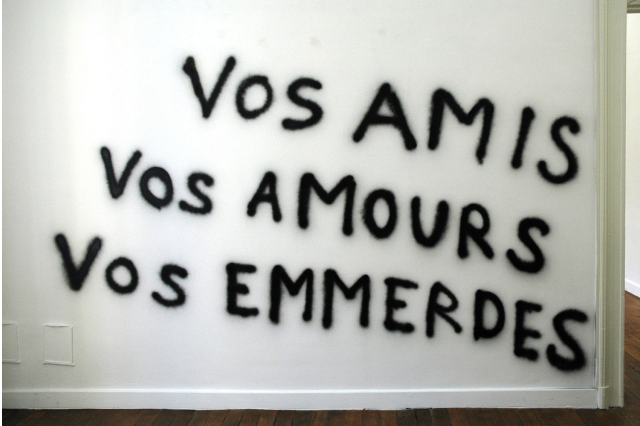
Hip, Hip, You're Raw Exhibition View Nosbaum Reding, Luxembourg, 2005