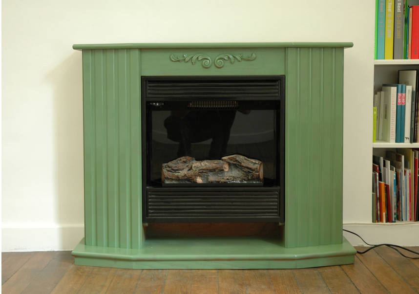
Hip, Hip, You're Raw Exhibition View Nosbaum Reding, Luxembourg, 2005