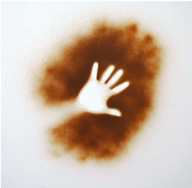
Hip, Hip, You're Raw Exhibition View Nosbaum Reding, Luxembourg, 2005