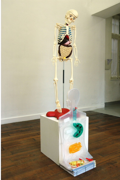
Hip, Hip, You're Raw Exhibition View Nosbaum Reding, Luxembourg, 2005