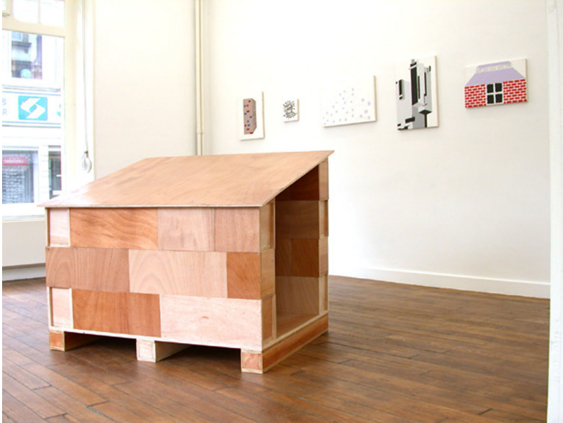
Wahrscheinlich / Vraisemblablement Exhibition View Nosbaum Reding, Luxembourg, 2001