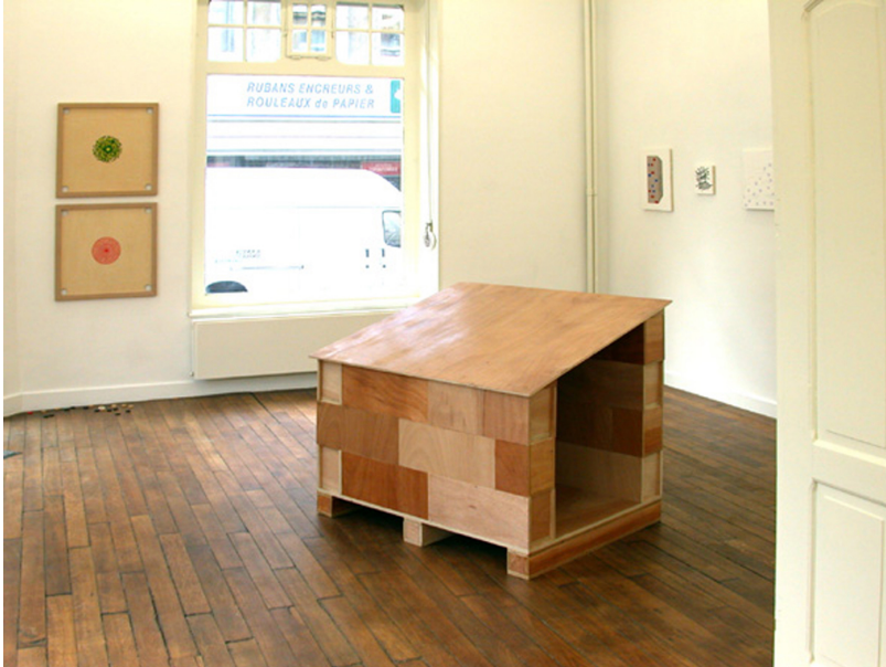
Wahrscheinlich / Vraisemblablement Exhibition View Nosbaum Reding, Luxembourg, 2001