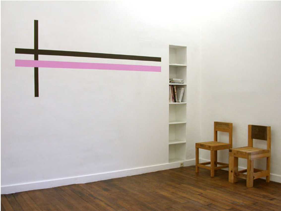
Wahrscheinlich / Vraisemblablement Exhibition View Nosbaum Reding, Luxembourg, 2001