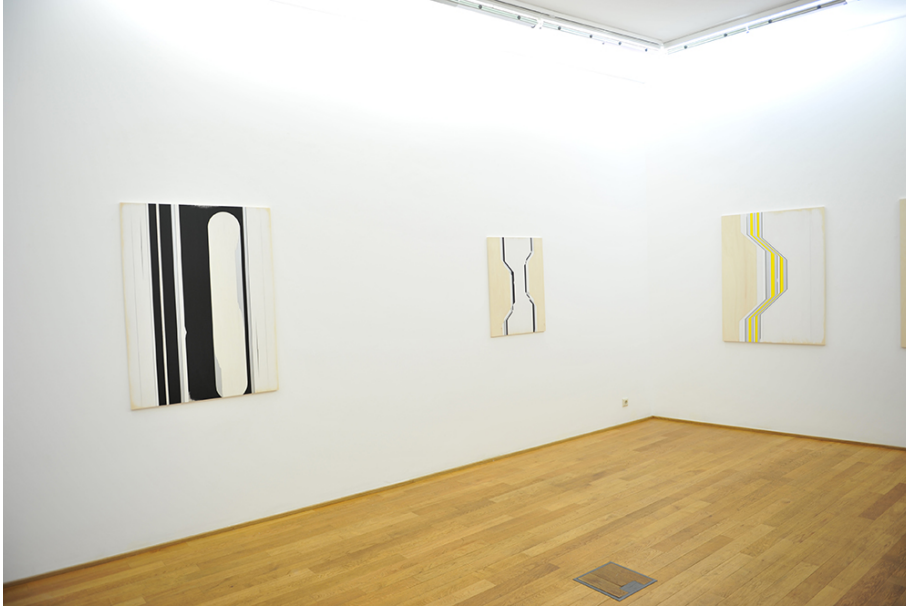
Exhibition View Nosbaum Reding, Luxembourg, 2015