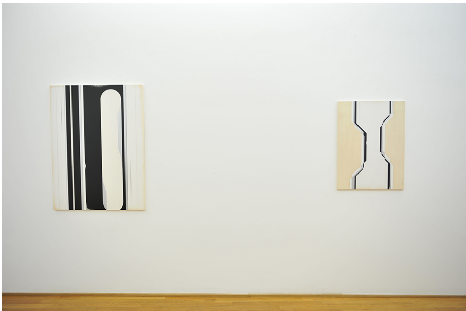
Exhibition View Nosbaum Reding, Luxembourg, 2015