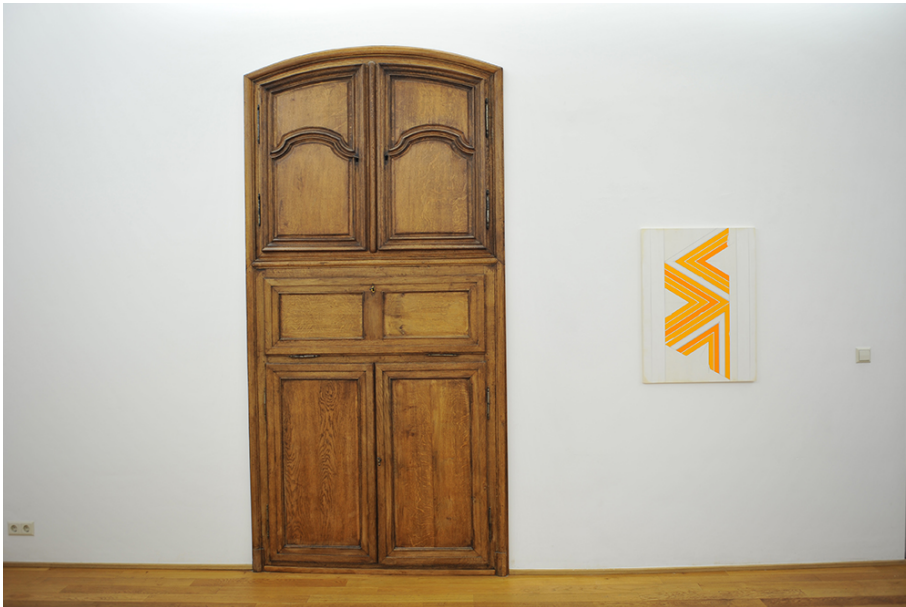
Exhibition View Nosbaum Reding, Luxembourg, 2015