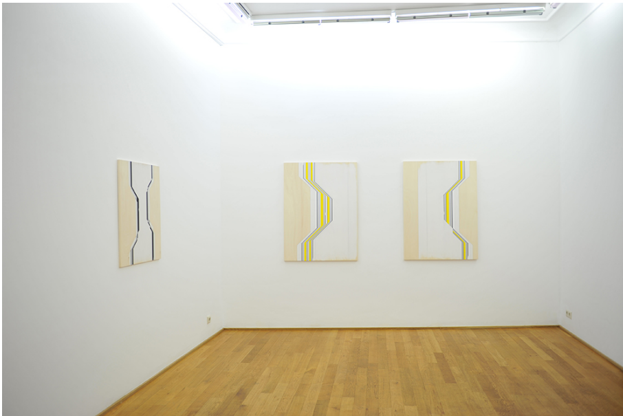
Exhibition View Nosbaum Reding, Luxembourg, 2015