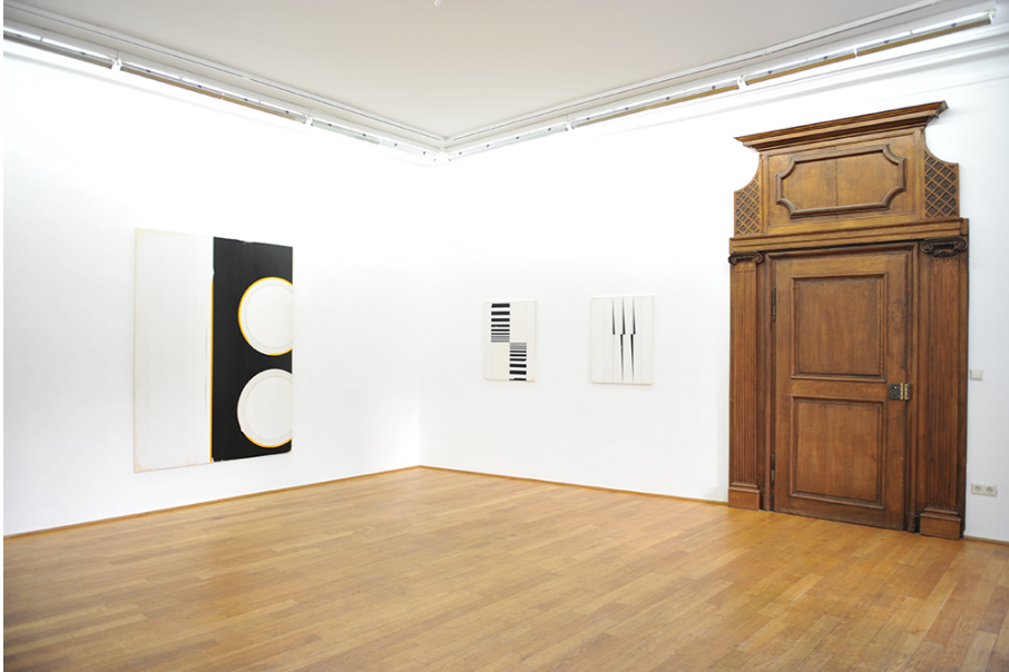
Exhibition View Nosbaum Reding, Luxembourg, 2015