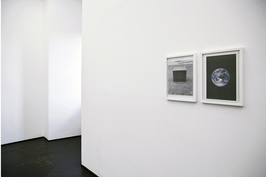
Steve Veloso Exhibition View Nosbaum Reding, Luxembourg, 2015