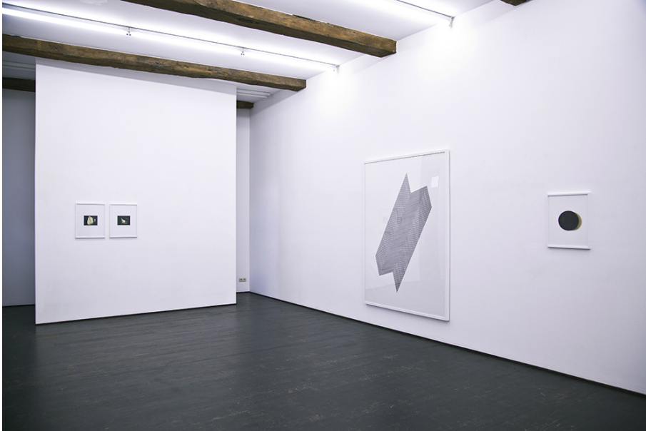
Steve Veloso Exhibition View Nosbaum Reding, Luxembourg, 2015