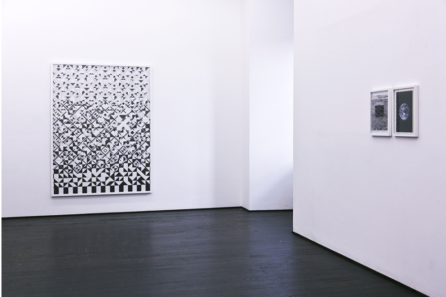
Steve Veloso Exhibition View Nosbaum Reding, Luxembourg, 2015