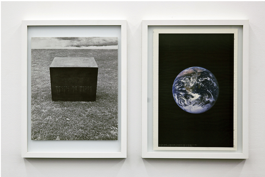
Steve Veloso Exhibition View Nosbaum Reding, Luxembourg, 2015