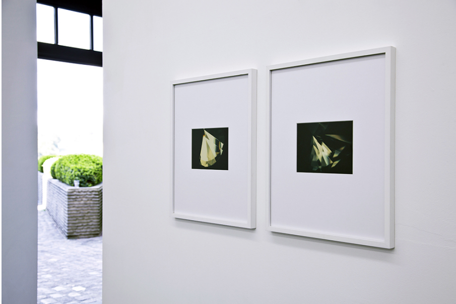
Steve Veloso Exhibition View Nosbaum Reding, Luxembourg, 2015