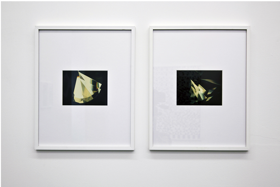
Steve Veloso Exhibition View Nosbaum Reding, Luxembourg, 2015