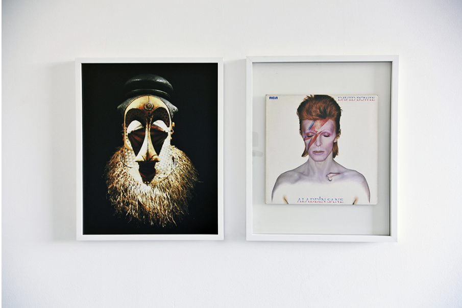
Steve Veloso Exhibition View Nosbaum Reding, Luxembourg, 2015