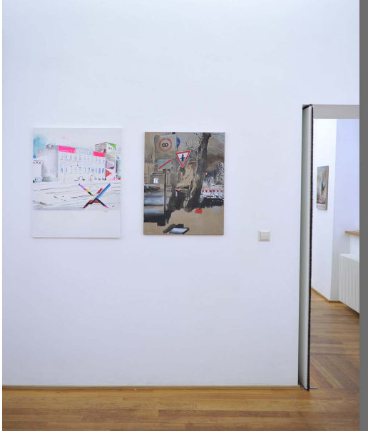
BARELY INAPPROPRIATE IMAGERY Exhibition View Nosbaum Reding, Luxembourg, 2015