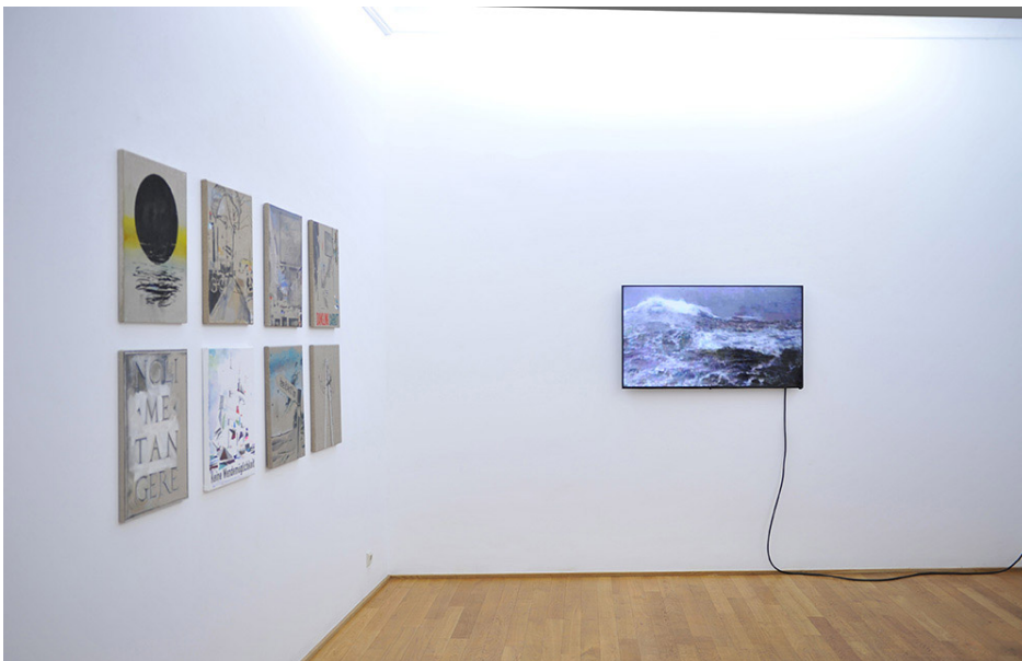
BARELY INAPPROPRIATE IMAGERY Exhibition View Nosbaum Reding, Luxembourg, 2015