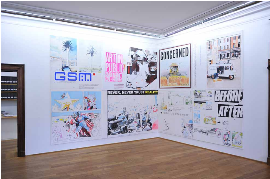
BARELY INAPPROPRIATE IMAGERY Exhibition View Nosbaum Reding, Luxembourg, 2015