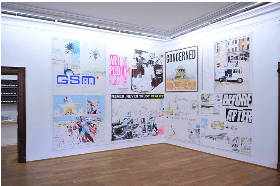
BARELY INAPPROPRIATE IMAGERY Exhibition View Nosbaum Reding, Luxembourg, 2015