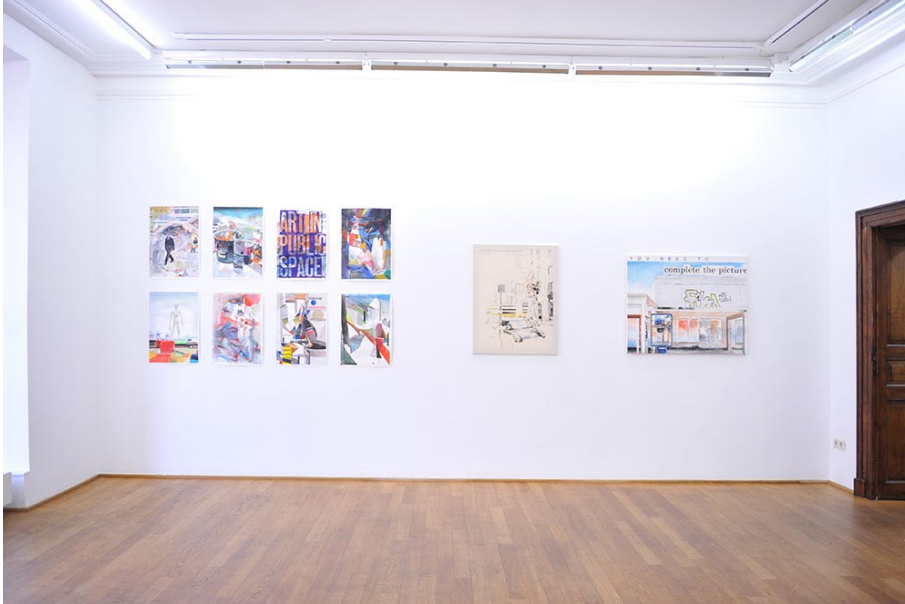
BARELY INAPPROPRIATE IMAGERY Exhibition View Nosbaum Reding, Luxembourg, 2015