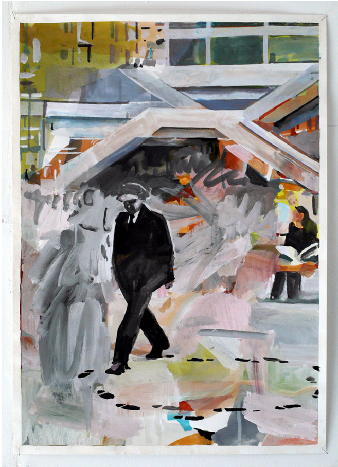
BARELY INAPPROPRIATE IMAGERY Exhibition View Nosbaum Reding, Luxembourg, 2015