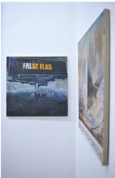
BARELY INAPPROPRIATE IMAGERY Exhibition View Nosbaum Reding, Luxembourg, 2015