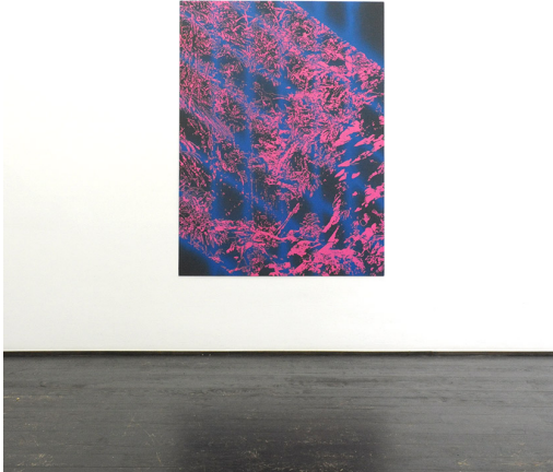
A Spotlight at Night Exhibition View Nosbaum Reding, Luxembourg, 2016