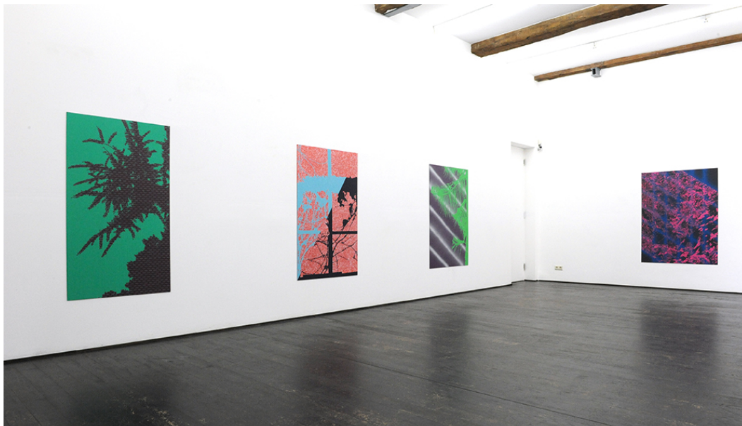
A Spotlight at Night Exhibition View Nosbaum Reding, Luxembourg, 2016