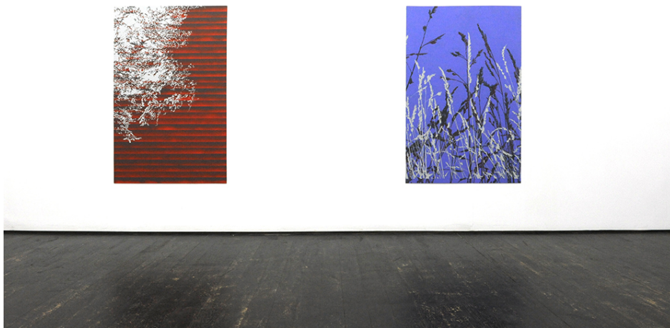
A Spotlight at Night Exhibition View Nosbaum Reding, Luxembourg, 2016