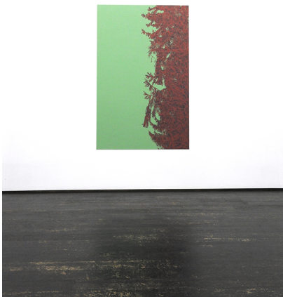
A Spotlight at Night Exhibition View Nosbaum Reding, Luxembourg, 2016