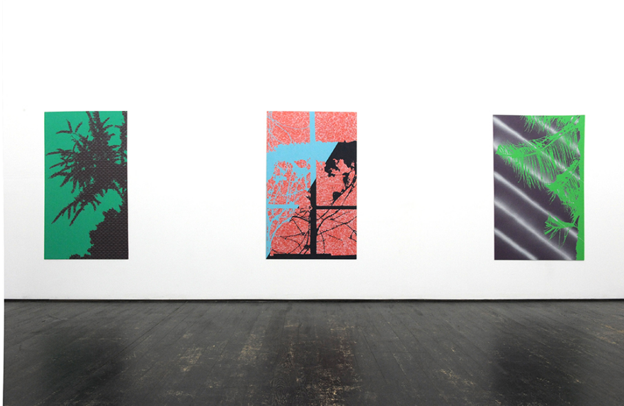
A Spotlight at Night Exhibition View Nosbaum Reding, Luxembourg, 2016