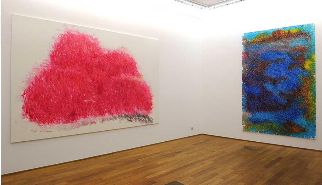
Exhibition View Nosbaum Reding, Luxembourg, 2016