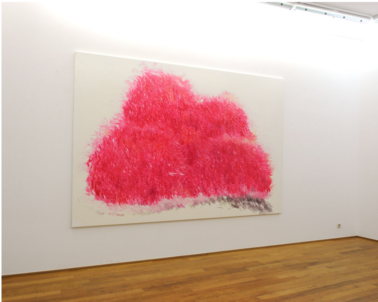
Exhibition View Nosbaum Reding, Luxembourg, 2016