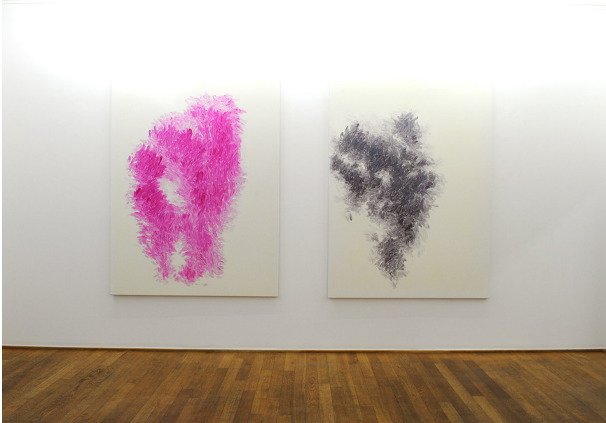
Exhibition View Nosbaum Reding, Luxembourg, 2016