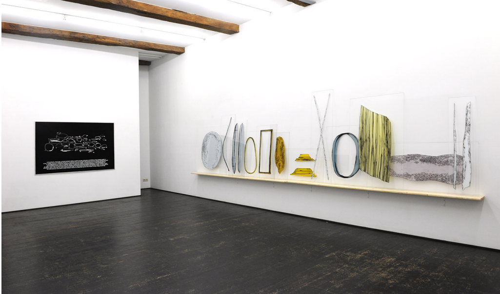
L'état des choses Exhibition View Nosbaum Reding, Luxembourg, 2016