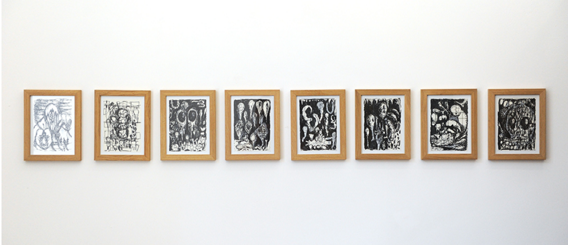
Hello! Belle Peinture: Thinking of the Beginning of the End of the Death of Painting Exhibition View Nosbaum Reding, Luxembourg, 2017