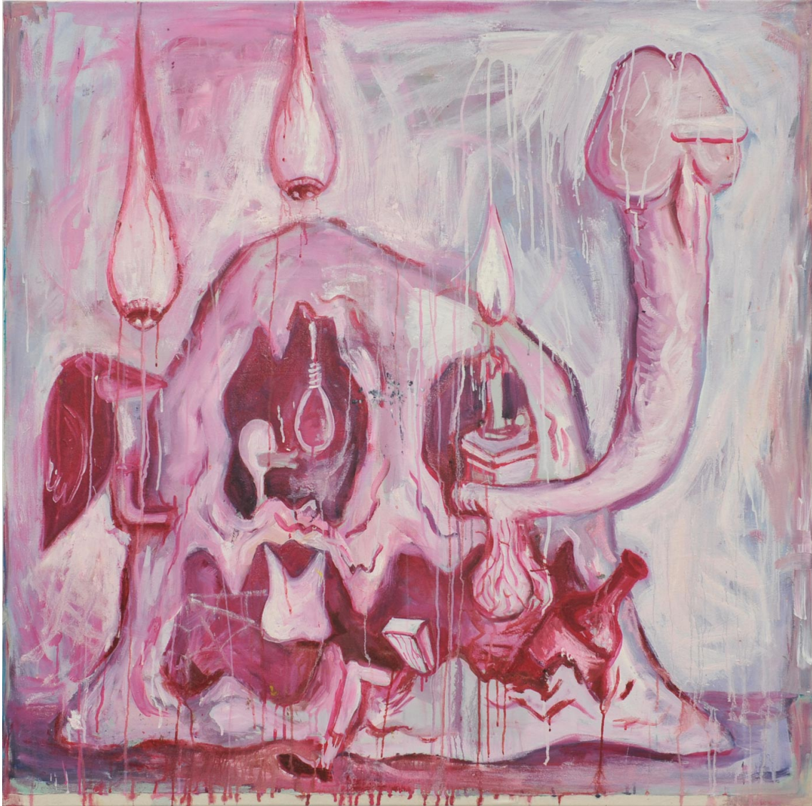
Untitled , 2004 oil on canvas 125 x 125 cm