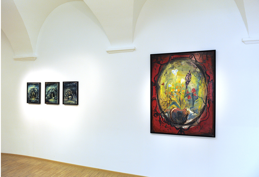
Hello! Belle Peinture: Thinking of the Beginning of the End of the Death of Painting Exhibition View Nosbaum Reding, Luxembourg, 2017