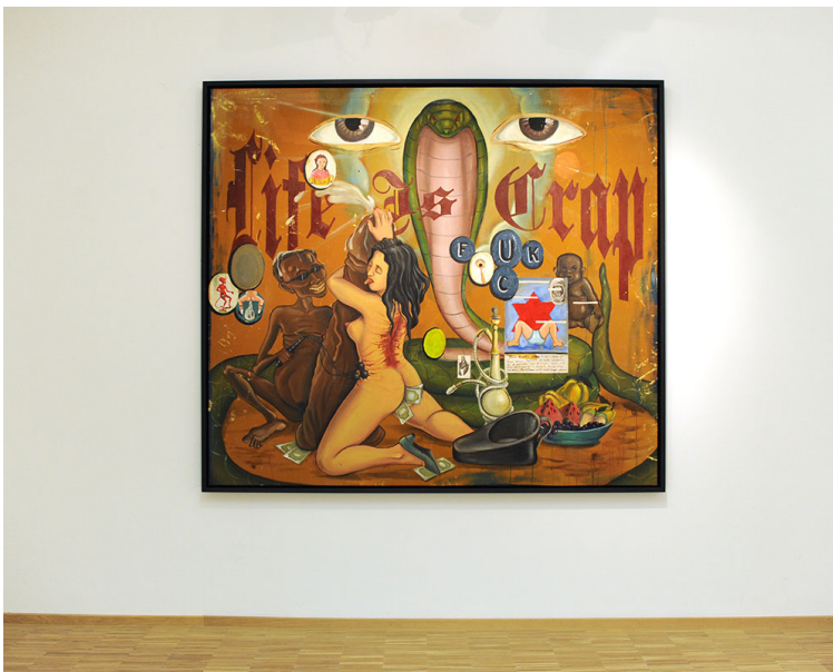
Hello! Belle Peinture: Thinking of the Beginning of the End of the Death of Painting Exhibition View Nosbaum Reding, Luxembourg, 2017