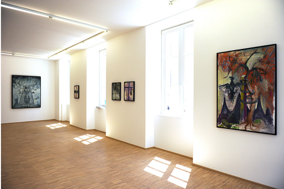
Hello! Belle Peinture: Thinking of the Beginning of the End of the Death of Painting Exhibition View Nosbaum Reding, Luxembourg, 2017