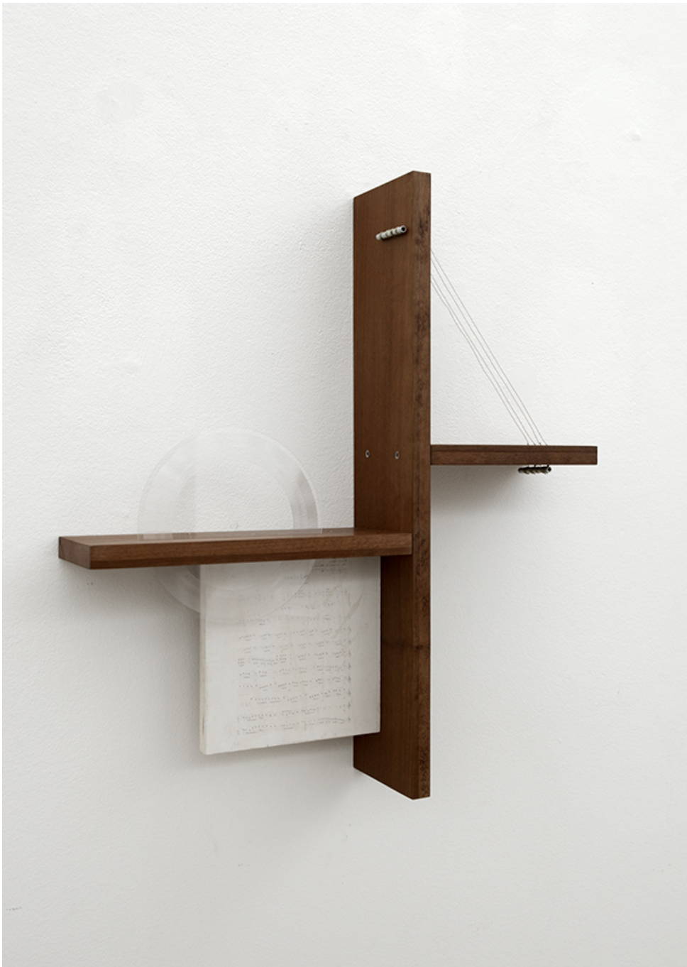
Quatuor , 2018 Vinyl, plywood, brass wire, sapelli 58 x 51 x 12 cm