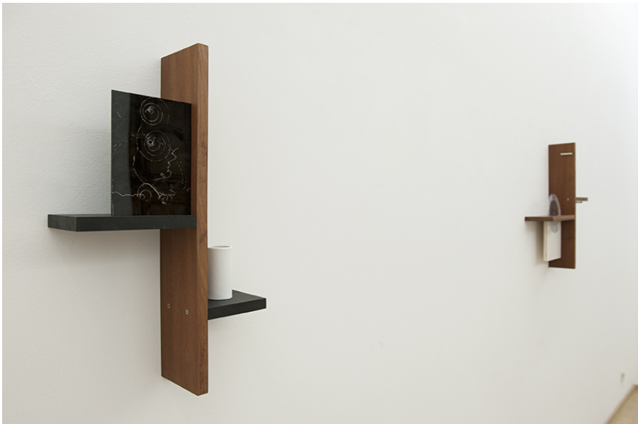
Exhibition View Nosbaum Reding, Luxembourg, 2018