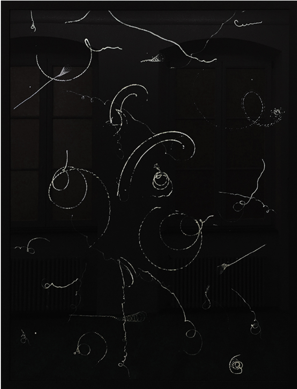
Toupie , 2018 Soot set under glass 117 x 90 cm