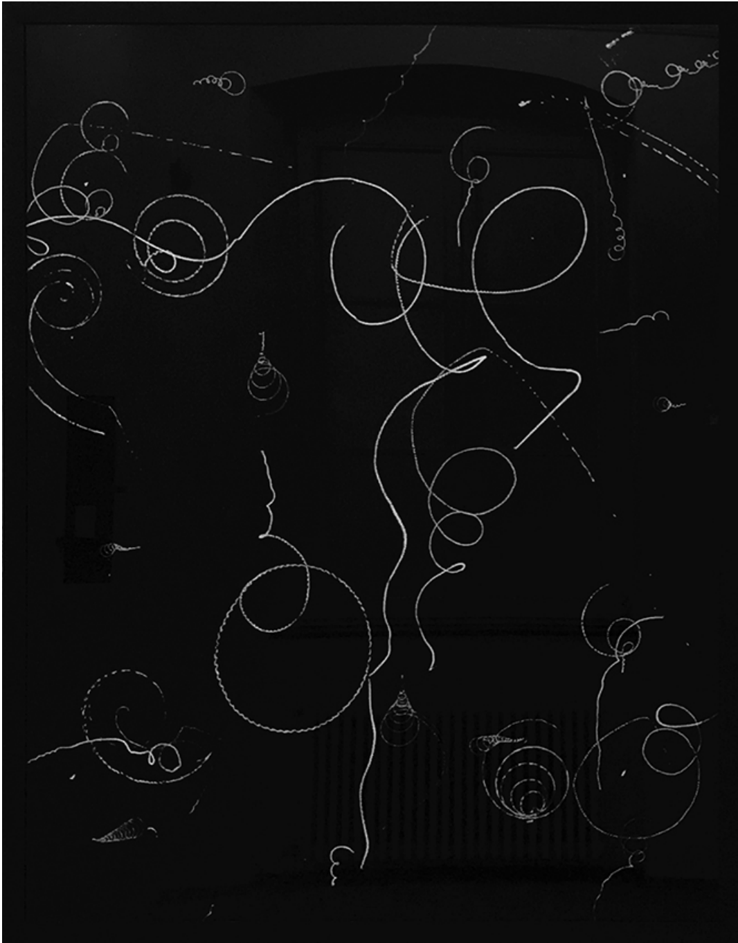
Toupie , 2018 Soot set under glass 117 x 90 cm