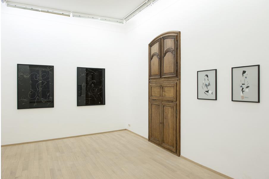
Exhibition View Nosbaum Reding, Luxembourg, 2018