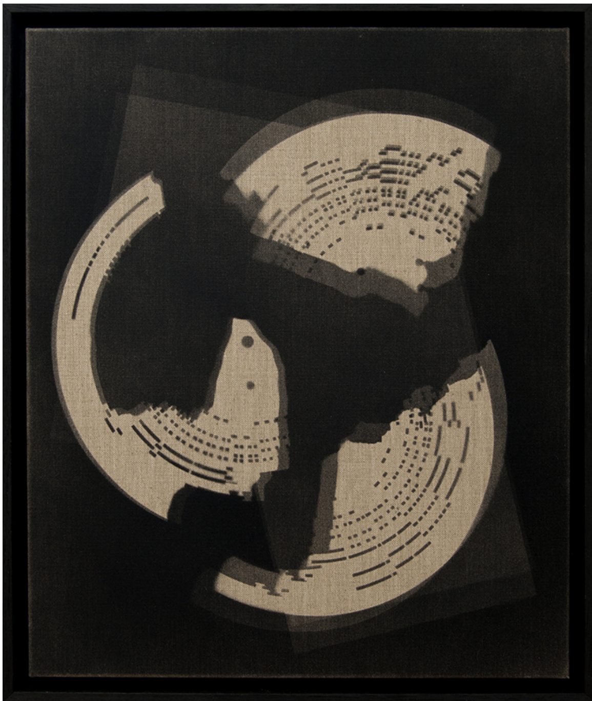
Perforation , 2018 Spray on canvas 55 x 46 cm