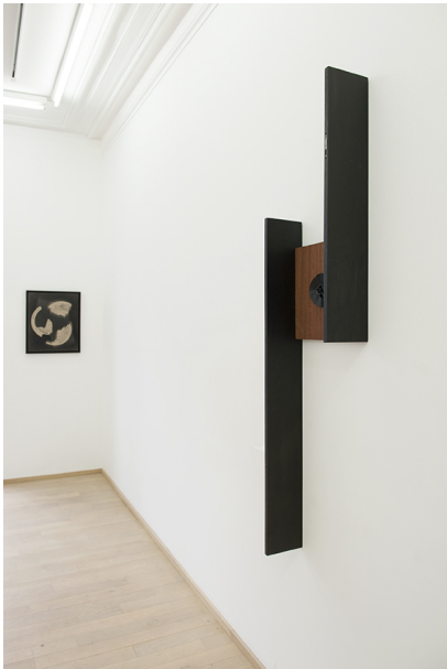
Exhibition View Nosbaum Reding, Luxembourg, 2018