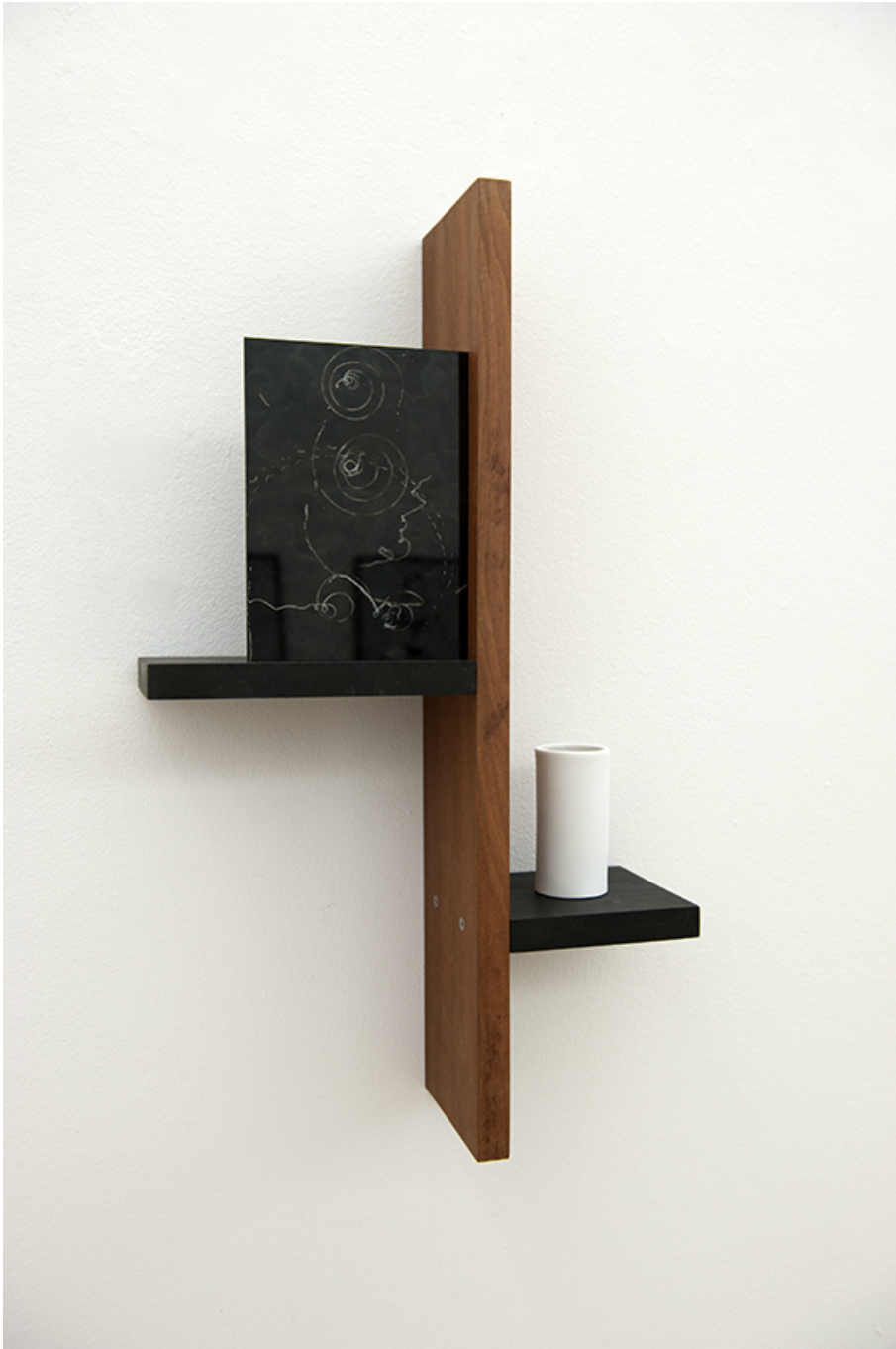
Enregistrement , 2018 Soot set under glass, sapelli, oak, porcelain 55 x 33 x 12 cm