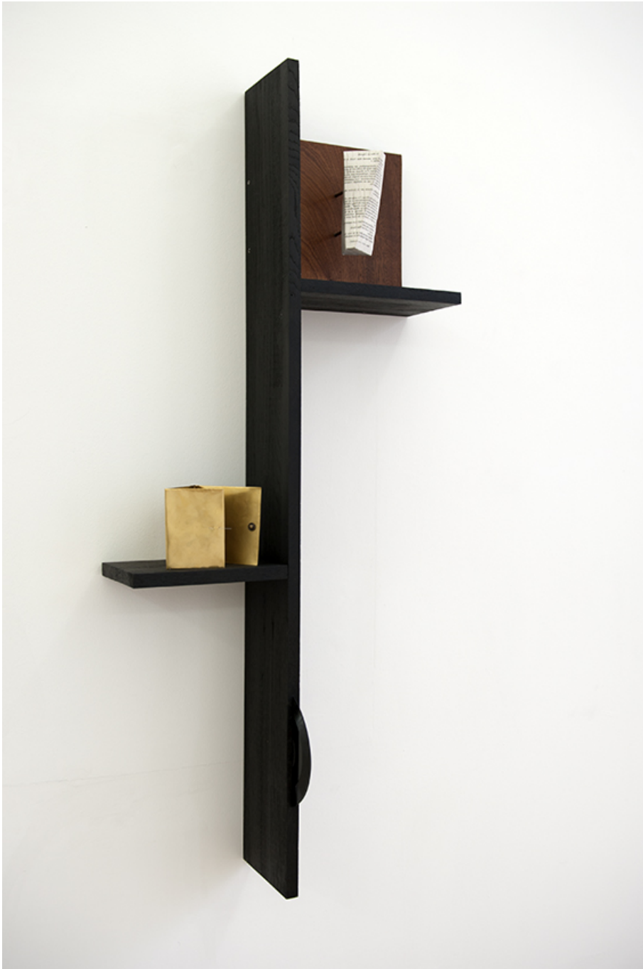
Le plan de l'Aiguille , 2018 Copper, vinyl, sapelli, oak, resin 120 x 52 x 20 cm