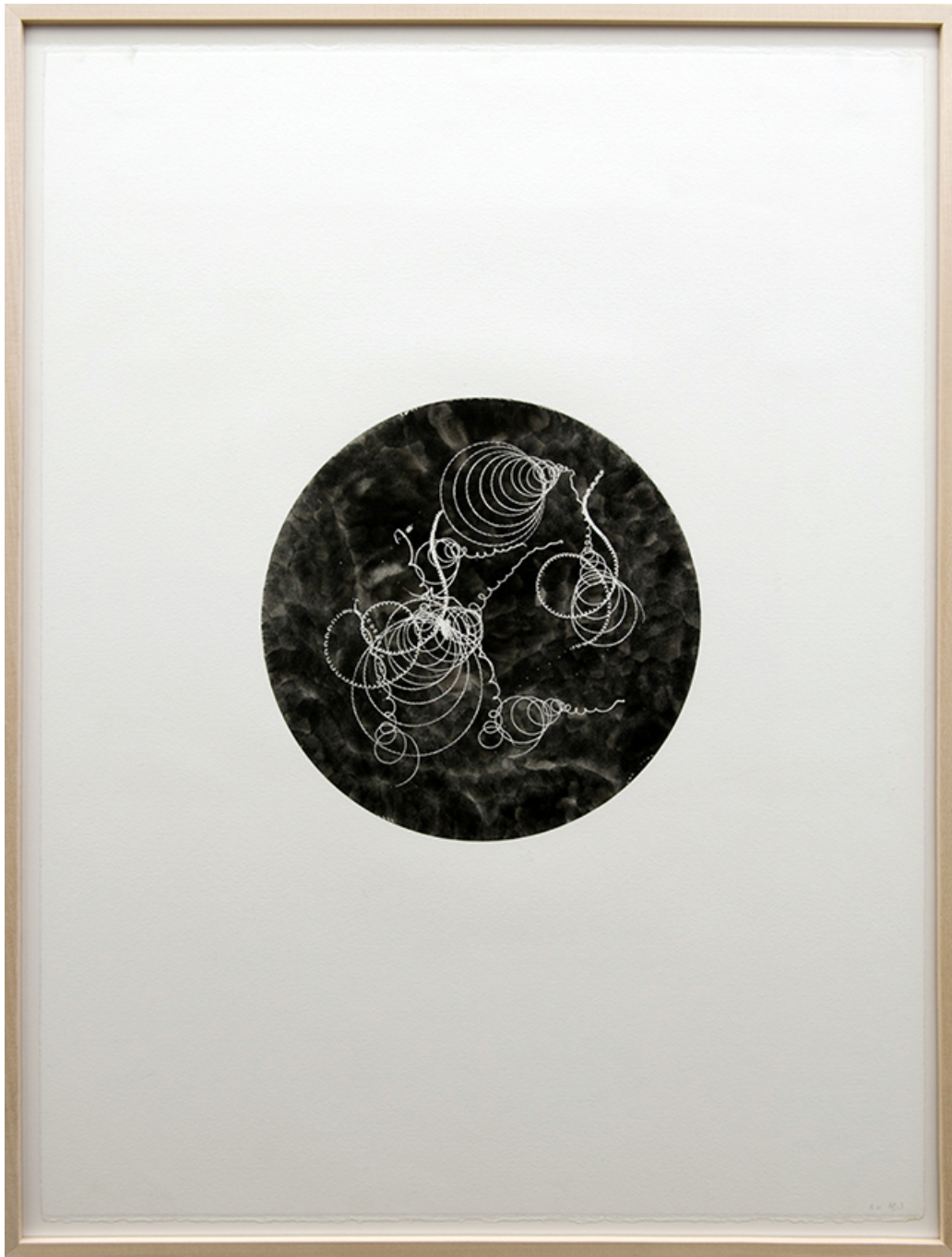
Toupie , 2013 Monotype Carbon black on paper 66 x 50 cm