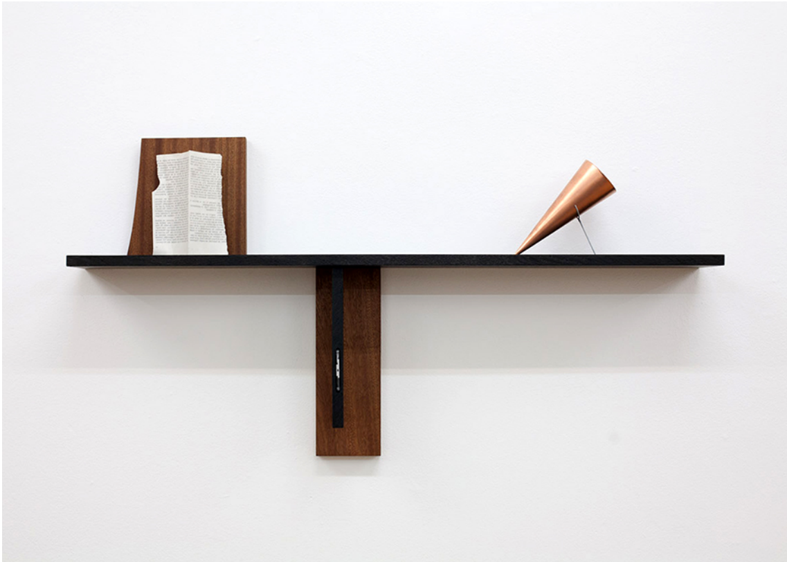
L'invention de Morel , 2016 Oak, sapelli, minidisc, acrylic resin, copper, metal 59 x 120 x 20 cm