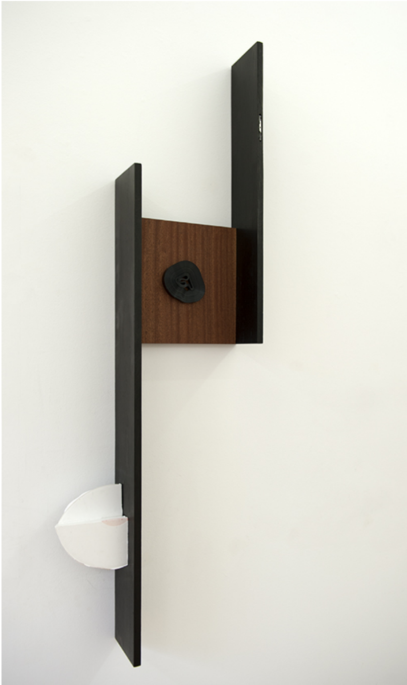
Journal , 2017 VHS tape, sapelli, minidisc, oak, resin 158 x 54 x 15 cm