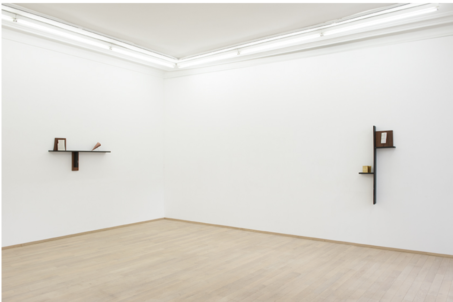
Exhibition View Nosbaum Reding, Luxembourg, 2018