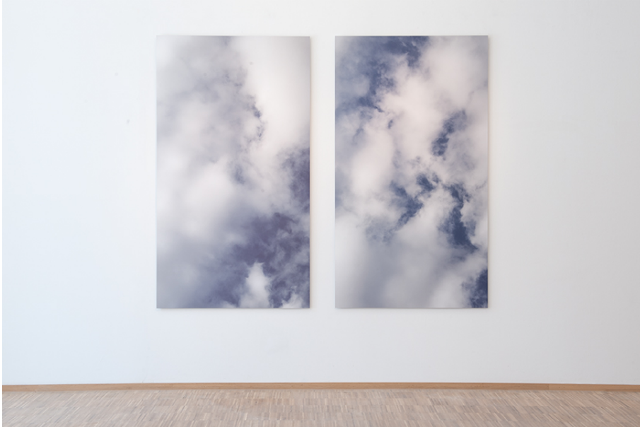
Walking and Pausing... Exhibition View Nosbaum Reding, Luxembourg, 2018