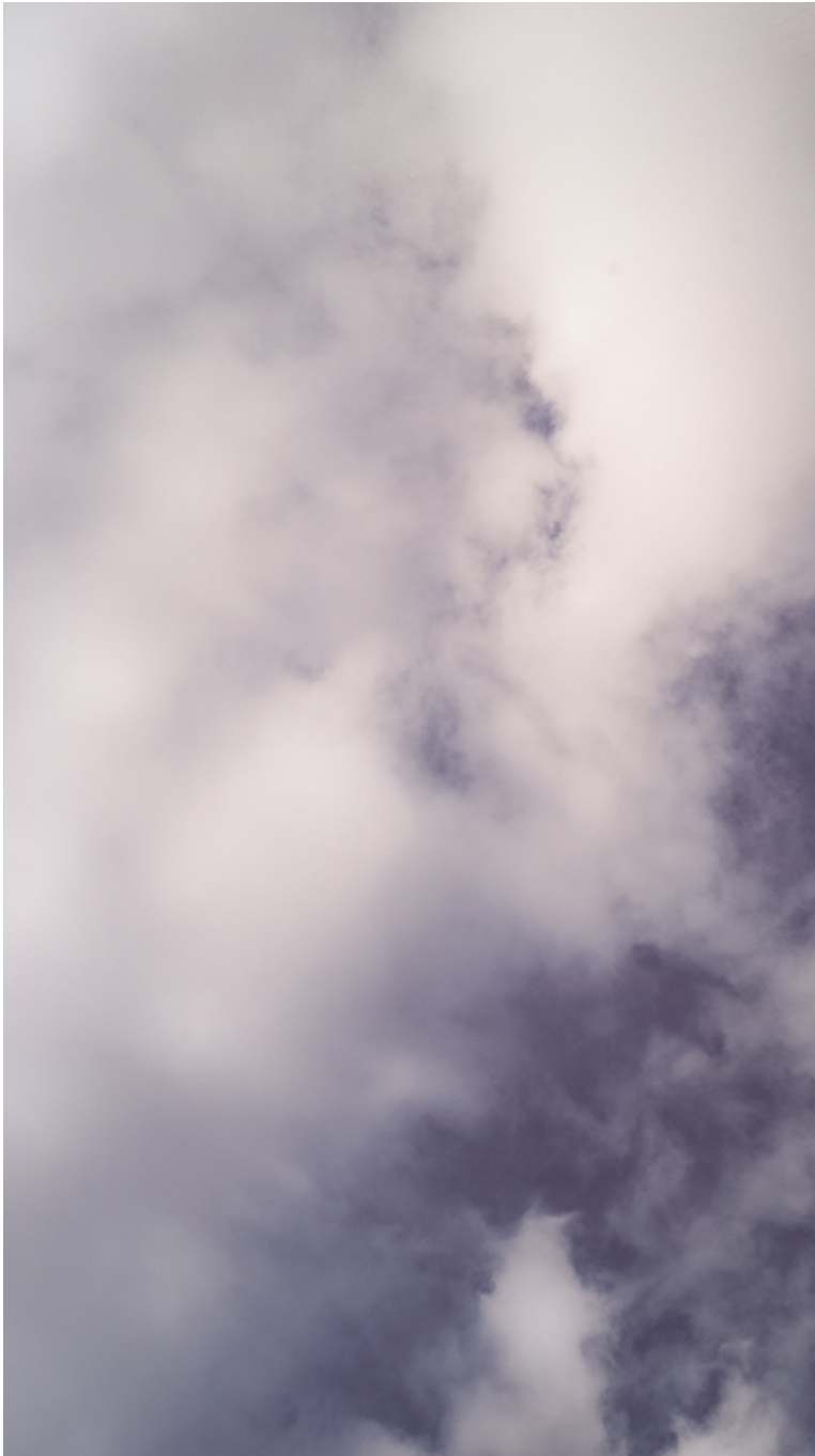
Sky #1 , 2018 Inkjet on fine arts paper Image: 160 x 90 cm Edition of 5 ex