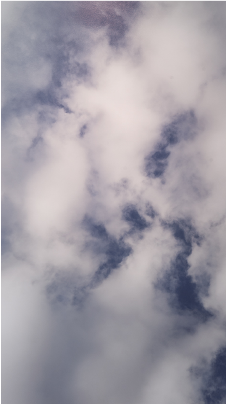
Sky #2 , 2018 Inkjet on fine arts paper Image: 160 x 90 cm Edition of 5 ex