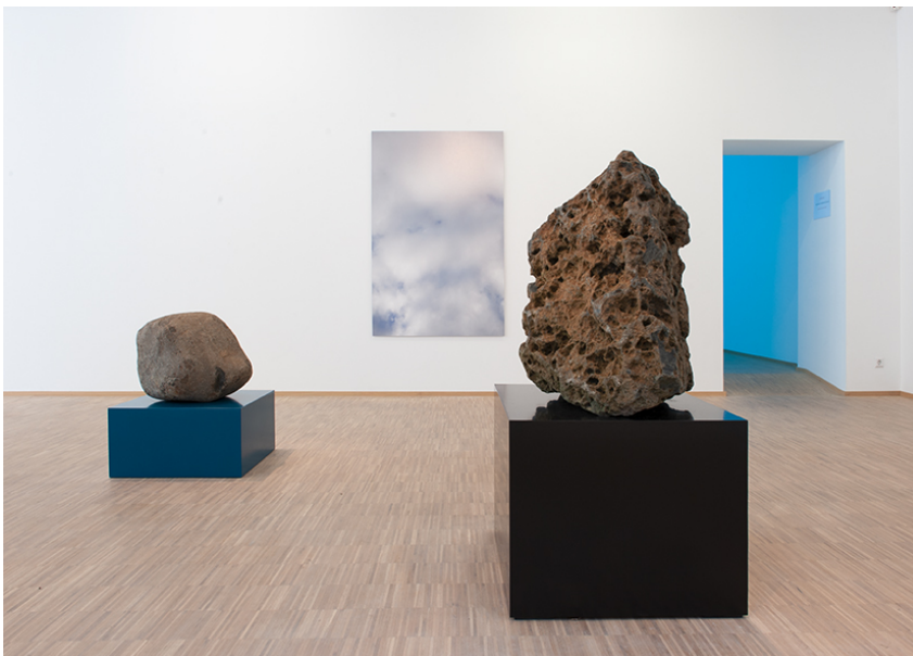
Walking and Pausing... Exhibition View Nosbaum Reding, Luxembourg, 2018