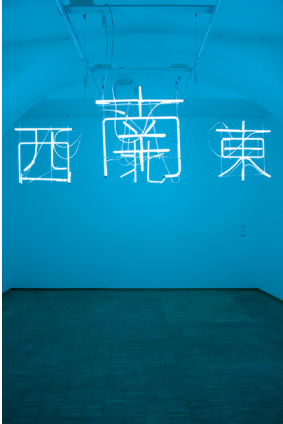
Walking and Pausing... Exhibition View Nosbaum Reding, Luxembourg, 2018