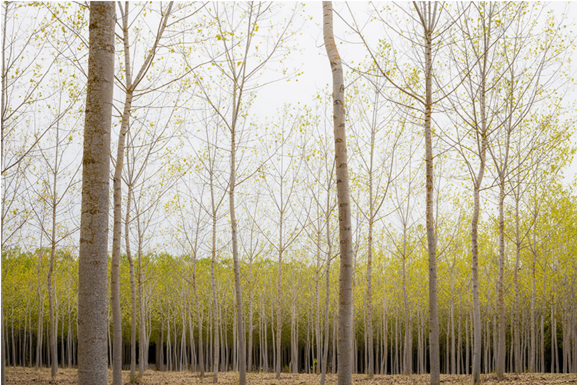
Golden Trees (Reminiscences) , 2018 Colour photograph on dibond, face mounted on acrylic Image: 113 x 170 cm Frame: 117 x 174 cm Edition of 5 ex