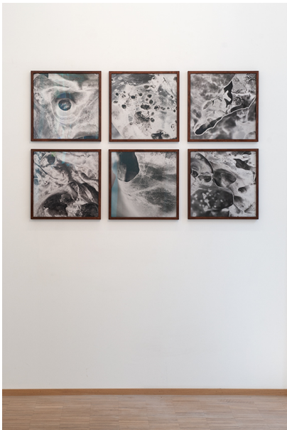
Walking and Pausing... Exhibition View Nosbaum Reding, Luxembourg, 2018