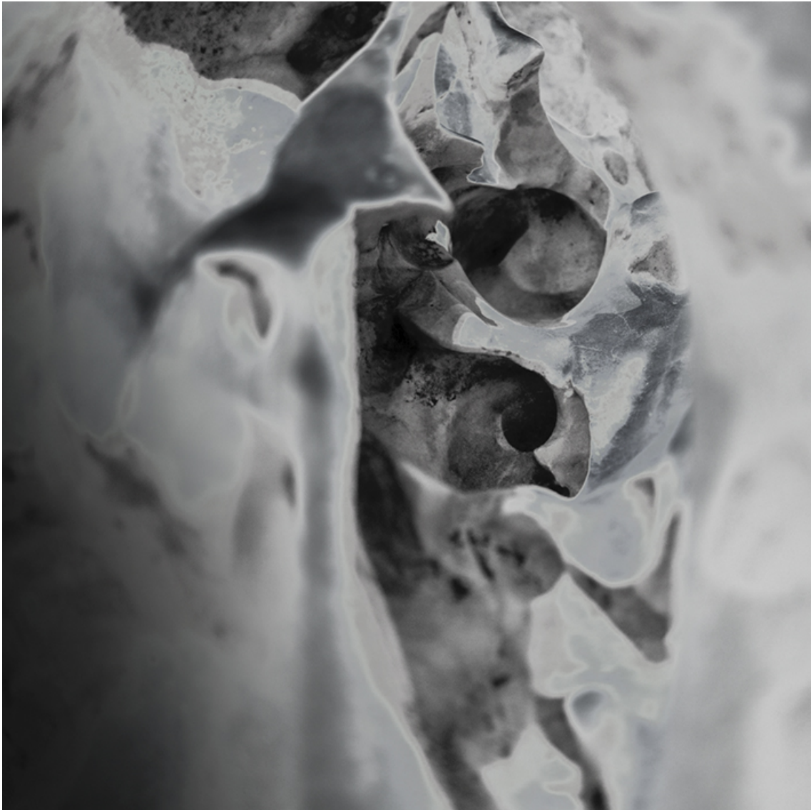
Stonescape #6 , 2017 ink jet on fine arts paper Frame: 40 x 40 cm Edition of 5 ex