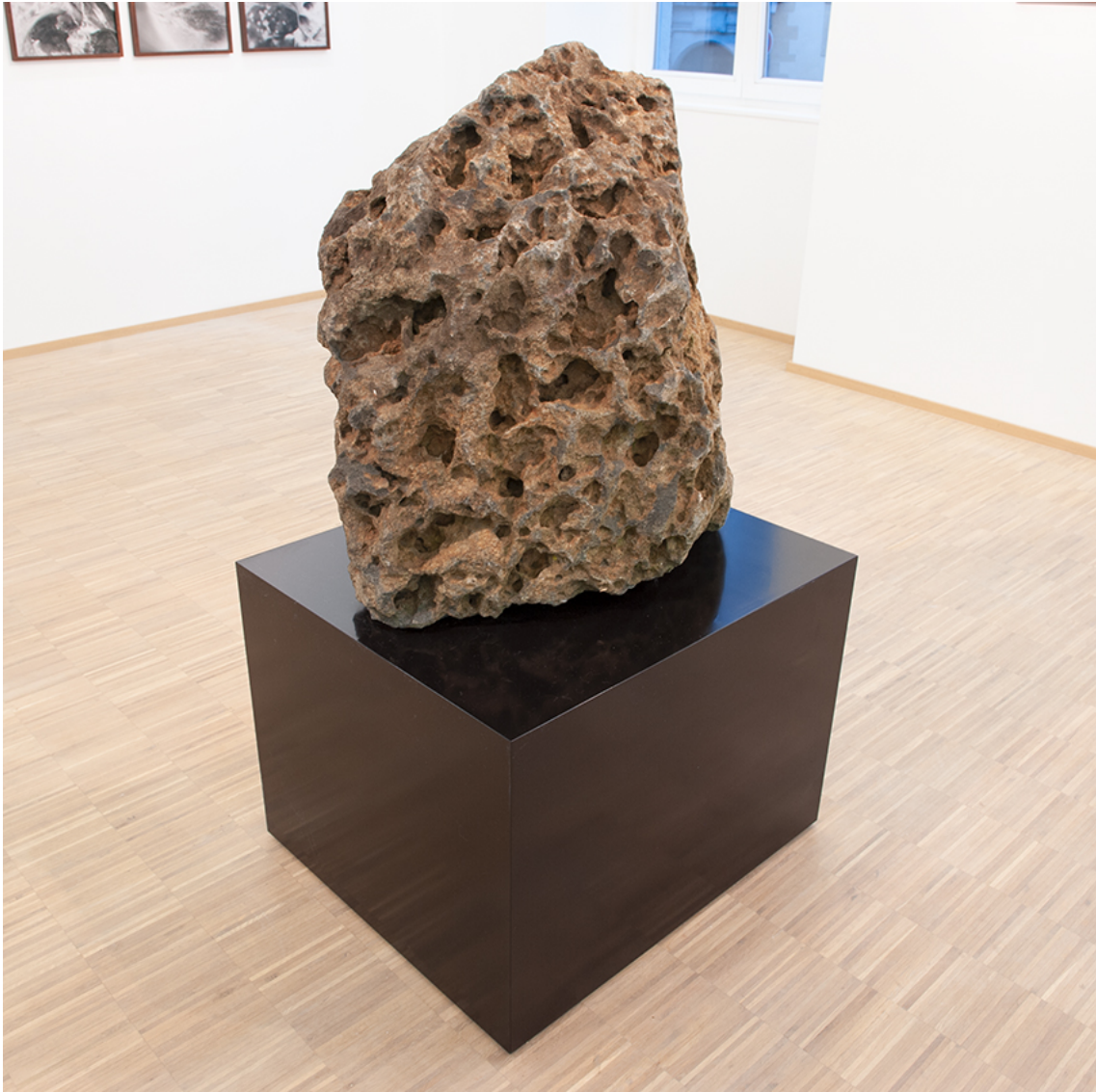
Stone II #2 , 2018 de la série Stone Collection Found stone on black wooden base Stone (80 x 53 x 77 cm), base (50 x 60 x 70 cm)