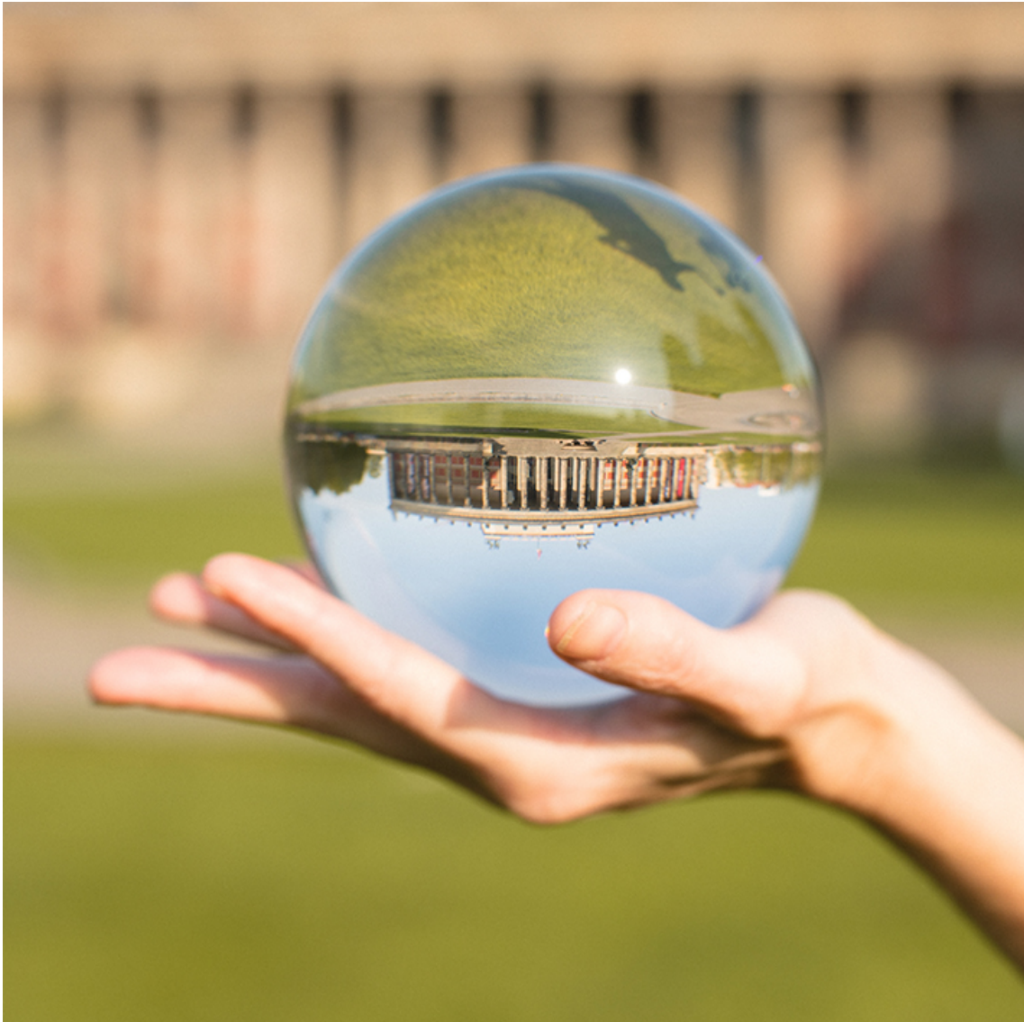
Gewisse Rahmenbedingungen 3 (Altes Museum, Berlin), 2017 Colour photograph on dibond, face mounted on acrylic Image: 75 x 75 cm Edition of 5 ex