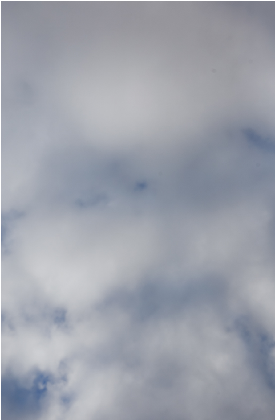
Sky #3 , 2018 Inkjet on fine arts paper Image: 160 x 106 cm Edition of 5 ex