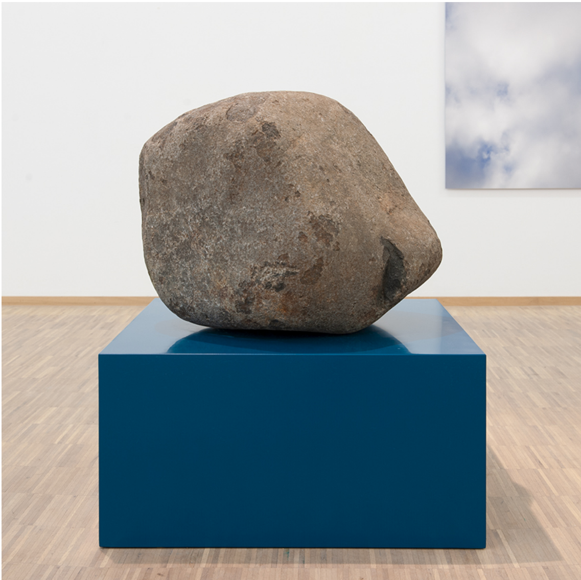
Stone II #3 , 2018 de la série Stone Collection Found stone on blue wooden base Stone (42 x 50 x 48 cm), base (31 x 59,6 x 59,6 cm)