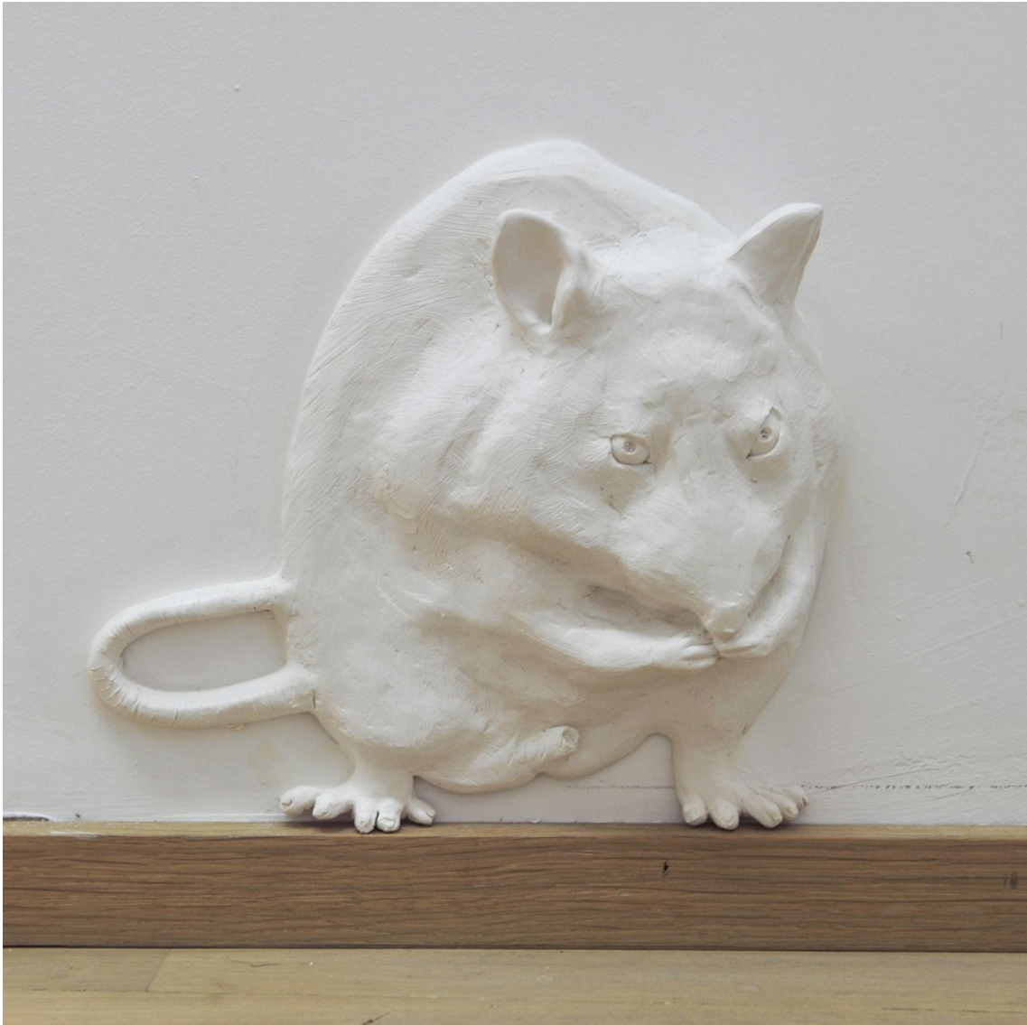
We will make you lose what you are struggling to hold on to, V , 2018 Jesmonite, pigment, fiberglass, natural wax 24 x 25 x 6 cm Edition of 2 ex