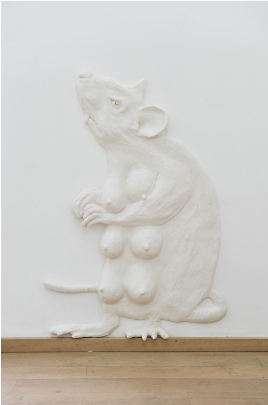
We will make you lose what you are struggling to hold on to, I , 2018 Jesmonite, pigment, fiberglass, natural wax 81 x 58 x 9 cm Edition of 2 ex