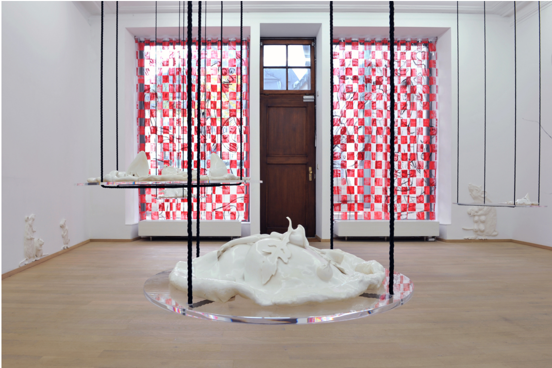
A Cannibal's Banquet within the Fortress of Exclusion , 2018 (Pizzas) Faïence émaillée, plexiglas, corde (Four) Jesmonite, métal (Rideaux) Feuille de PVC, peinture acrylique (Peinture murale) peinture acrylique Dimensions variable