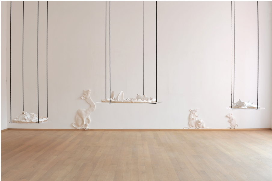
People With Vaginas Exhibition View Nosbaum Reding, Luxembourg, 2018