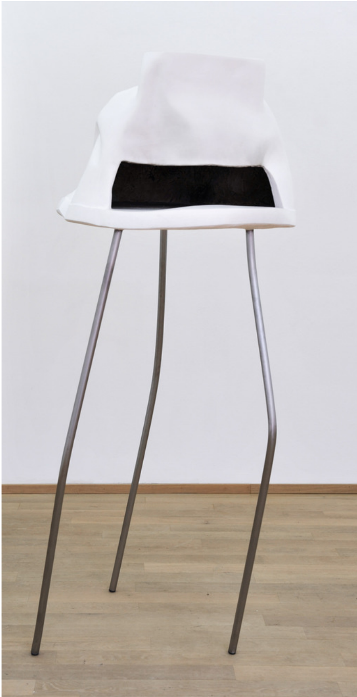
A Cannibal's Banquet within the Fortress of Exclusion (Oven) , 2018 Jesmonite, metal 165 x 65 cm