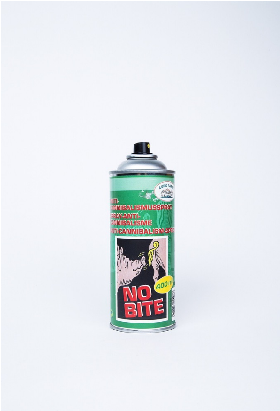
Anti-Cannibalism Spray , 2018 Archival ink jet print Image: 117,5 x 81 cm Edition of 1 ex + 1 EA