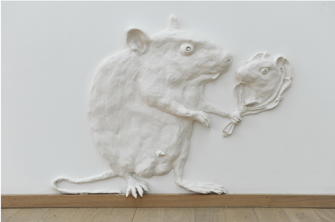
We will make you lose what you are struggling to hold on to, III , 2018 Jesmonite, pigment, fiberglass, natural wax 53 x 75 x 9 cm Edition of 2 ex