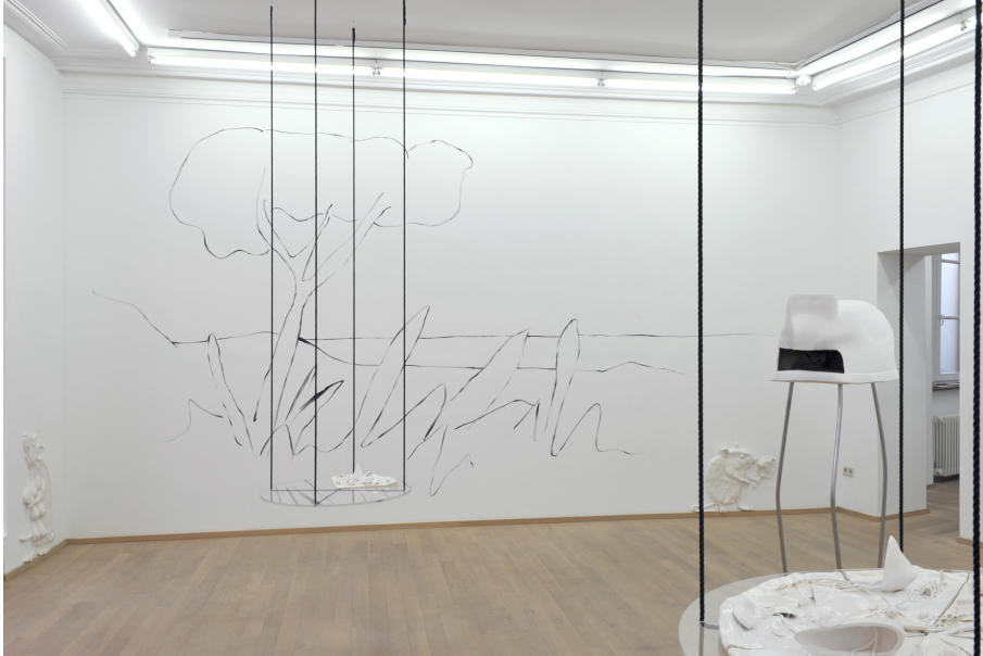
People With Vaginas Exhibition View Nosbaum Reding, Luxembourg, 2018