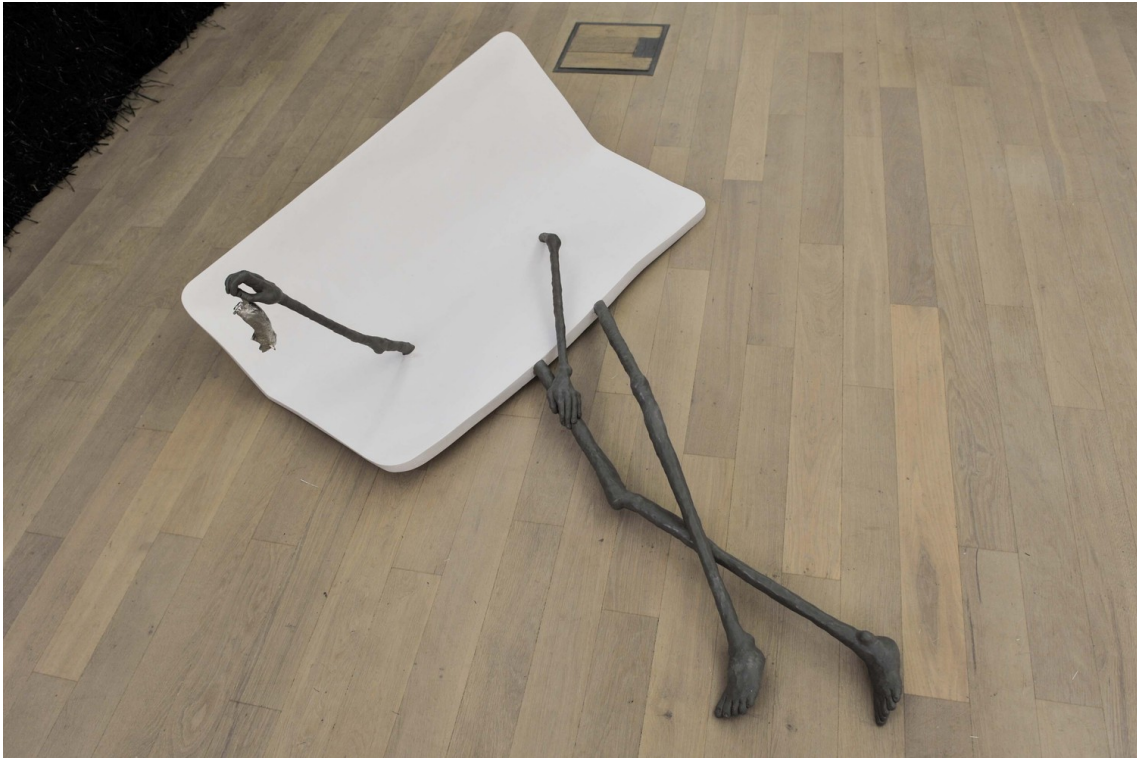
T. , 2018 Cardboard, jesmonite, pigment, fiberglass, epoxy 150 x 100 x 40 cm