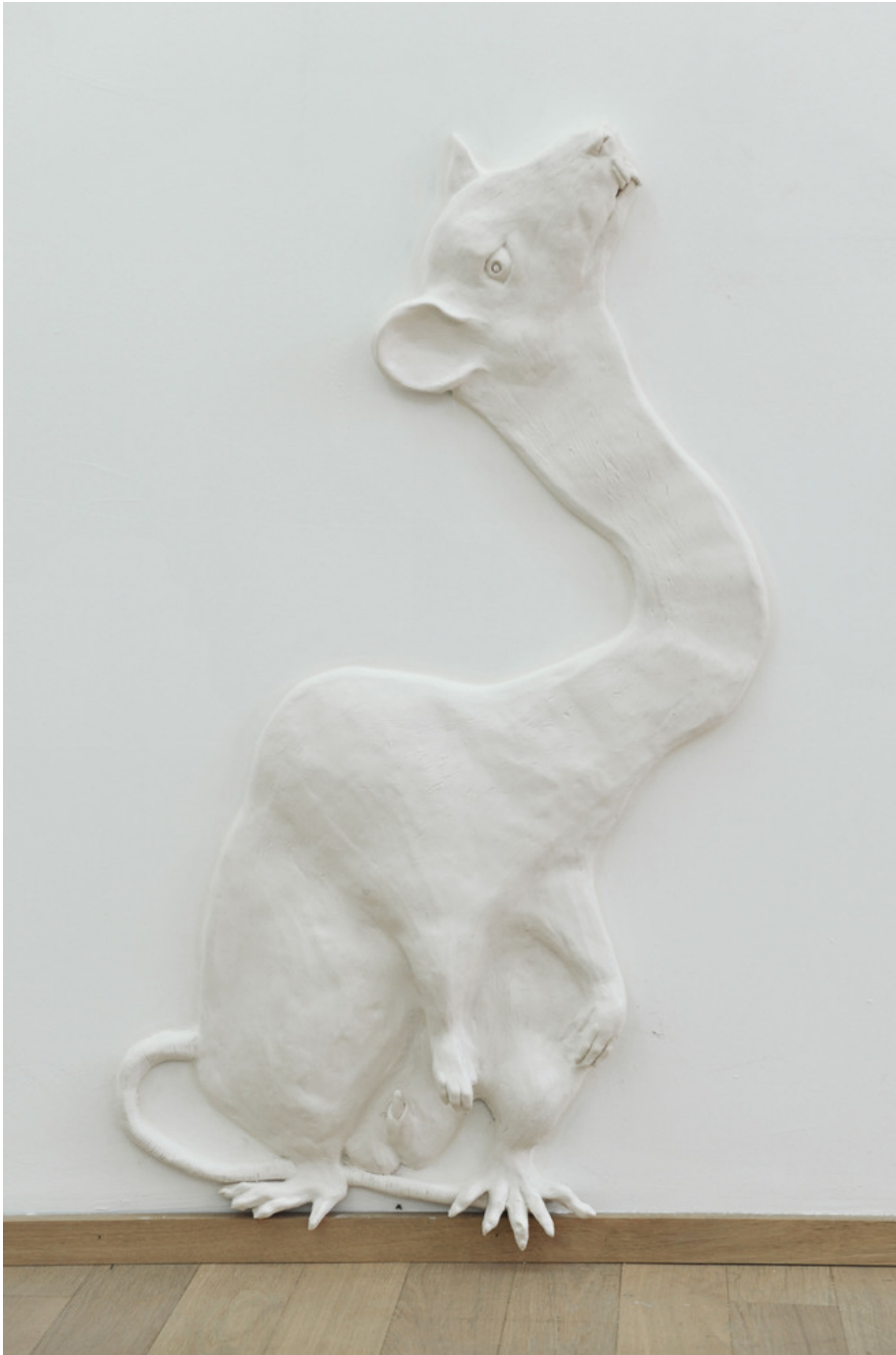
We will make you lose what you are struggling to hold on to, II , 2018 Jesmonite, pigment, fiberglass, natural wax 94 x 48 x 8 cm Edition of 2 ex