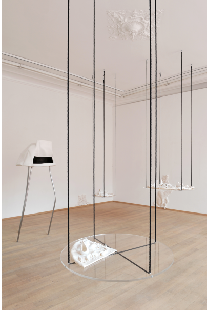
People With Vaginas Exhibition View Nosbaum Reding, Luxembourg, 2018