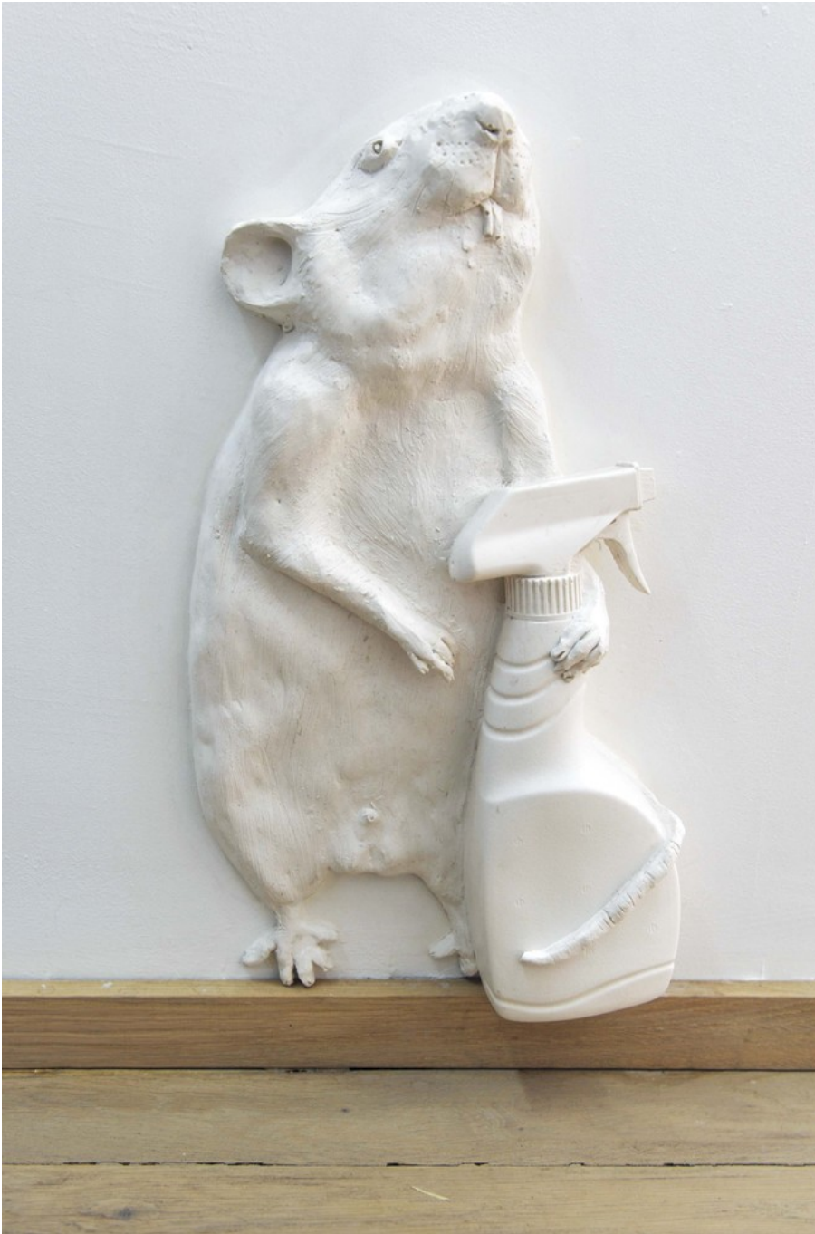
We will make you lose what you are struggling to hold on to, VIII , 2018 Jesmonite, pigment, fiberglass, natural wax 38 x 22 x 11 cm Edition of 2 ex