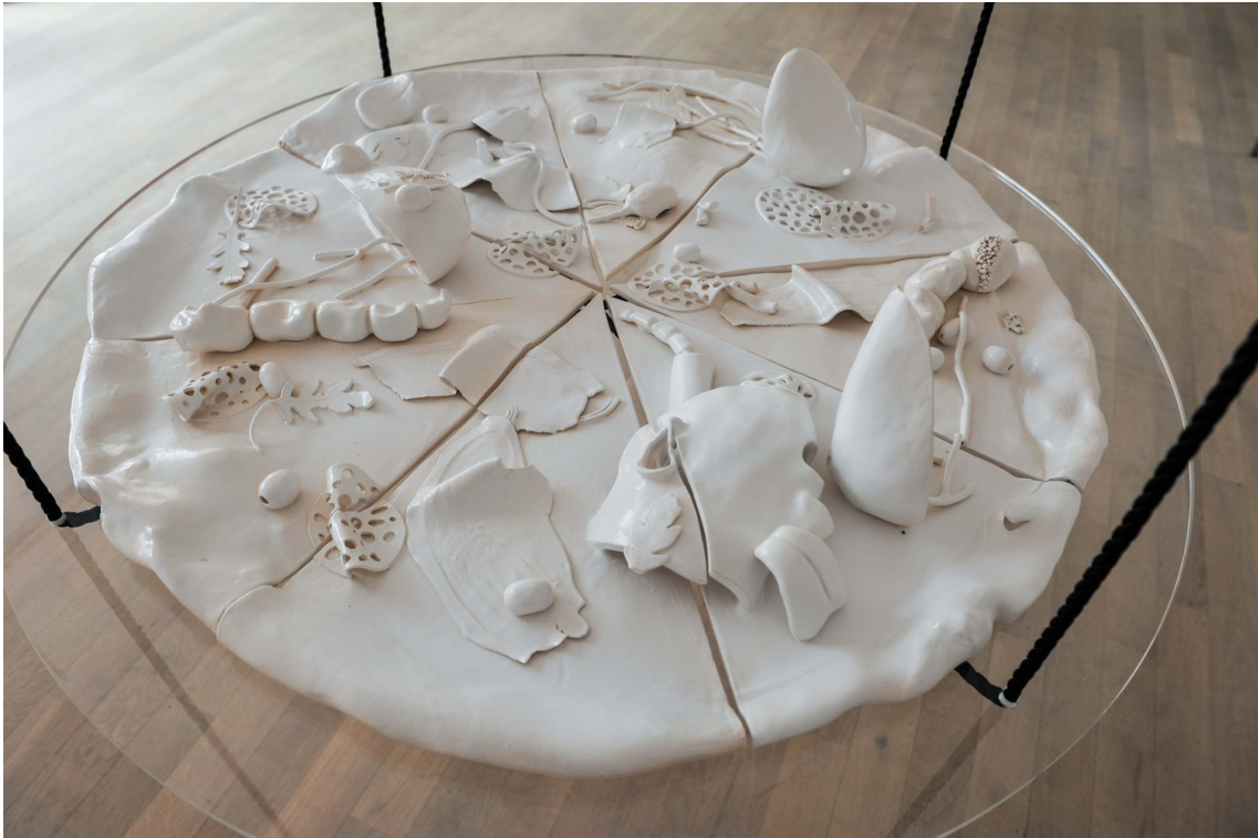
A Cannibal's Banquet within the Fortress of Exclusion (Pizza II) , 2018 Glazed earthenware, plexiglass, rope diamètre : 105 cm