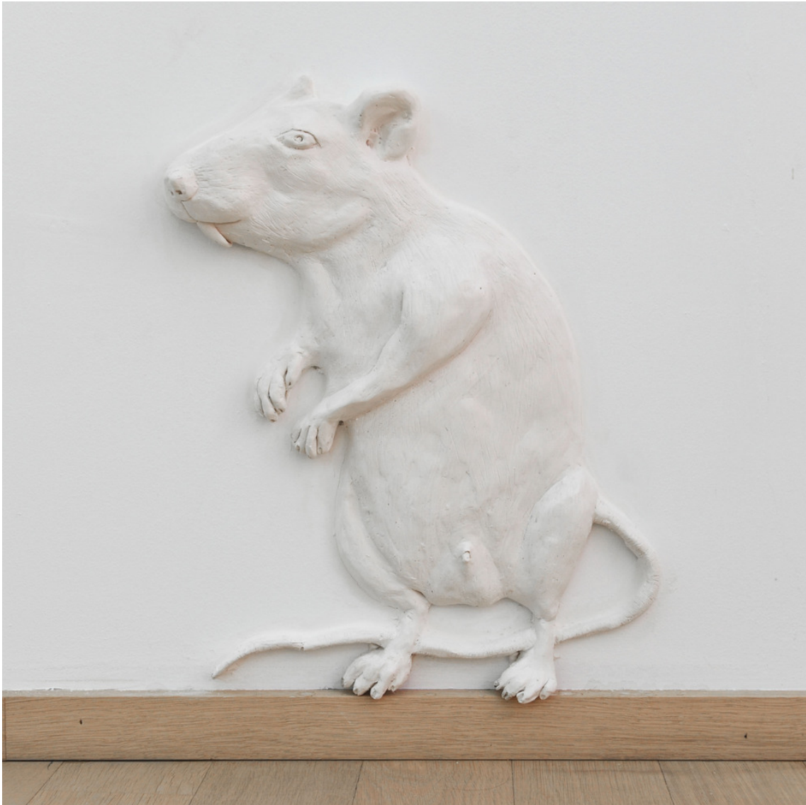
We will make you lose what you are struggling to hold on to, IX , 2018 Jesmonite, pigment, fiberglass, natural wax 36 x 28 x 5 cm Edition of 2 ex