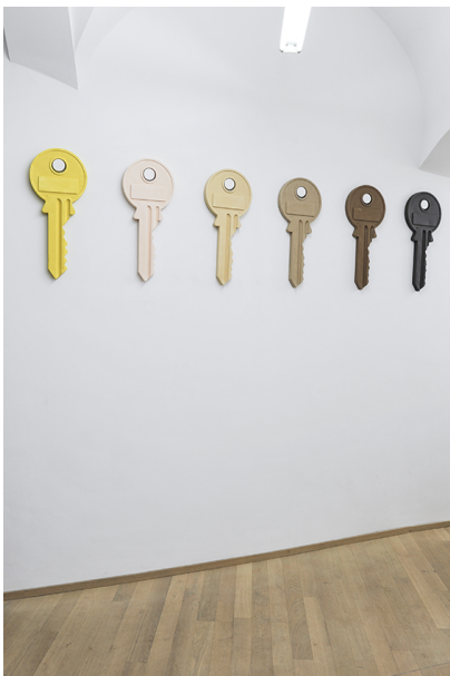
People With Vaginas Exhibition View Nosbaum Reding, Luxembourg, 2018