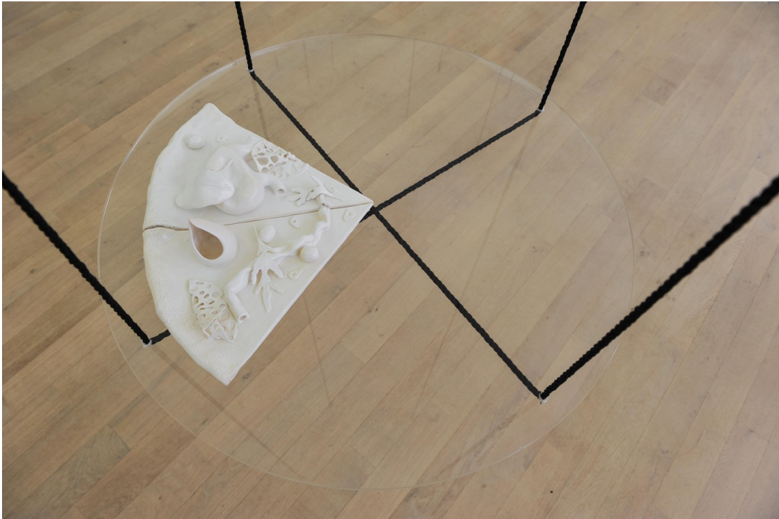
A Cannibal's Banquet within the Fortress of Exclusion (Pizza IV), 2018 Glazed earthenware, plexiglass, rope diamètre : 80cm