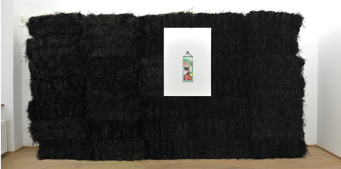
People With Vaginas Exhibition View Nosbaum Reding, Luxembourg, 2018