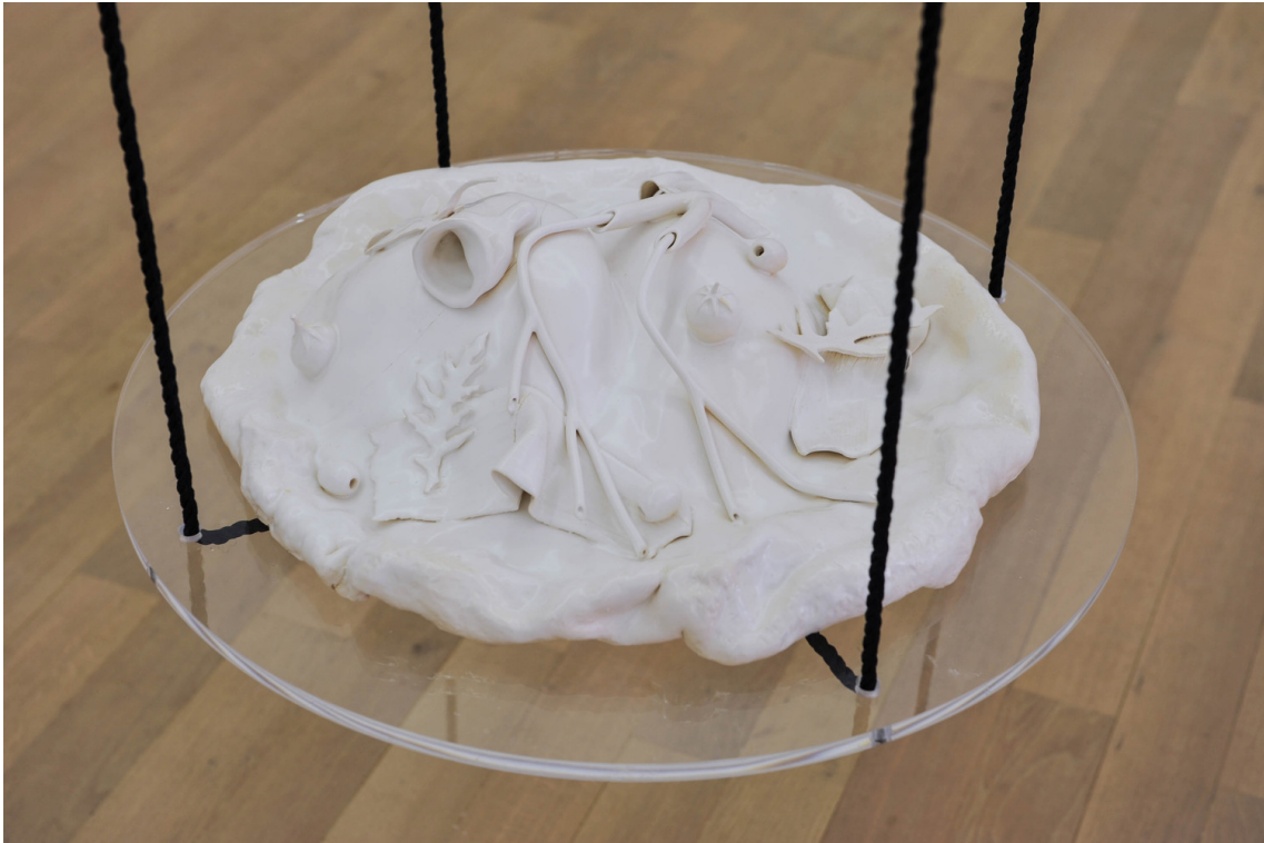
A Cannibal's Banquet within the Fortress of Exclusion (Pizza III) , 2018 Glazed earthenware, plexiglass, rope diamètre : 60cm