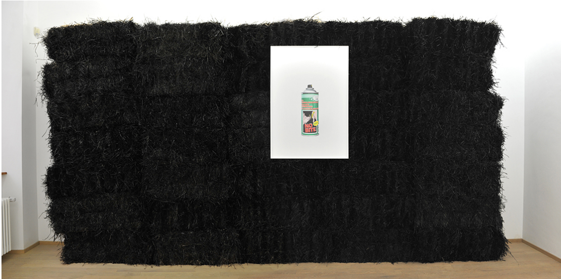
People With Vaginas Exhibition View Nosbaum Reding, Luxembourg, 2018