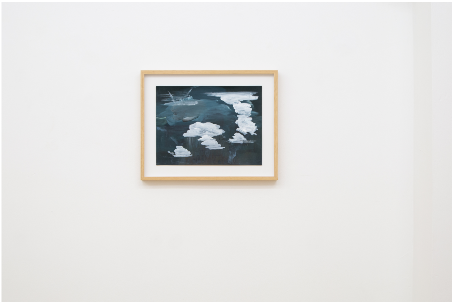
Windways Exhibition View Nosbaum Reding, Luxembourg, 2019