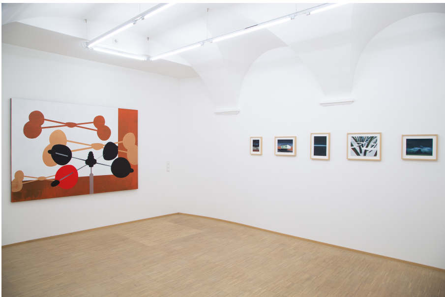
Windways Exhibition View Nosbaum Reding, Luxembourg, 2019