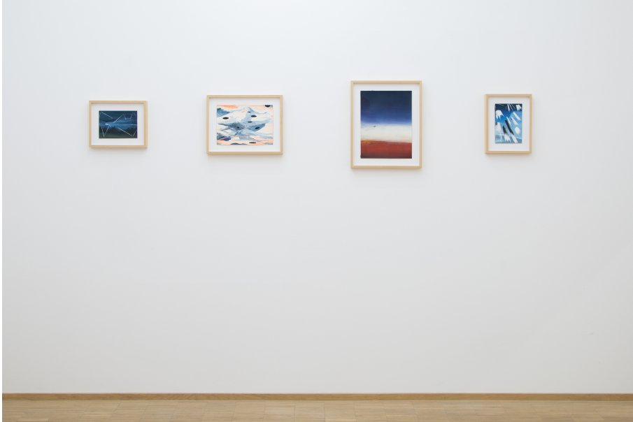
Windways Exhibition View Nosbaum Reding, Luxembourg, 2019