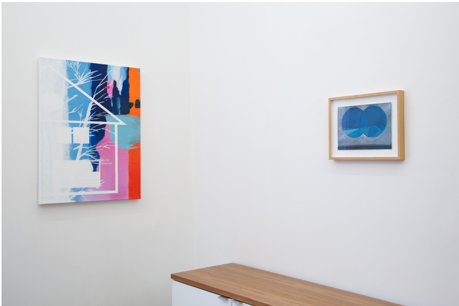
Windways Exhibition View Nosbaum Reding, Luxembourg, 2019