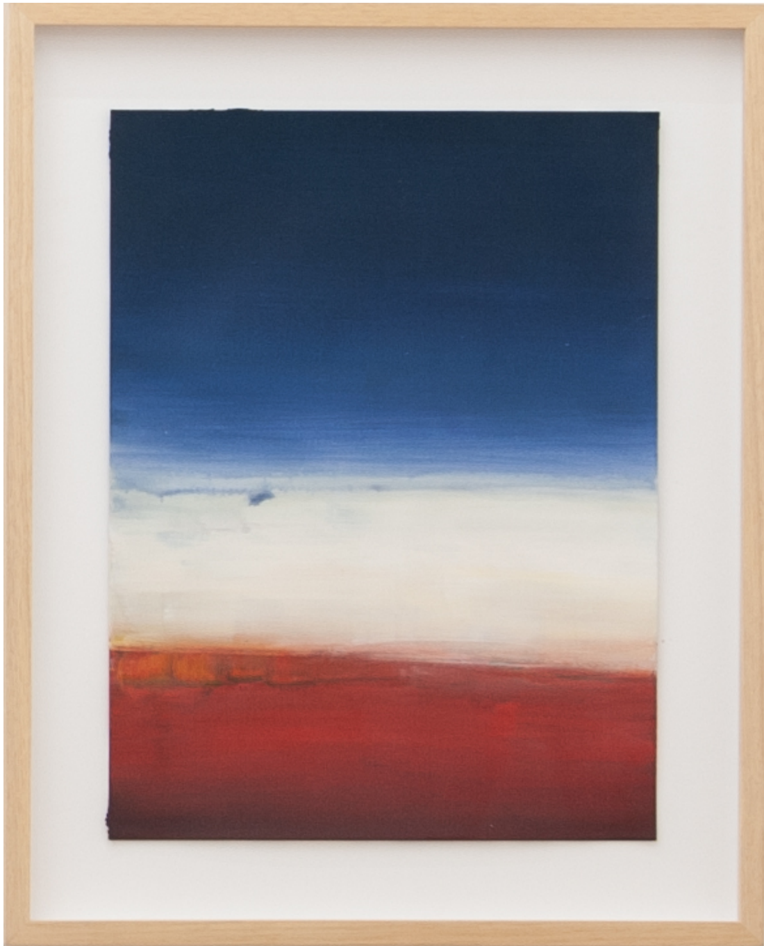
Atmosphere , 2018 Acrylic on paper 36 x 27 cm