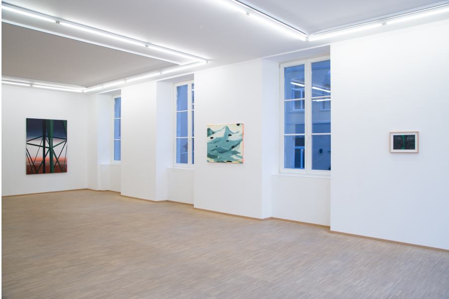
Windways Exhibition View Nosbaum Reding, Luxembourg, 2019