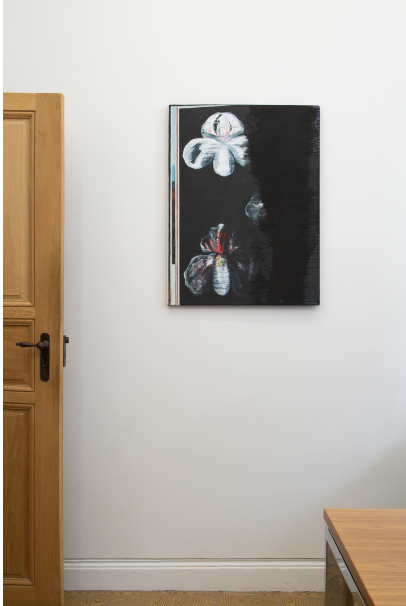
Windways Exhibition View Nosbaum Reding, Luxembourg, 2019