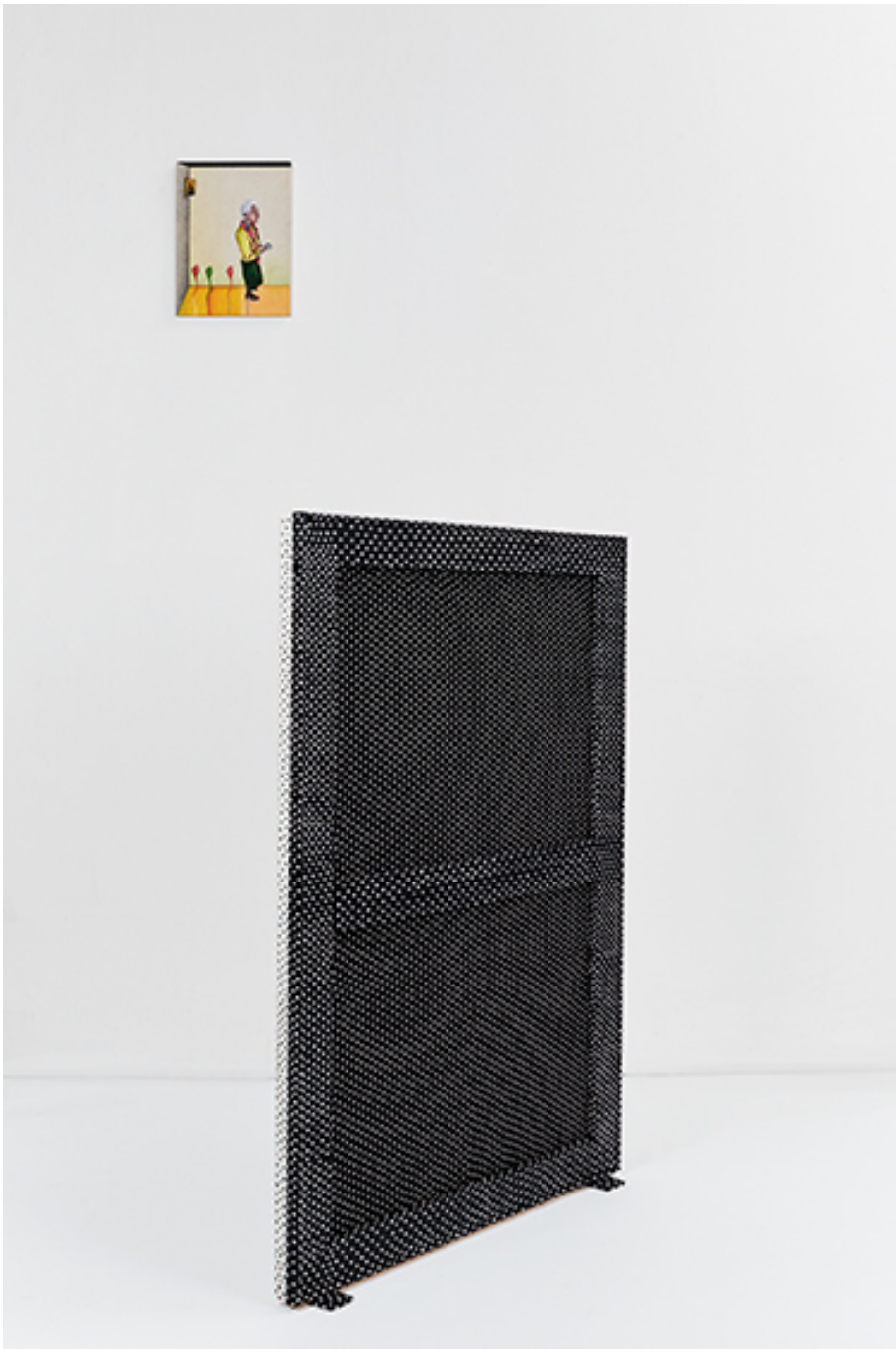
Ascenseur spirituel , 2018 huile sur bois, textile imprimé 100 x 70 x 4 cm