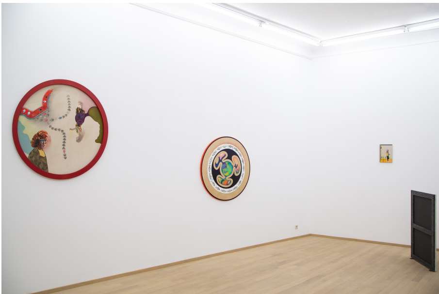
Nina Tomàs Exhibition View Nosbaum Reding, Luxembourg, 2019