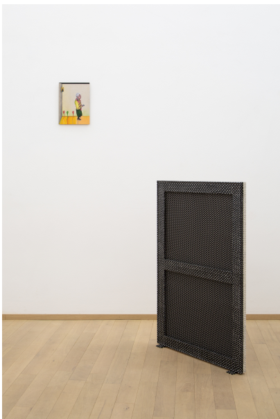
Nina Tomàs Exhibition View Nosbaum Reding, Luxembourg, 2019