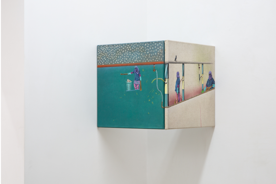
Nina Tomàs Exhibition View Nosbaum Reding, Luxembourg, 2019