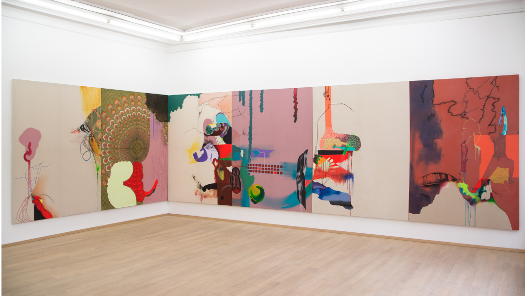
Nina Tomàs Exhibition View Nosbaum Reding, Luxembourg, 2019