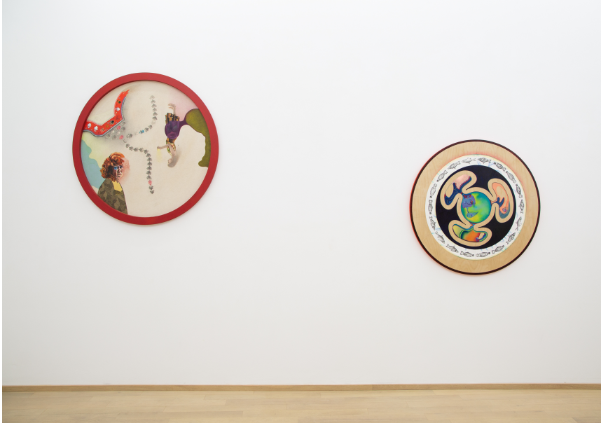
Nina Tomàs Exhibition View Nosbaum Reding, Luxembourg, 2019