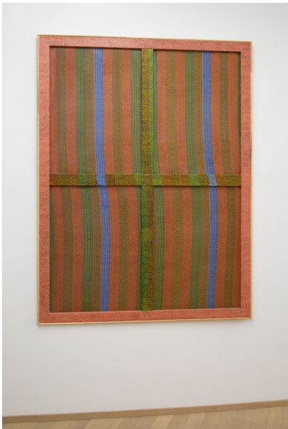
Nina Tomàs Exhibition View Nosbaum Reding, Luxembourg, 2019