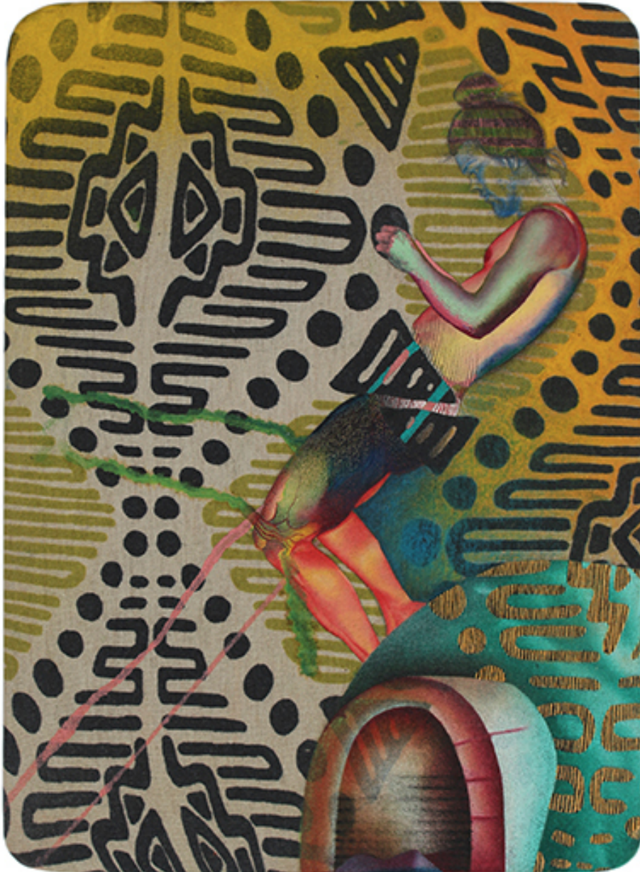
Kaki dit (tablette 2) , 2017 Oil, acrylic, charcoal and pencils on printed textile 30 x 22 cm

Gallery Nosbaum Reding 2 + 4, rue Wiltheim L-2733 Luxembourg / T (+352) 28 11 25 1 / reding@nosbaumreding.com