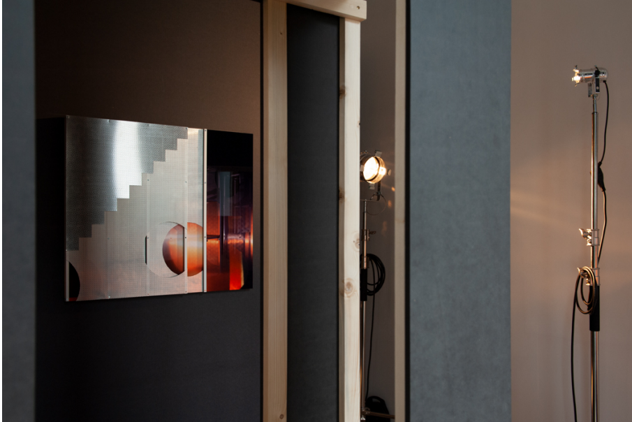
La Moitié des Yeux Exhibition View Nosbaum Reding, Luxembourg, 2019