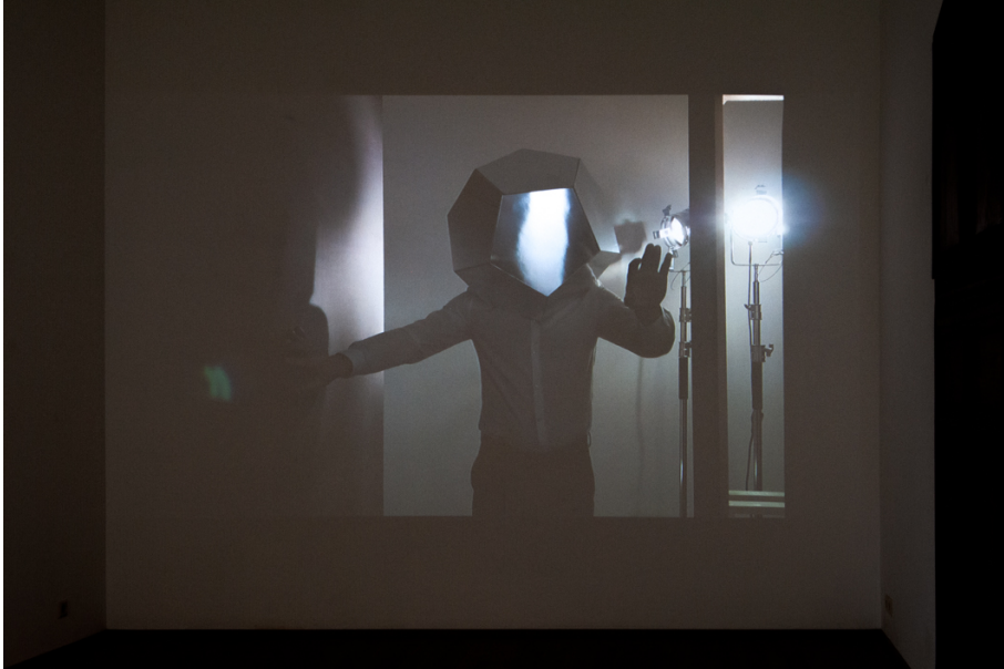
La Moitié des Yeux Exhibition View Nosbaum Reding, Luxembourg, 2019