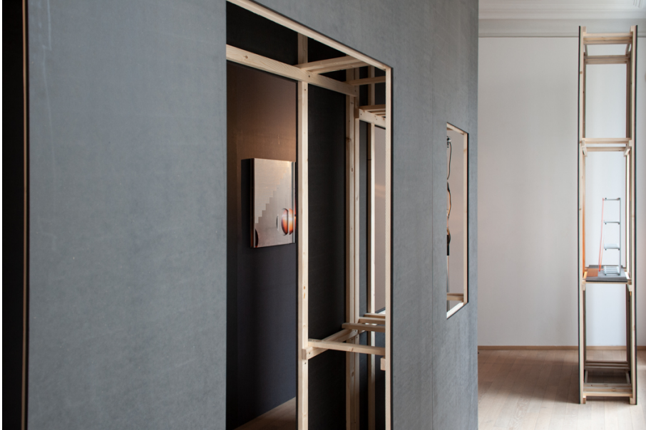
La Moitié des Yeux Exhibition View Nosbaum Reding, Luxembourg, 2019