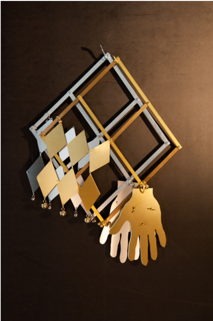
à géométrie variable (serviteur de deux patrons) 1, 2019 Aluminium and brass 24.8 x 17.32 x 1.97 in ( 63 x 44 x 5 cm ) Edition of 3 ex