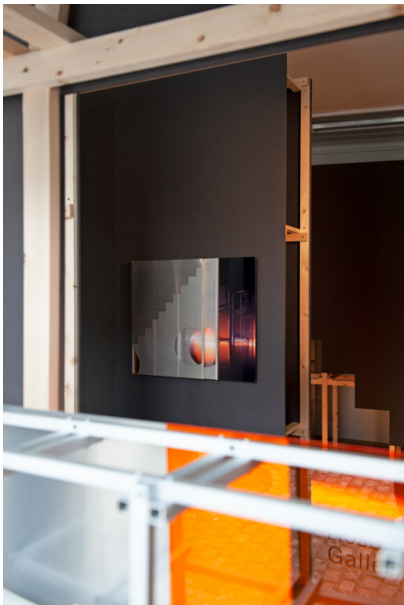
La Moitié des Yeux Exhibition View Nosbaum Reding, Luxembourg, 2019