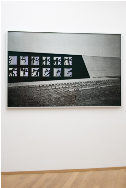
La Moitié des Yeux Exhibition View Nosbaum Reding, Luxembourg, 2019