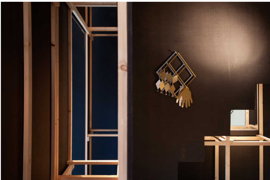
La Moitié des Yeux Exhibition View Nosbaum Reding, Luxembourg, 2019