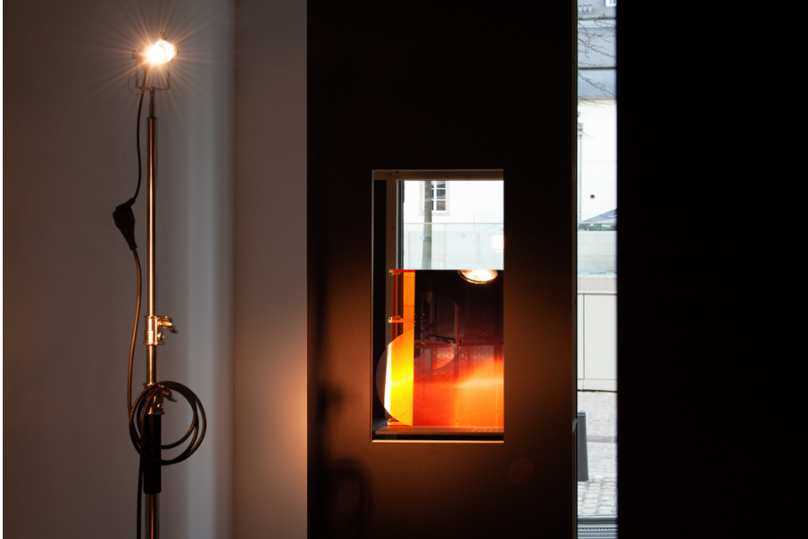
La Moitié des Yeux Exhibition View Nosbaum Reding, Luxembourg, 2019