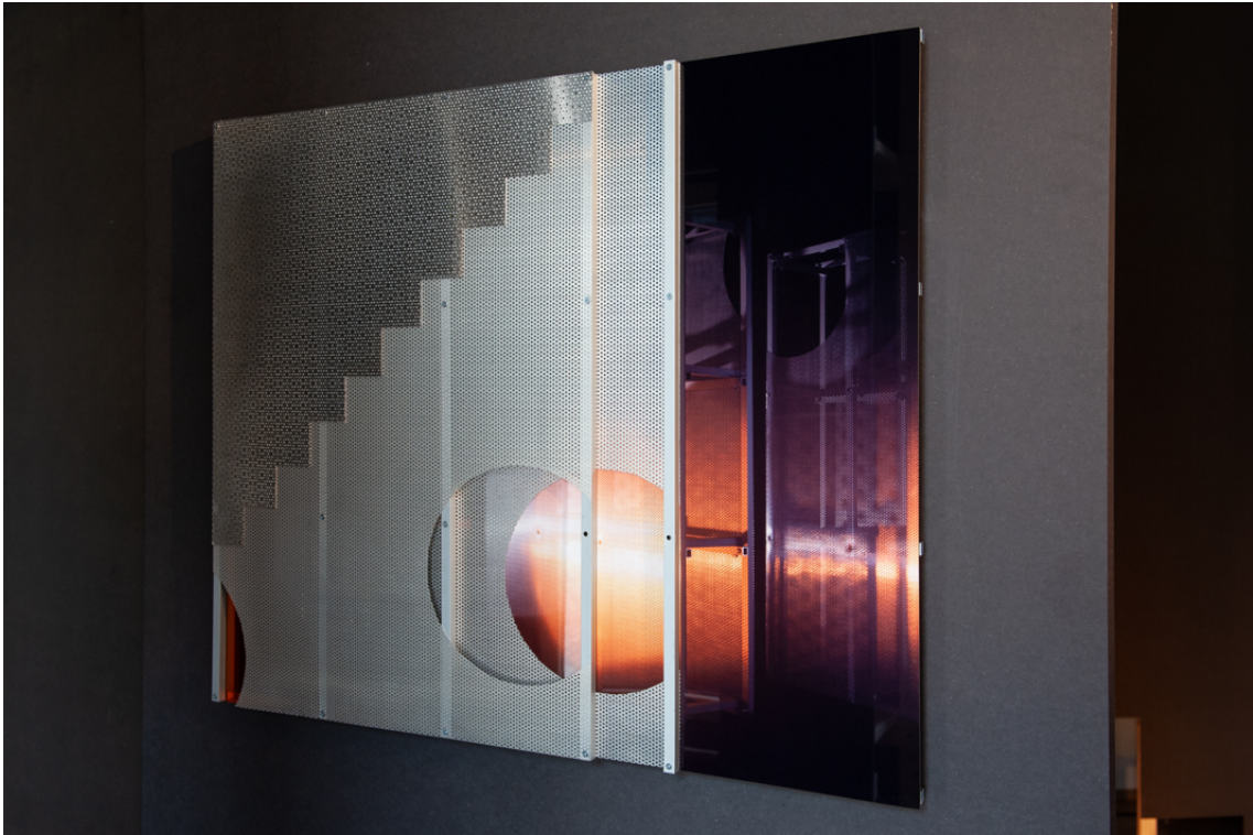
Un passage , 2019 Aluminium and plexiglass 23.62 x 27.95 x 1.18 in ( 60,2 x 71 x 3,5 cm )