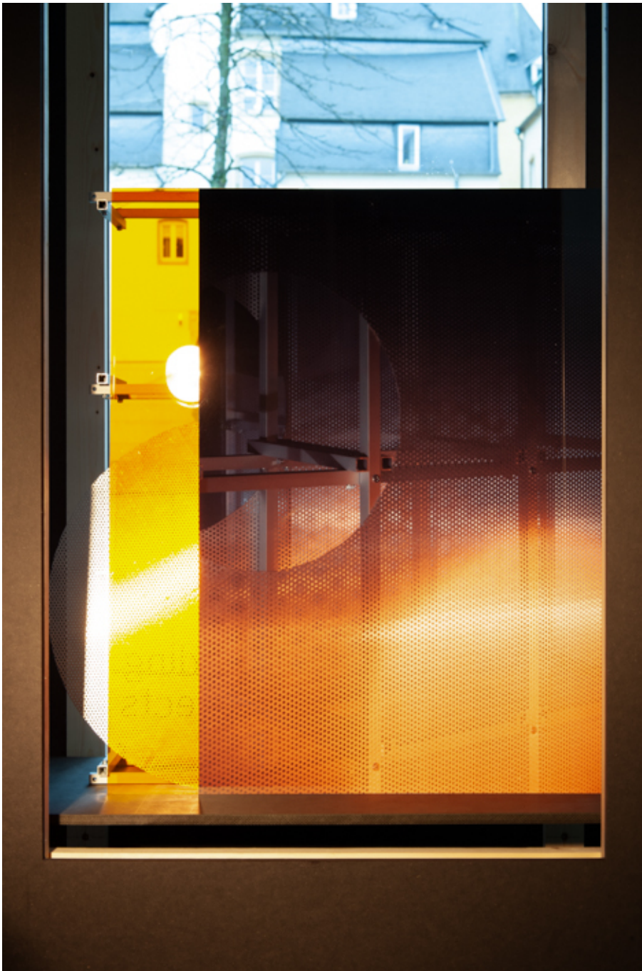
Un autre passage , 2019 Aluminium and plexiglass 23.62 x 21.65 x 6.69 in ( 60,2 x 55 x 17 cm )