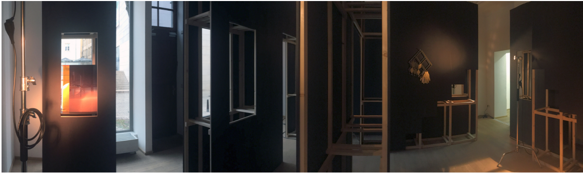
Serviteur de deux patrons , 2019 Mixed medias