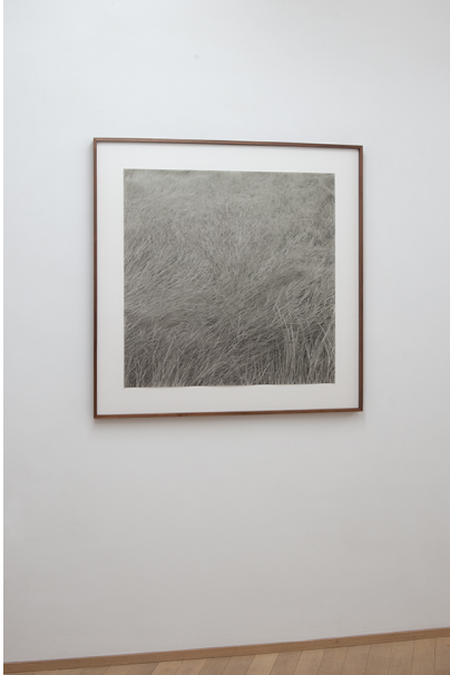
Aline Forçain Exhibition View Nosbaum Reding, Luxembourg, 2019