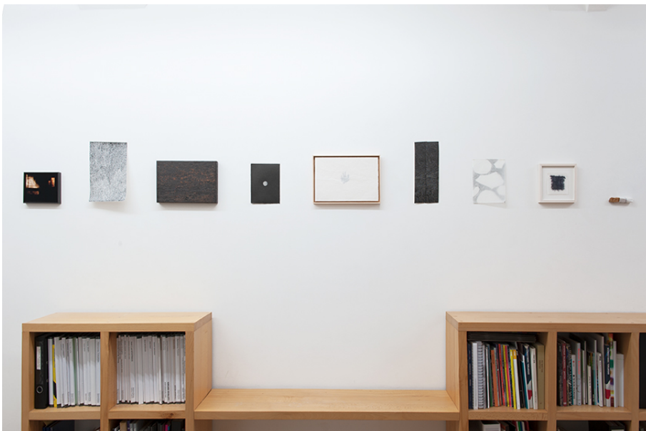
Aline Forçain Exhibition View Nosbaum Reding, Luxembourg, 2019