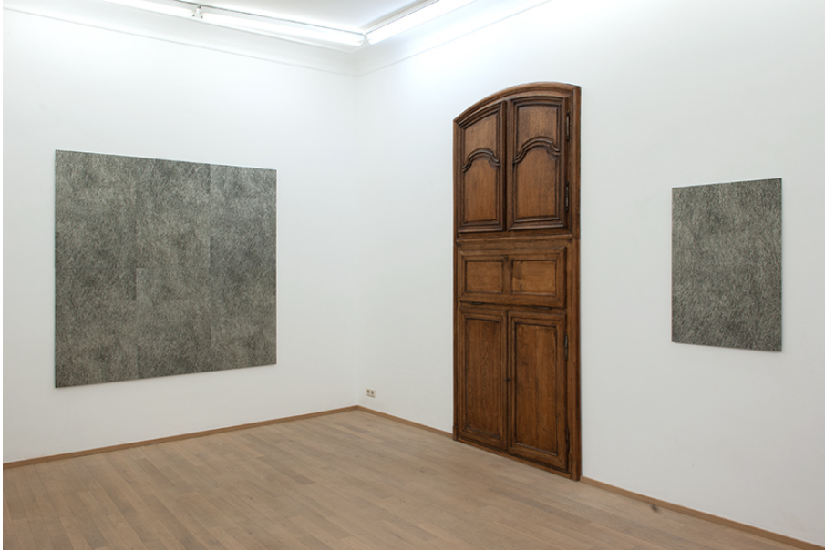
Aline Forçain Exhibition View Nosbaum Reding, Luxembourg, 2019