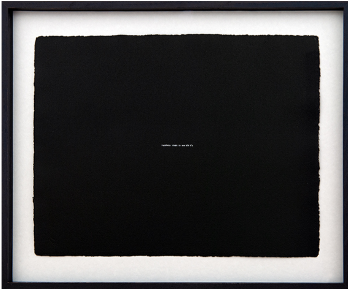
De l'autre côté , 2018 Encre de Chine sur papier 11.81 x 15.75 in ( 30 x 40,5 cm )