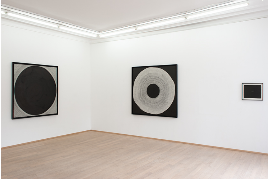
Aline Forçain Exhibition View Nosbaum Reding, Luxembourg, 2019