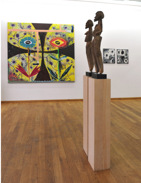
GUESTS / Arts premiers Exhibition View Nosbaum Reding, Luxembourg, 2013