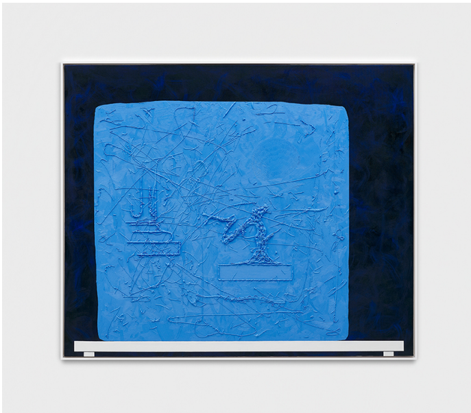
AUGMENTED BONSAI (Malerei) Exhibition View Nosbaum Reding, Luxembourg, 2019