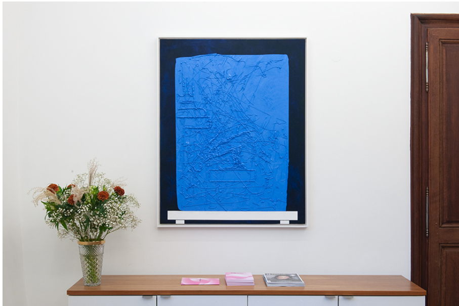
AUGMENTED BONSAI (Malerei) Exhibition View Nosbaum Reding, Luxembourg, 2019