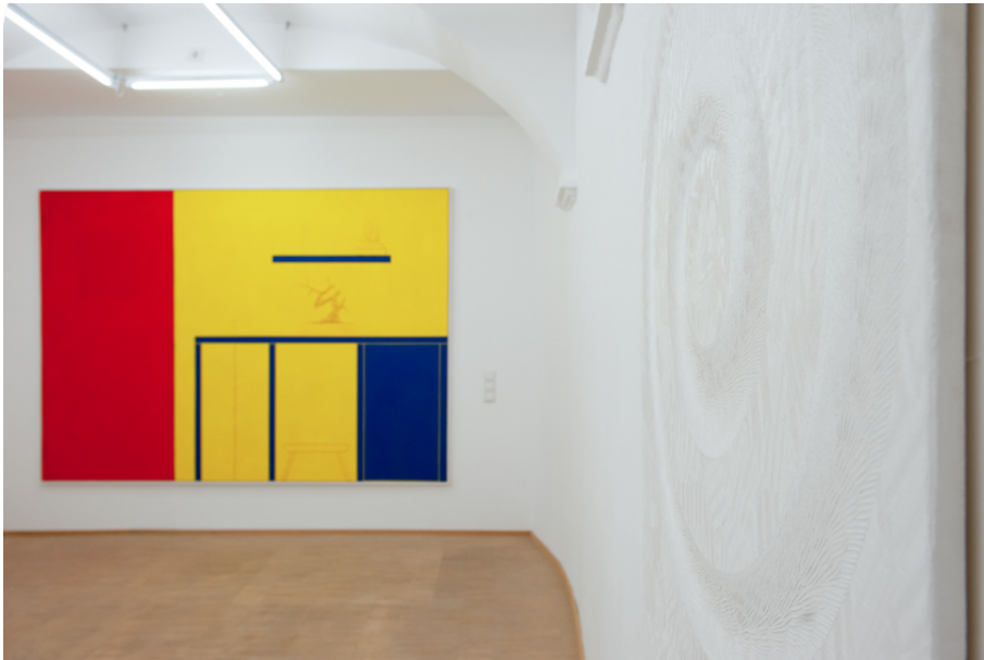
AUGMENTED BONSAI (Malerei) Exhibition View Nosbaum Reding, Luxembourg, 2019