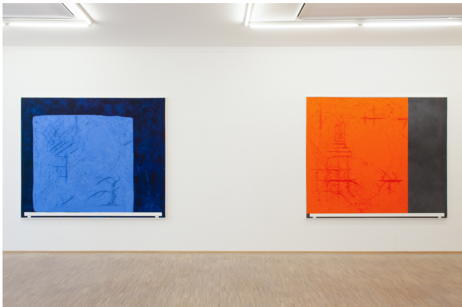
AUGMENTED BONSAI (Malerei) Exhibition View Nosbaum Reding, Luxembourg, 2019