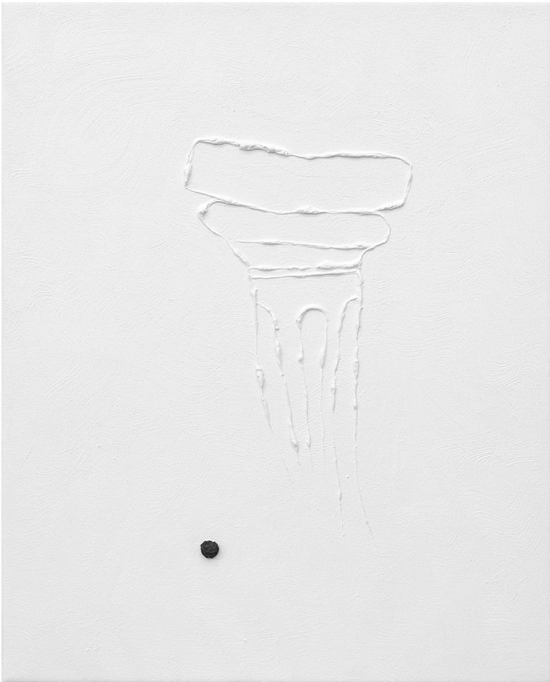
S.T.(5), 2018 huile sur toile 19.69 x 15.75 in ( 50 x 40 cm )