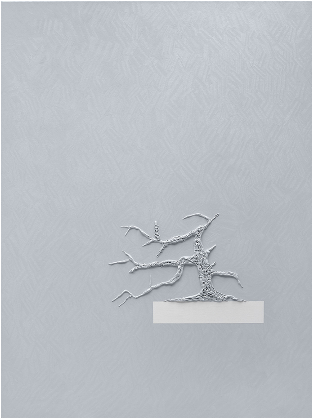
GRID (WEB) 6 , 2019 Oil on canvas 78.74 x 59.06 in ( 200 x 150 cm )