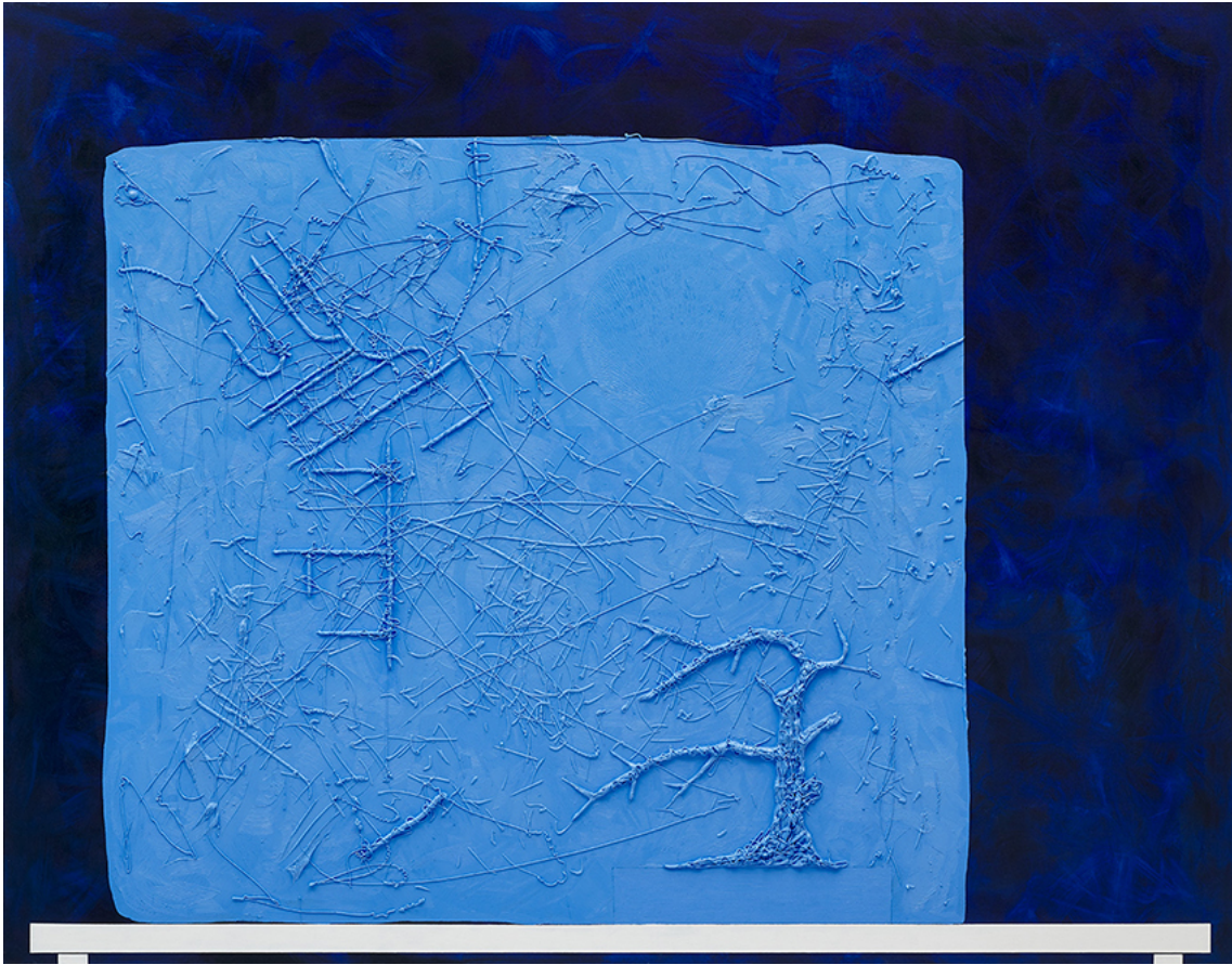
GRID (WEB) 3 , 2019 huile sur toile 70.87 x 90.55 in ( 180 x 230 cm )