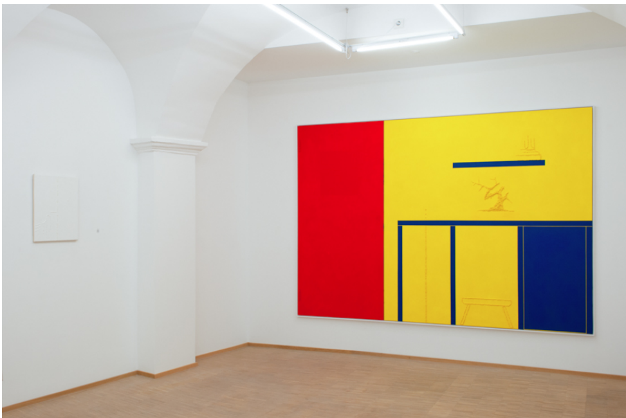
AUGMENTED BONSAI (Malerei) Exhibition View Nosbaum Reding, Luxembourg, 2019