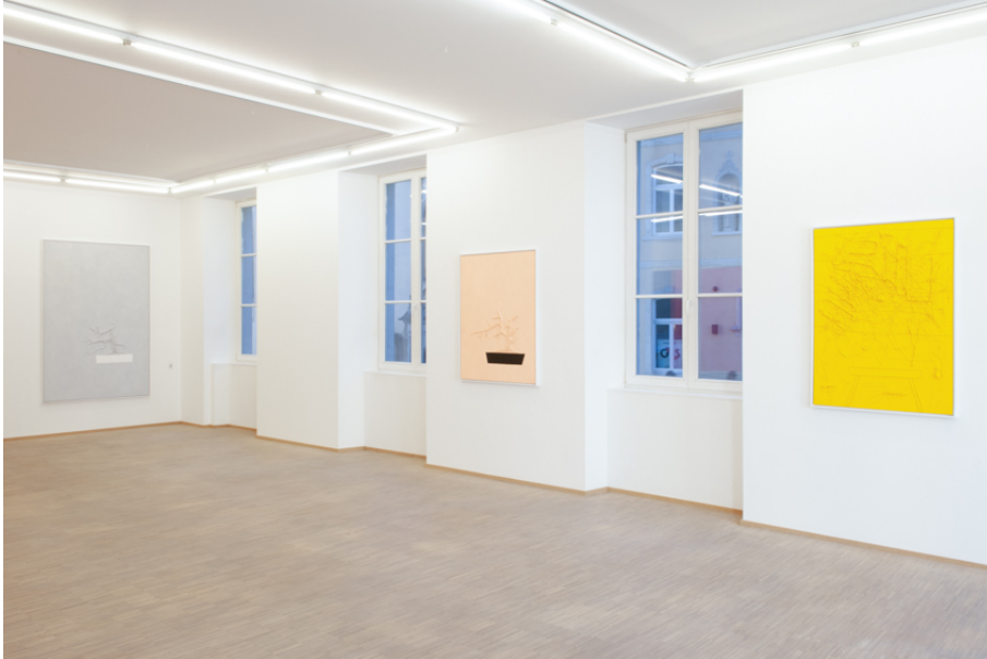
AUGMENTED BONSAI (Malerei) Exhibition View Nosbaum Reding, Luxembourg, 2019