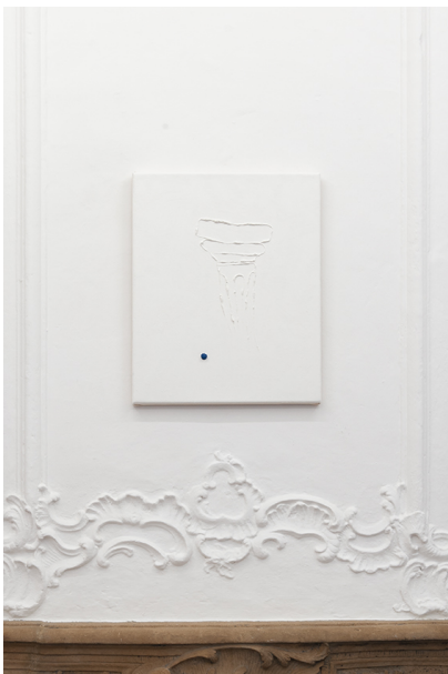
AUGMENTED BONSAI (Malerei) Exhibition View Nosbaum Reding, Luxembourg, 2019