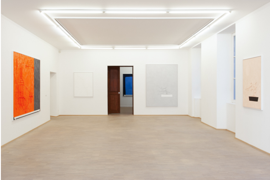
AUGMENTED BONSAI (Malerei) Exhibition View Nosbaum Reding, Luxembourg, 2019