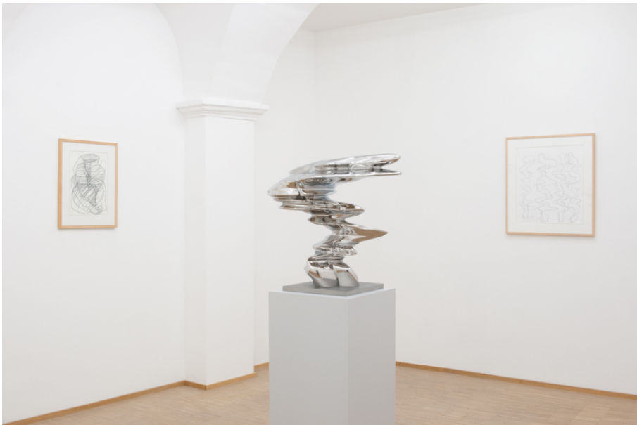
Tony Cragg Exhibition View Nosbaum Reding, Luxembourg, 2020