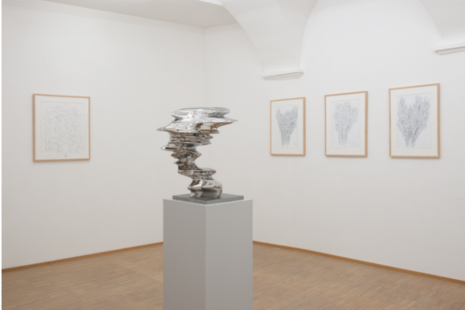
Tony Cragg Exhibition View Nosbaum Reding, Luxembourg, 2020