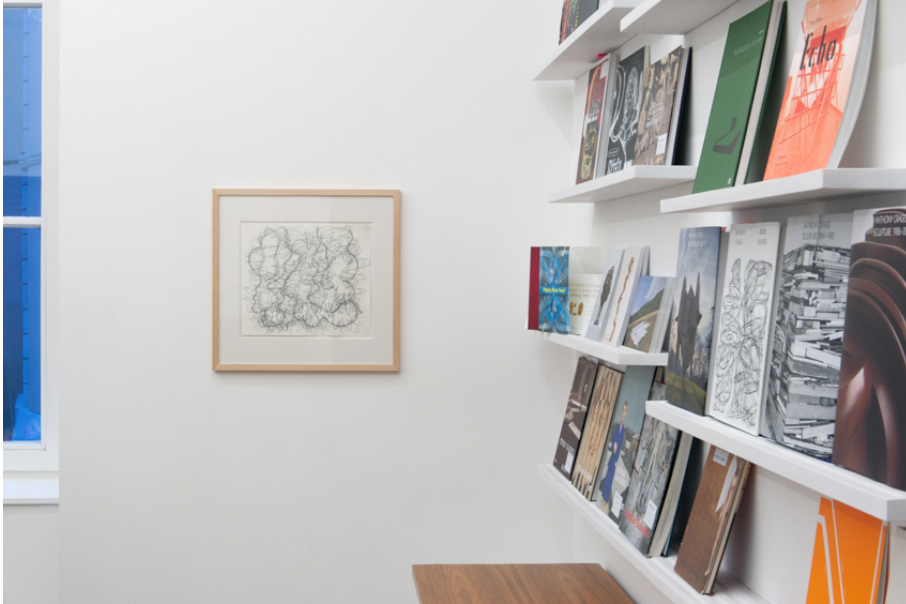
Tony Cragg Exhibition View Nosbaum Reding, Luxembourg, 2020