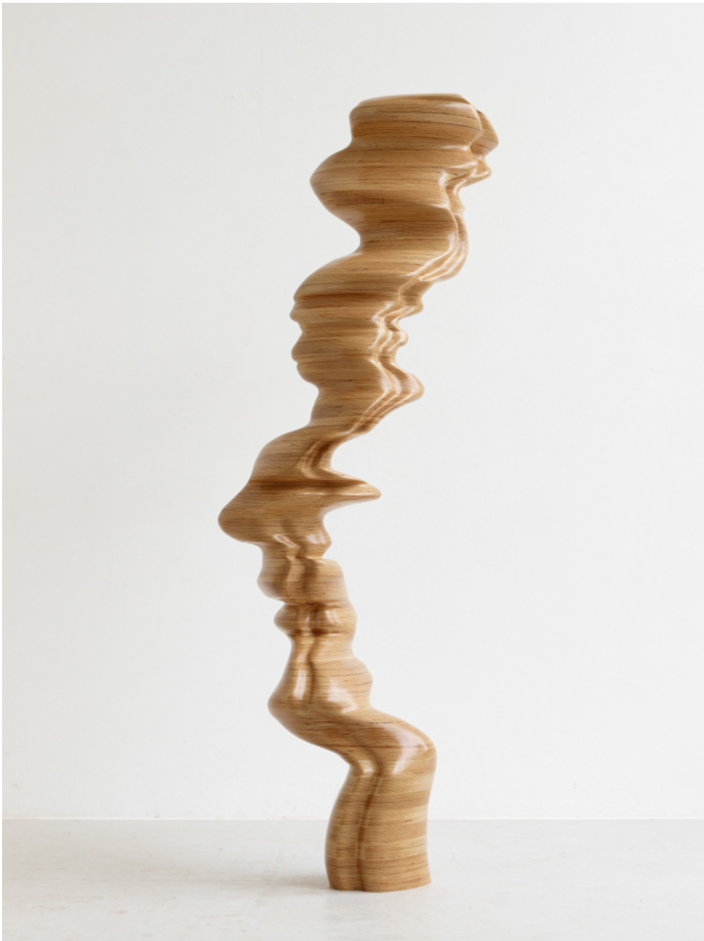
Ivy , 2018 wood 80.71 x 28.35 x 25.98 in ( 205 x 72 x 66 cm )