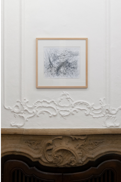
Tony Cragg Exhibition View Nosbaum Reding, Luxembourg, 2020