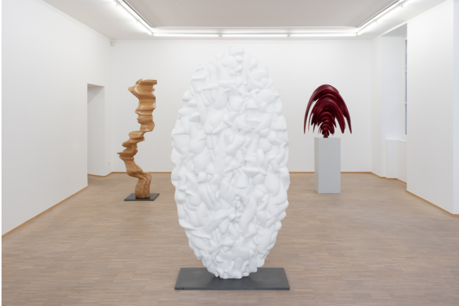
Tony Cragg Exhibition View Nosbaum Reding, Luxembourg, 2020