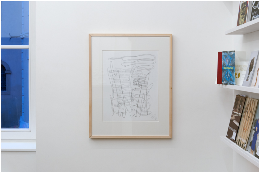
Tony Cragg Exhibition View Nosbaum Reding, Luxembourg, 2020