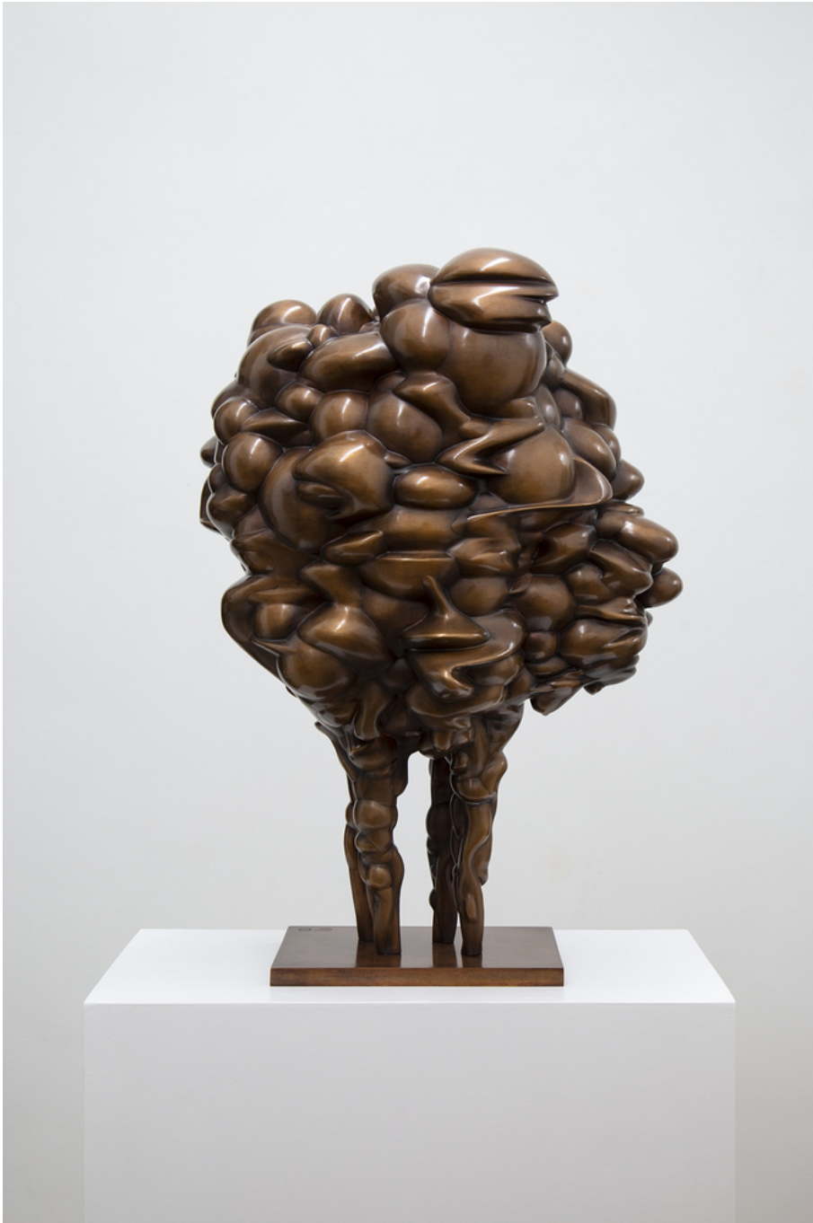
Quadruped , 2019 Bronze 23.62 x 16.54 x 13.78 in ( 60 x 42 x 35 cm )

Gallery Nosbaum Reding 2 + 4, rue Wiltheim L-2733 Luxembourg / T (+352) 28 11 25 1 / reding@nosbaumreding.com