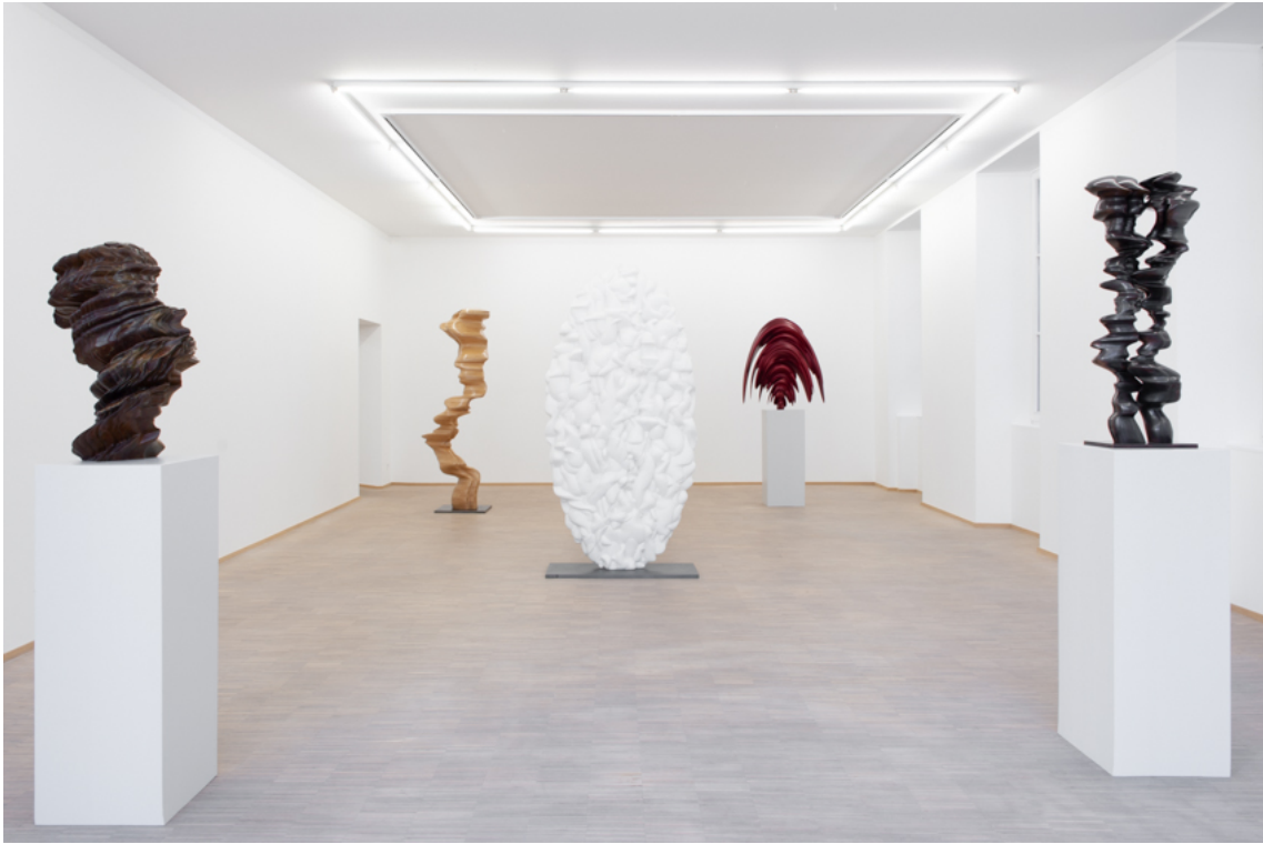
Tony Cragg Exhibition View Nosbaum Reding, Luxembourg, 2020