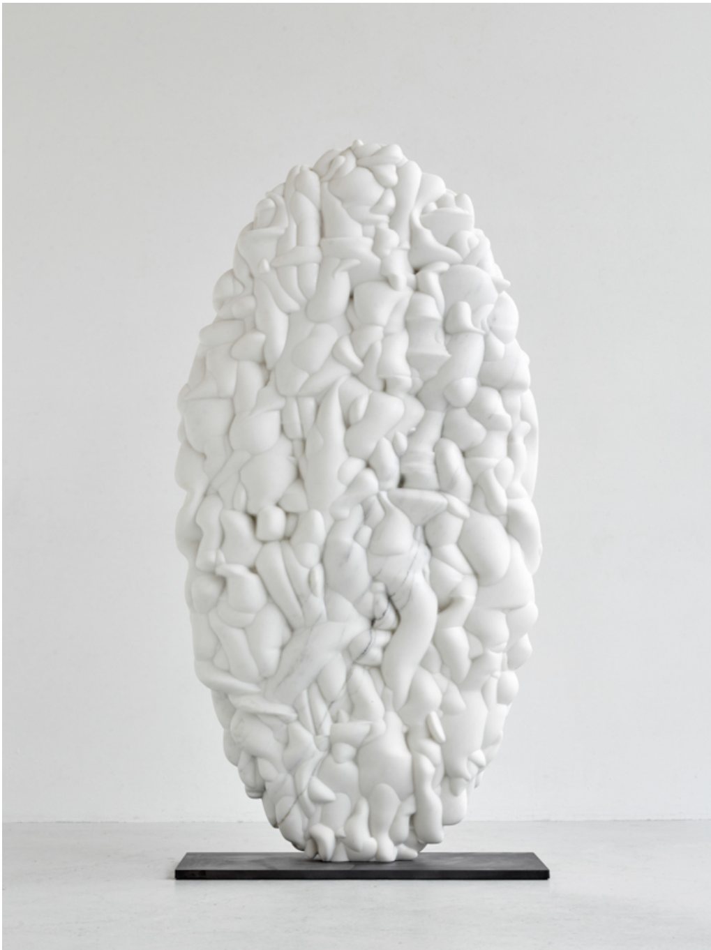
Sail , 2019 Stone (white) 78.74 x 39.37 x 11.81 in ( 200 x 100 x 30 cm )