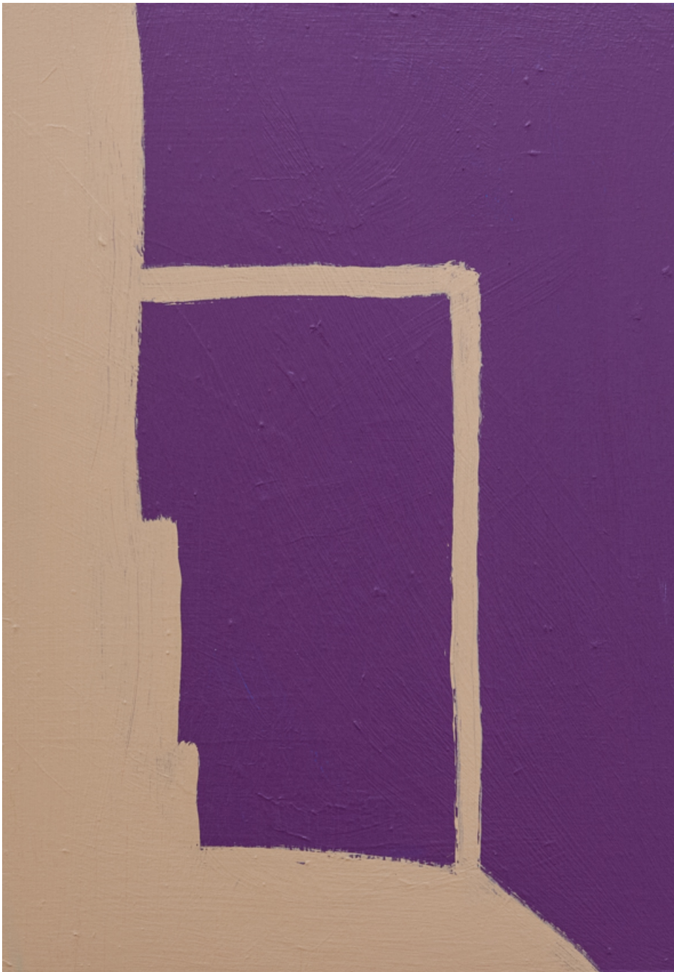
Winkel violett , 2020 acrylic on wood 15.75 x 11.02 in ( 40,8 x 28,8 cm )