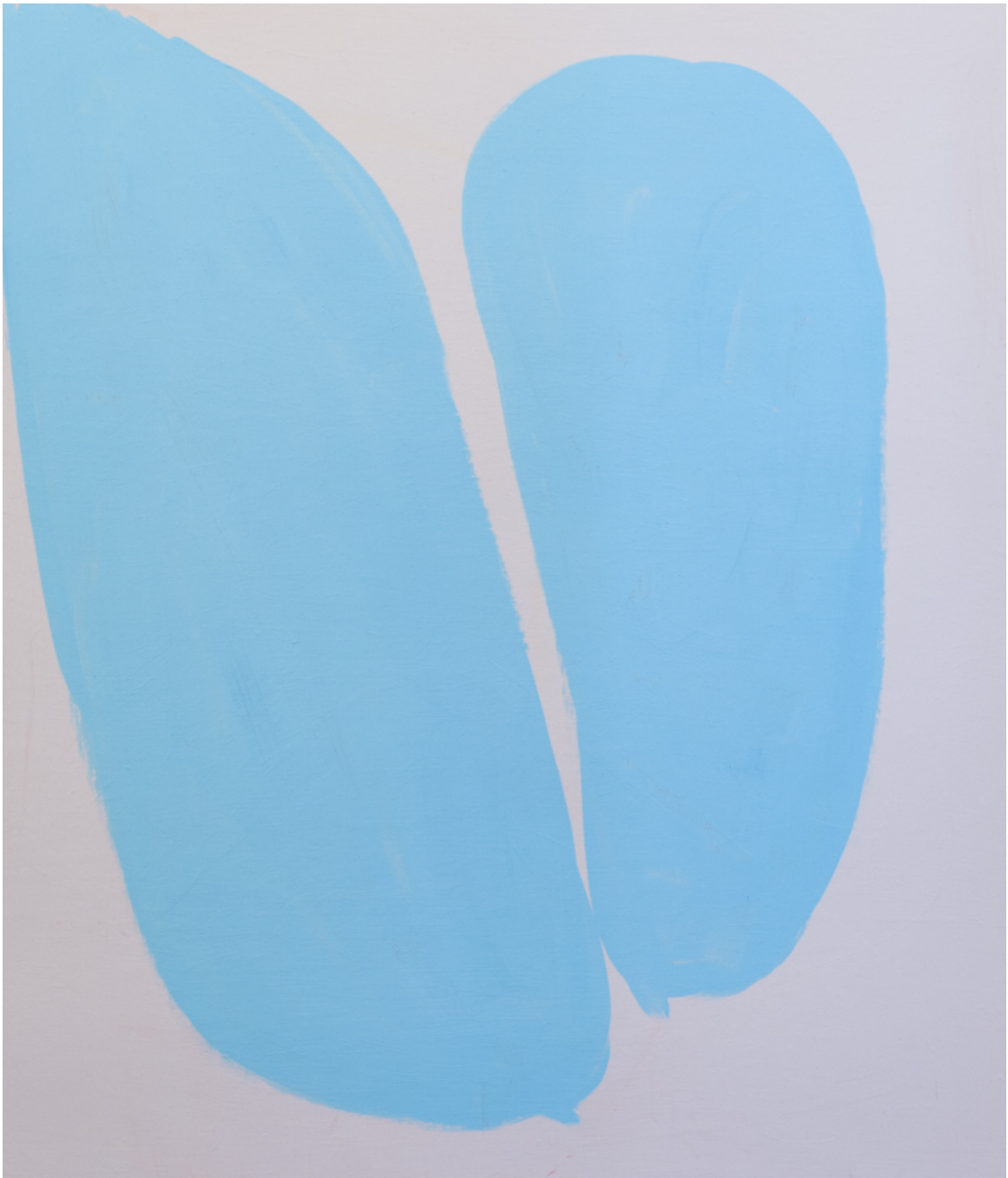
Keim , 2020 acrylic on wood 57.09 x 48.82 in ( 145,8 x 124,5 cm )