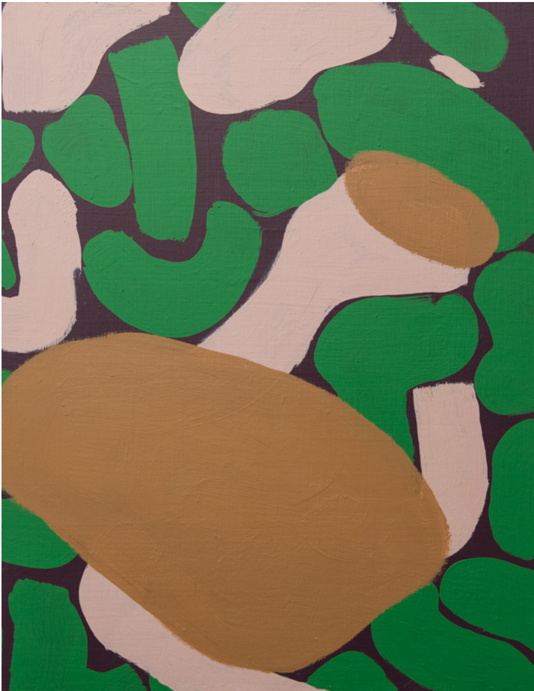
Grummeln , 2020 acrylic on wood 30.71 x 24.02 in ( 78,9 x 61 cm )