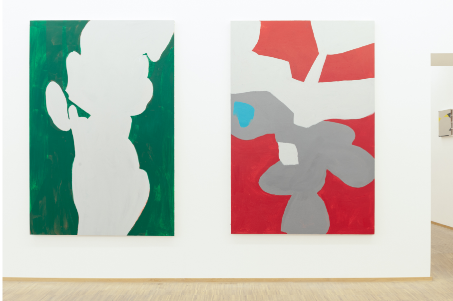
Zwischen Tor und Torschrei Exhibition View Nosbaum Reding, Luxembourg, 2020