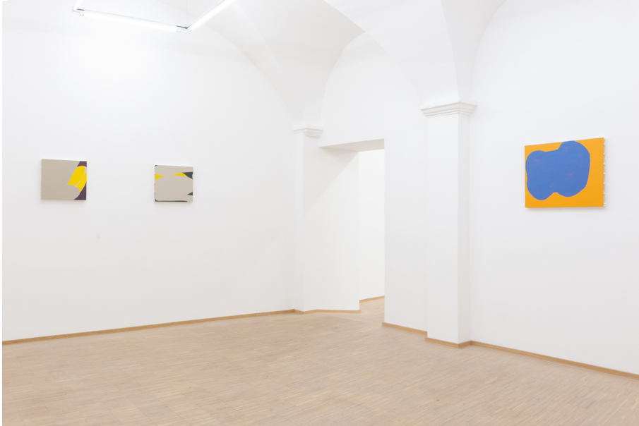
Zwischen Tor und Torschrei Exhibition View Nosbaum Reding, Luxembourg, 2020