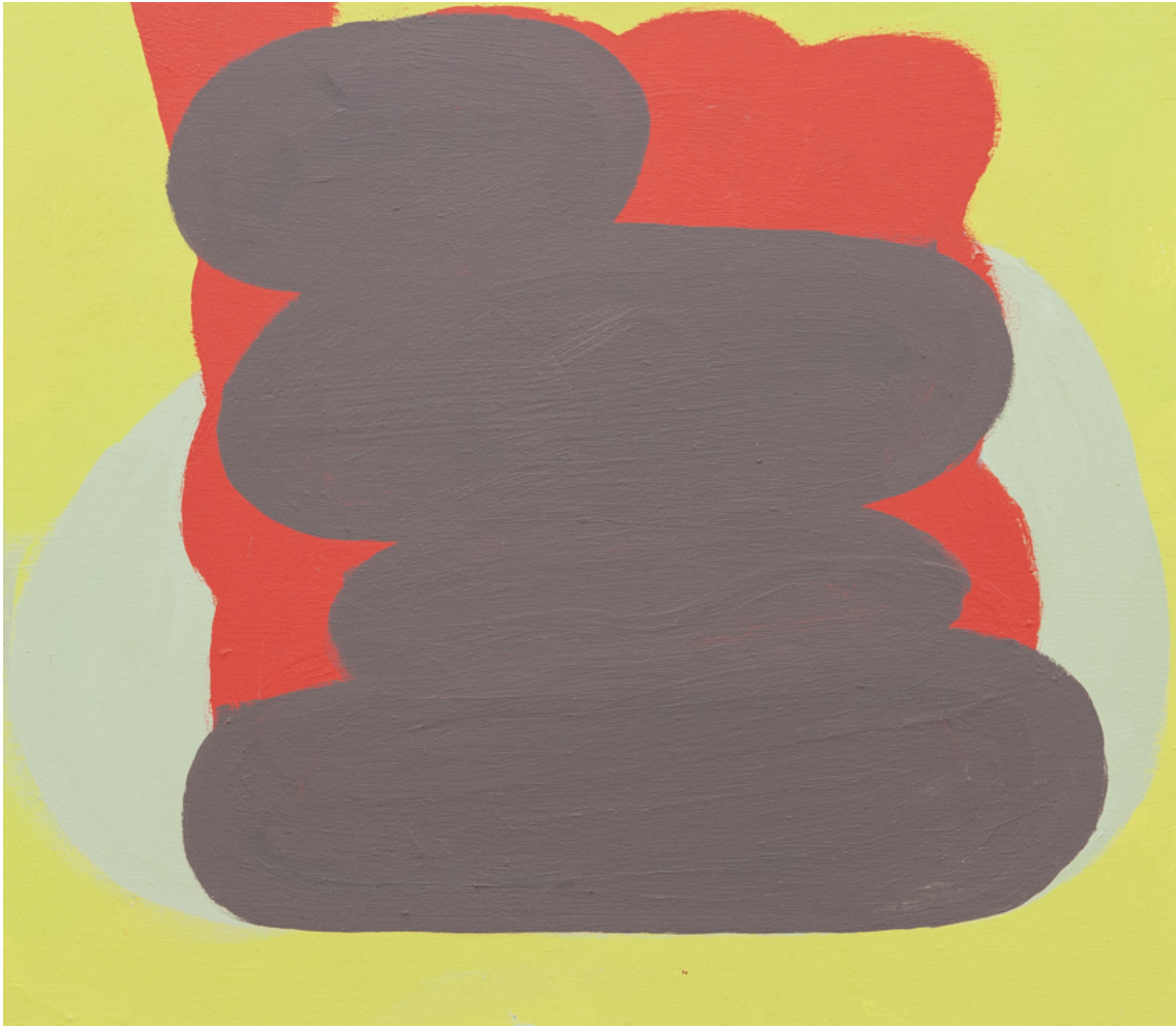
Stapel , 2020 acrylic on wood 13.78 x 15.75 in ( 35,3 x 40,3 cm )