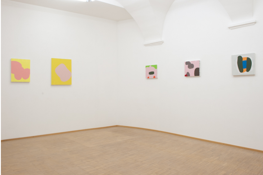
Zwischen Tor und Torschrei Exhibition View Nosbaum Reding, Luxembourg, 2020