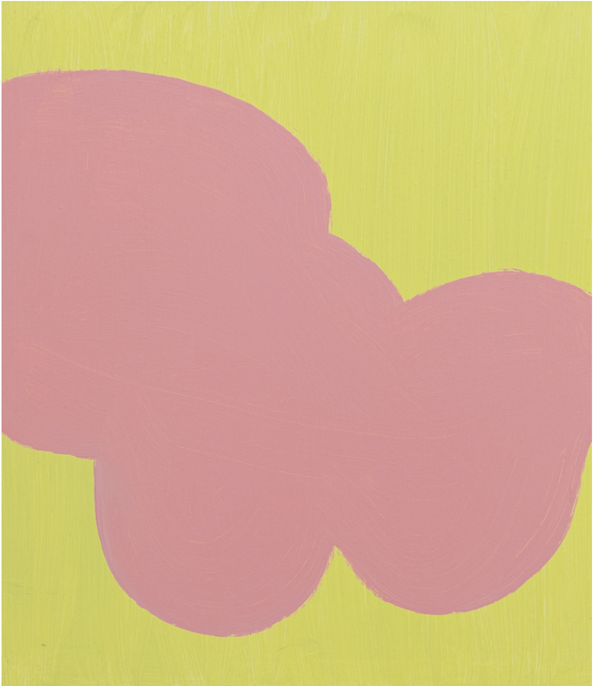
Yellow (Part A) , 2020 acrylic on wood 18.5 x 16.14 in ( 47,3 x 41 cm )