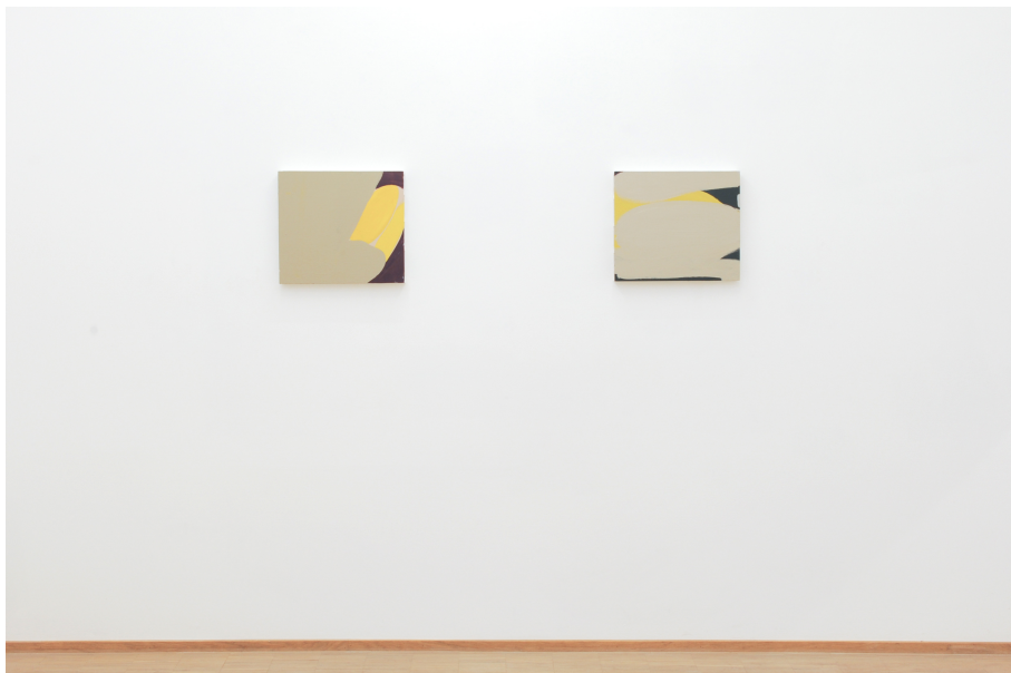
Zwischen Tor und Torschrei Exhibition View Nosbaum Reding, Luxembourg, 2020