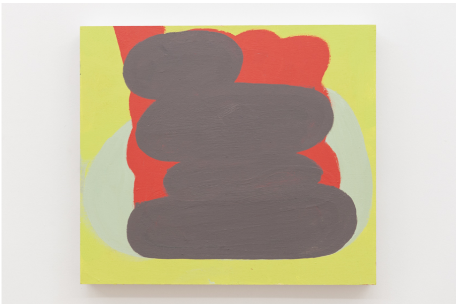
Zwischen Tor und Torschrei Exhibition View Nosbaum Reding, Luxembourg, 2020