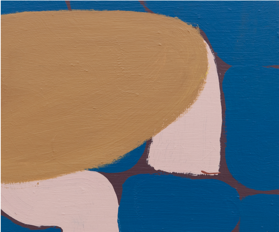
Klemmstein 2 , 2020 acrylic on wood 11.42 x 13.78 in ( 29,9 x 35,9 cm )