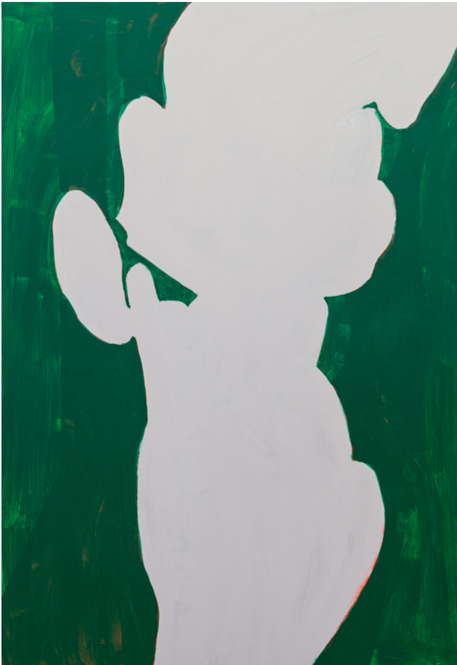
Licht und Grün , 2020 acrylic on wood 73.23 x 50.39 in ( 186,8 x 128,5 cm )