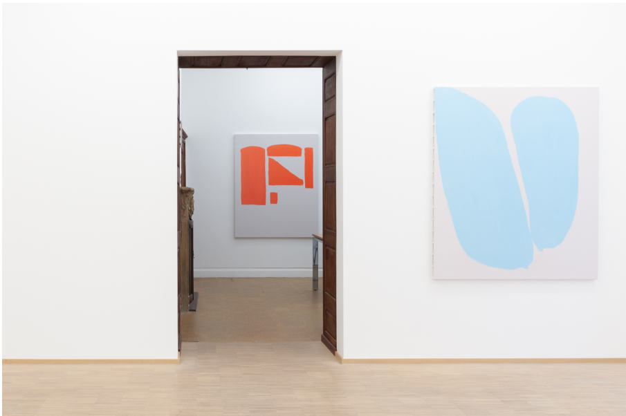
Zwischen Tor und Torschrei Exhibition View Nosbaum Reding, Luxembourg, 2020