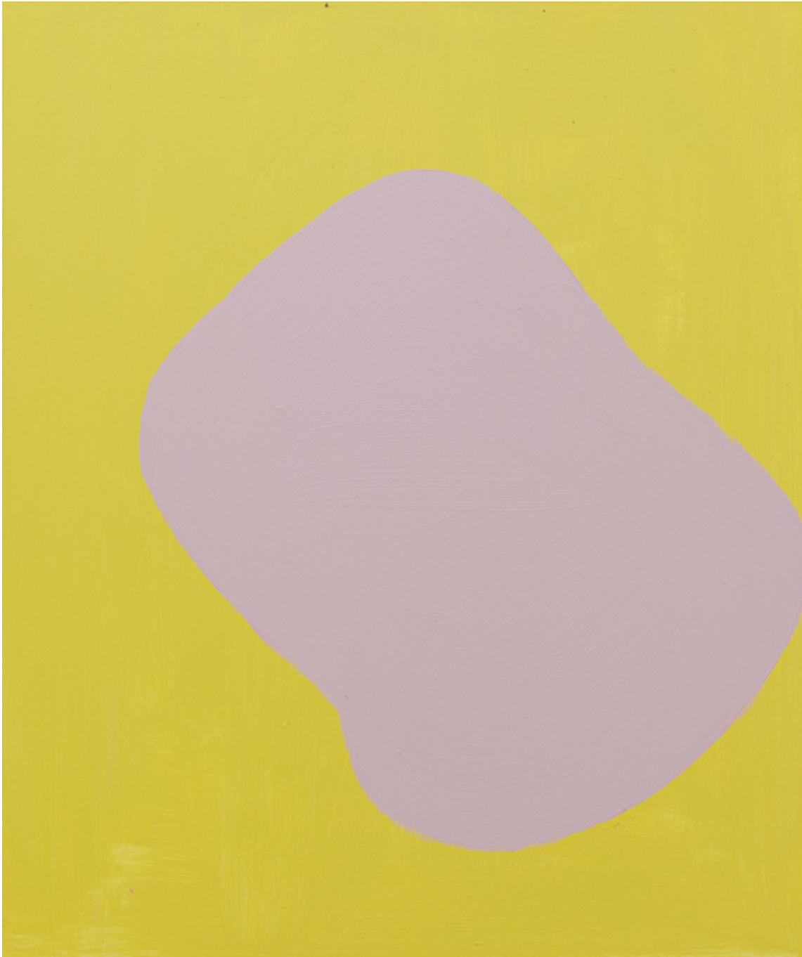
Yellow (Part B) , 2020 acrylic on wood 23.62 x 19.69 in ( 60,1 x 50 cm )

Gallery Nosbaum Reding 2 + 4, rue Wiltheim L-2733 Luxembourg / T (+352) 28 11 25 1 / reding@nosbaumreding.com