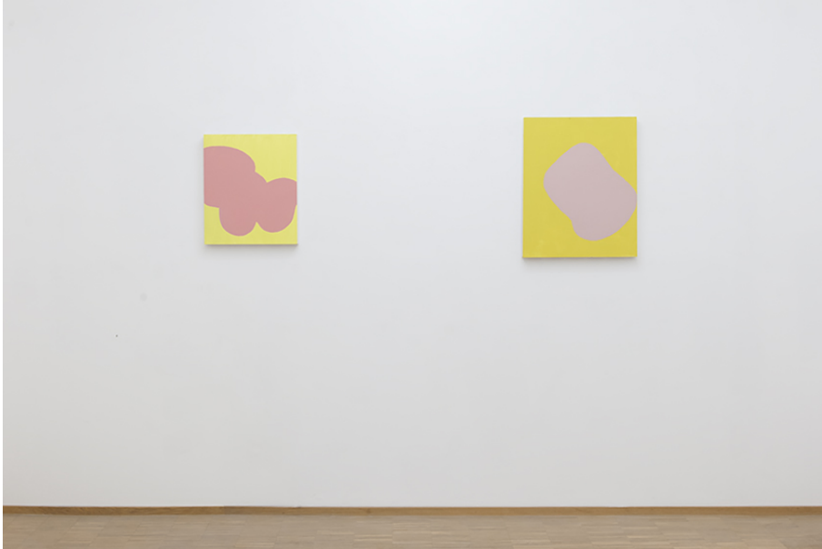
Zwischen Tor und Torschrei Exhibition View Nosbaum Reding, Luxembourg, 2020