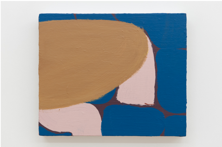
Zwischen Tor und Torschrei Exhibition View Nosbaum Reding, Luxembourg, 2020