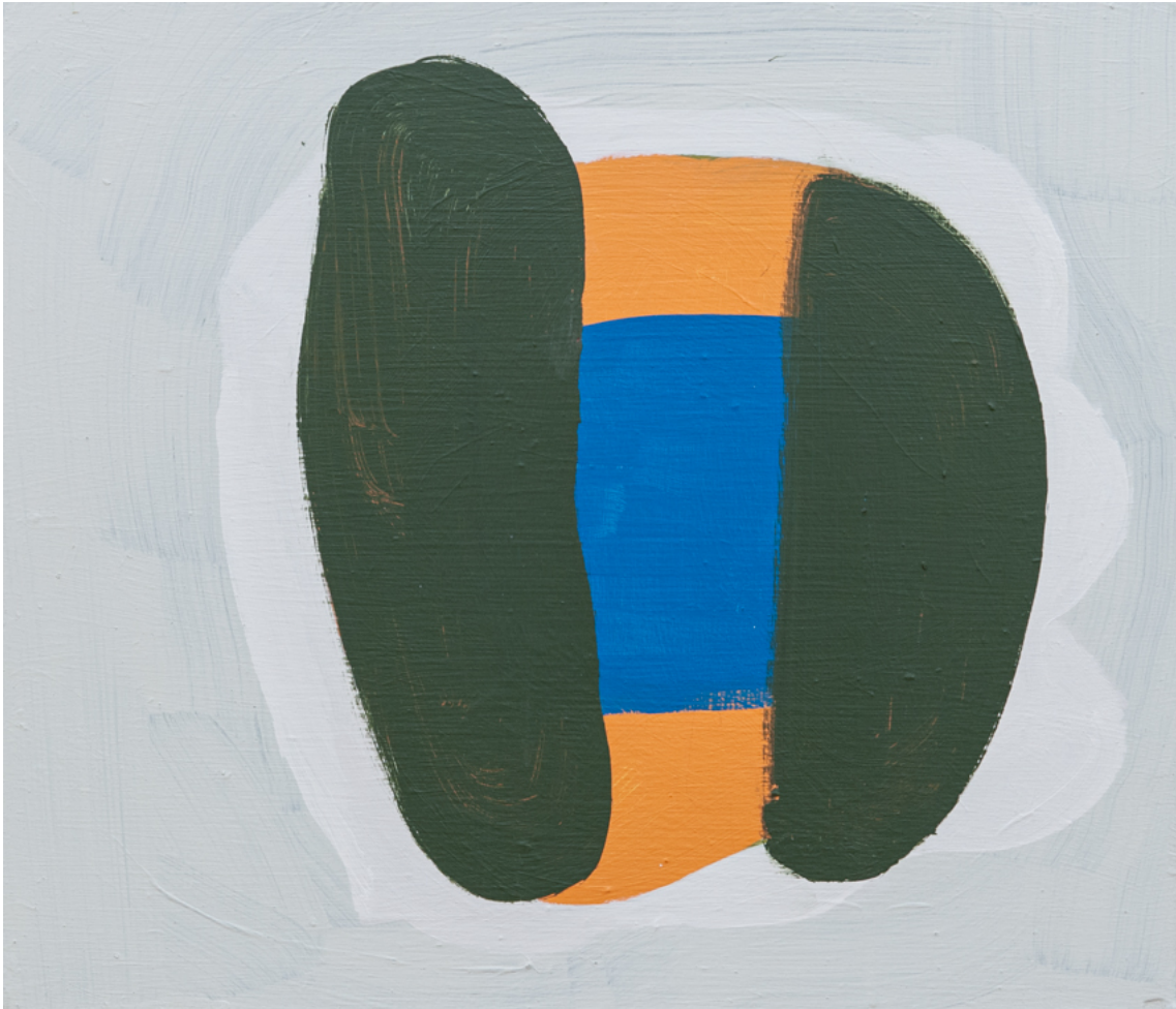
Doppelsandwich , 2020 acrylic on wood 13.78 x 16.14 in ( 35,3 x 41 cm )