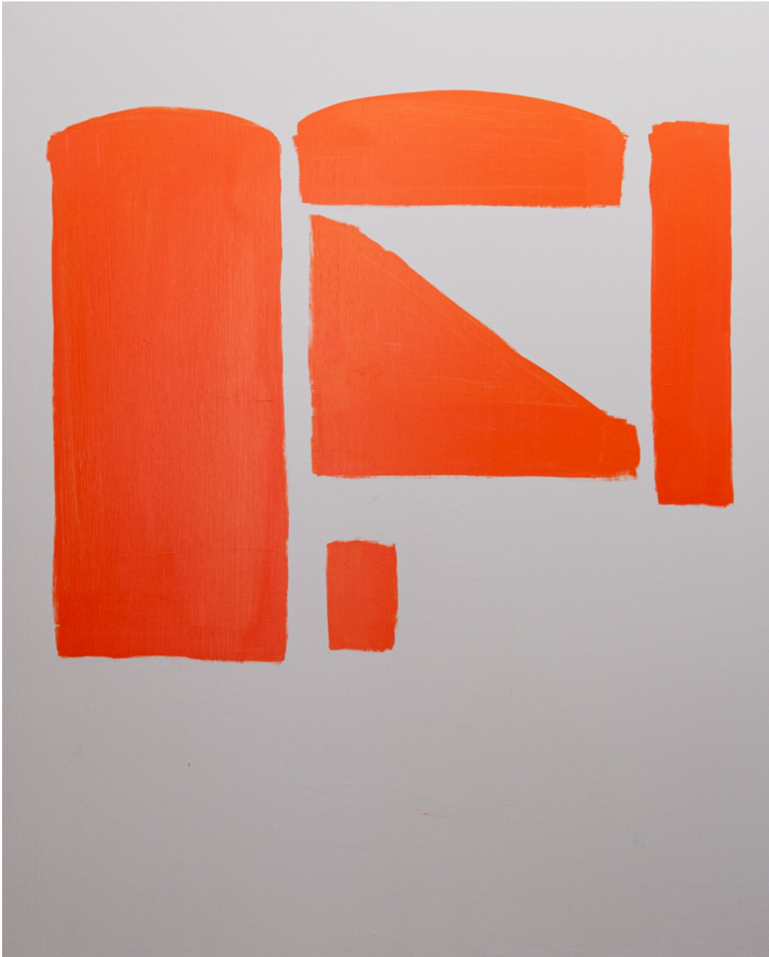
Satz , 2020 acrylic on wood 60.63 x 48.82 in ( 154,5 x 124,4 cm )