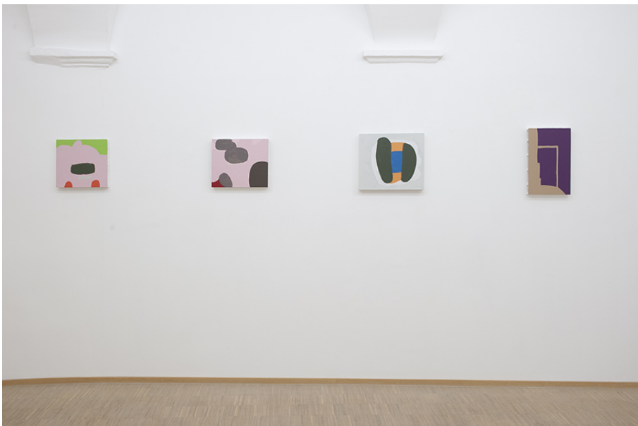
Zwischen Tor und Torschrei Exhibition View Nosbaum Reding, Luxembourg, 2020