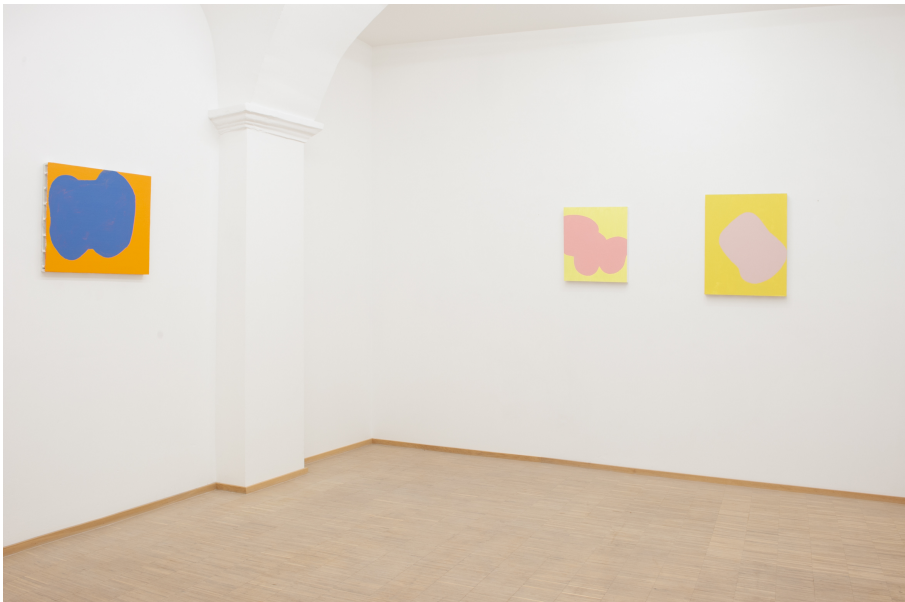
Zwischen Tor und Torschrei Exhibition View Nosbaum Reding, Luxembourg, 2020