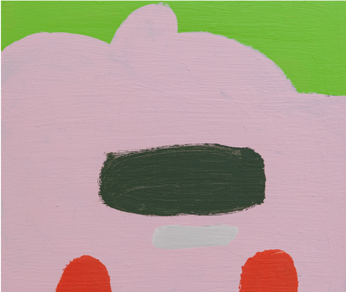
Bunker , 2020 acrylic on wood 12.2 x 14.17 in ( 31 x 36,4 cm )