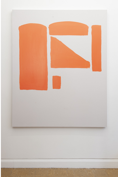
Zwischen Tor und Torschrei Exhibition View Nosbaum Reding, Luxembourg, 2020