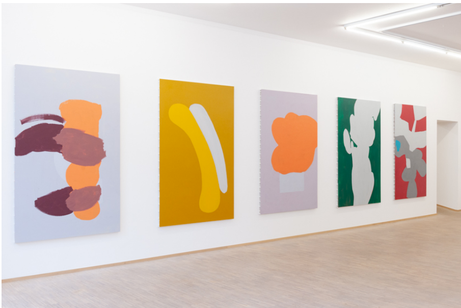
Zwischen Tor und Torschrei Exhibition View Nosbaum Reding, Luxembourg, 2020