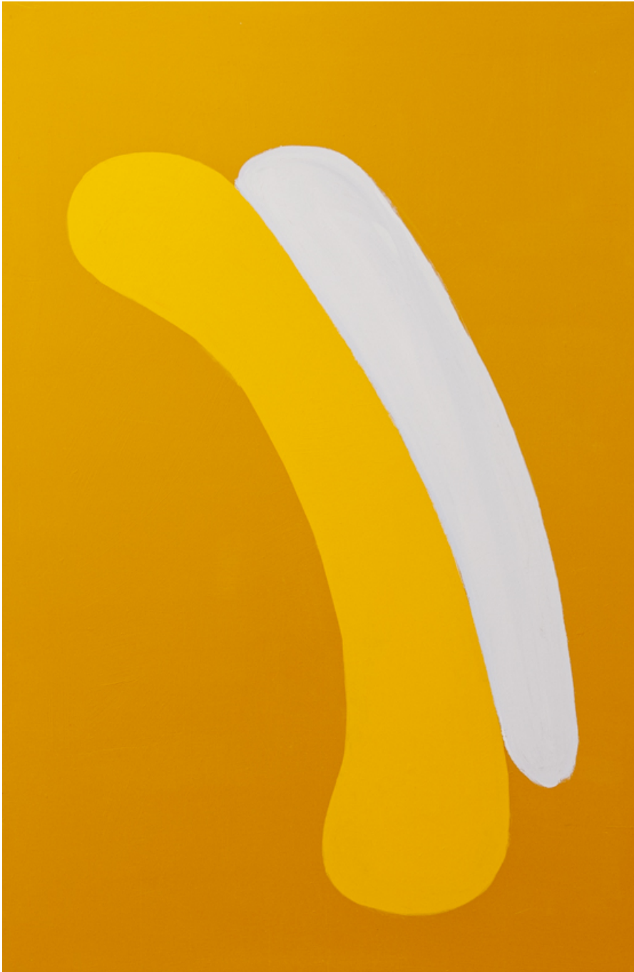
Nahgespräch , 2020 acrylic on wood 73.23 x 47.64 in ( 186,2 x 121,8 cm )