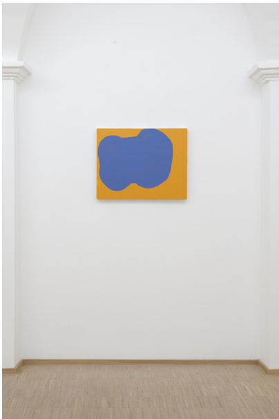
Zwischen Tor und Torschrei Exhibition View Nosbaum Reding, Luxembourg, 2020