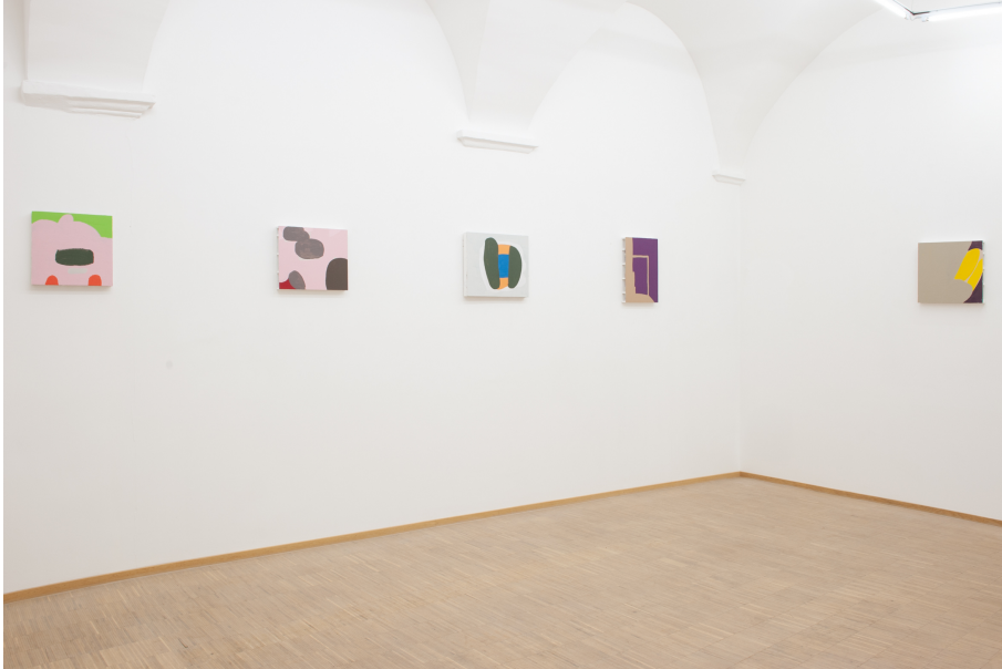
Zwischen Tor und Torschrei Exhibition View Nosbaum Reding, Luxembourg, 2020