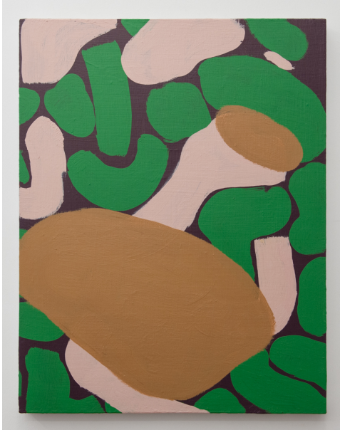
Zwischen Tor und Torschrei Exhibition View Nosbaum Reding, Luxembourg, 2020