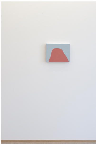
Zwischen Tor und Torschrei Exhibition View Nosbaum Reding, Luxembourg, 2020