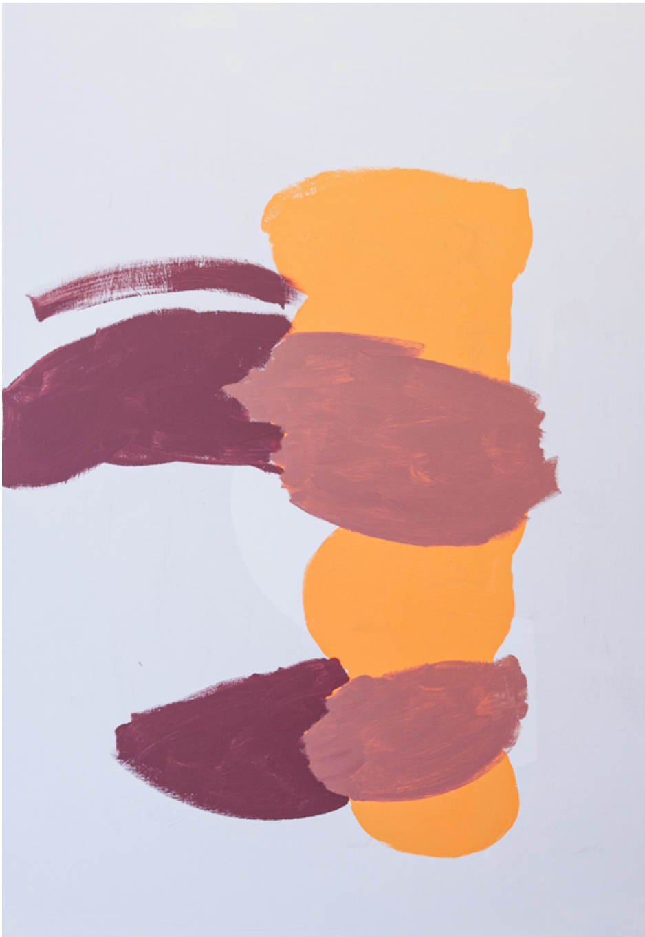
Figur ohne Schnee , 2020 acrylic on wood 73.23 x 50 in ( 186,6 x 127,5 cm )