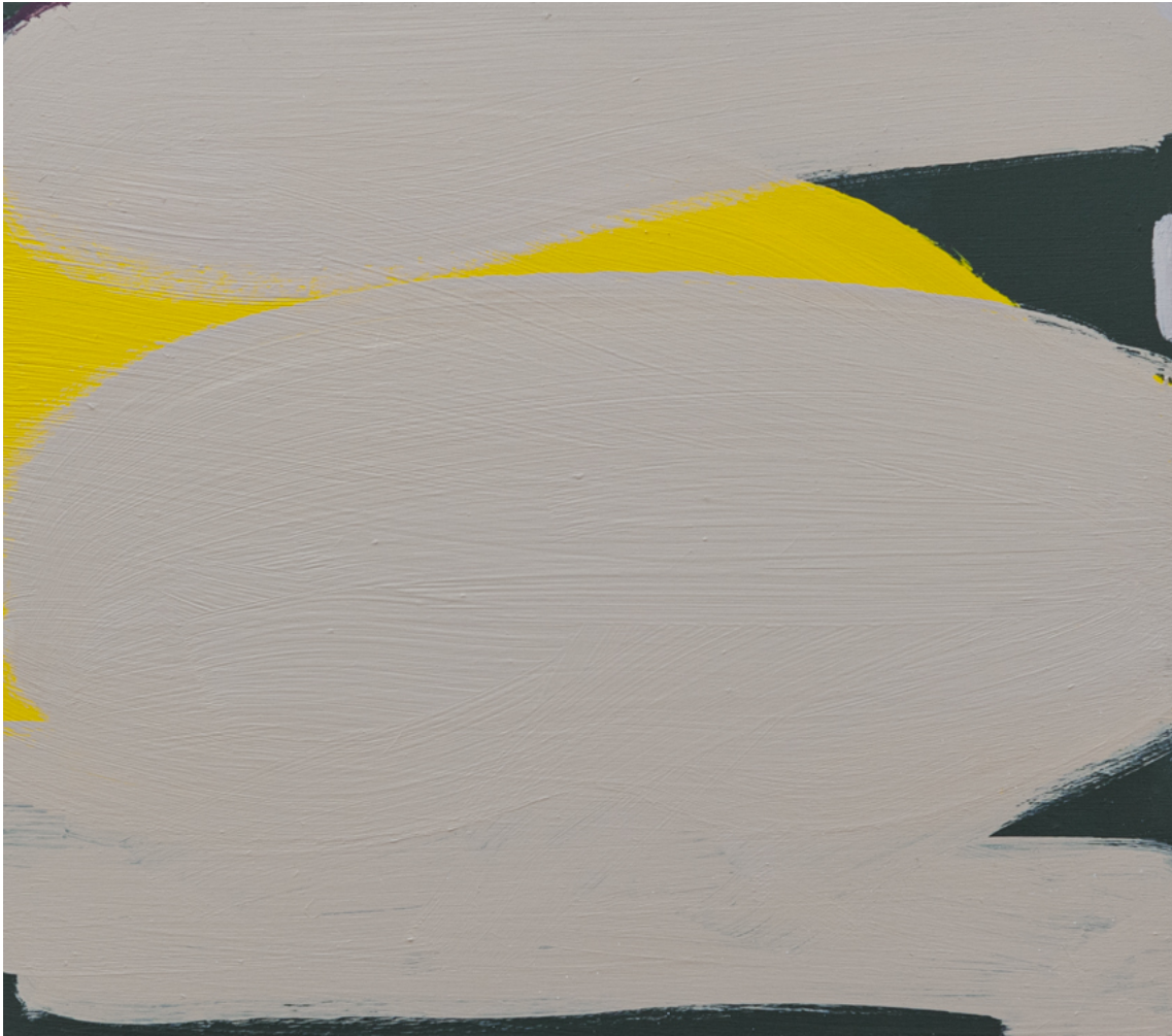
Randnotiz , 2020 acrylic on wood 14.17 x 15.75 in ( 36 x 40,8 cm )