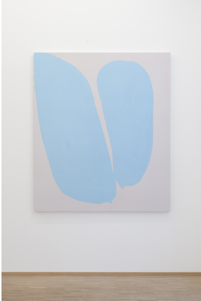
Zwischen Tor und Torschrei Exhibition View Nosbaum Reding, Luxembourg, 2020