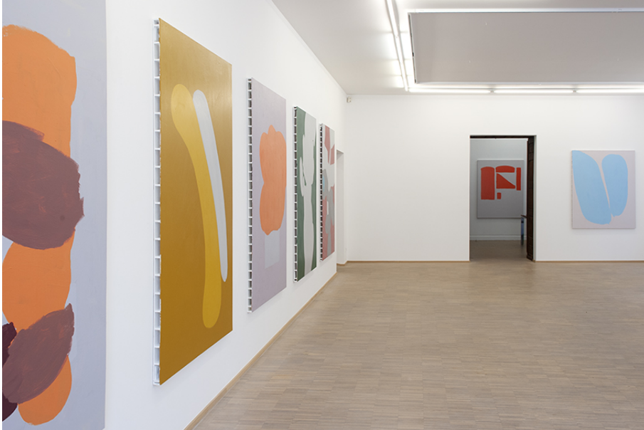
Zwischen Tor und Torschrei Exhibition View Nosbaum Reding, Luxembourg, 2020