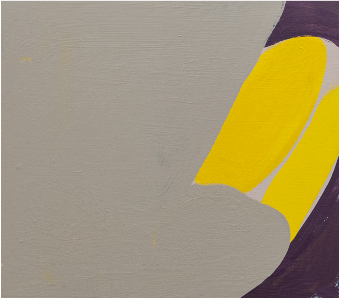
Lichtzunge , 2020 acrylic on wood 14.17 x 16.14 in ( 36,1 x 41,1 cm )