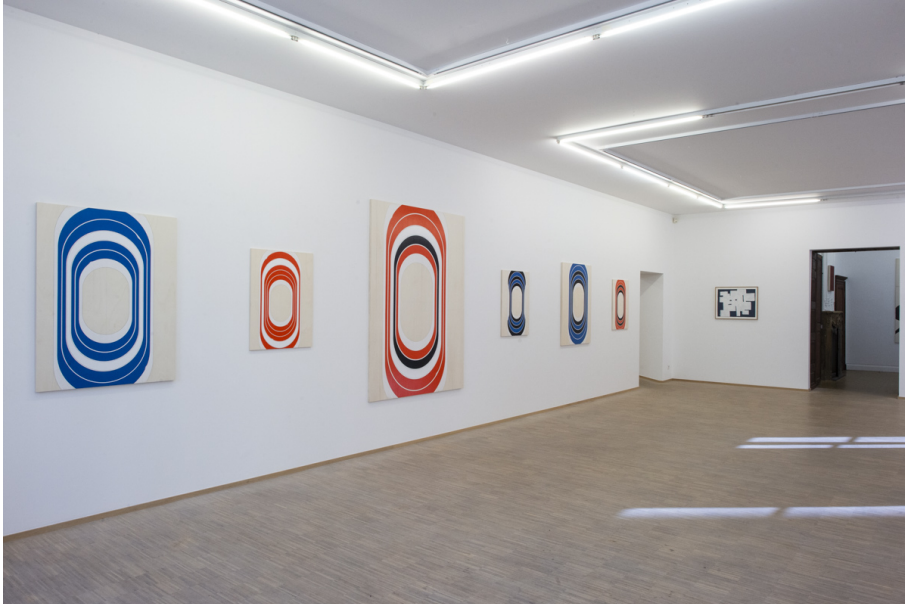
Abstraktion, Fläche und Überlappungen Exhibition View Nosbaum Reding, Luxembourg, 2020