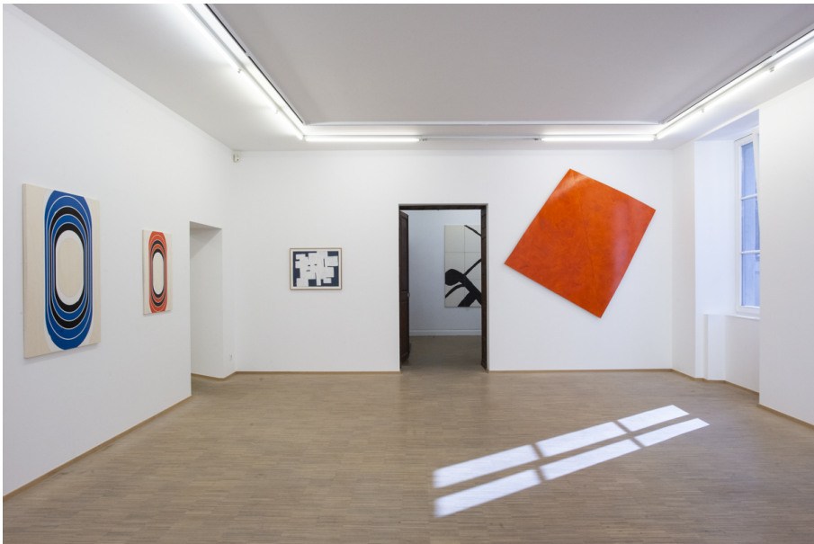
Abstraktion, Fläche und Überlappungen Exhibition View Nosbaum Reding, Luxembourg, 2020