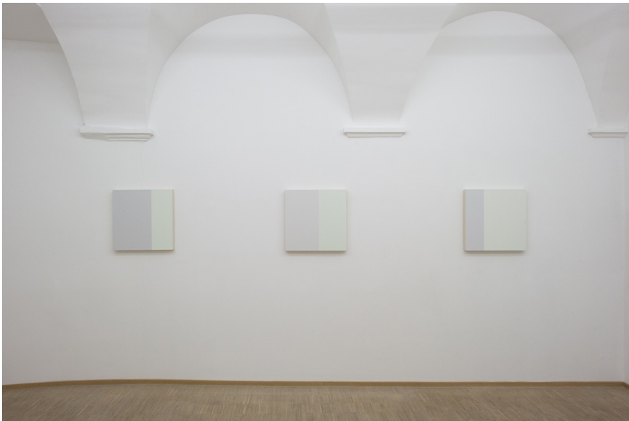
Abstraktion, Fläche und Überlappungen Exhibition View Nosbaum Reding, Luxembourg, 2020