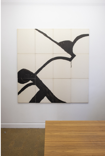
Abstraktion, Fläche und Überlappungen Exhibition View Nosbaum Reding, Luxembourg, 2020