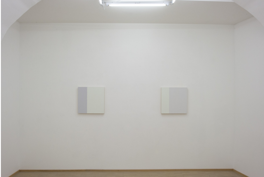
Abstraktion, Fläche und Überlappungen Exhibition View Nosbaum Reding, Luxembourg, 2020