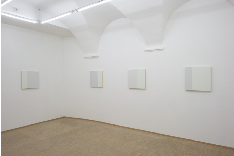
Abstraktion, Fläche und Überlappungen Exhibition View Nosbaum Reding, Luxembourg, 2020