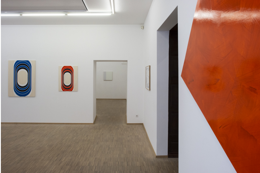
Abstraktion, Fläche und Überlappungen Exhibition View Nosbaum Reding, Luxembourg, 2020