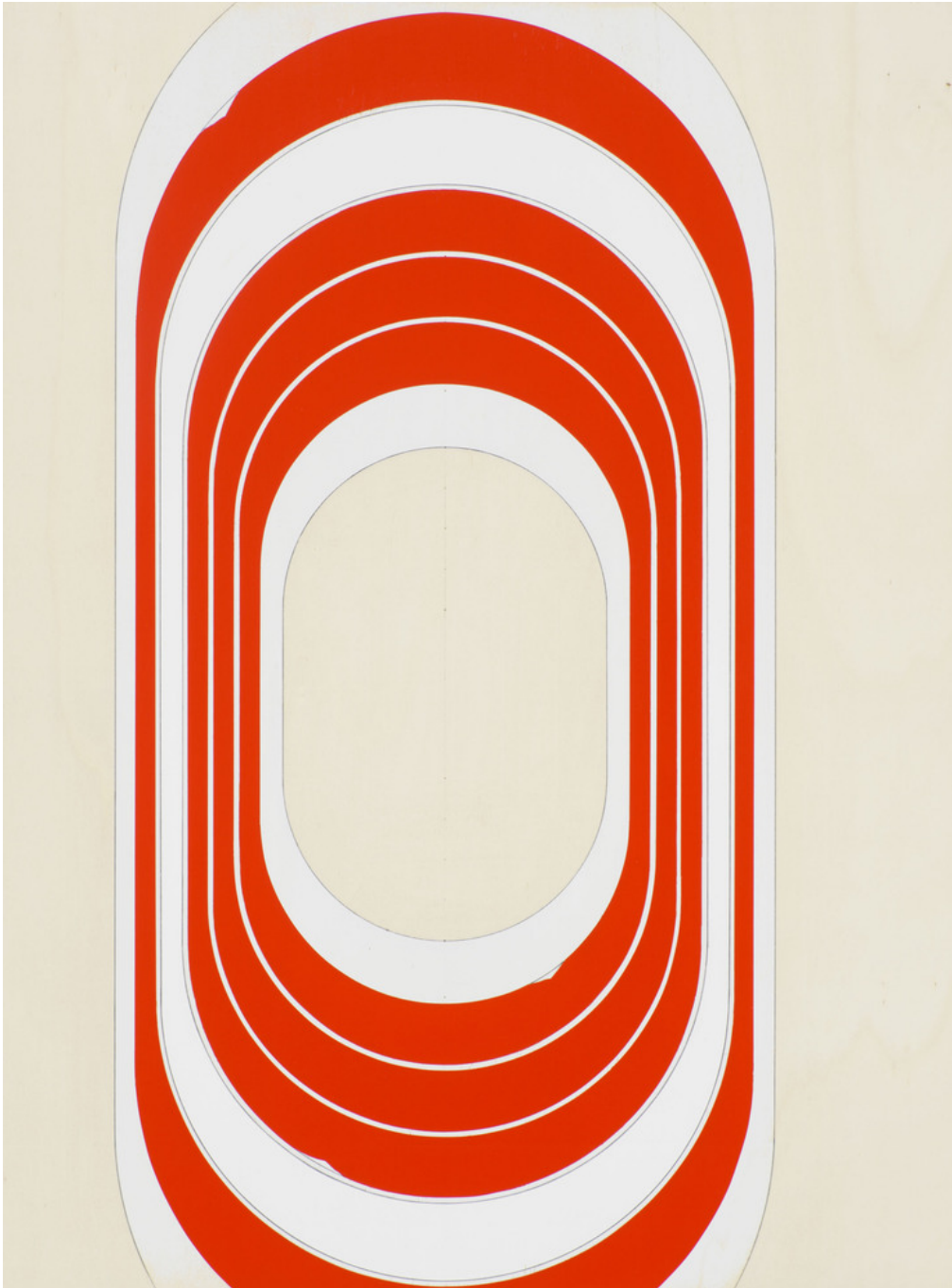
Untitled (20.23) , 2020 Acrylic on plywood 31.5 x 23.62 in ( 80 x 60 cm )