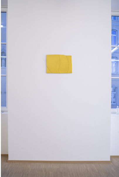
Abstraktion, Fläche und Überlappungen Exhibition View Nosbaum Reding, Luxembourg, 2020