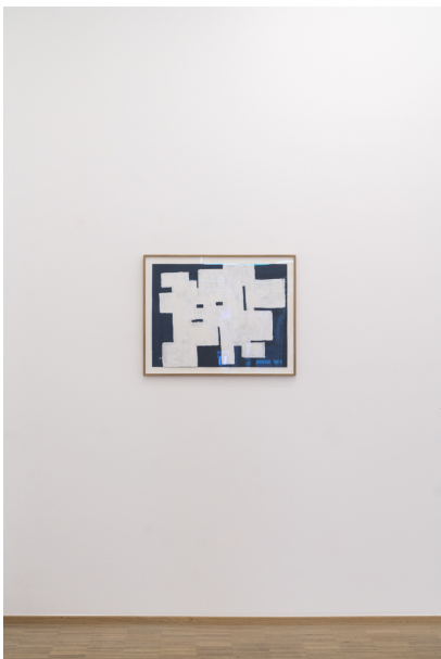
Abstraktion, Fläche und Überlappungen Exhibition View Nosbaum Reding, Luxembourg, 2020