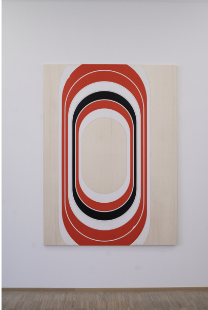
Abstraktion, Fläche und Überlappungen Exhibition View Nosbaum Reding, Luxembourg, 2020