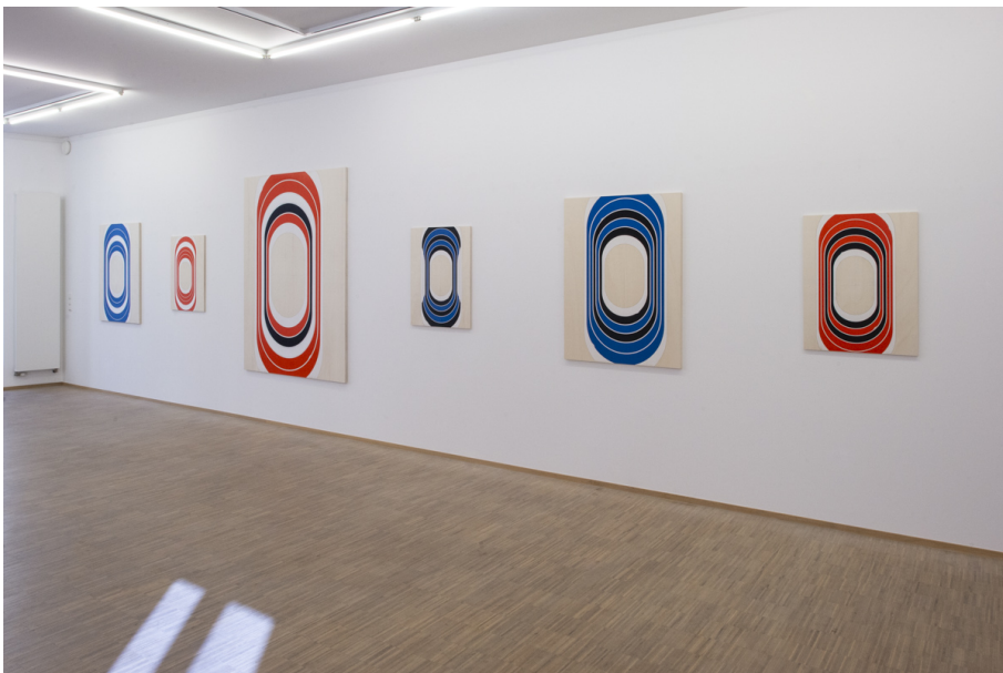
Abstraktion, Fläche und Überlappungen Exhibition View Nosbaum Reding, Luxembourg, 2020