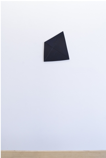
Abstraktion, Fläche und Überlappungen Exhibition View Nosbaum Reding, Luxembourg, 2020