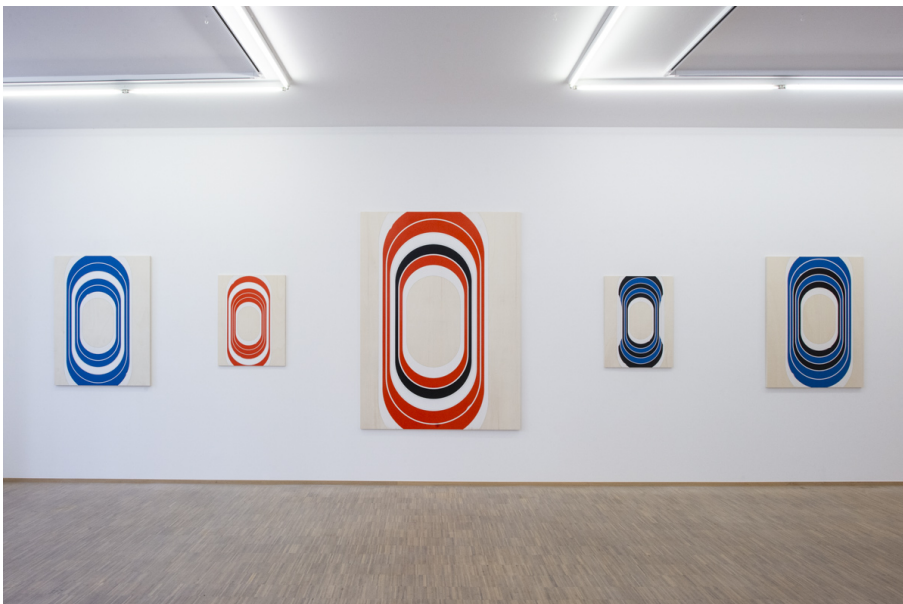
Abstraktion, Fläche und Überlappungen Exhibition View Nosbaum Reding, Luxembourg, 2020