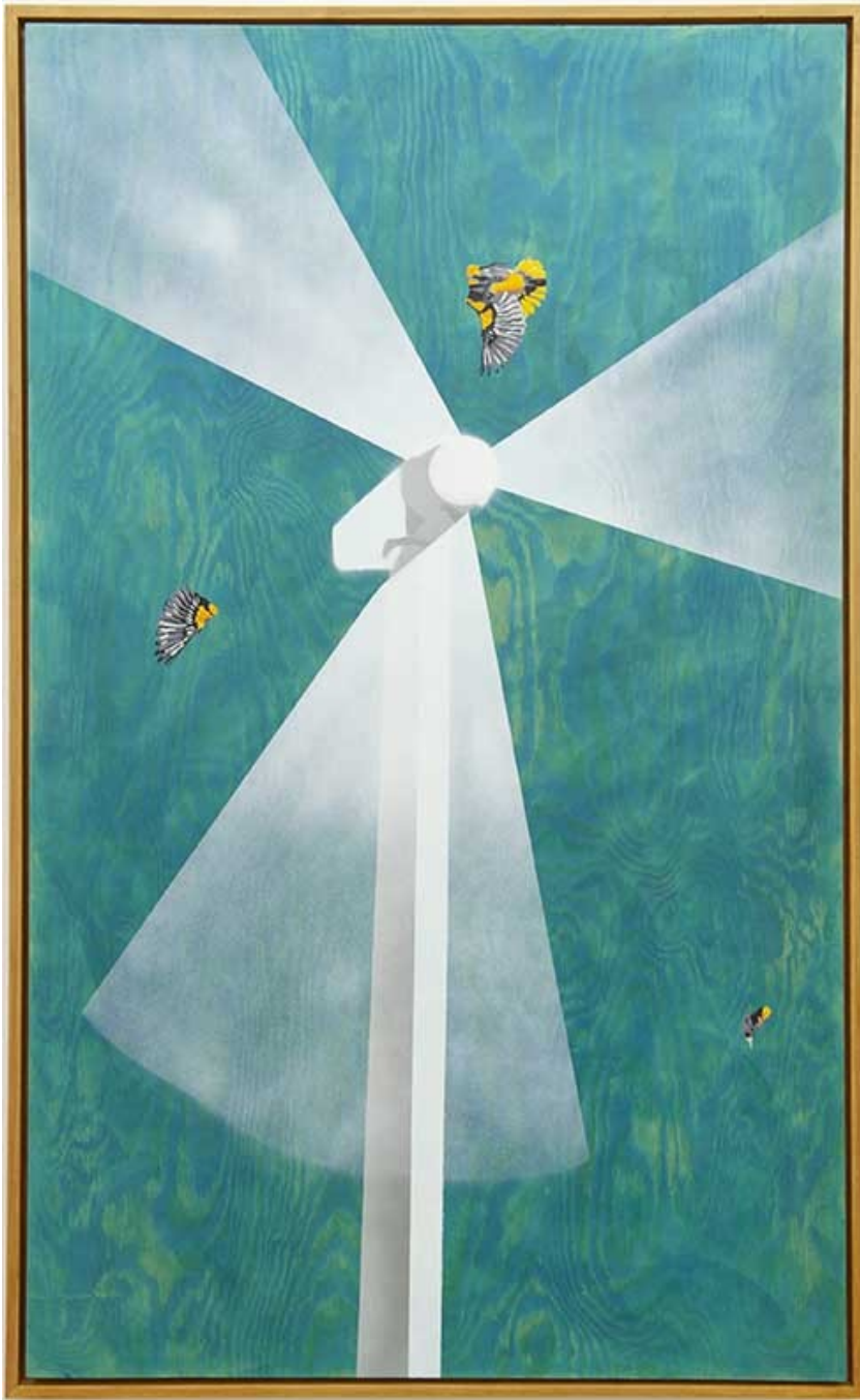
Damage collatéral , 2019 Oil, acrylic and ink on wood 58.66 x 35.04 in ( 149 x 89 cm )

Je ne peindrai plus de fleurs vu que l'homme a mangé la Terre