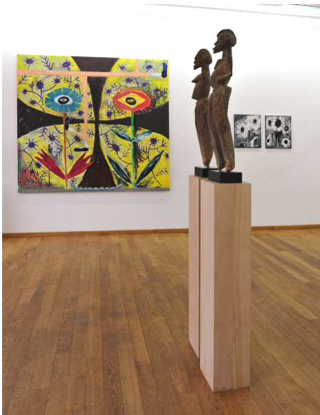
Perverse Sublime of the Toxic Exhibition View Nosbaum Reding, Luxembourg, 2013