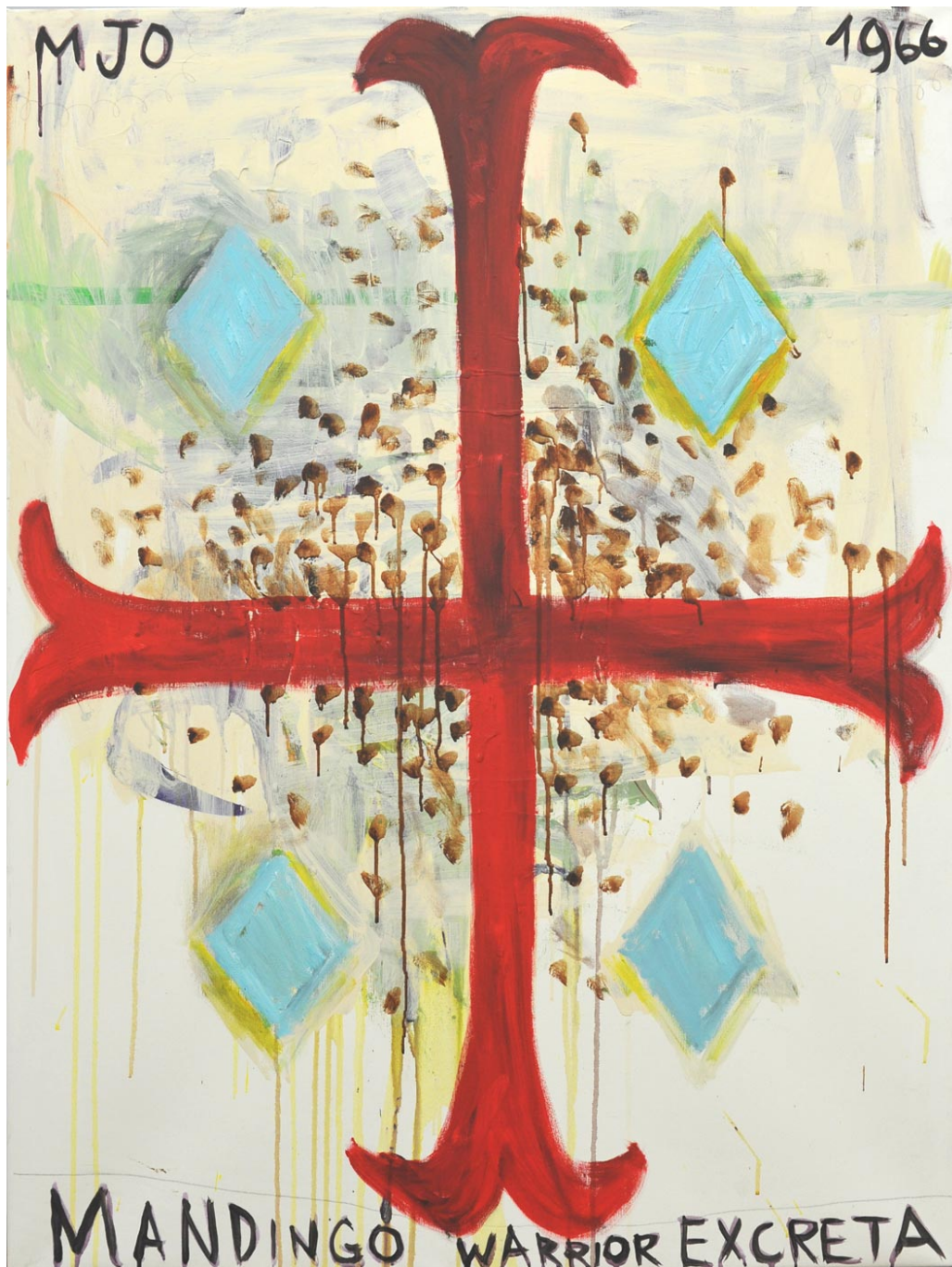
Mandingo Warrior Excreta MJO, 2013 oil on canvas 119 x 90 cm