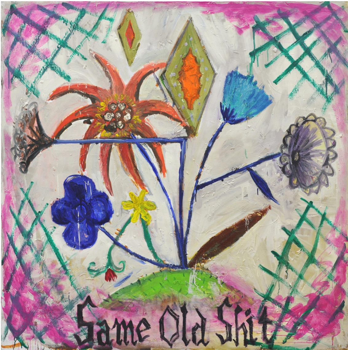
Flowers with « Same Old Shit » written on top, 2013 oil on canvas 127 x 126,5 cm