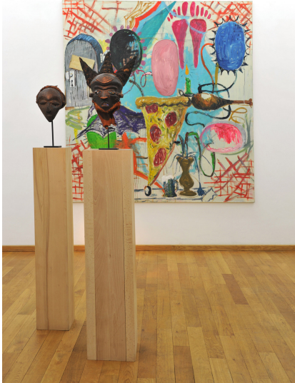
Perverse Sublime of the Toxic Exhibition View Nosbaum Reding, Luxembourg, 2013