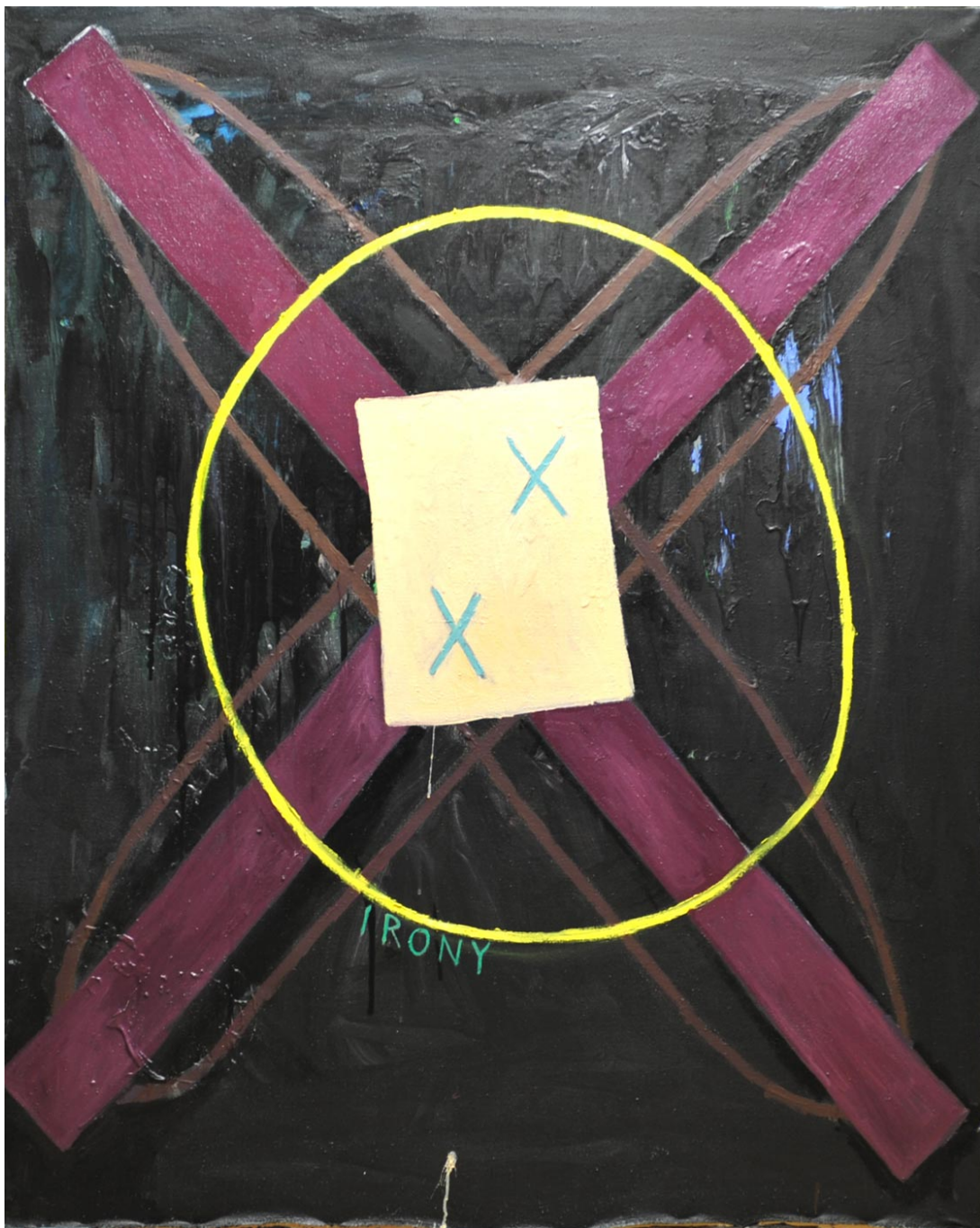
Irony, Irony , 2013 oil on canvas 160 x 1130 cm