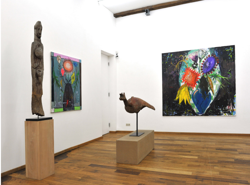
Perverse Sublime of the Toxic Exhibition View Nosbaum Reding, Luxembourg, 2013