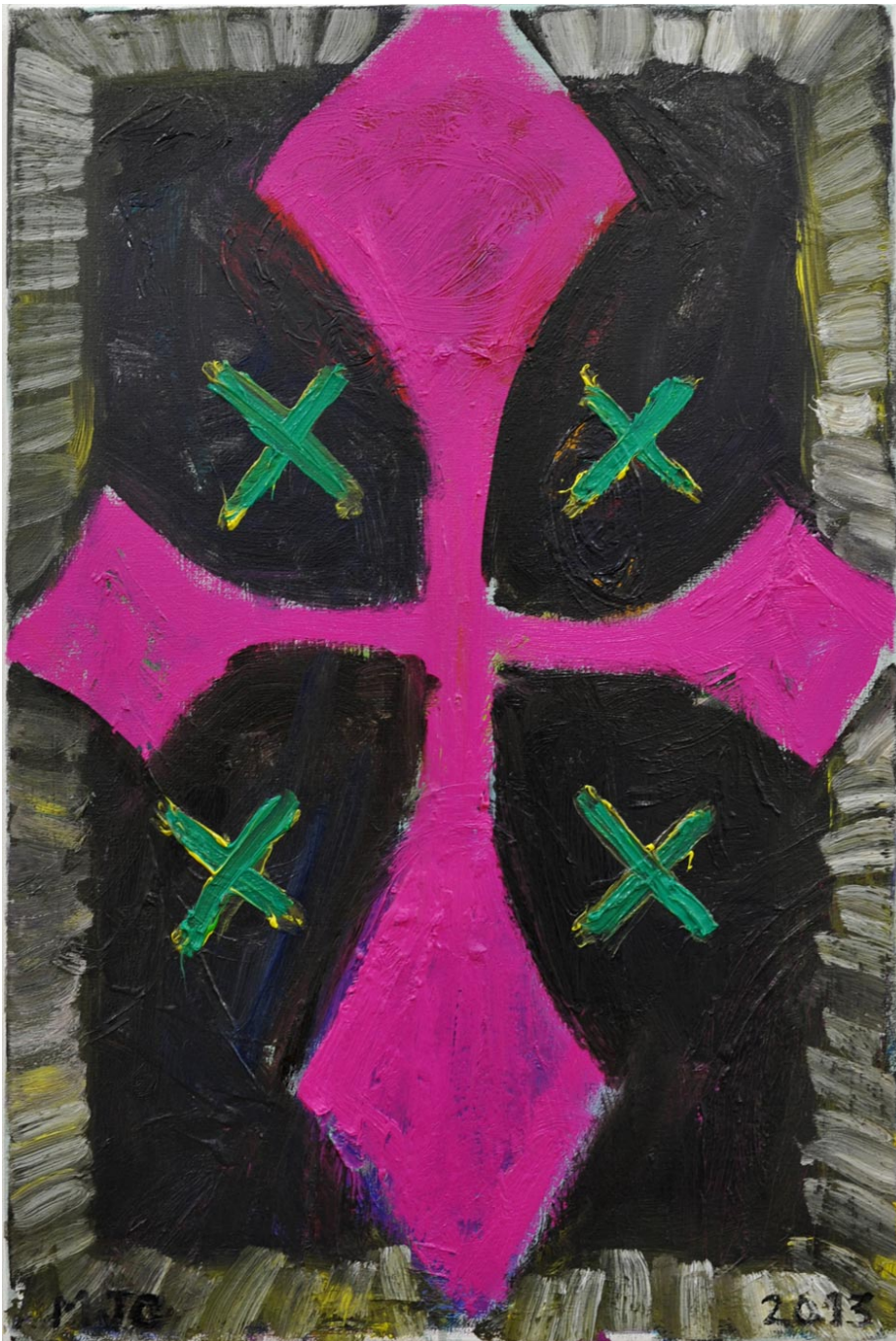
Pink Cross with 4 Green X's , 2013 oil on canvas 60 x 40 cm