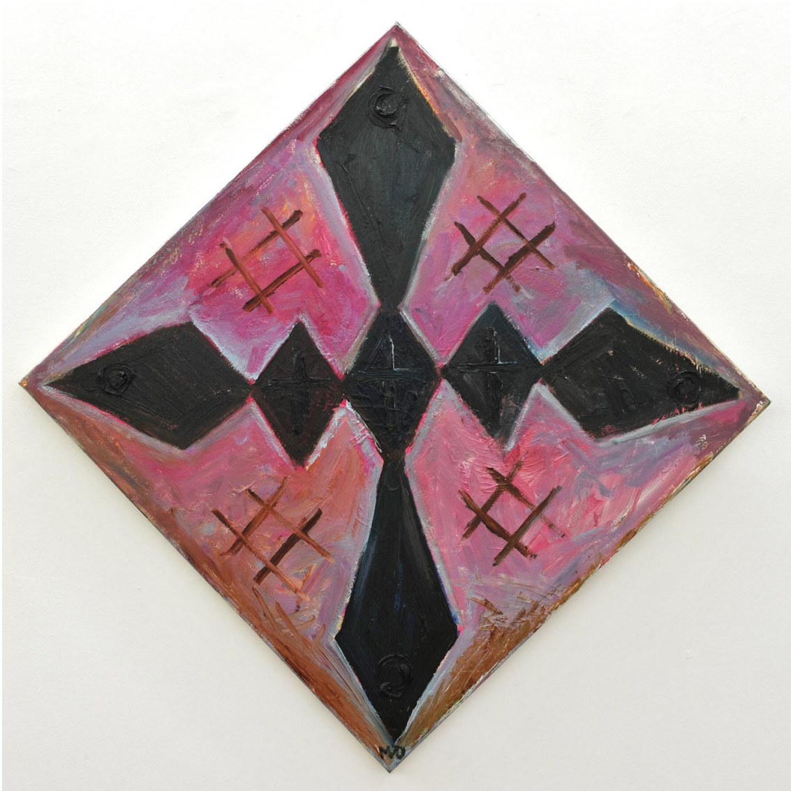
Brown Cross with 4 Cross-Hatch , 2013 oil on canvas 73 x 73 cm