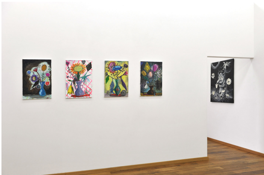
Perverse Sublime of the Toxic Exhibition View Nosbaum Reding, Luxembourg, 2013