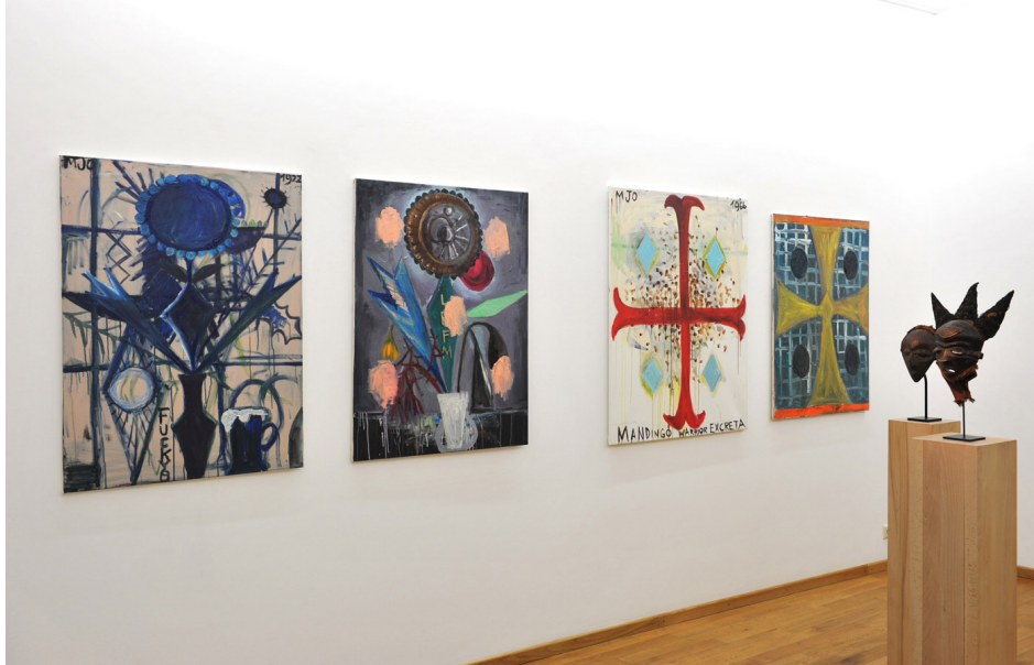
Perverse Sublime of the Toxic Exhibition View Nosbaum Reding, Luxembourg, 2013