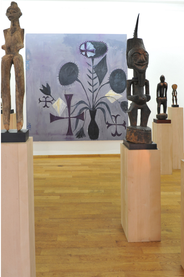
Perverse Sublime of the Toxic Exhibition View Nosbaum Reding, Luxembourg, 2013