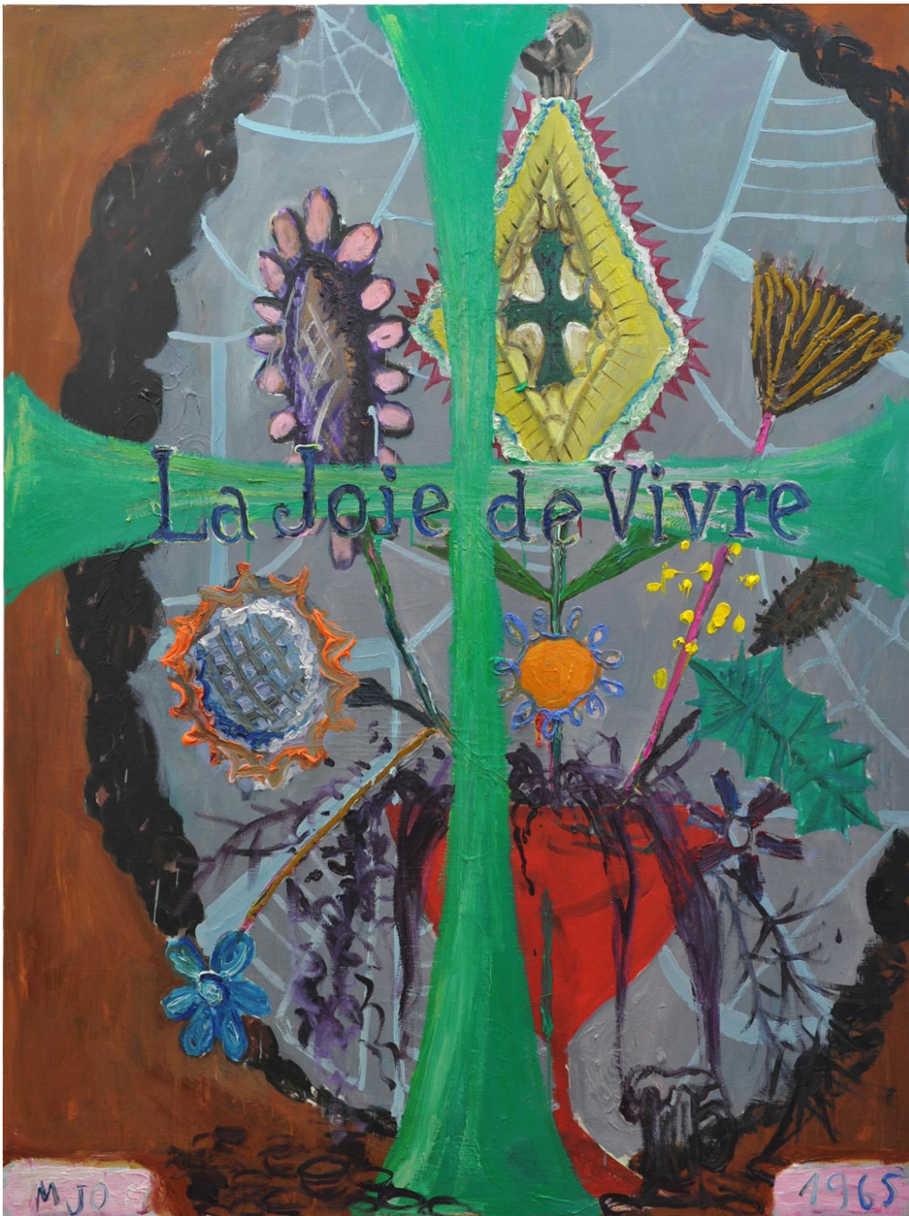
La Joie de Vivre MJO 1965 (MILF), 2013 oil on canvas 160 x 120 cm