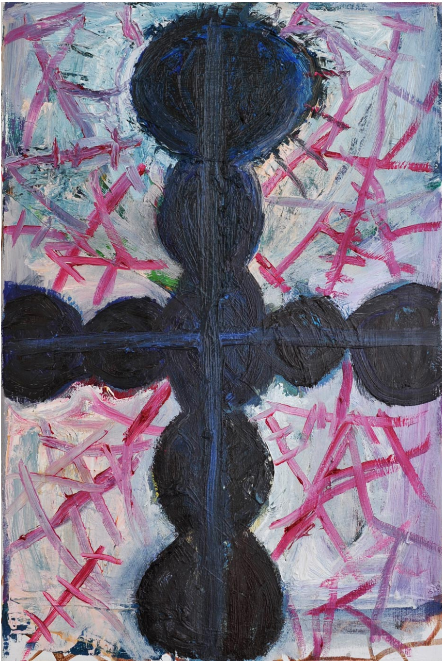
Cross with Wounds , 2013 oil on canvas 60 x 40 cm