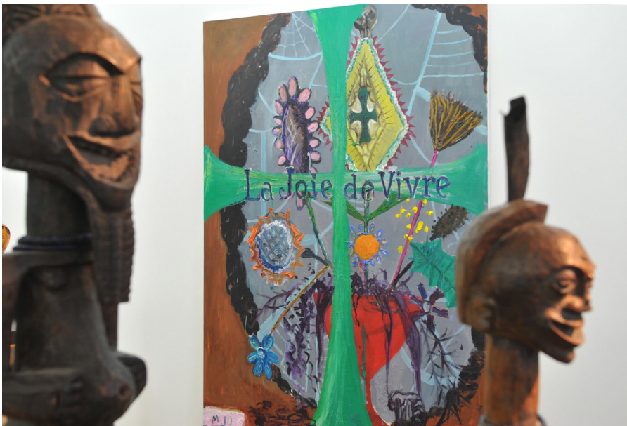
Perverse Sublime of the Toxic Exhibition View Nosbaum Reding, Luxembourg, 2013