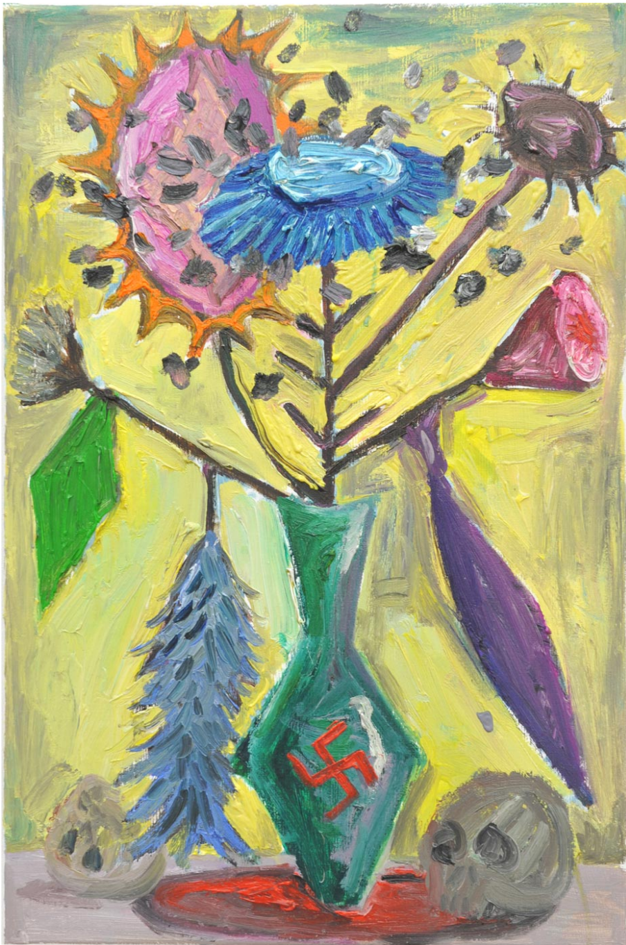
From the Series : Notes from the Contern asylum #3, 2013 oil on canvas 60 x 40 cm