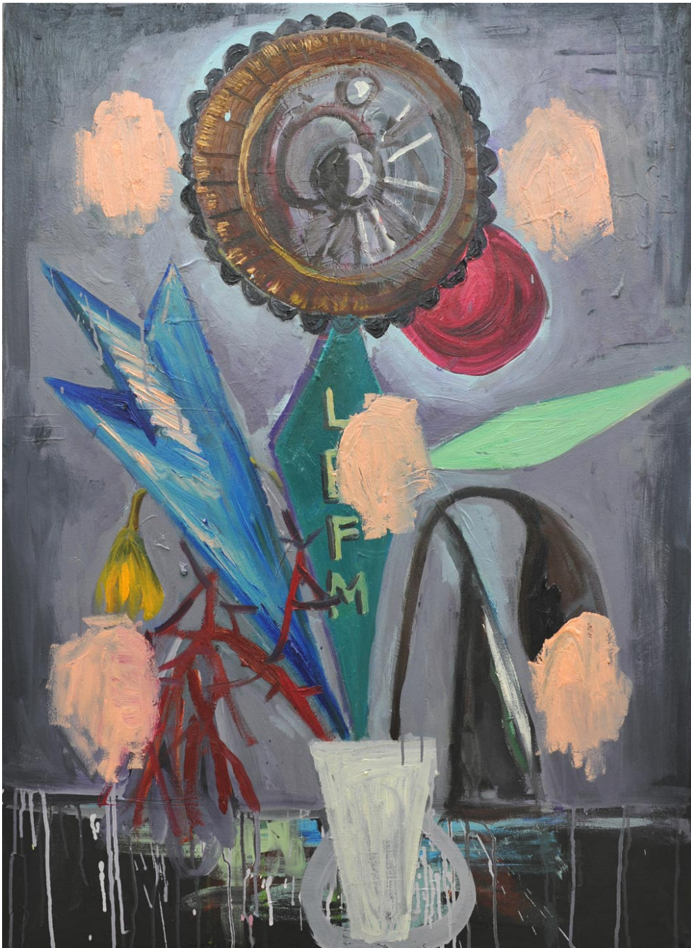
LBFM (Little Brown Fucking Machine), 2013 oil on canvas 109 x 80 cm