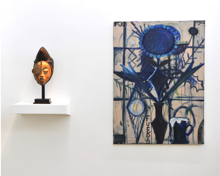
Perverse Sublime of the Toxic Exhibition View Nosbaum Reding, Luxembourg, 2013