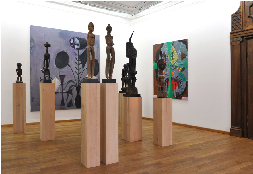
Perverse Sublime of the Toxic Exhibition View Nosbaum Reding, Luxembourg, 2013