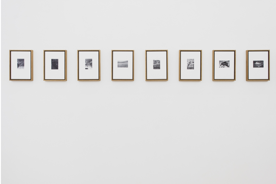
Oversees Exhibition View Nosbaum Reding, Luxembourg, 2021