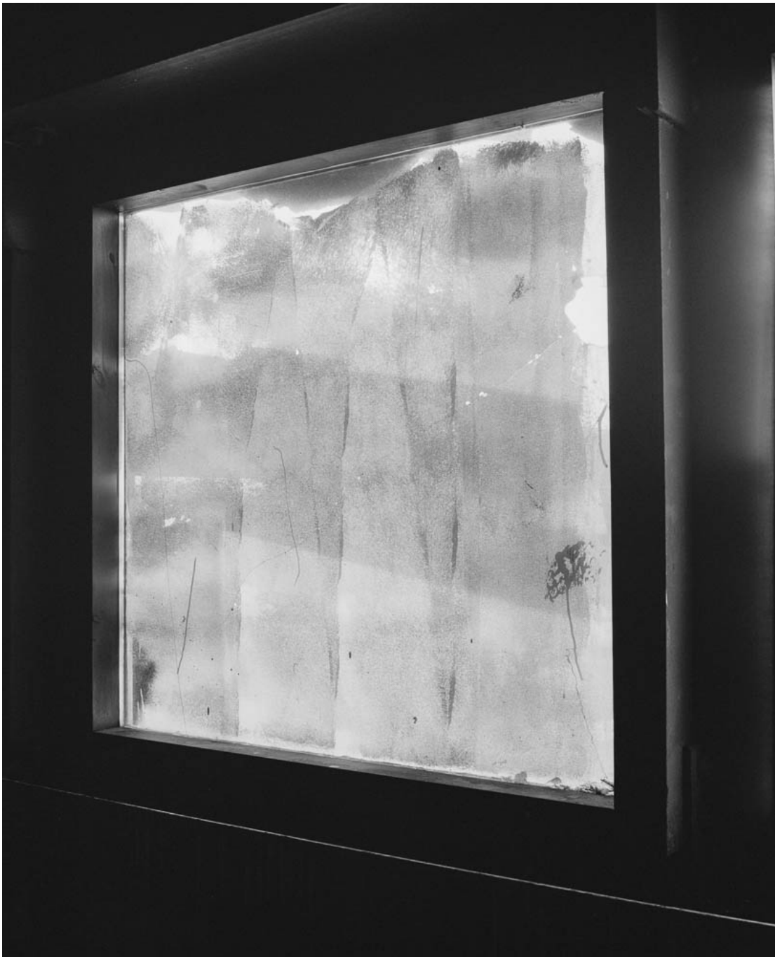
Untitled (#23 from History of the Visit) , 2013 Archival inkjet print Image : 31.5 x 25.59 in ( 80 x 65 cm ) Edition of 5 ex + 1 EA