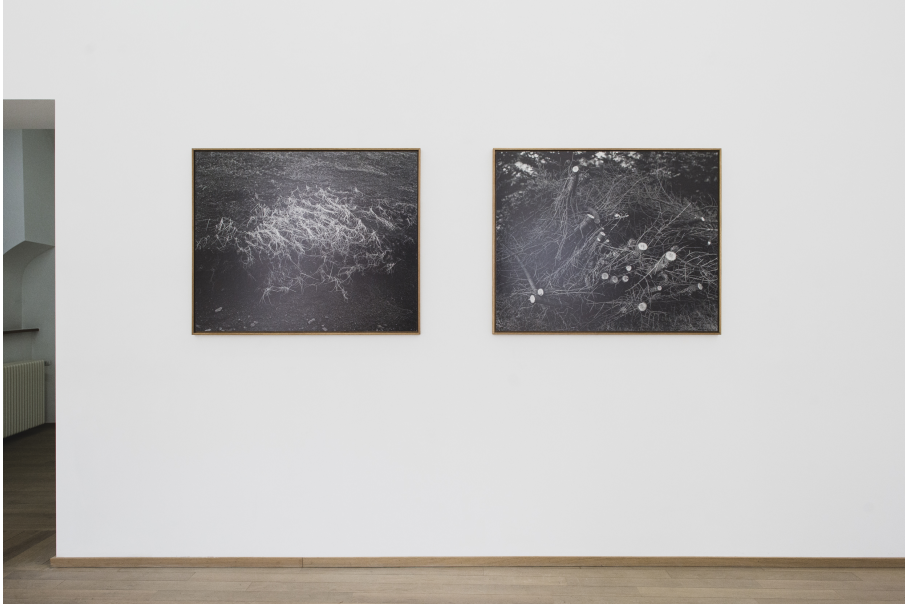
Oversees Exhibition View Nosbaum Reding, Luxembourg, 2021