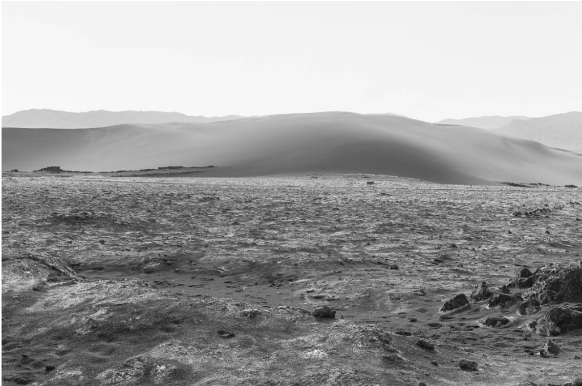
No Pasar , 2016 Archival inkjet print Image : 28.74 x 43.31 in ( 73 x 110 cm ) Edition of 5 ex + 1 EA