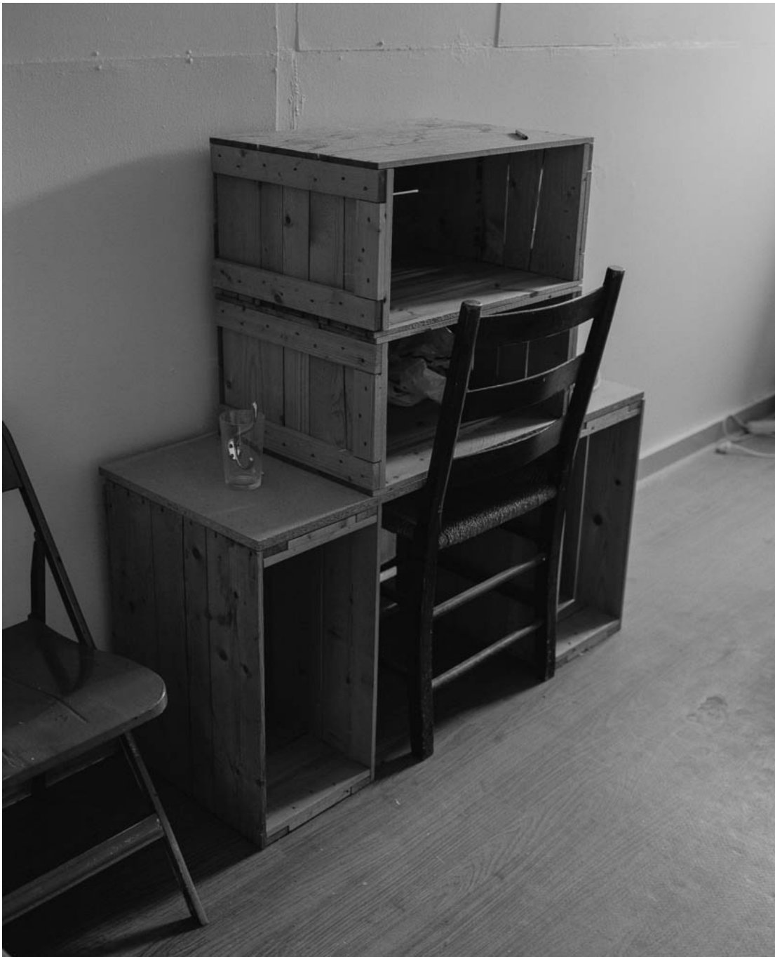
Untitled (#17 from History of the Visit) , 2013 Archival inkjet print Image : 31.5 x 25.59 in ( 80 x 65 cm ) Edition of 5 ex + 1 EA