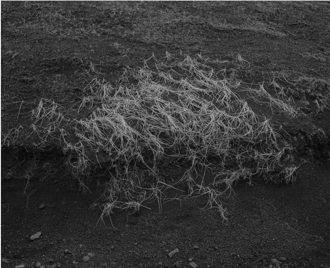
Untitled (#33 from History of the Visit), 2013 Archival inkjet print Image : 31.5 x 39.37 in ( 80 x 100 cm ) Edition of 5 ex + 1 EA