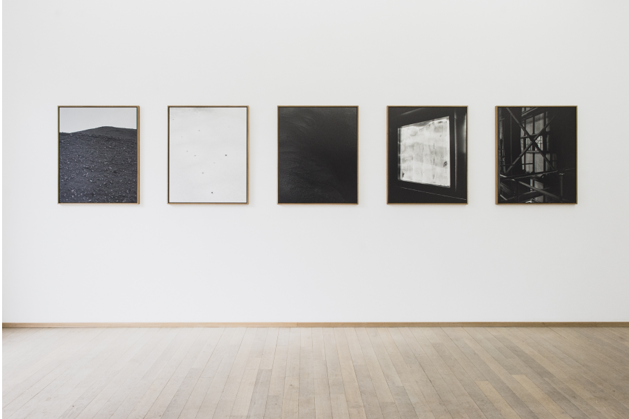
Oversees Exhibition View Nosbaum Reding, Luxembourg, 2021