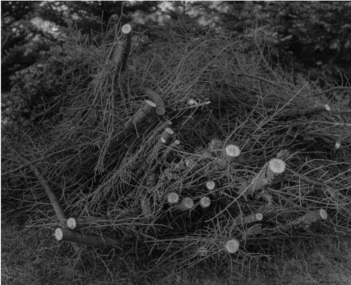
Untitled (#29 from History of the Visit), 2013 Archival inkjet print Image : 31.5 x 39.37 in ( 80 x 100 cm ) Edition of 5 ex + 1 EA