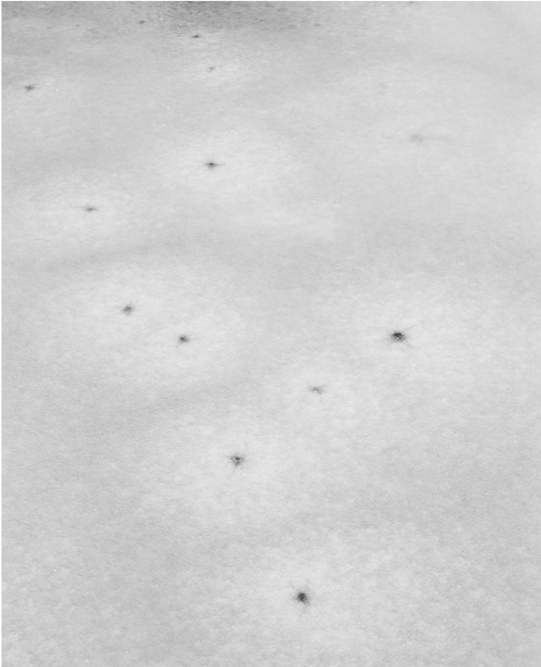
Untitled (#5 from History of the Visit), 2013 Archival inkjet print Image : 31.5 x 25.59 in ( 80 x 65 cm ) Edition of 5 ex + 1 EA