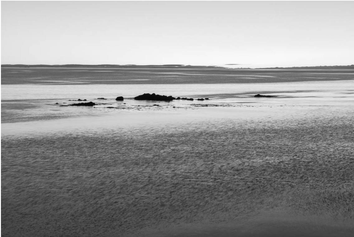
#1004531 (from Beachhead ), 2017 Archival inkjet print Image : 22.83 x 33.86 in ( 58 x 86,7 cm ) Edition of 5 ex + 1 EA