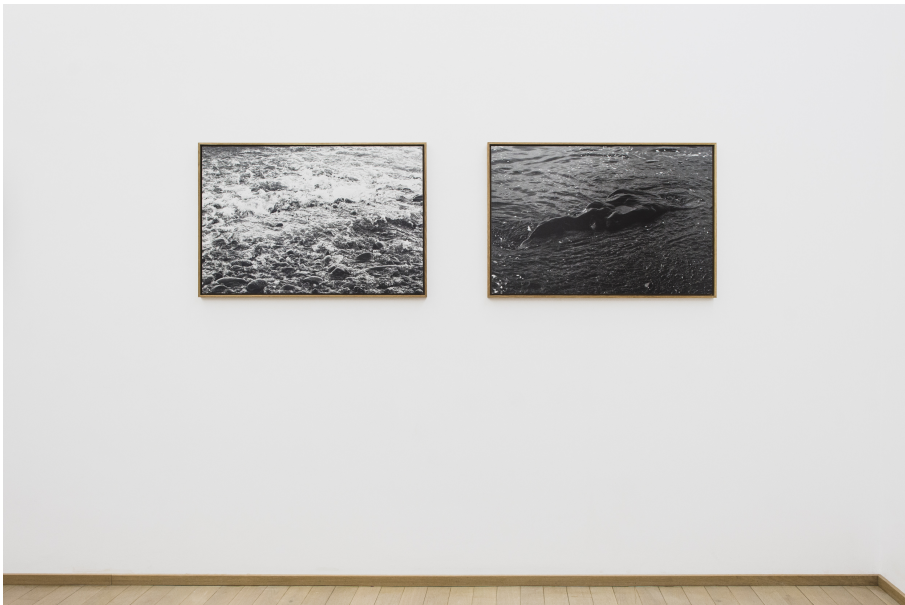
Oversees Exhibition View Nosbaum Reding, Luxembourg, 2021