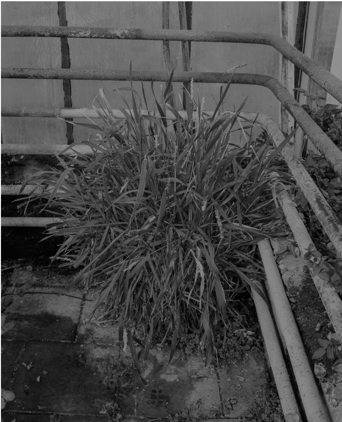
Untitled (#31 from History of the Visit) , 2013 Archival inkjet print Image : 31.5 x 25.59 in ( 80 x 65 cm ) Edition of 5 ex + 1 EA