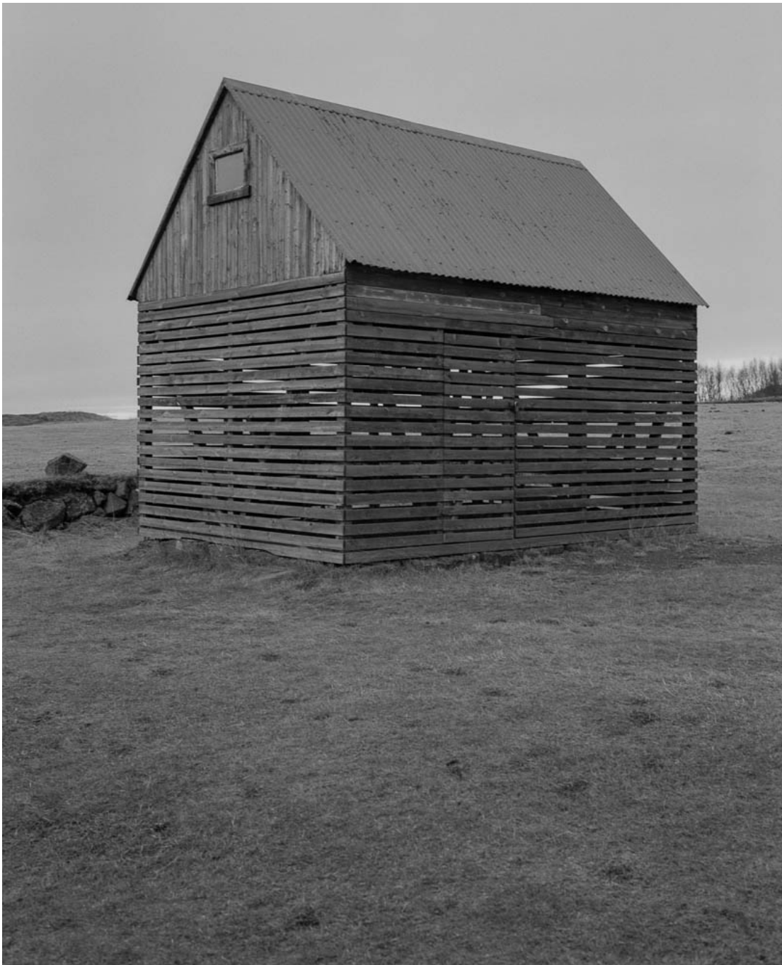
Untitled (#30 from History of the Visit) , 2013 Archival inkjet print Image : 31.5 x 25.59 in ( 80 x 65 cm ) Edition of 5 ex + 1 EA