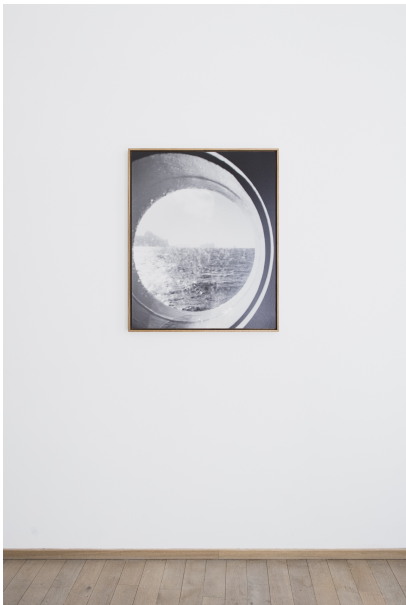
Oversees Exhibition View Nosbaum Reding, Luxembourg, 2021