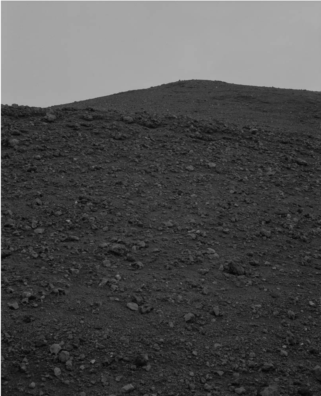
Untitled (#3 from History of the Visit) , 2013 Archival inkjet print Image : 31.5 x 25.59 in ( 80 x 65 cm ) Edition of 5 ex + 1 EA