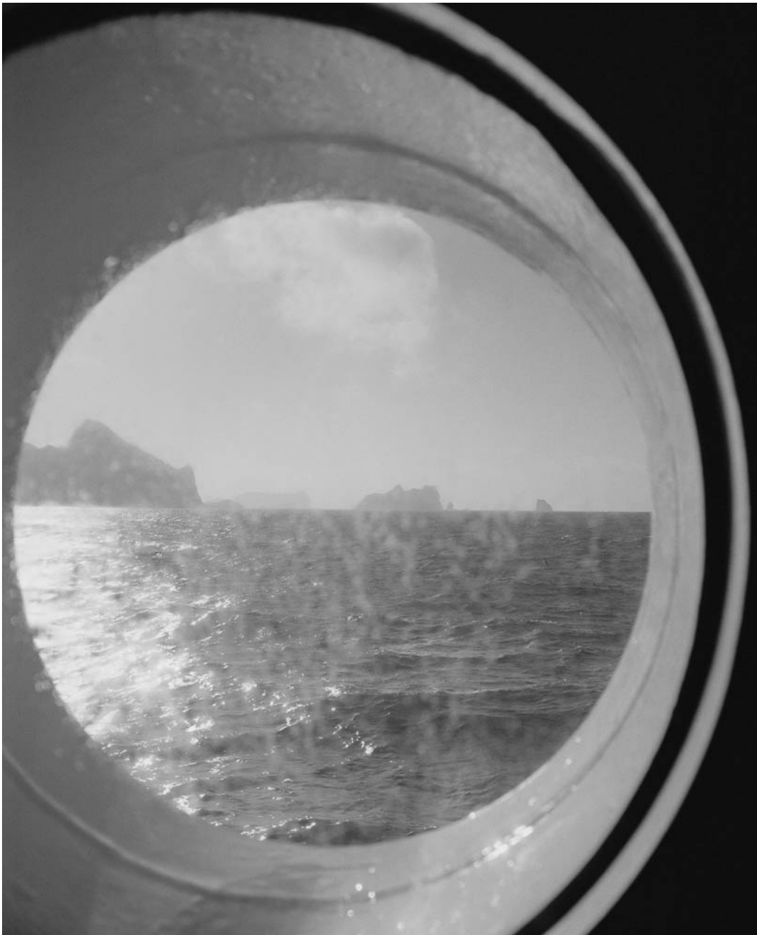
Untitled (#36 from History of the Visit) , 2013 Archival inkjet print Image : 31.5 x 25.59 in ( 80 x 65 cm ) Edition of 5 ex + 1 EA