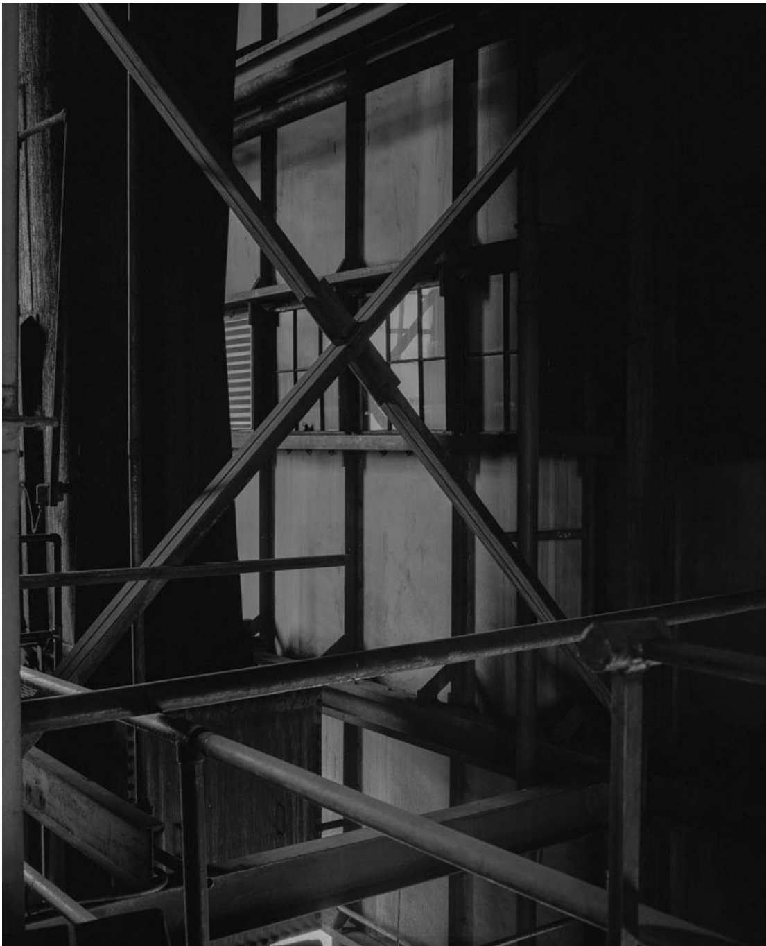
Untitled (#21) , 2013 from the series "History of the Visit" Archival inkjet print Image : 31.5 x 25.59 in ( 80 x 65 cm ) Edition of 5 ex + 1 EA