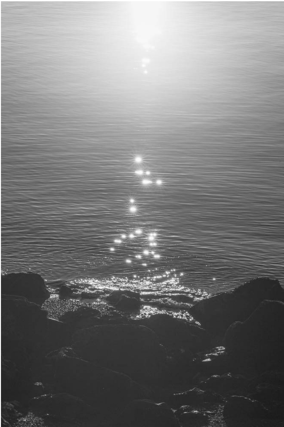
#1004451 (from Beachhead ), 2017 Archival inkjet print Image : 4.33 x 2.76 in ( 11 x 7,3 cm ) Edition of 5 ex + 1 EA