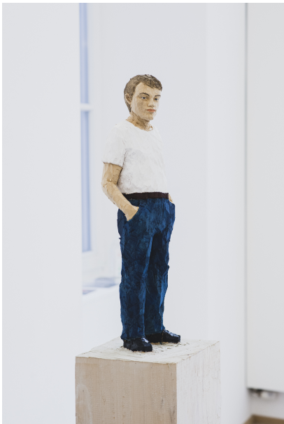
Exhibition View Nosbaum Reding, Luxembourg, 2021