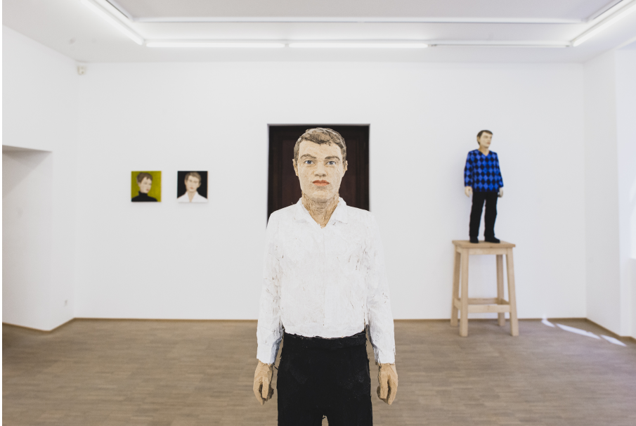
Exhibition View Nosbaum Reding, Luxembourg, 2021