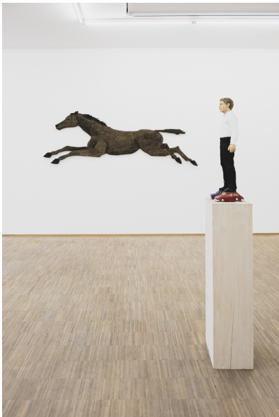
Exhibition View Nosbaum Reding, Luxembourg, 2021