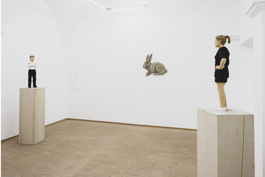
Exhibition View Nosbaum Reding, Luxembourg, 2021