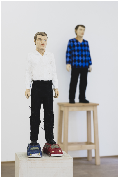
Exhibition View Nosbaum Reding, Luxembourg, 2021