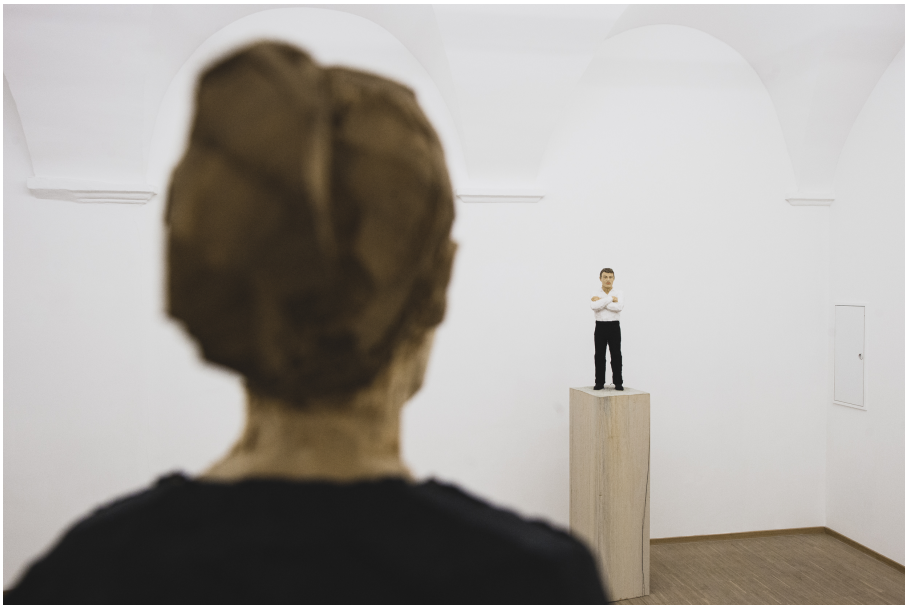
Exhibition View Nosbaum Reding, Luxembourg, 2021