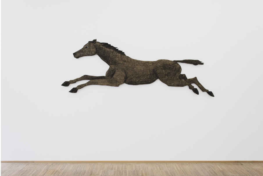
Exhibition View Nosbaum Reding, Luxembourg, 2021