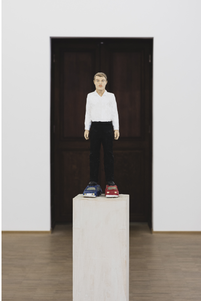
Exhibition View Nosbaum Reding, Luxembourg, 2021