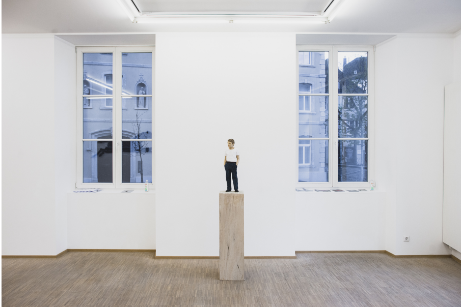
Exhibition View Nosbaum Reding, Luxembourg, 2021