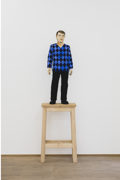
Exhibition View Nosbaum Reding, Luxembourg, 2021