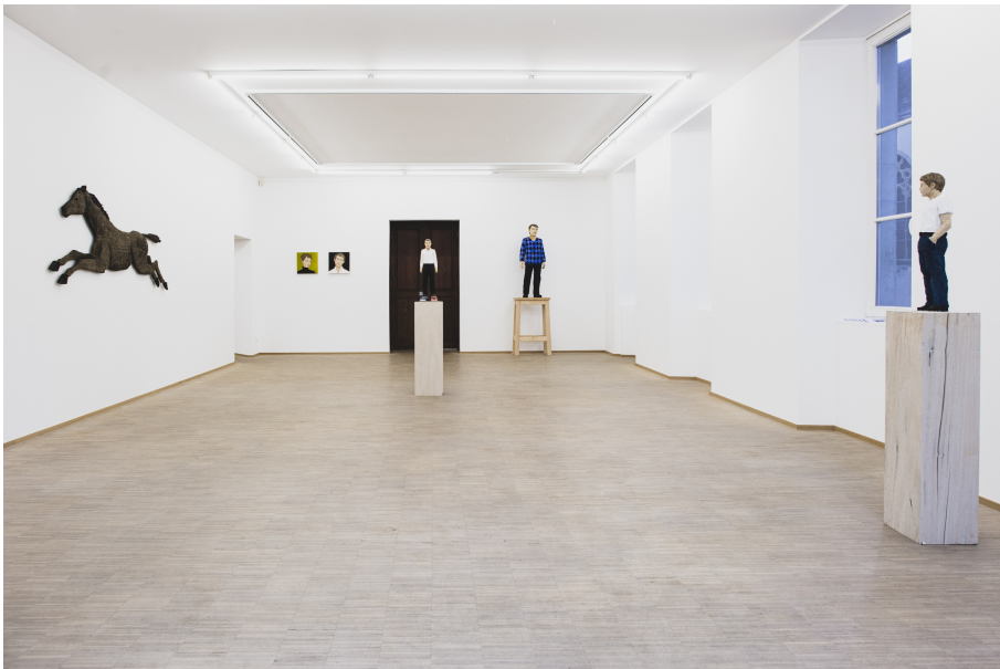
Exhibition View Nosbaum Reding, Luxembourg, 2021