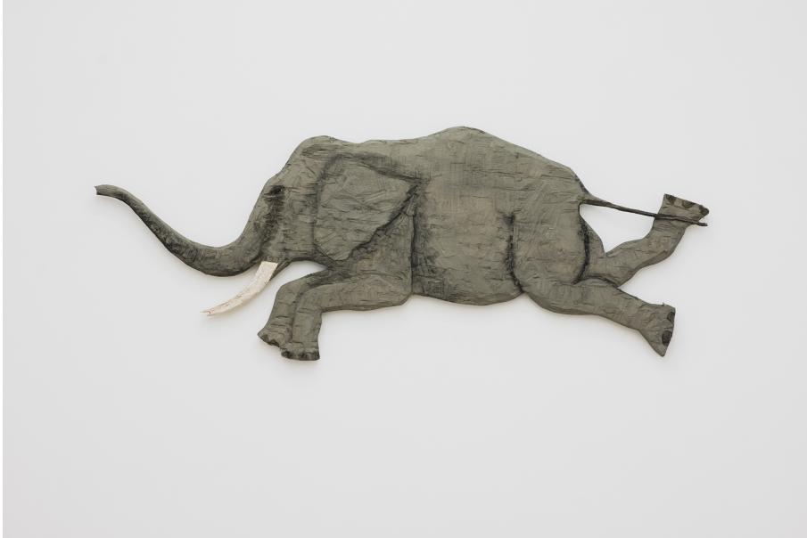
Exhibition View Nosbaum Reding, Luxembourg, 2021