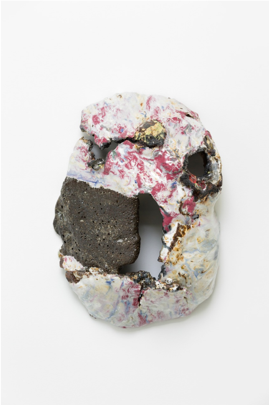
Untitled , 2020 glazed stoneware 20.87 x 12.99 x 8.27 in ( 53 x 33 x 21 cm )