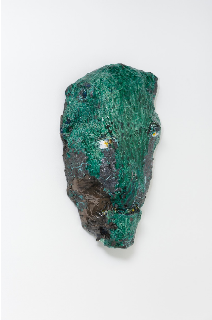
Untitled , 2020 glazed stoneware 22.05 x 13.78 x 7.87 in ( 56 x 35 x 20 cm )