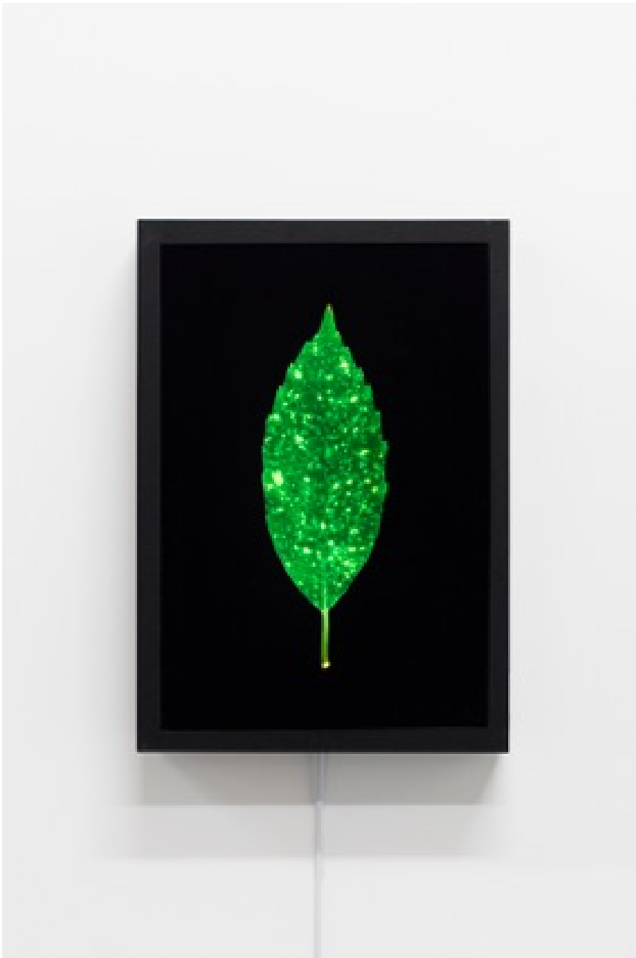
Feuille d'aucuba , 2016 Duratrans et caisson lumineux 16.14 x 11.42 in ( 41,5 x 29 cm ) Edition of 3 ex