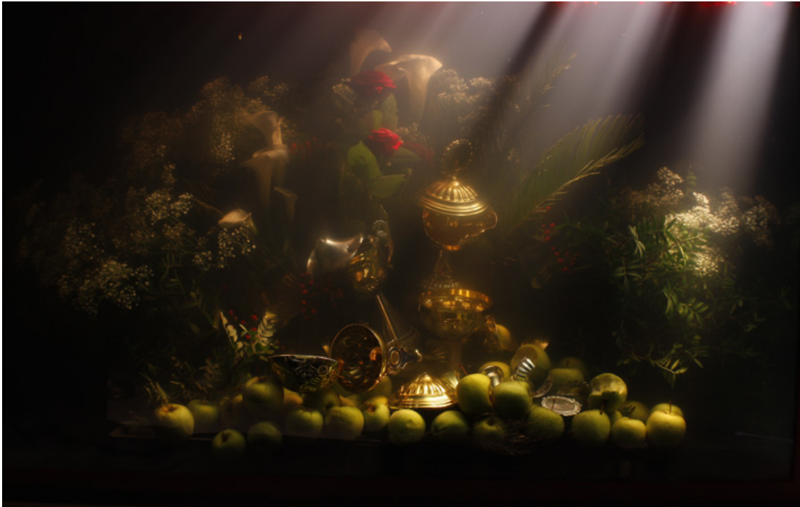
Je ne peux pas faire de miracles 11 , 2010 Inkjet on fine art paper Arches Image : 26.38 x 38.58 in ( 67,5 x 98 cm ) Edition of 5 ex