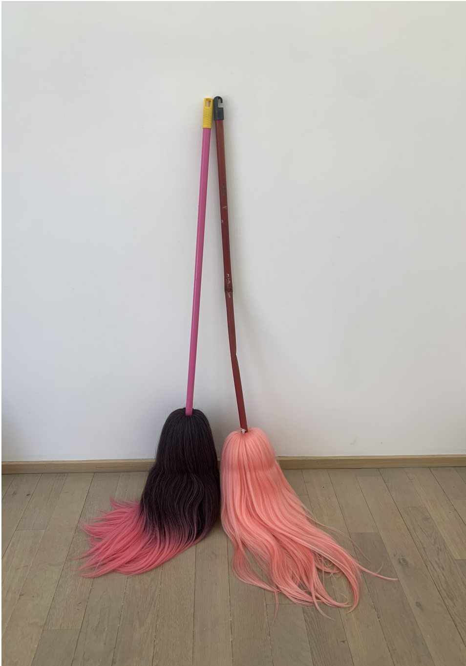
Sans titre , 2020 (After the Waves / The Waifs) Manche à balai, cheveux synthétiques et semi-naturels 55.12 x 0.39 x 0.39 in ( 140 x 1 x 1 cm )