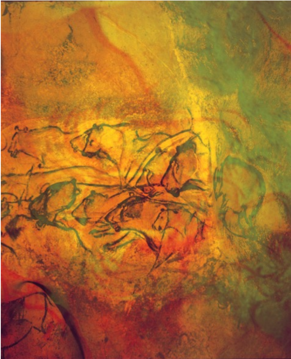
Chauvet, le voyage intérieur 4 Photo contrecollée sur aluminium Image : 50.39 x 40.55 in ( 128 x 103 cm ) Edition of 3 ex