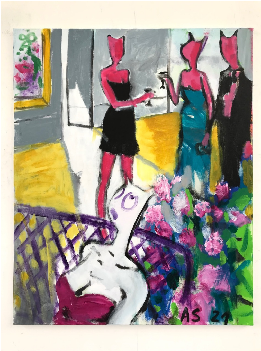
Cocktail , 2021 Acrylic on canvas 39.37 x 31.89 in ( 100 x 81 cm )