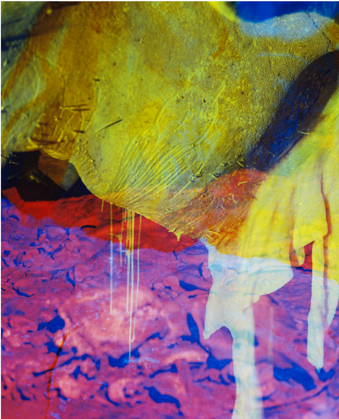
Chauvet, le voyage intérieur 2 Photo contrecollée sur aluminium Image : 50.39 x 40.55 in ( 128 x 103 cm ) Edition of 3 ex