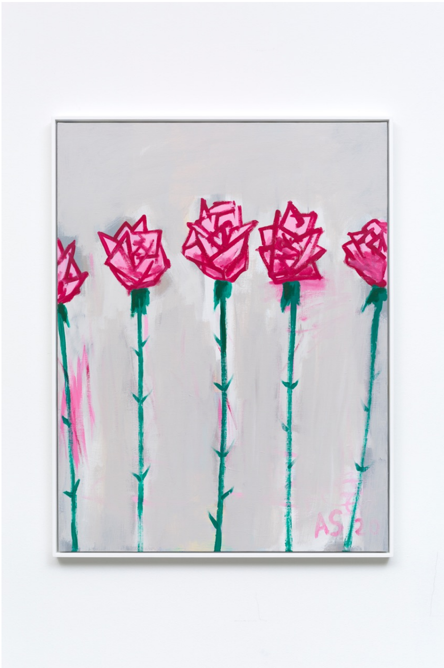
Fleurs 24 , 2020 Acrylic on canvas 45.67 x 35.04 in ( 116 x 89 cm )