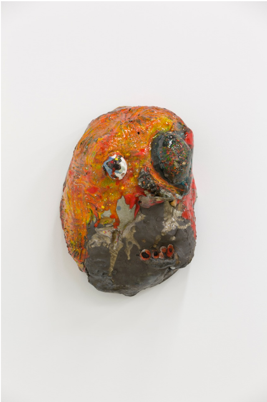
Untitled , 2020 glazed stoneware 17.72 x 13.39 x 9.06 in ( 45 x 34 x 23 cm )