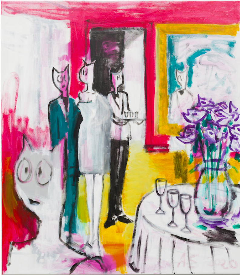
Un été français à Luxembourg Exhibition View Nosbaum Reding, Luxembourg, 2021