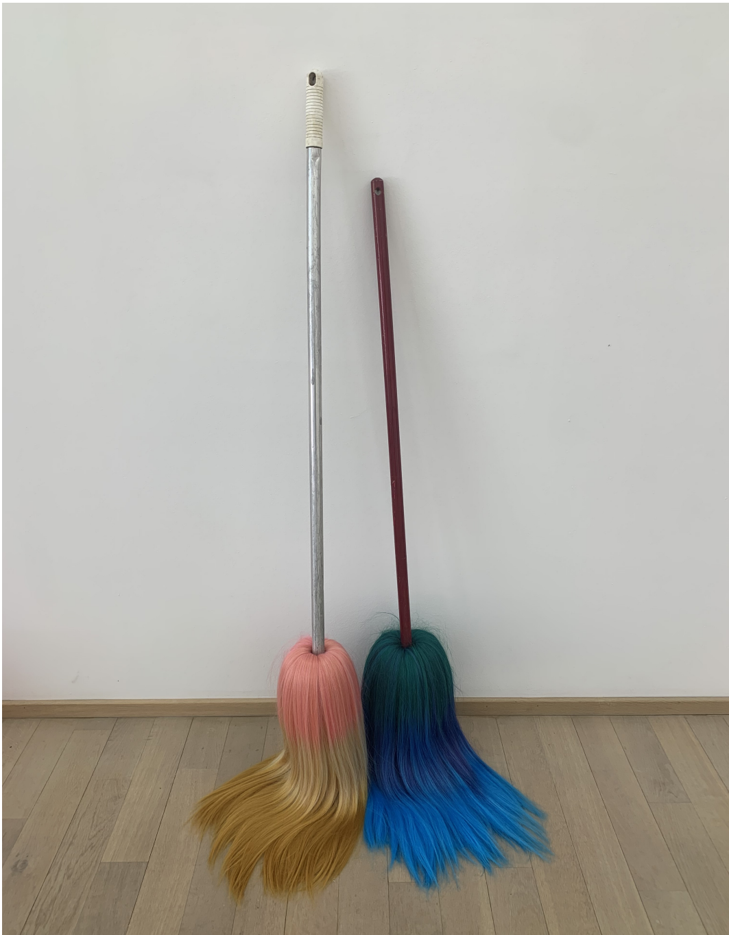
Sans titre , 2020 (After the Waves / The Waifs) Manche à balai, cheveux synthétiques et semi-naturels 54.33 x 0.39 x 0.39 in ( 138 x 1 x 1 cm )