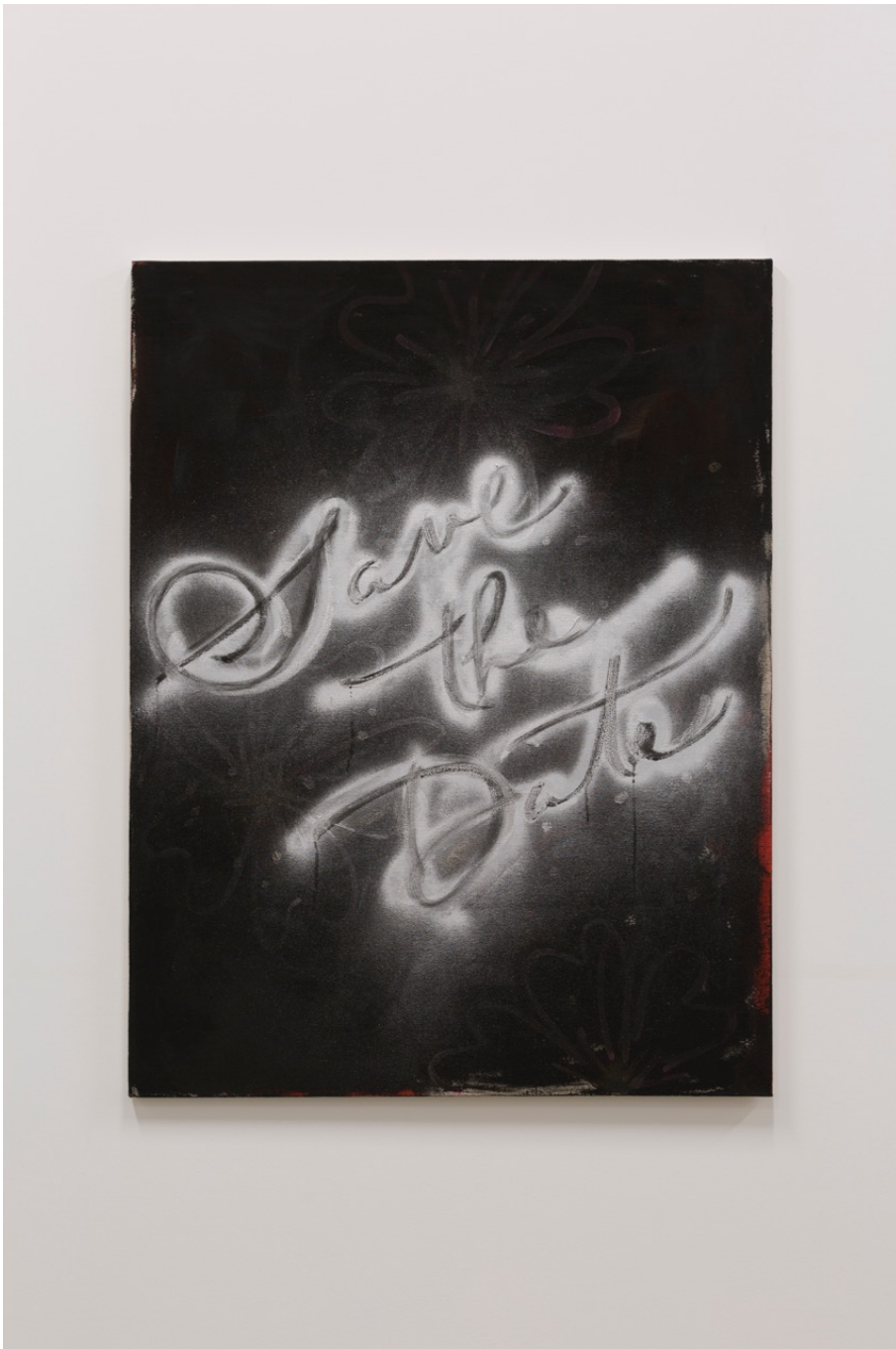
Save the date II , 2020 Acrylique et bombes de peinture en aérosol sur toile 45.67 x 35.04 in ( 116 x 89 cm )

Gallery Nosbaum Reding 2 + 4, rue Wiltheim L-2733 Luxembourg / T (+352) 28 11 25 1 / reding@nosbaumreding.com