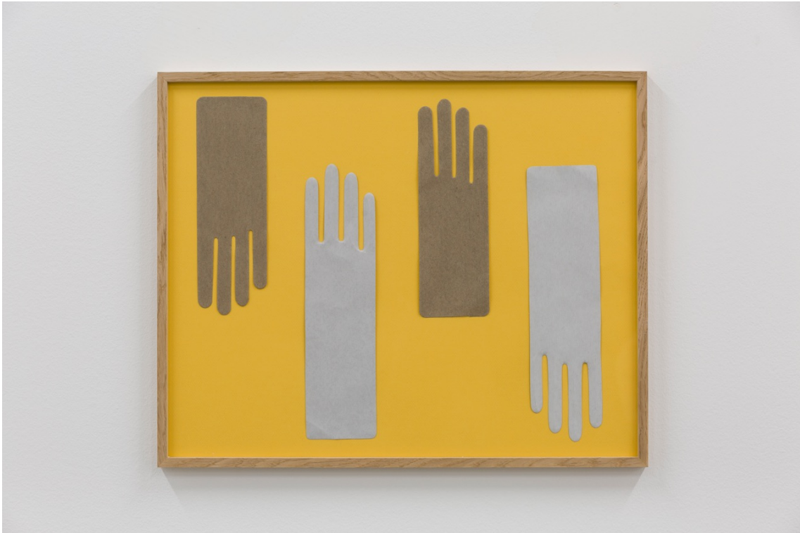
Gants , 2021 Gants, cartons découpés et papier canson 16.14 x 20.08 in ( 41,5 x 51,5 cm )