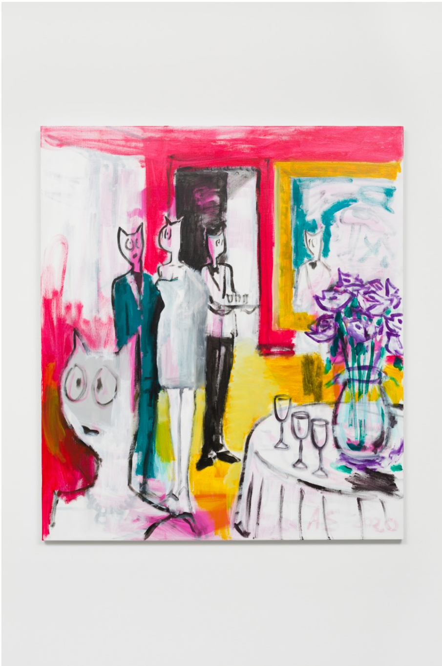
Cocktail , 2021 Acrylic on canvas 62.99 x 55.12 in ( 160 x 140 cm )