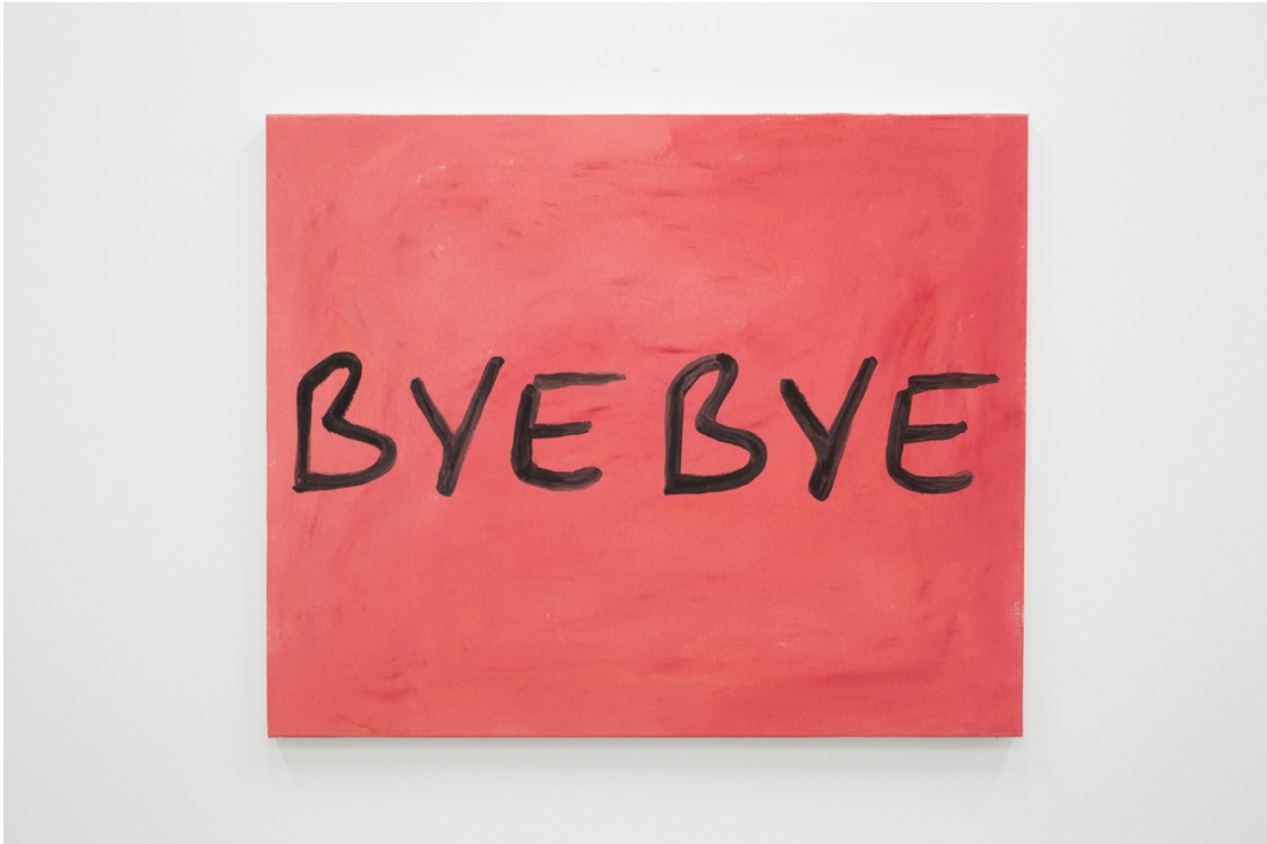
Bye Bye , 2020 Spray on canvas 23.62 x 28.74 in ( 60 x 73 cm )