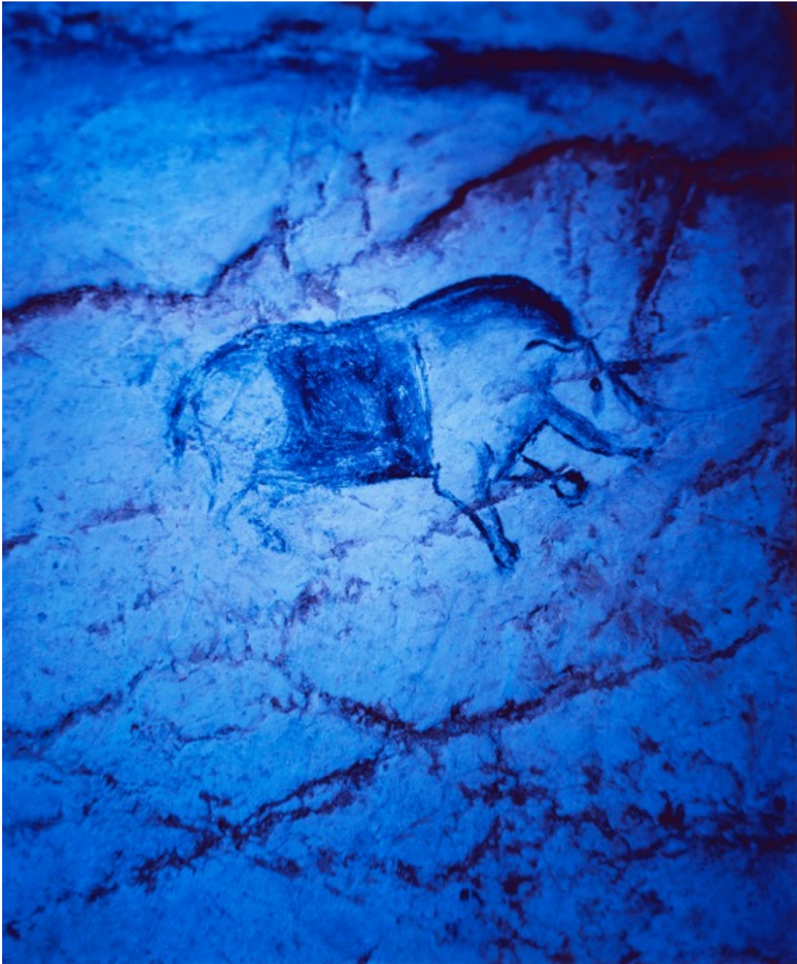
Chauvet, le voyage intérieur 3 Photo contrecollée sur aluminium Image : 50.39 x 40.55 in ( 128 x 103 cm ) Edition of 3 ex