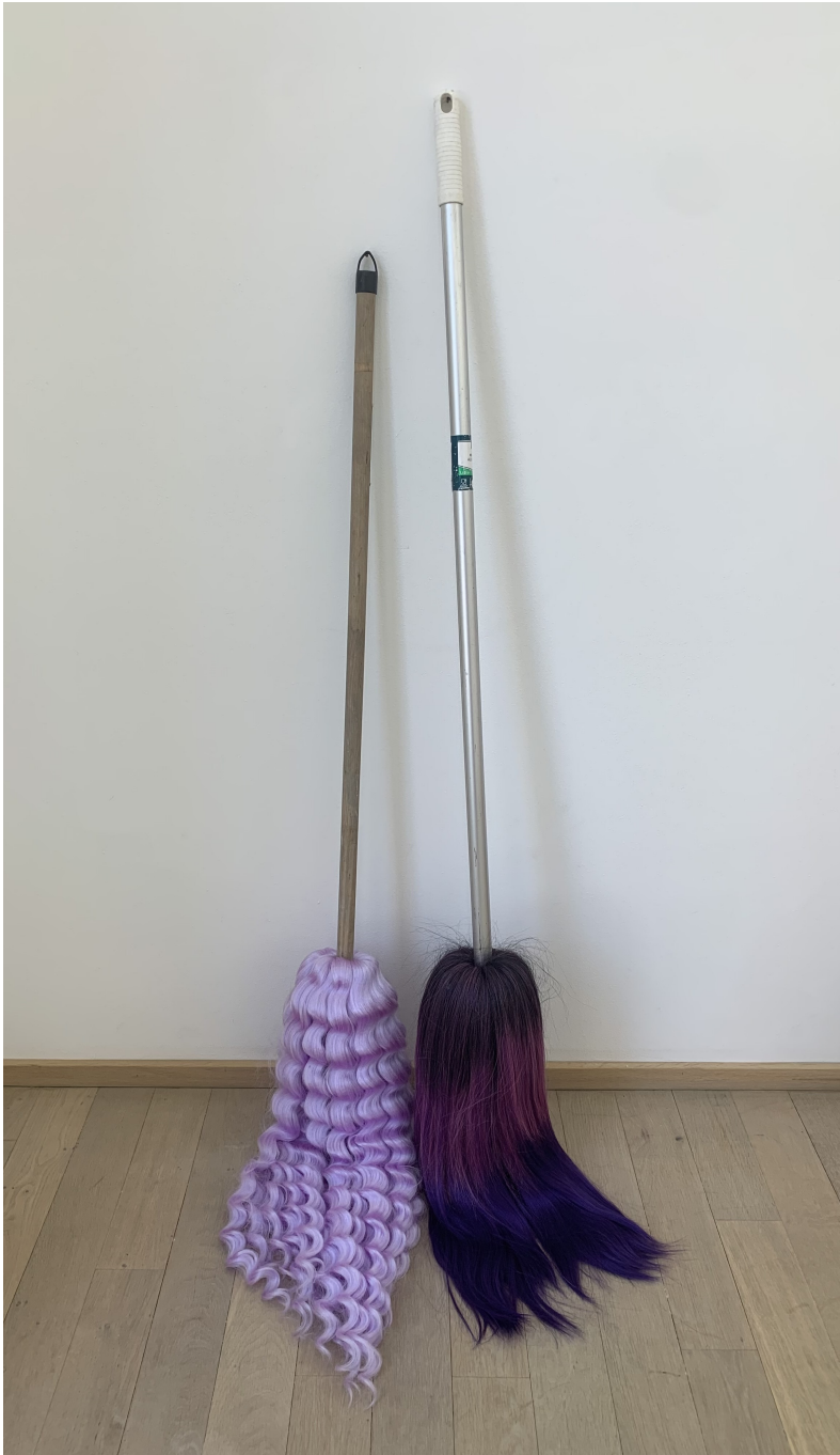
Sans titre , 2020 (After the Waves / The Waifs) Manche à balai, cheveux synthétiques et semi-naturels 55.12 x 0.39 x 0.39 in ( 140 x 1 x 1 cm )