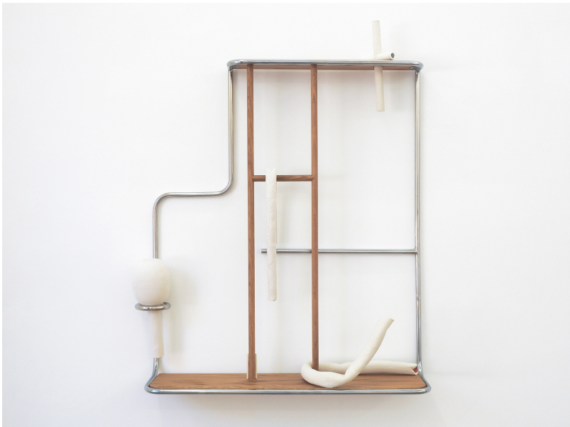
Industriel-viscéral Exhibition View Nosbaum Reding, Luxembourg, 2021