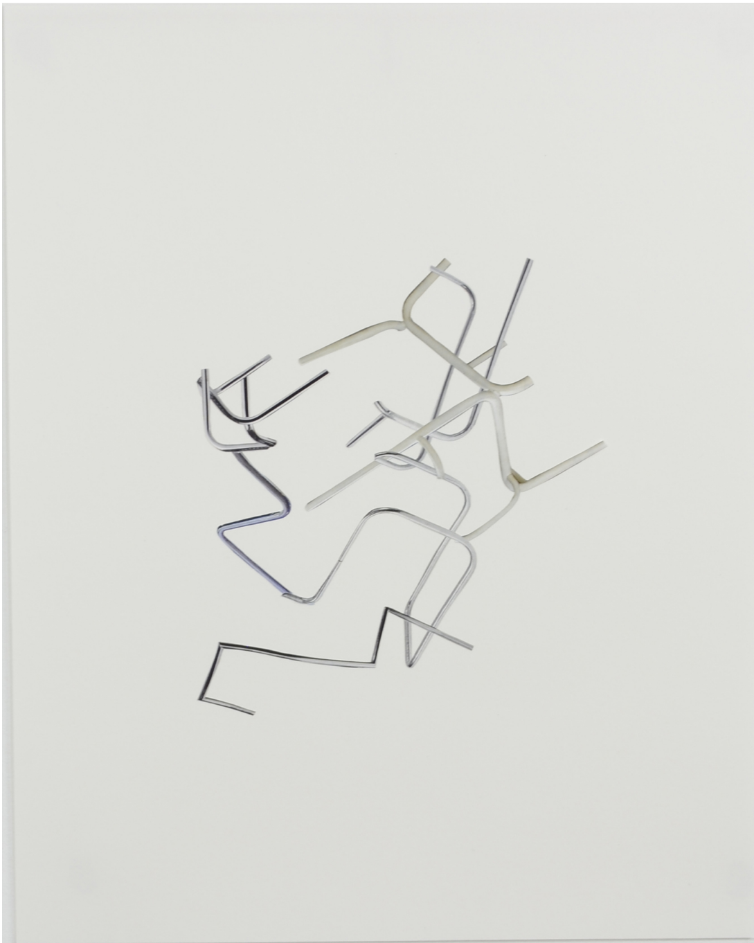
Décomposition en douceur, tubes , 2021 Collage sur papier et cadre en aluminium 15.75 x 11.81 in ( 40 x 30 cm )