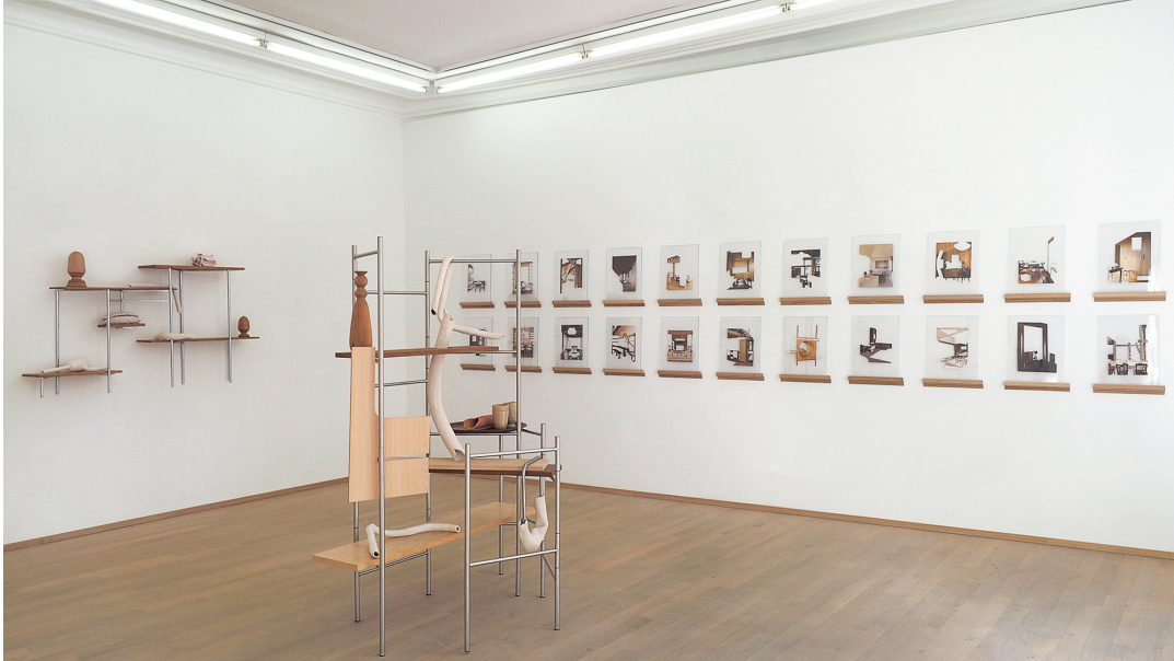
Industriel-viscéral Exhibition View Nosbaum Reding, Luxembourg, 2021