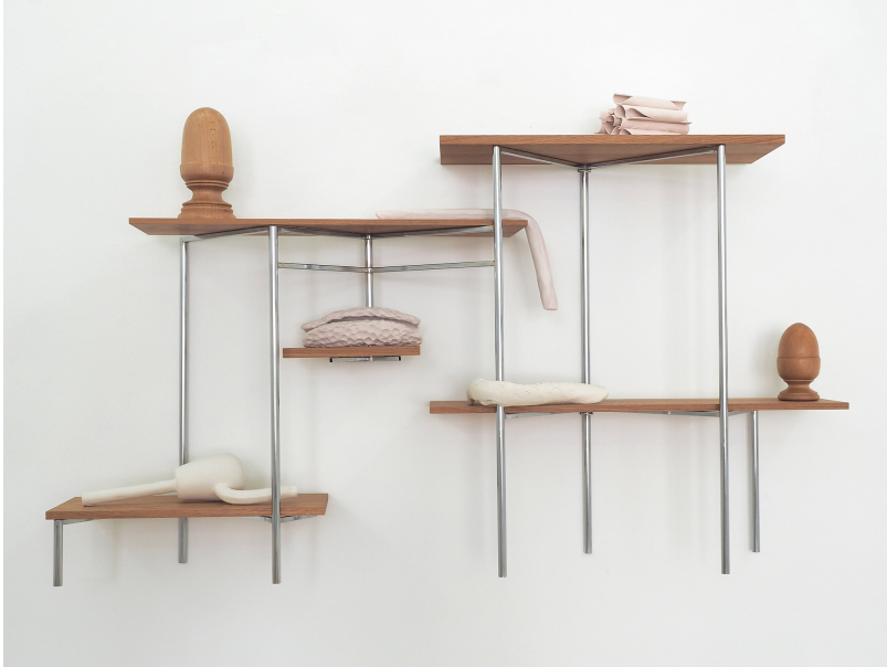
Industriel-viscéral Exhibition View Nosbaum Reding, Luxembourg, 2021