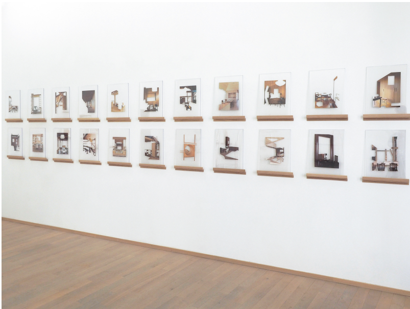
Industriel-viscéral Exhibition View Nosbaum Reding, Luxembourg, 2021