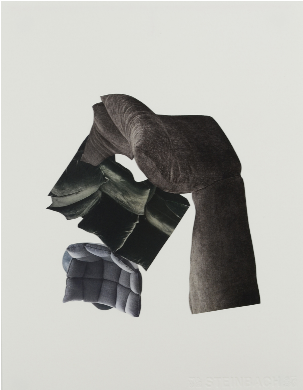
Décomposition en douceur, noir , 2021 Collage sur papier et cadre en aluminium 15.75 x 11.81 in ( 40 x 30 cm )