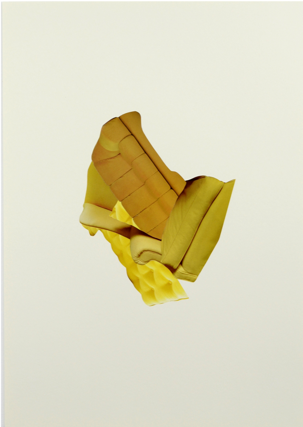
Décomposition en douceur, jaune , 2021 Collage sur papier et cadre en aluminium 19.69 x 15.75 in ( 50 x 40 cm )