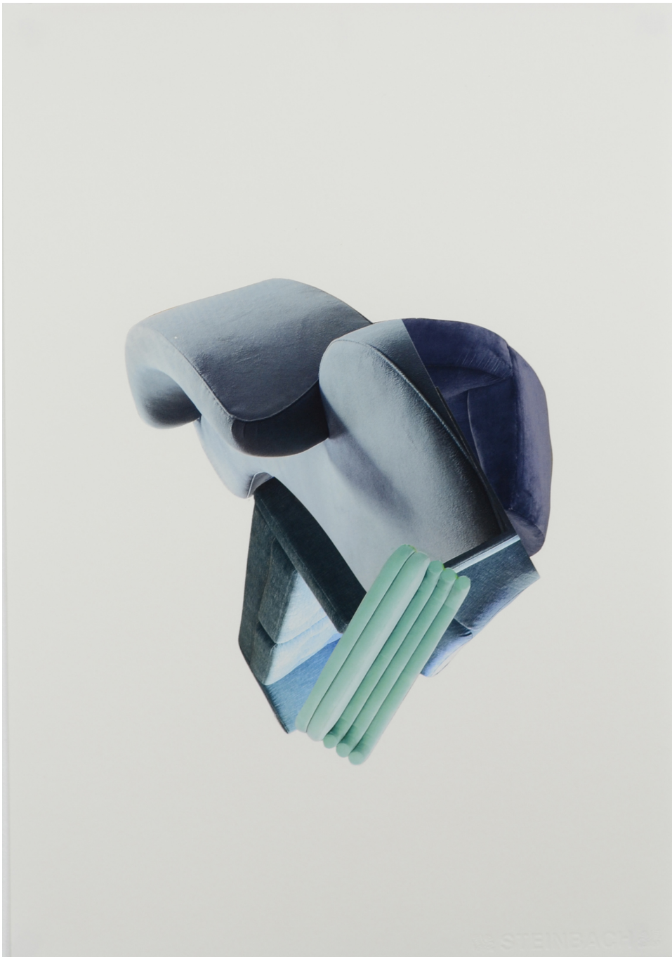
Décomposition en douceur, bleu , 2021 Collage sur papier et cadre en aluminium 19.69 x 15.75 in ( 50 x 40 cm )