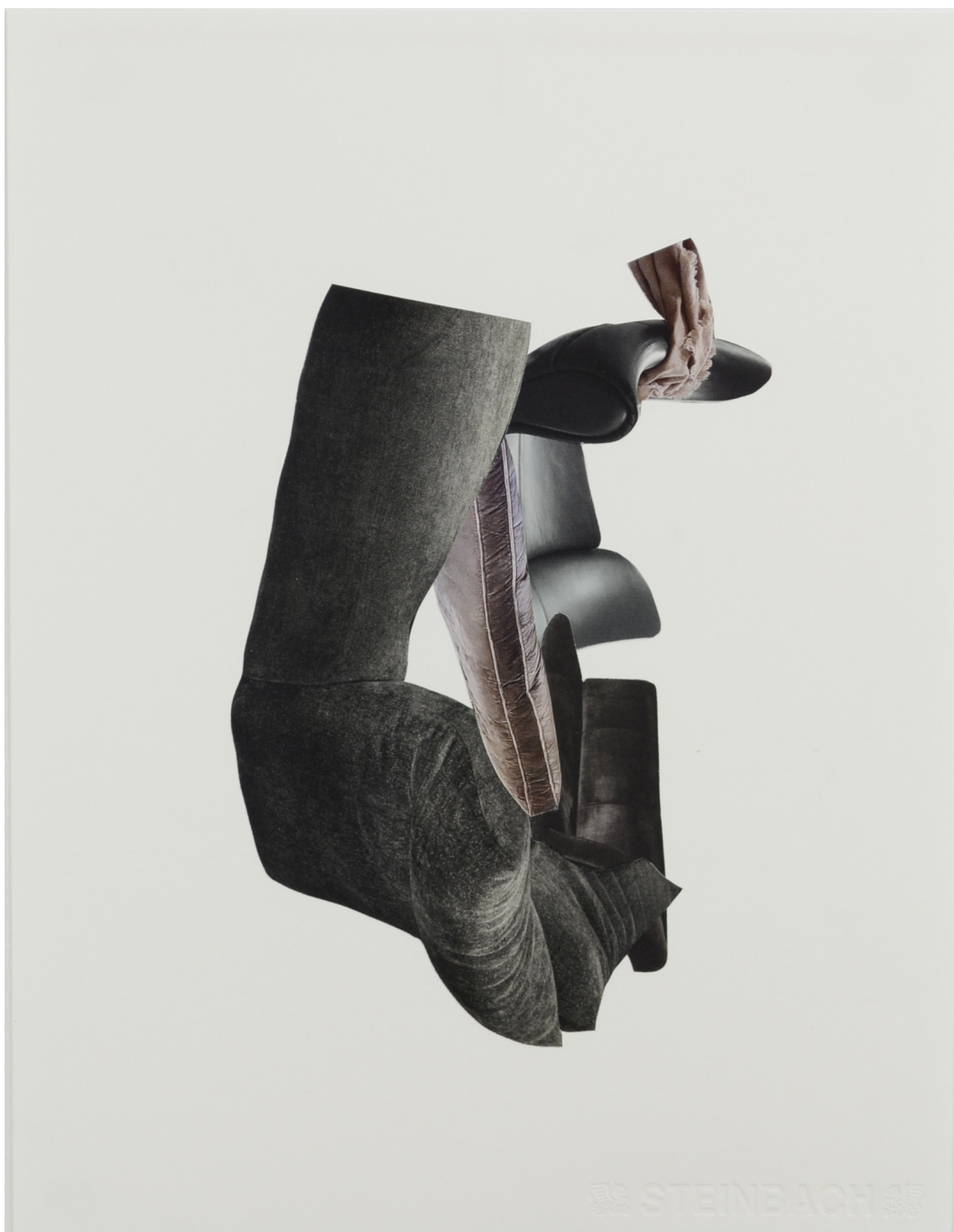
Décomposition en douceur, noir , 2021 Collage sur papier et cadre en aluminium 15.75 x 11.81 in ( 40 x 30 cm )