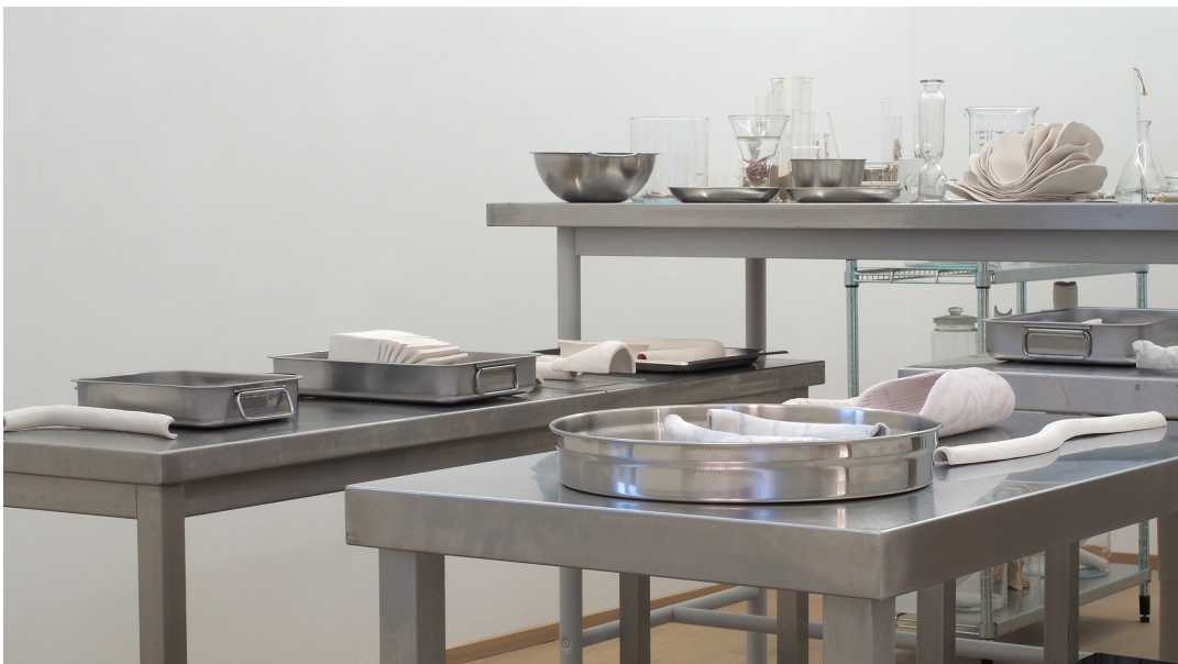
Industriel-viscéral Exhibition View Nosbaum Reding, Luxembourg, 2021