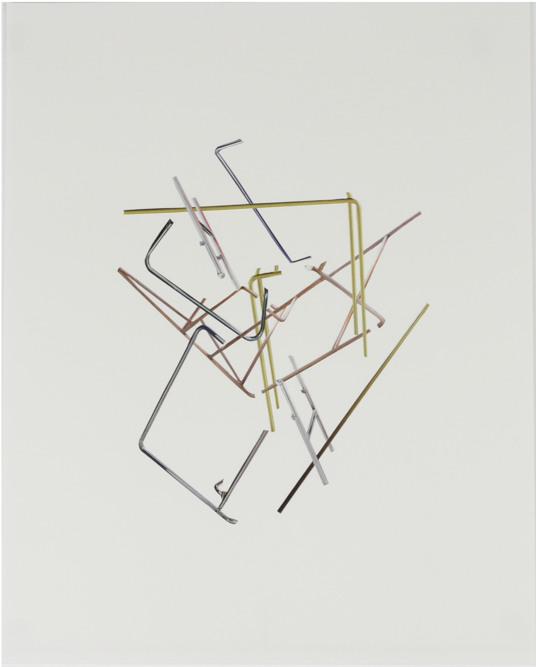
Tubular Collage II , 2021 Collage on paper 15.75 x 11.81 in ( 40 x 30 cm )