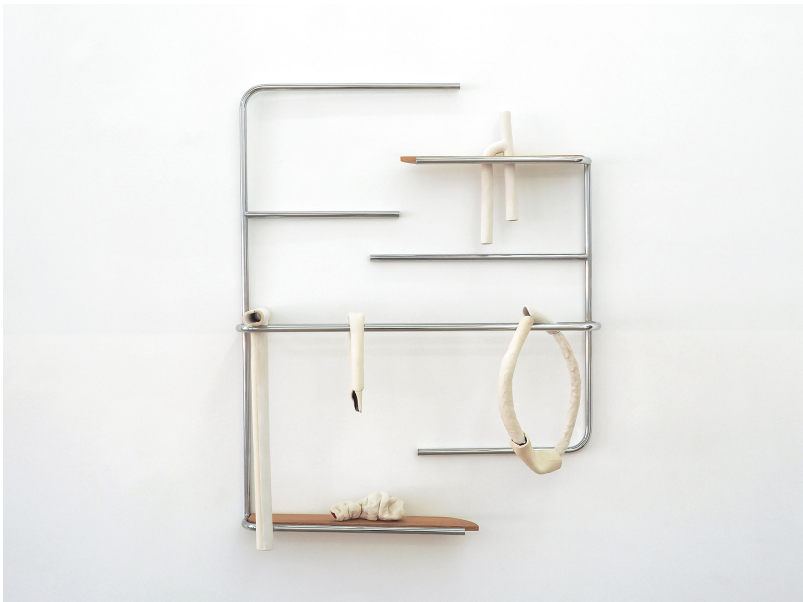
Industriel-viscéral Exhibition View Nosbaum Reding, Luxembourg, 2021