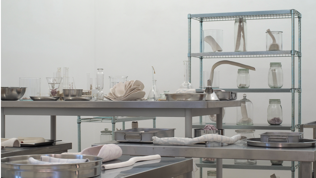
Industriel-viscéral Exhibition View Nosbaum Reding, Luxembourg, 2021