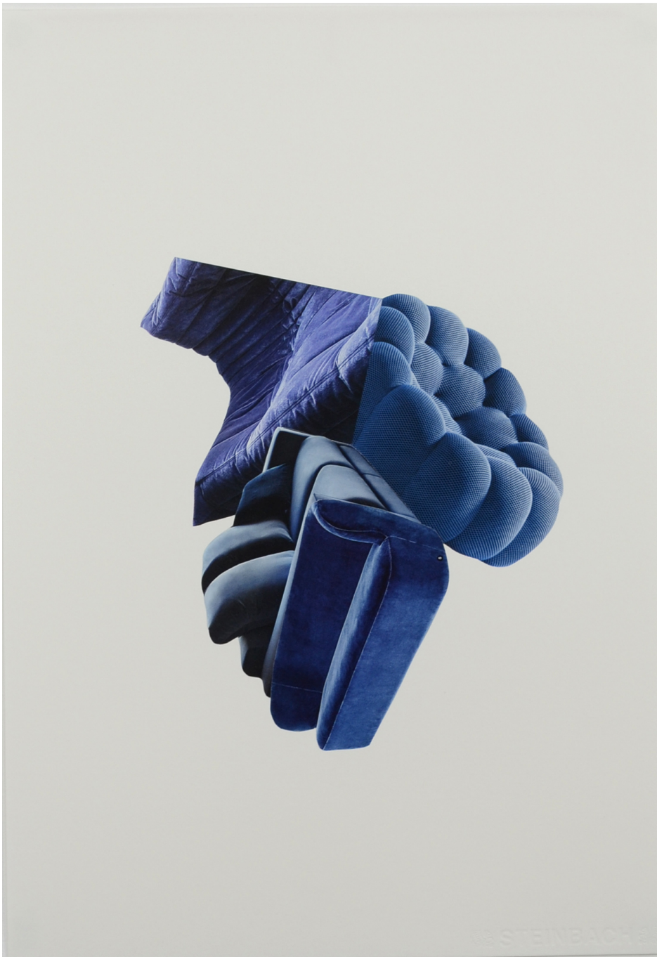
Décomposition en douceur, bleu , 2021 Collage sur papier et cadre en aluminium 19.69 x 15.75 in ( 50 x 40 cm )