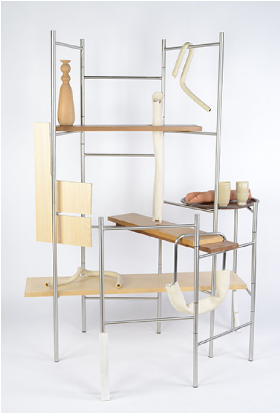
Rack I , 2018 Galvanized steel, wood, laminated board and ceramics 66.93 x 51.18 x 39.37 in ( 170 x 130 x 100 cm )