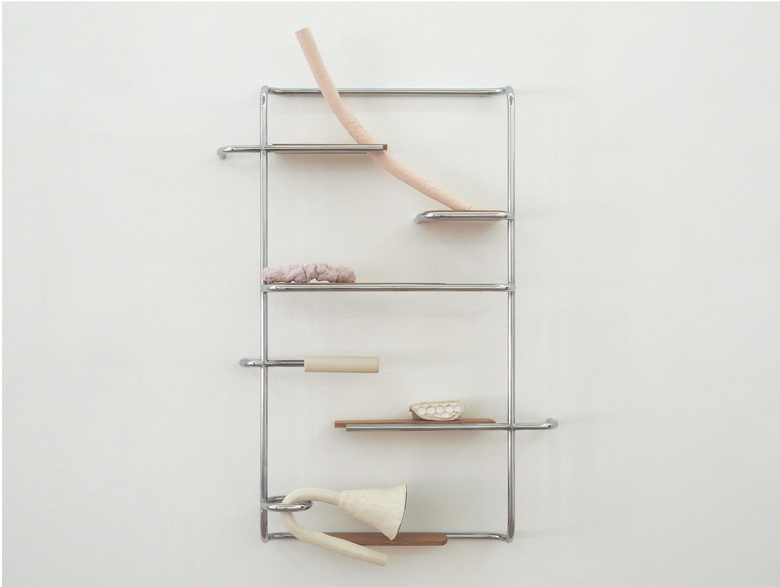
Industriel - viscéral II , 2021 Chrome plated iron tube, oak and stoneware glazed 45.28 x 30.31 x 7.09 in ( 115 x 77 x 18 cm )