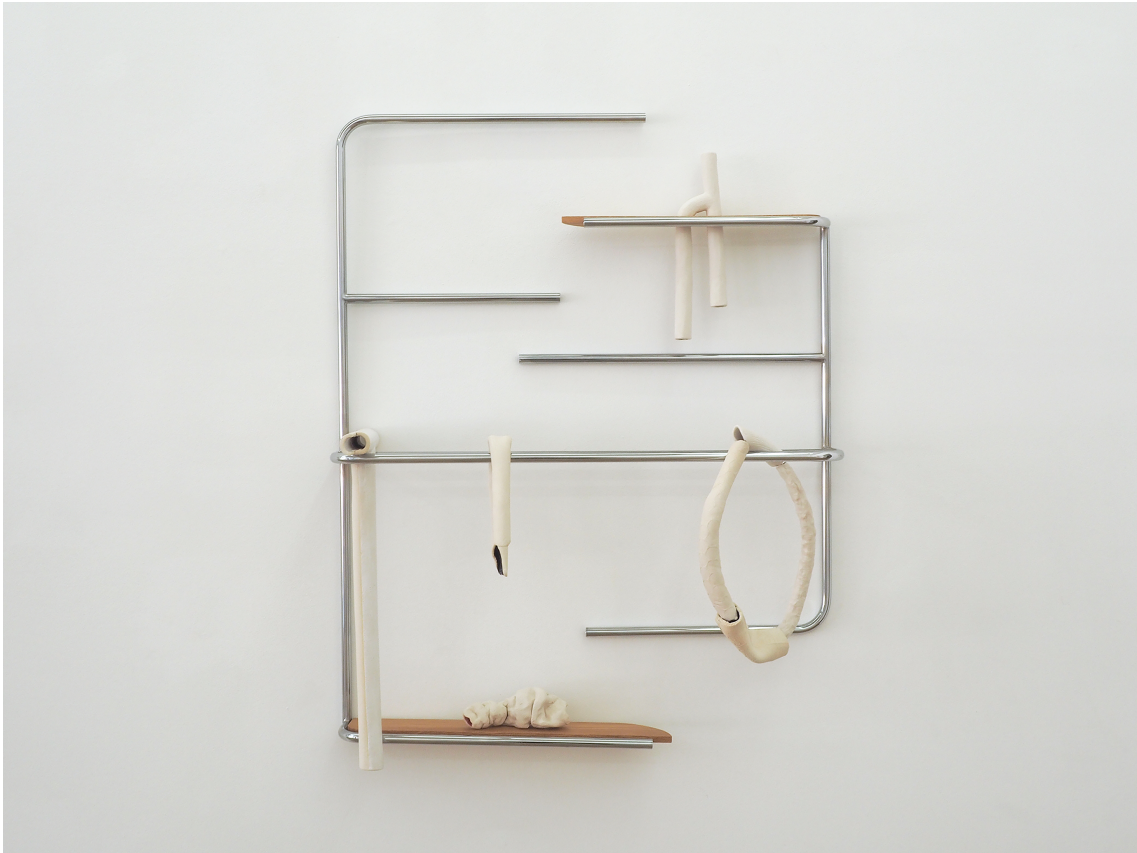
Industriel - viscéral III , 2021 Chromed iron tube, oak and glazed stoneware 41.34 x 32.28 x 10.63 in ( 105 x 82 x 27 cm )