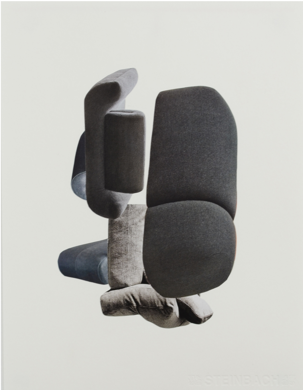
Décomposition en douceur, noir , 2021 Collage sur papier et cadre en aluminium 15.75 x 11.81 in ( 40 x 30 cm )