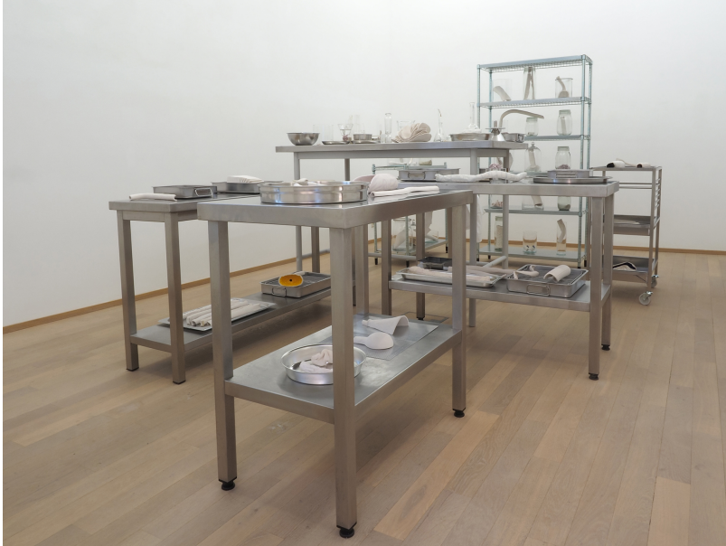
Industriel-viscéral Exhibition View Nosbaum Reding, Luxembourg, 2021