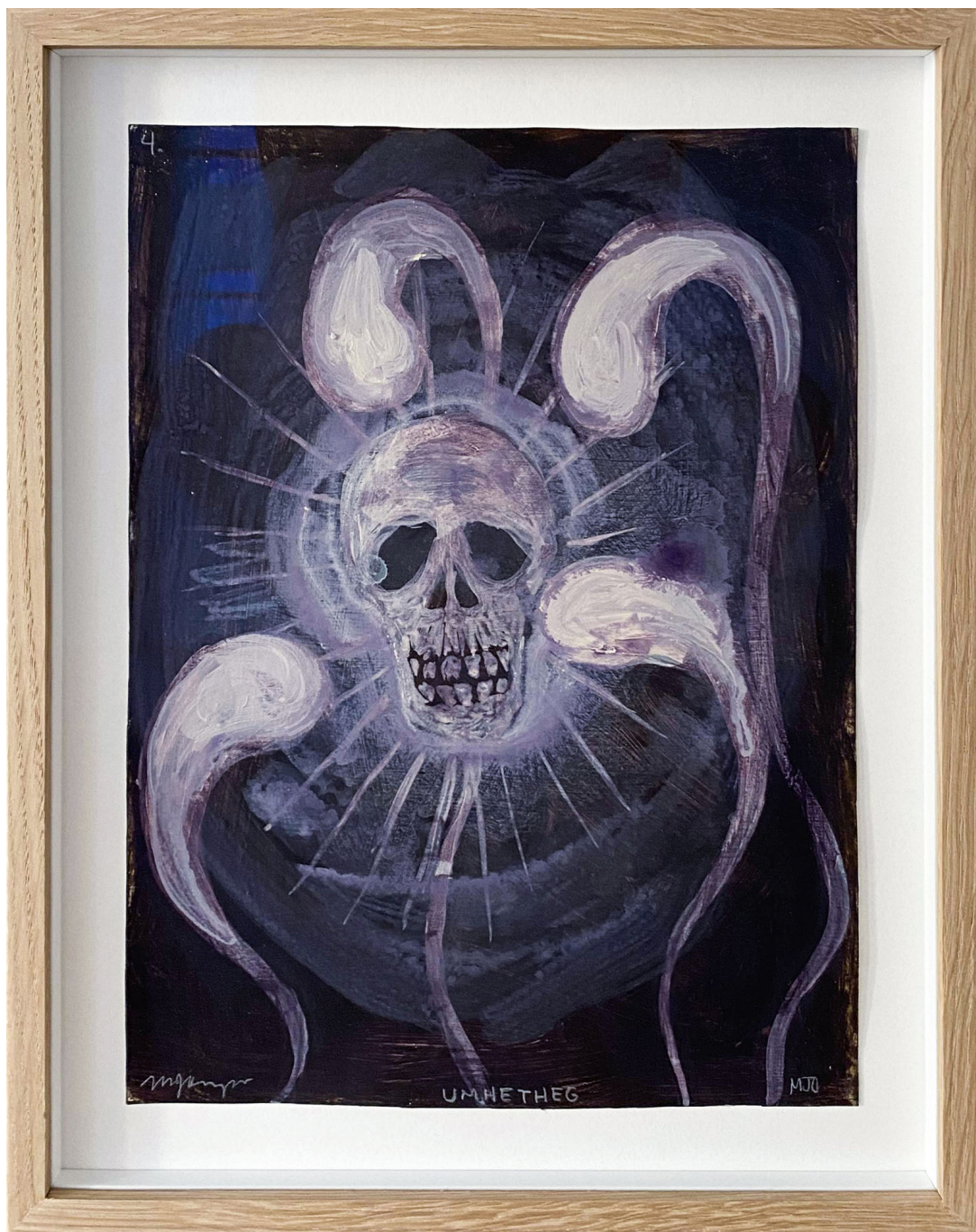
Sans titre , 2021 Mixed media on paper 11.81 x 8.27 in ( 30 x 21 cm )