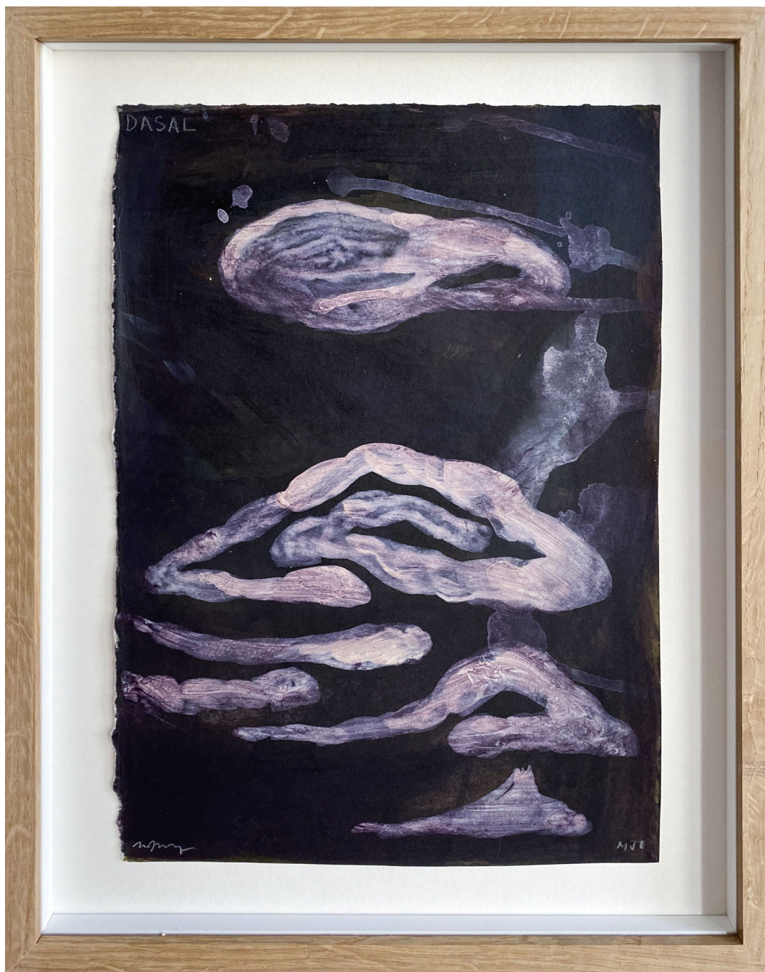
Sans titre , 2021 Mixed media on paper 11.81 x 8.27 in ( 30 x 21 cm )

Gallery Nosbaum Reding 2 + 4, rue Wiltheim L-2733 Luxembourg / T (+352) 28 11 25 1 / reding@nosbaumreding.com