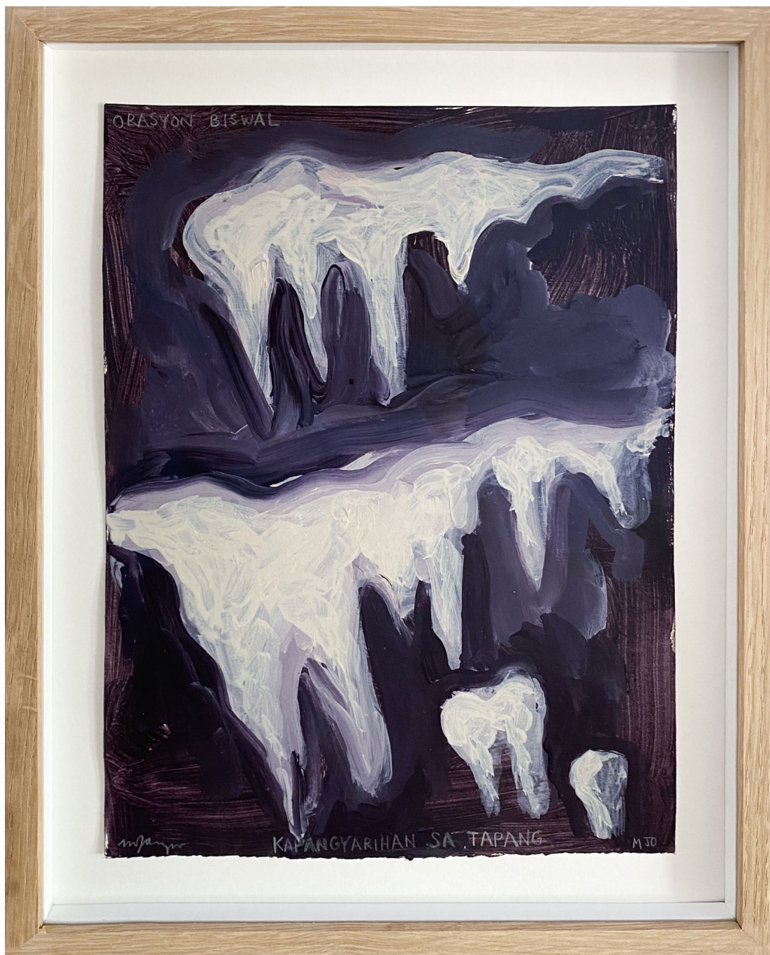
Sans titre , 2021 Mixed media on paper 11.81 x 8.27 in ( 30 x 21 cm )