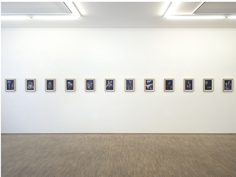
Aesthetic of Discomfort Exhibition View Nosbaum Reding, Luxembourg, 2021