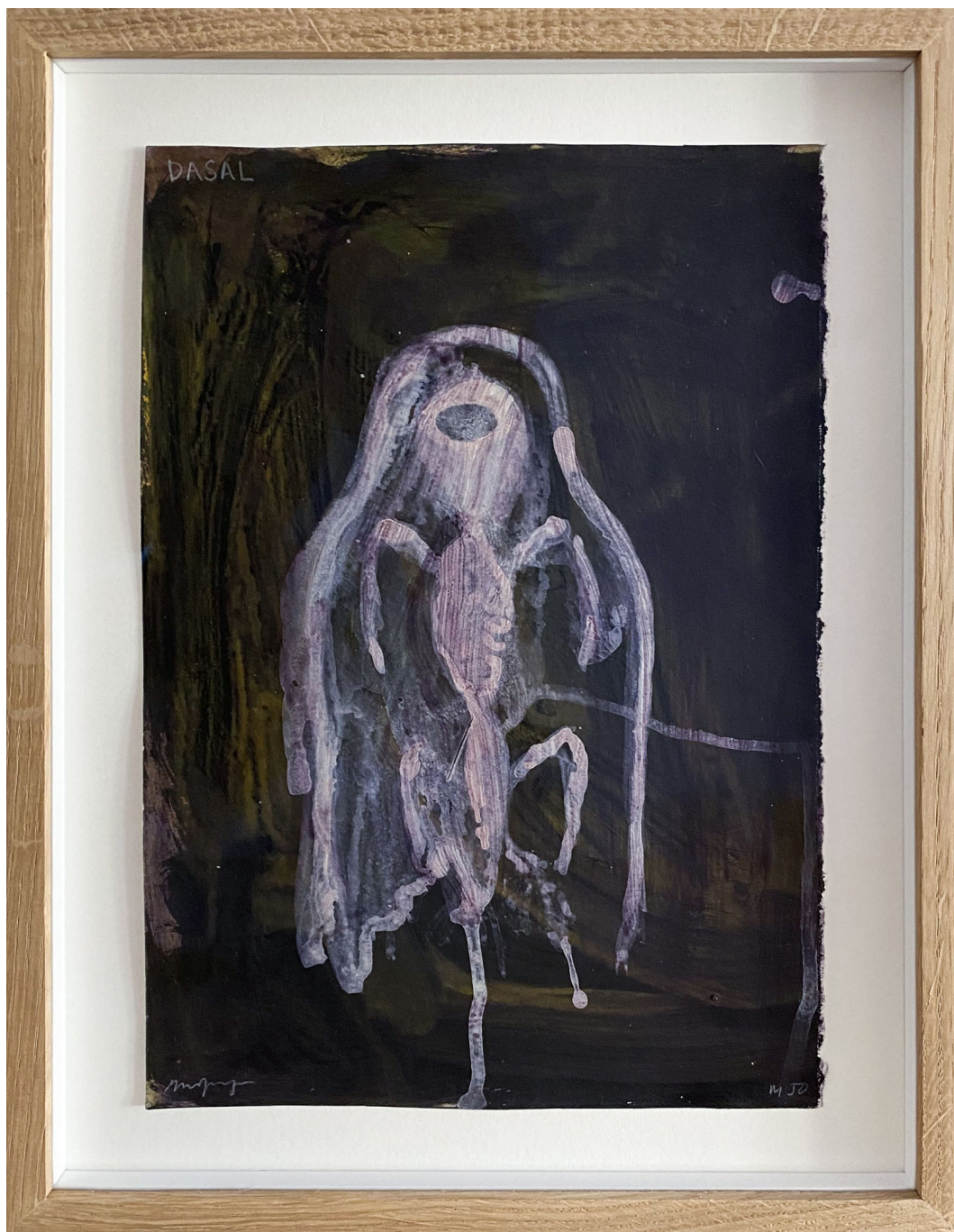
Sans titre , 2021 Mixed media on paper 11.81 x 8.27 in ( 30 x 21 cm )