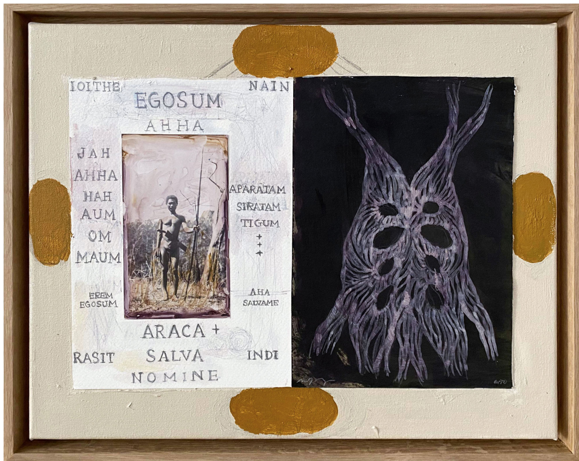
Sans titre , 2021 Mixed media on canvas 15.75 x 19.69 in ( 40 x 50 cm )