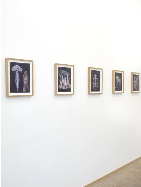
Aesthetic of Discomfort Exhibition View Nosbaum Reding, Luxembourg, 2021