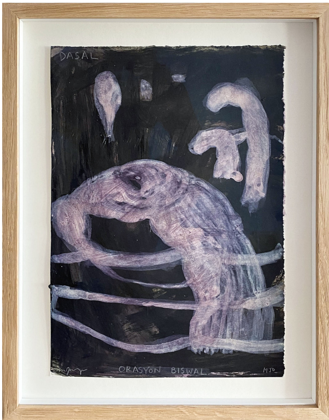
Sans titre , 2021 Mixed media on paper 11.81 x 8.27 in ( 30 x 21 cm )