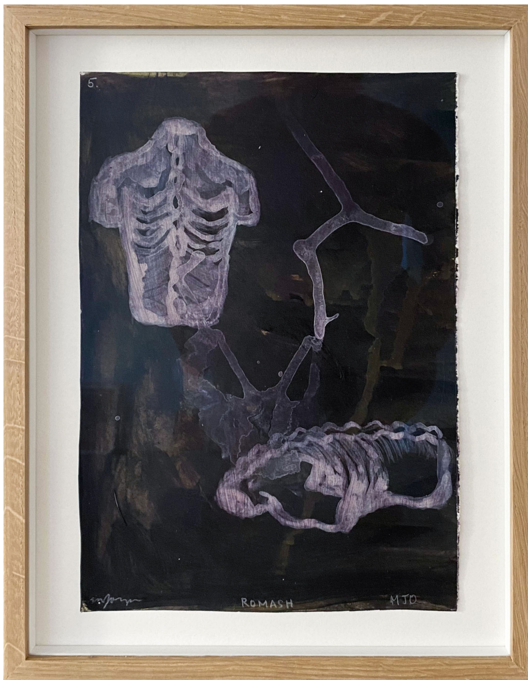
Sans titre , 2021 Mixed media on paper 11.81 x 8.27 in ( 30 x 21 cm )