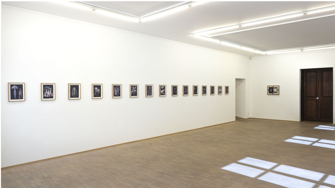
Aesthetic of Discomfort Exhibition View Nosbaum Reding, Luxembourg, 2021