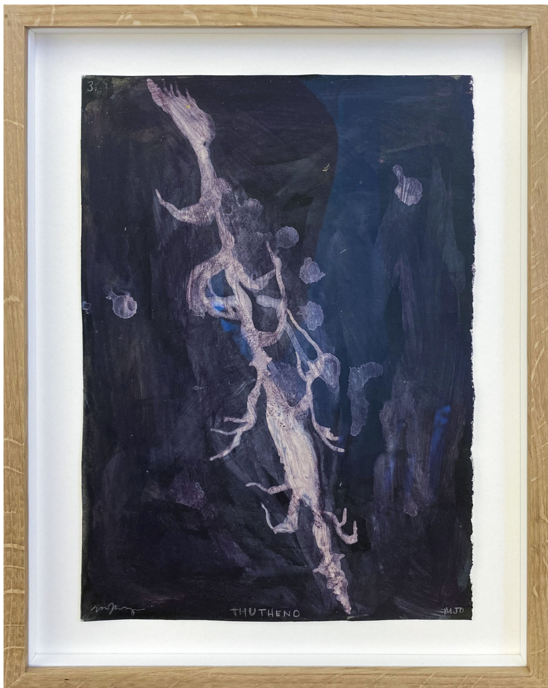
Sans titre , 2021 Mixed media on paper 11.81 x 8.27 in ( 30 x 21 cm )

Gallery Nosbaum Reding 2 + 4, rue Wiltheim L-2733 Luxembourg / T (+352) 28 11 25 1 / reding@nosbaumreding.com