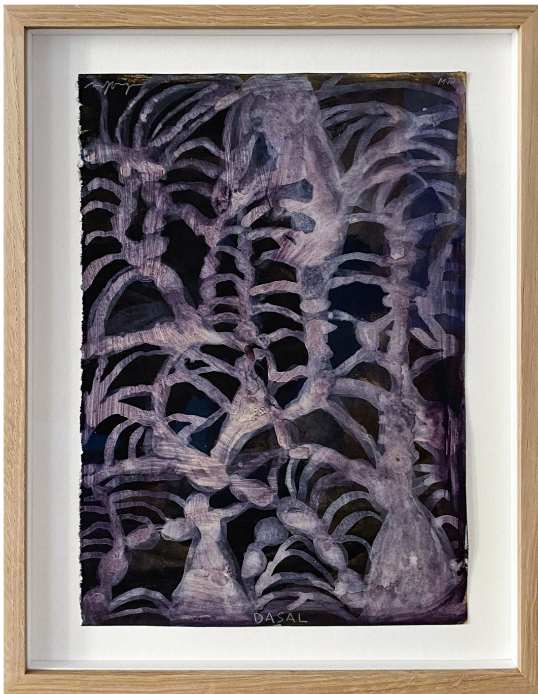
Sans titre , 2021 Mixed media on paper 11.81 x 8.27 in ( 30 x 21 cm )