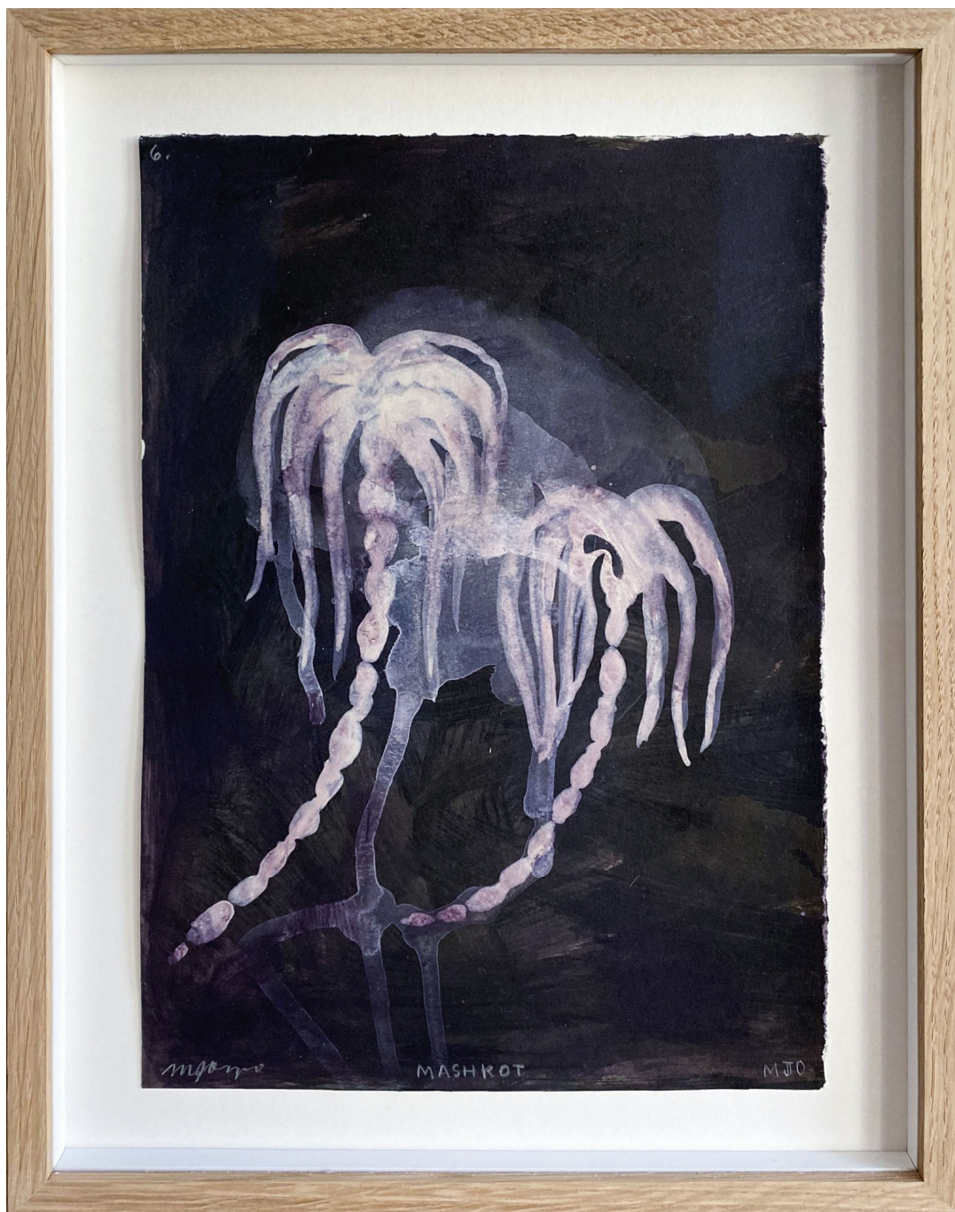
Sans titre , 2021 Mixed media on paper 11.81 x 8.27 in ( 30 x 21 cm )