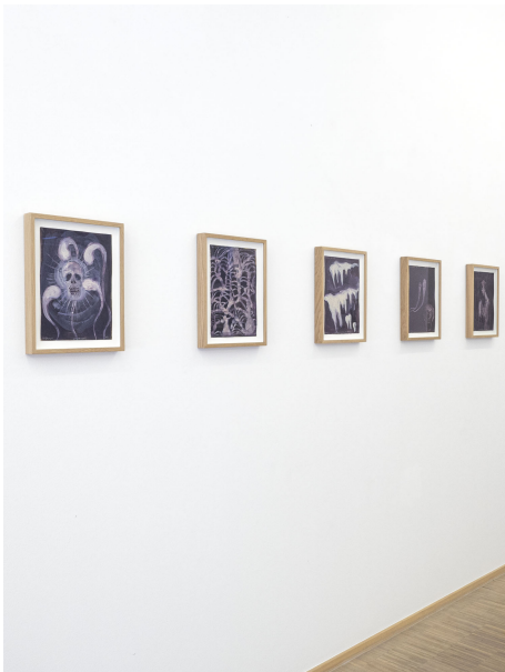
Aesthetic of Discomfort Exhibition View Nosbaum Reding, Luxembourg, 2021