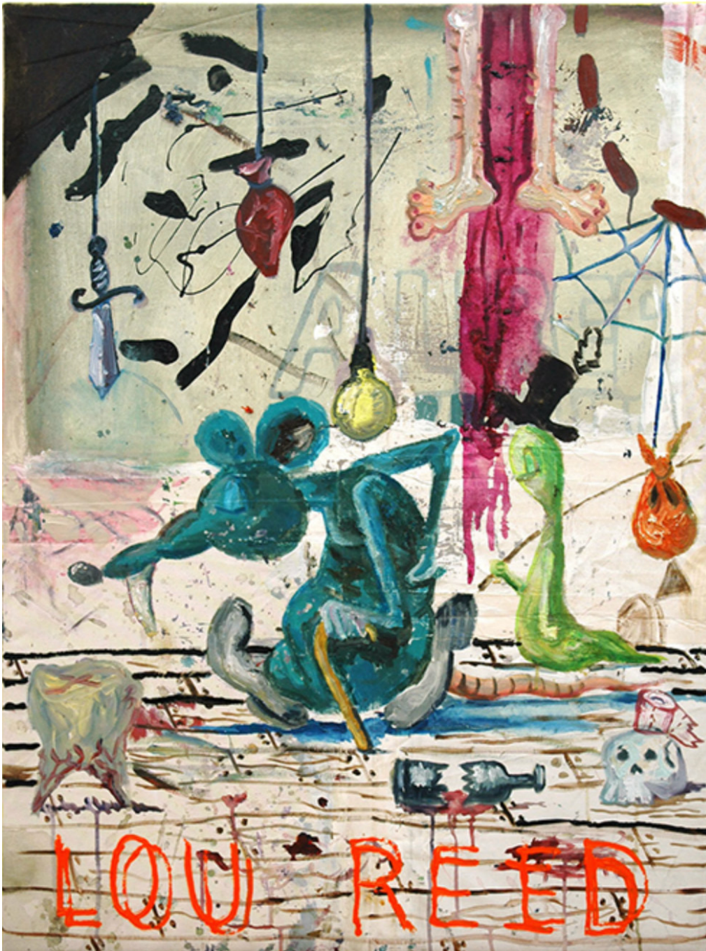
Lou Reed, 2007 Oil on canvas 39.76 x 29.92 in ( 101 x 76,8 cm )