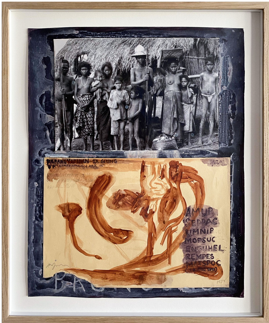
Sans titre , 2021 Mixed media on paper 70.87 x 51.18 in ( 180 x 130 cm )

Gallery Nosbaum Reding 2 + 4, rue Wiltheim L-2733 Luxembourg / T (+352) 28 11 25 1 / reding@nosbaumreding.com