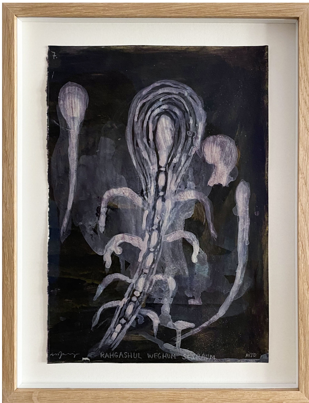
Sans titre , 2021 Mixed media on paper 11.81 x 8.27 in ( 30 x 21 cm )