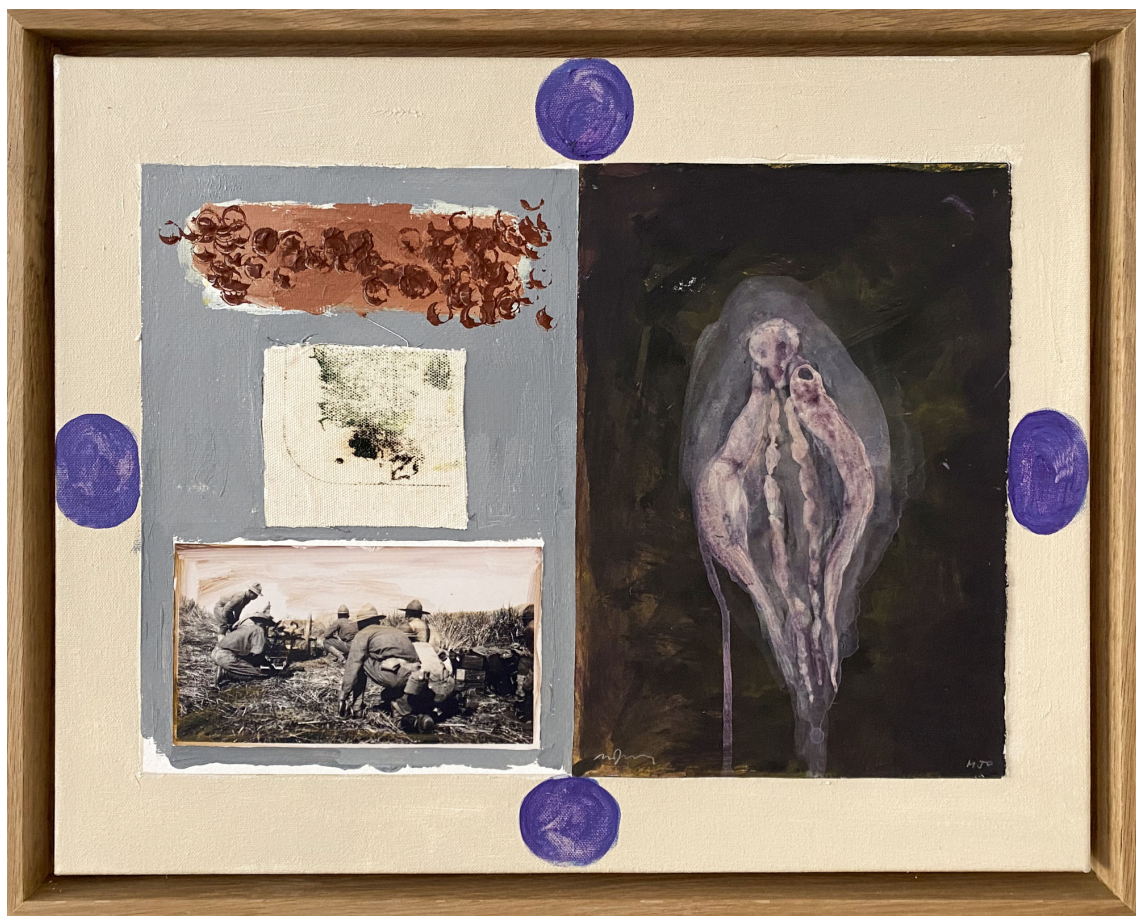
Sans titre , 2021 Mixed media on canvas 15.75 x 19.69 in ( 40 x 50 cm )