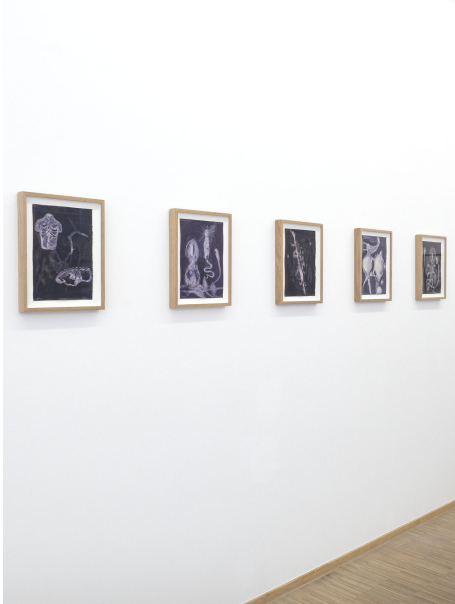
Aesthetic of Discomfort Exhibition View Nosbaum Reding, Luxembourg, 2021