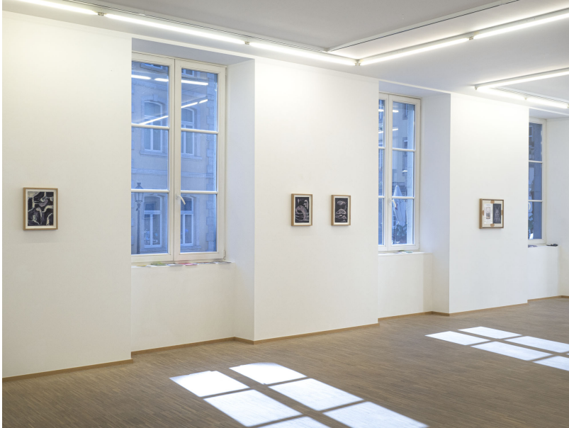
Aesthetic of Discomfort Exhibition View Nosbaum Reding, Luxembourg, 2021