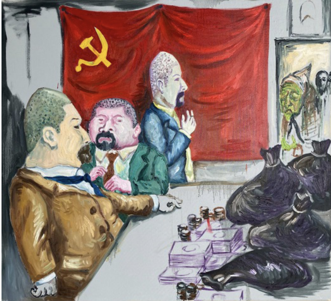
Aesthetic of Discomfort Exhibition View Nosbaum Reding, Luxembourg, 2021