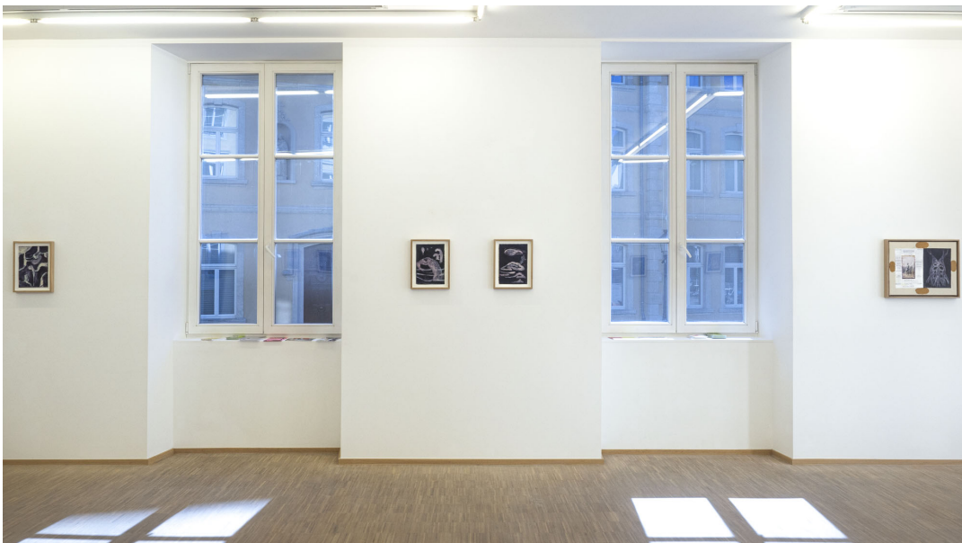
Aesthetic of Discomfort Exhibition View Nosbaum Reding, Luxembourg, 2021