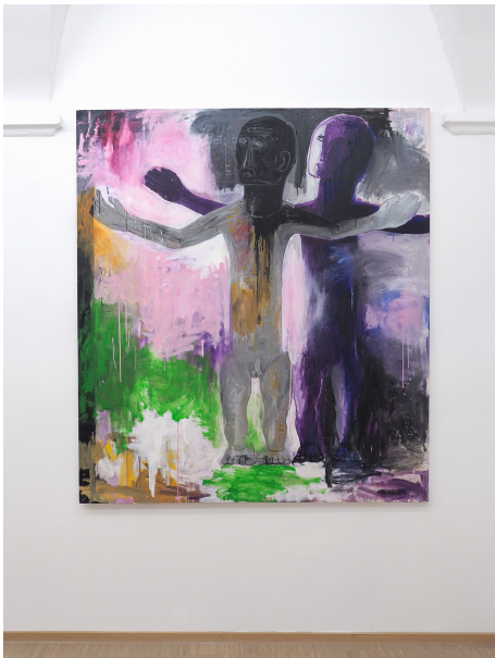
Aesthetic of Discomfort Exhibition View Nosbaum Reding, Luxembourg, 2021