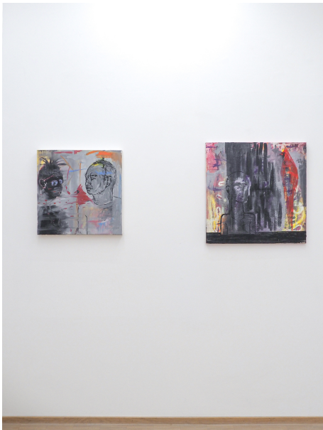
Aesthetic of Discomfort Exhibition View Nosbaum Reding, Luxembourg, 2021