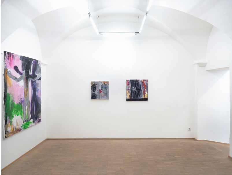
Aesthetic of Discomfort Exhibition View Nosbaum Reding, Luxembourg, 2021