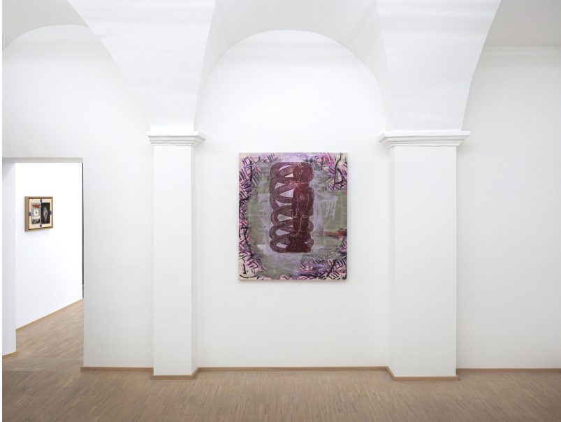
Aesthetic of Discomfort Exhibition View Nosbaum Reding, Luxembourg, 2021