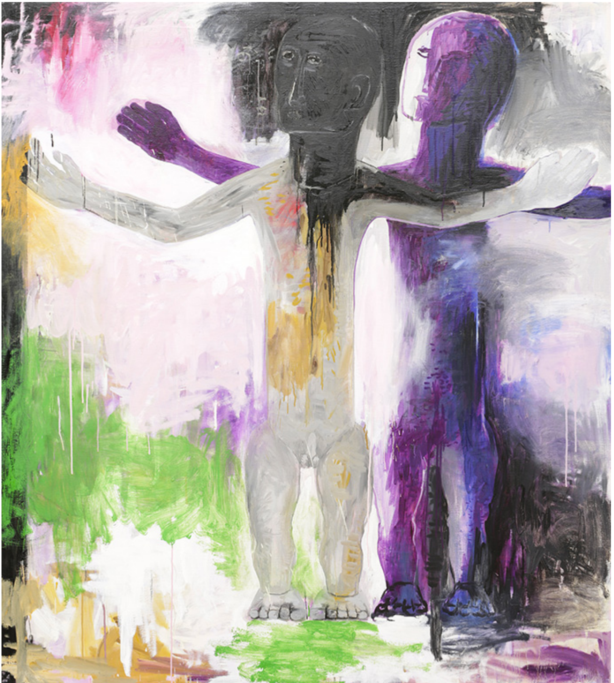
Sans titre , 2020 Oil on canvas 64.17 x 57.09 in ( 163 x 145 cm )