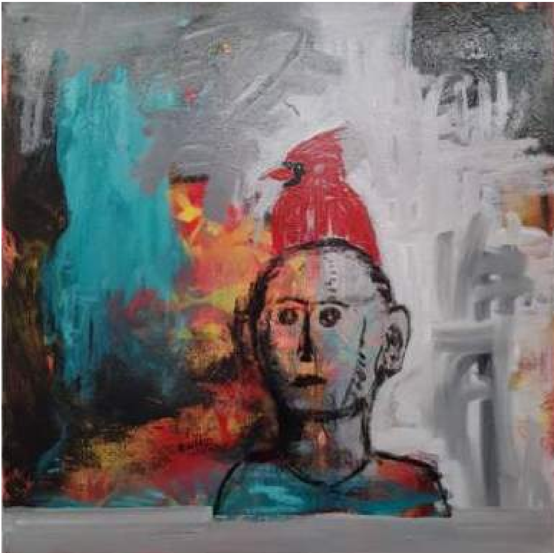
The angles are coming , 2021 Oil on canvas 23.62 x 23.62 in ( 60 x 60 cm )