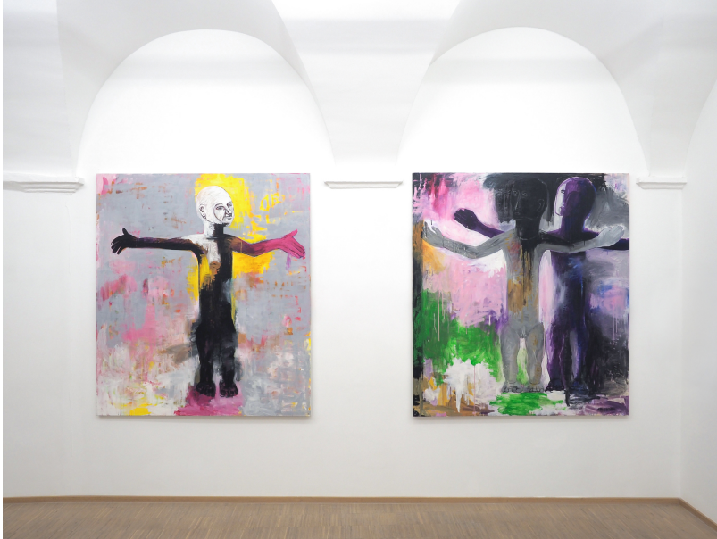
Aesthetic of Discomfort Exhibition View Nosbaum Reding, Luxembourg, 2021