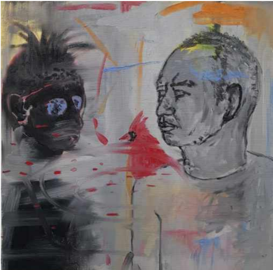
The angels are coming , 2021 Oil on canvas 19.69 x 19.69 in ( 50 x 50 cm )