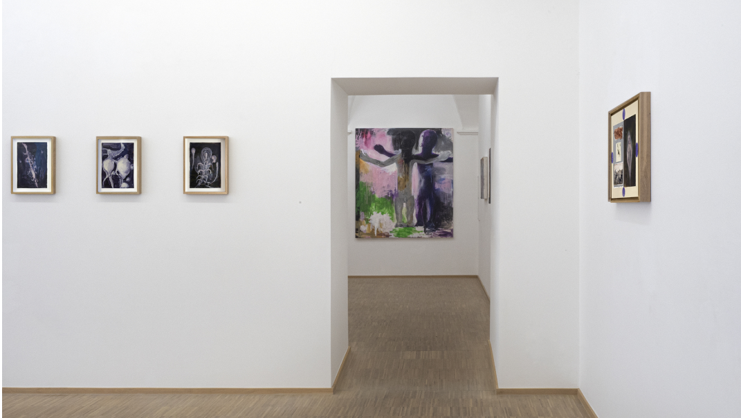
Aesthetic of Discomfort Exhibition View Nosbaum Reding, Luxembourg, 2021