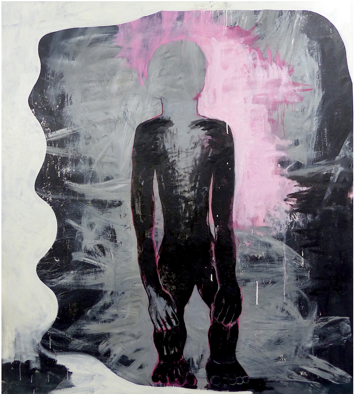
Sans titre , 2021 Oil on canvas 67.72 x 60.24 in ( 172,5 x 153 cm )