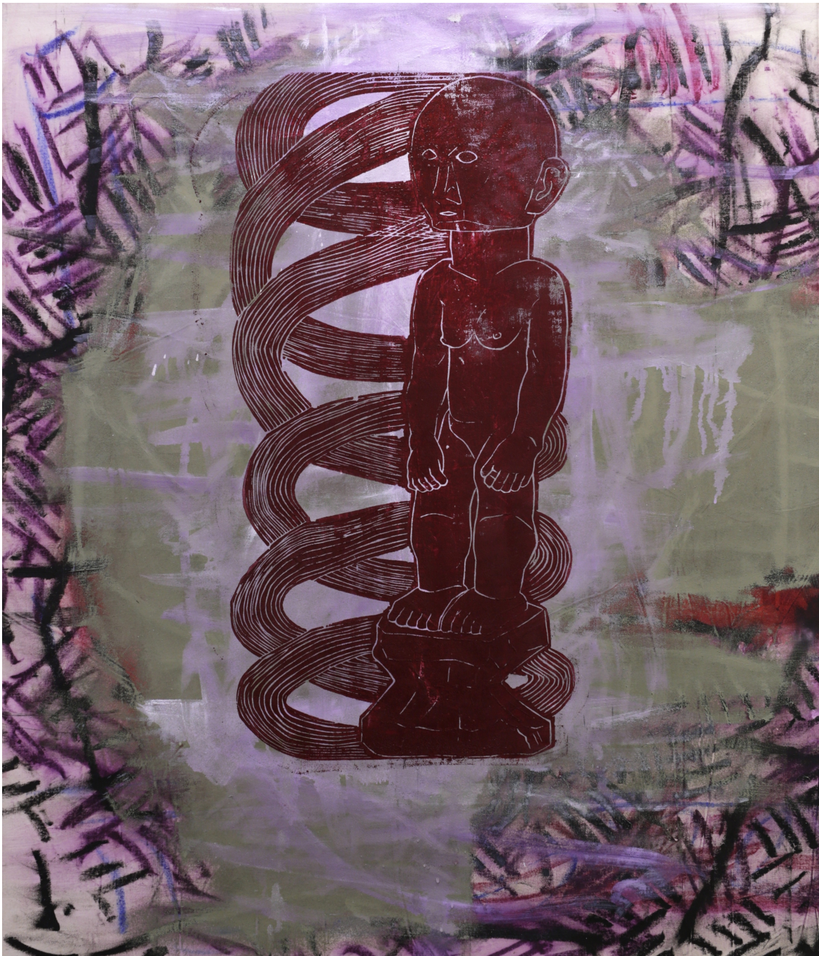
Sans titre , 2016 Oil on canvas 44.09 x 37.8 in ( 112 x 96 cm )