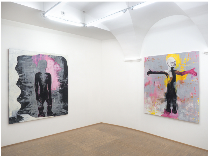
Aesthetic of Discomfort Exhibition View Nosbaum Reding, Luxembourg, 2021