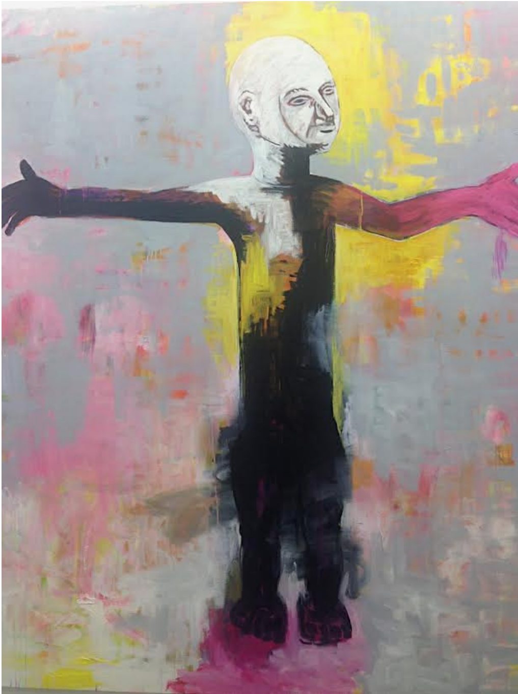
Sans titre , 2017 Oil on canvas 62.99 x 56.3 in ( 160 x 143 cm )