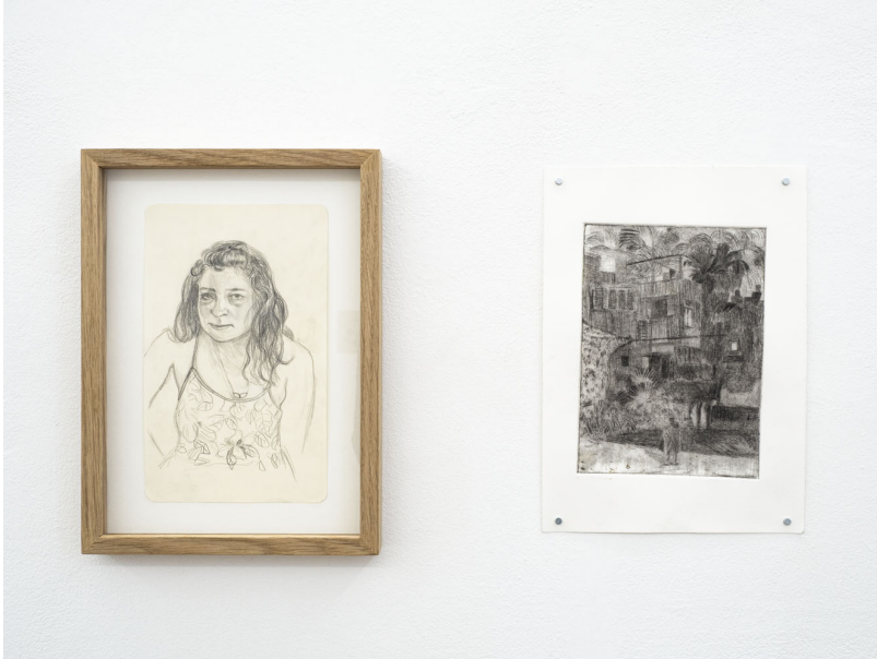
L'eau douce pénètre en profondeur Exhibition View Nosbaum Reding, Luxembourg, 2021