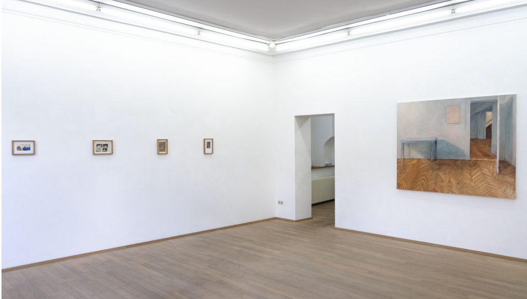
L'eau douce pénètre en profondeur Exhibition View Nosbaum Reding, Luxembourg, 2021