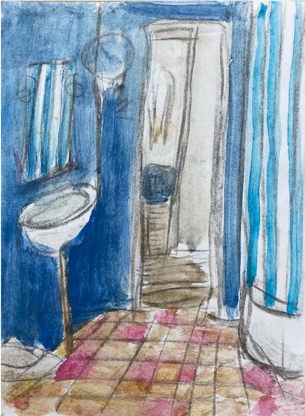
Esquisse pour la salle de bain , 2016 watercolor on paper 6.69 x 5.12 in ( 17,4 x 13 cm )