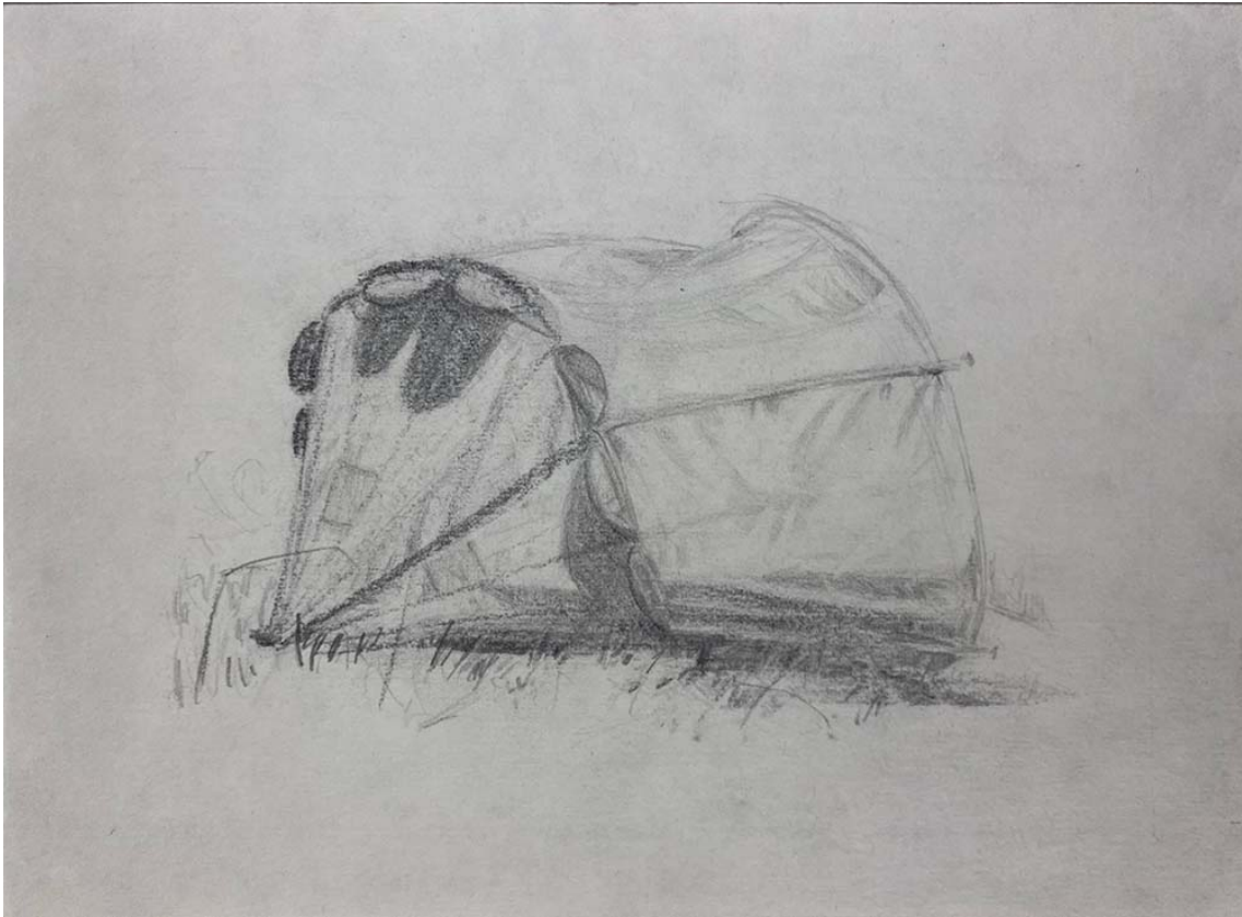
Bedstuy , 2015 Charcoal on paper 8.27 x 11.42 in ( 21 x 29,6 cm )