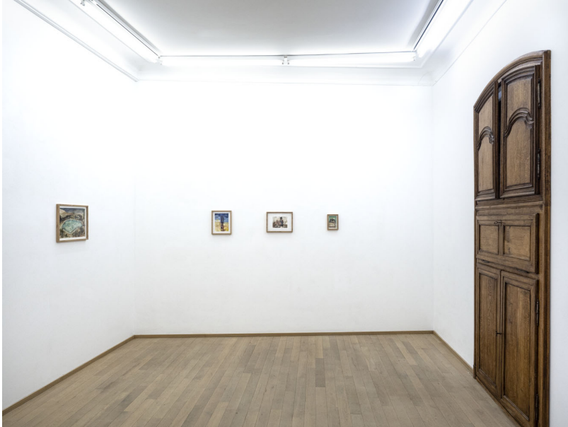
L'eau douce pénètre en profondeur Exhibition View Nosbaum Reding, Luxembourg, 2021