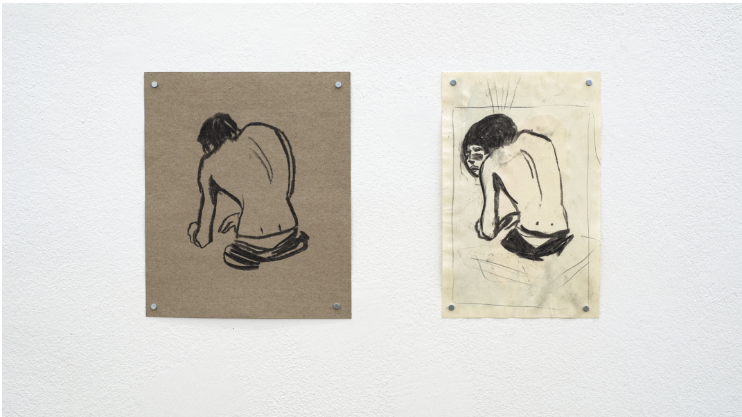
L'eau douce pénètre en profondeur Exhibition View Nosbaum Reding, Luxembourg, 2021