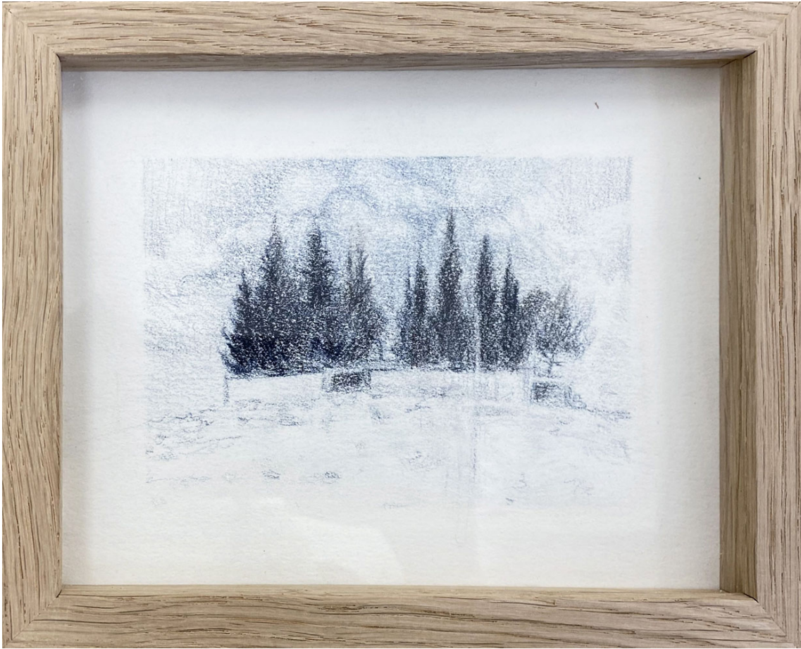
Cyprés version , 2018 Pencils on paper 5.12 x 6.69 in ( 13,5 x 17,2 cm )