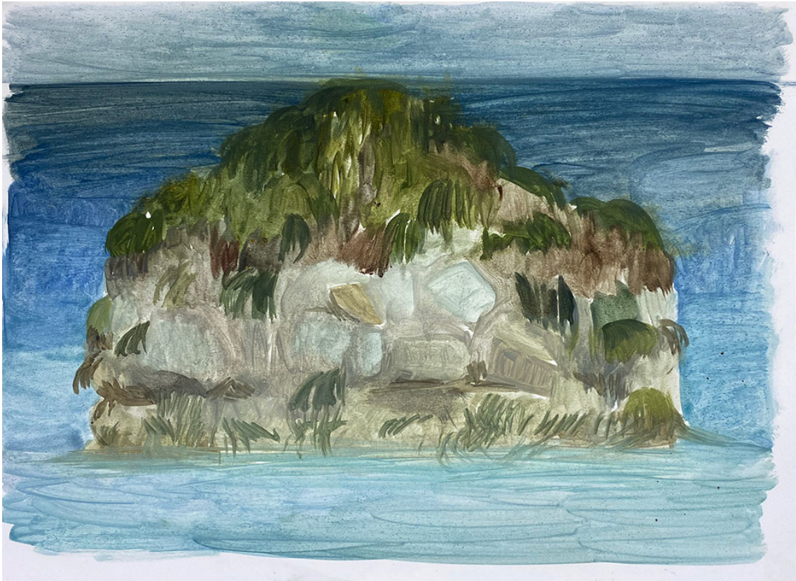
Ile à Paxos (la possible île) , 2020 Oil on paper 9.84 x 13.39 in ( 25 x 34 cm )