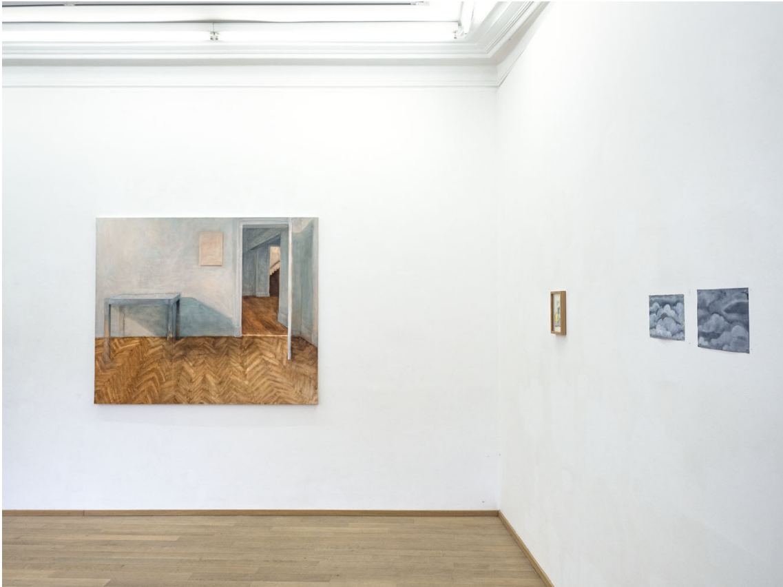
L'eau douce pénètre en profondeur Exhibition View Nosbaum Reding, Luxembourg, 2021