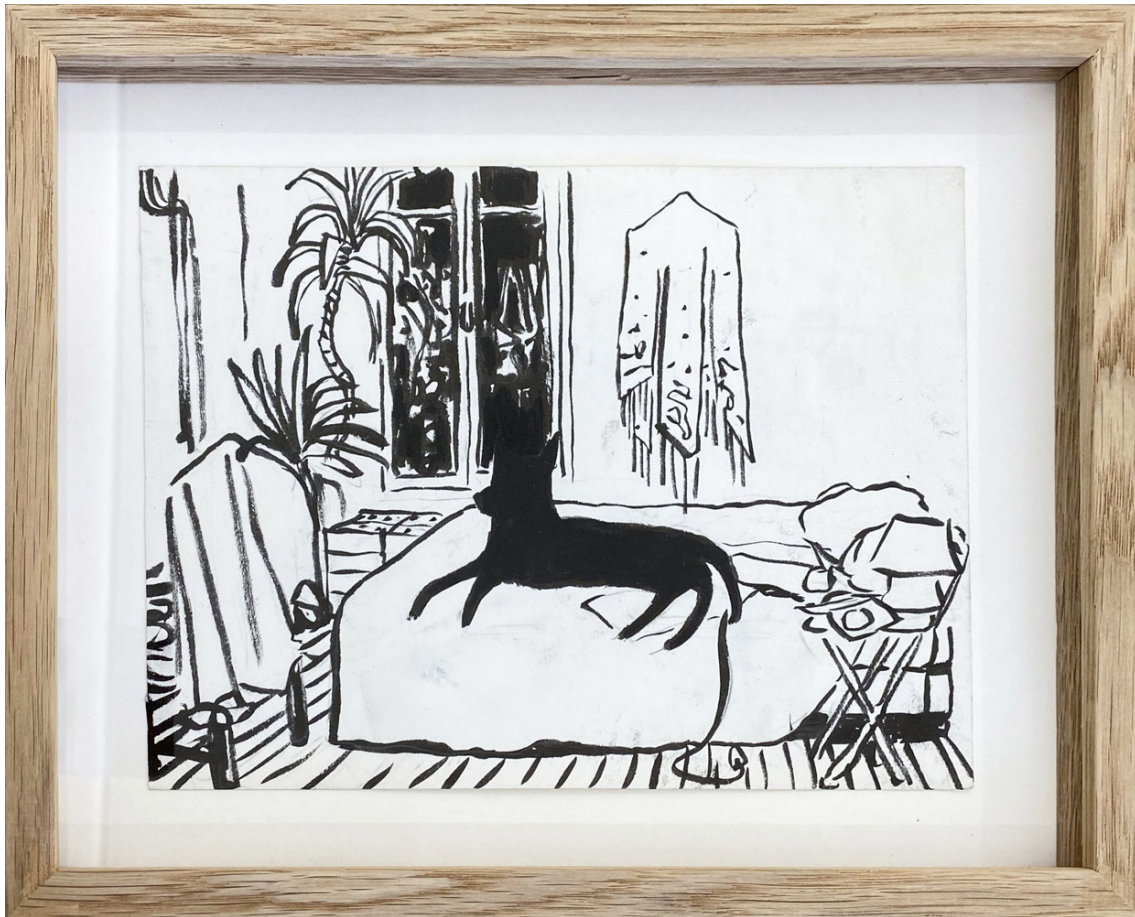
Shahar Ink on paper 6.3 x 8.27 in ( 16,3 x 21,5 cm )