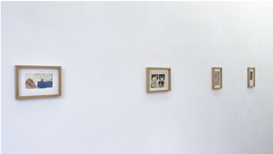
L'eau douce pénètre en profondeur Exhibition View Nosbaum Reding, Luxembourg, 2021