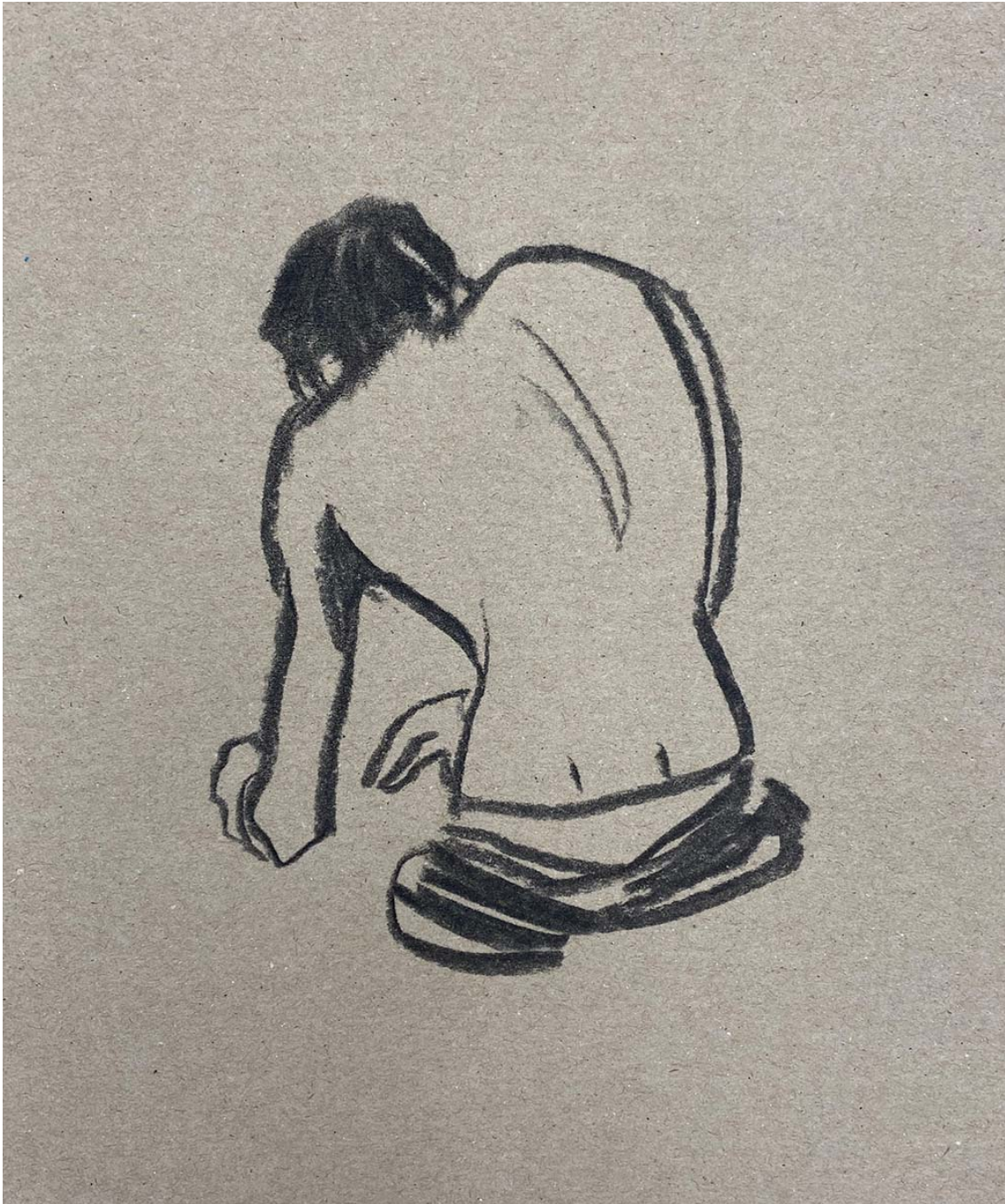
Monstre 2 , 2015 Charcoal on paper 8.27 x 6.69 in ( 21 x 17,4 cm )

Gallery Nosbaum Reding 2 + 4, rue Wiltheim L-2733 Luxembourg / T (+352) 28 11 25 1 / reding@nosbaumreding.com