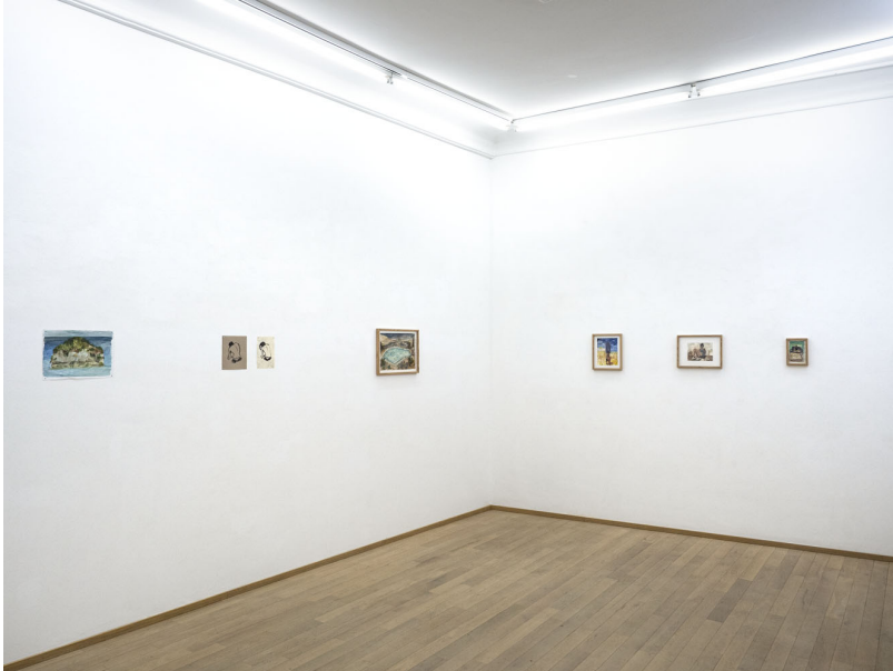
L'eau douce pénètre en profondeur Exhibition View Nosbaum Reding, Luxembourg, 2021