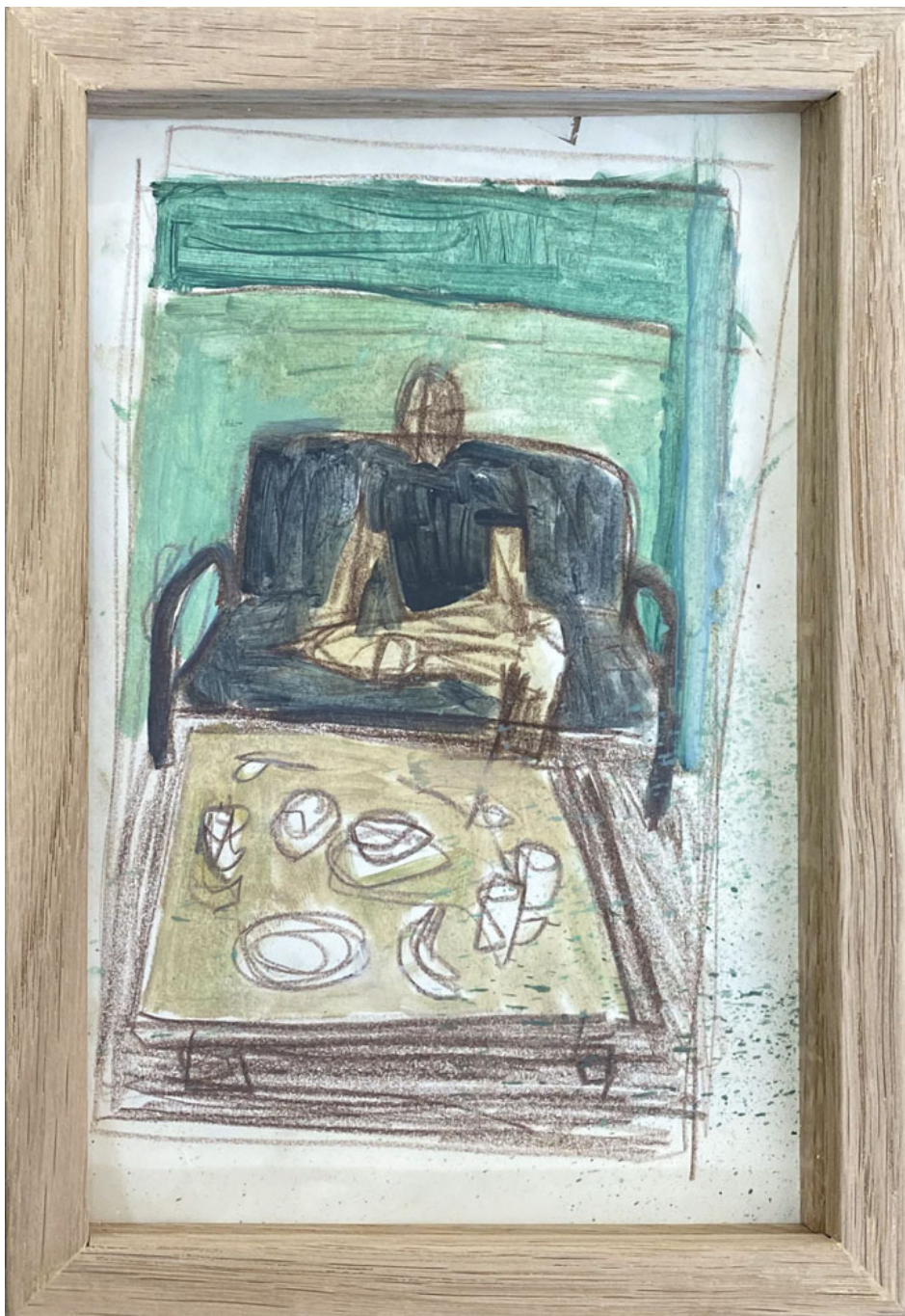
Esquisse pour Max , 2016 Huile et crayon sur papier 7.09 x 4.72 in ( 18,8 x 12,8 cm )