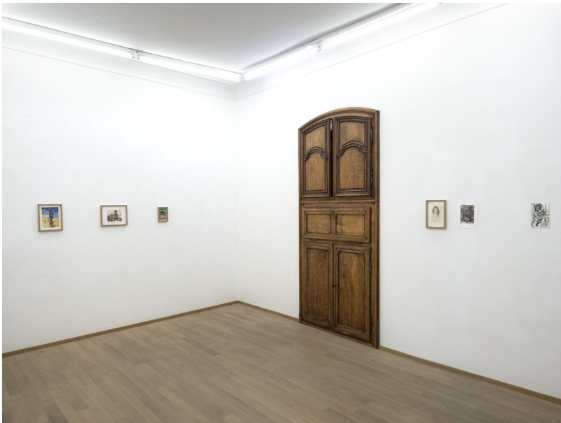
L'eau douce pénètre en profondeur Exhibition View Nosbaum Reding, Luxembourg, 2021