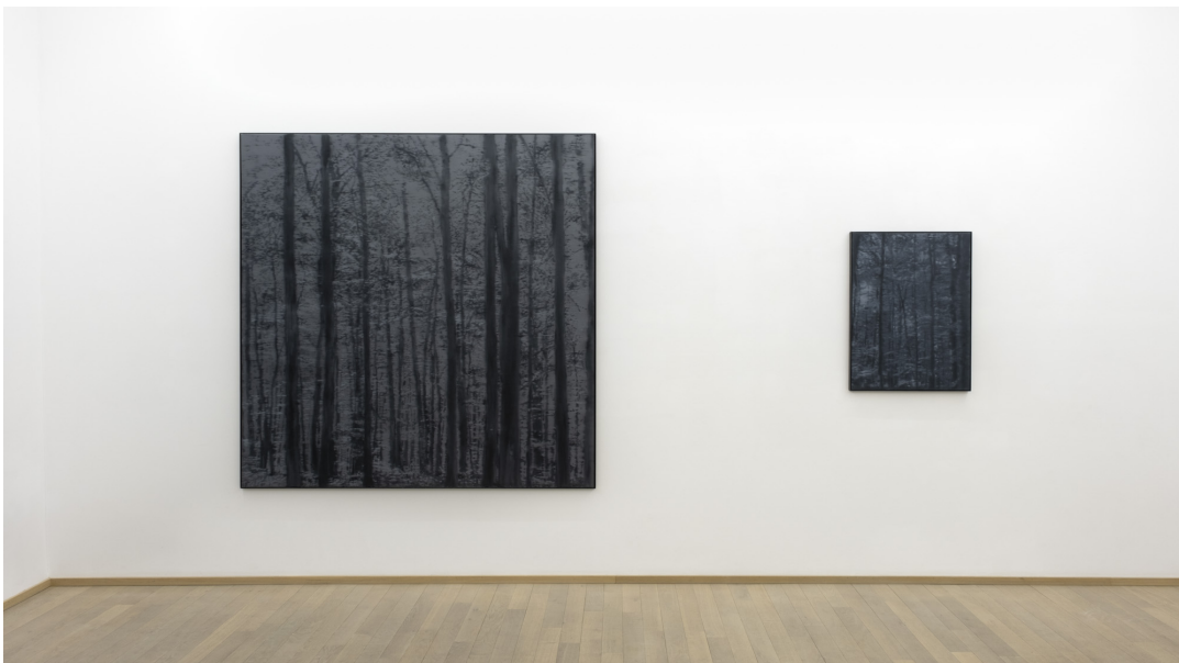
Abundance Exhibition View Nosbaum Reding, Luxembourg, 2022