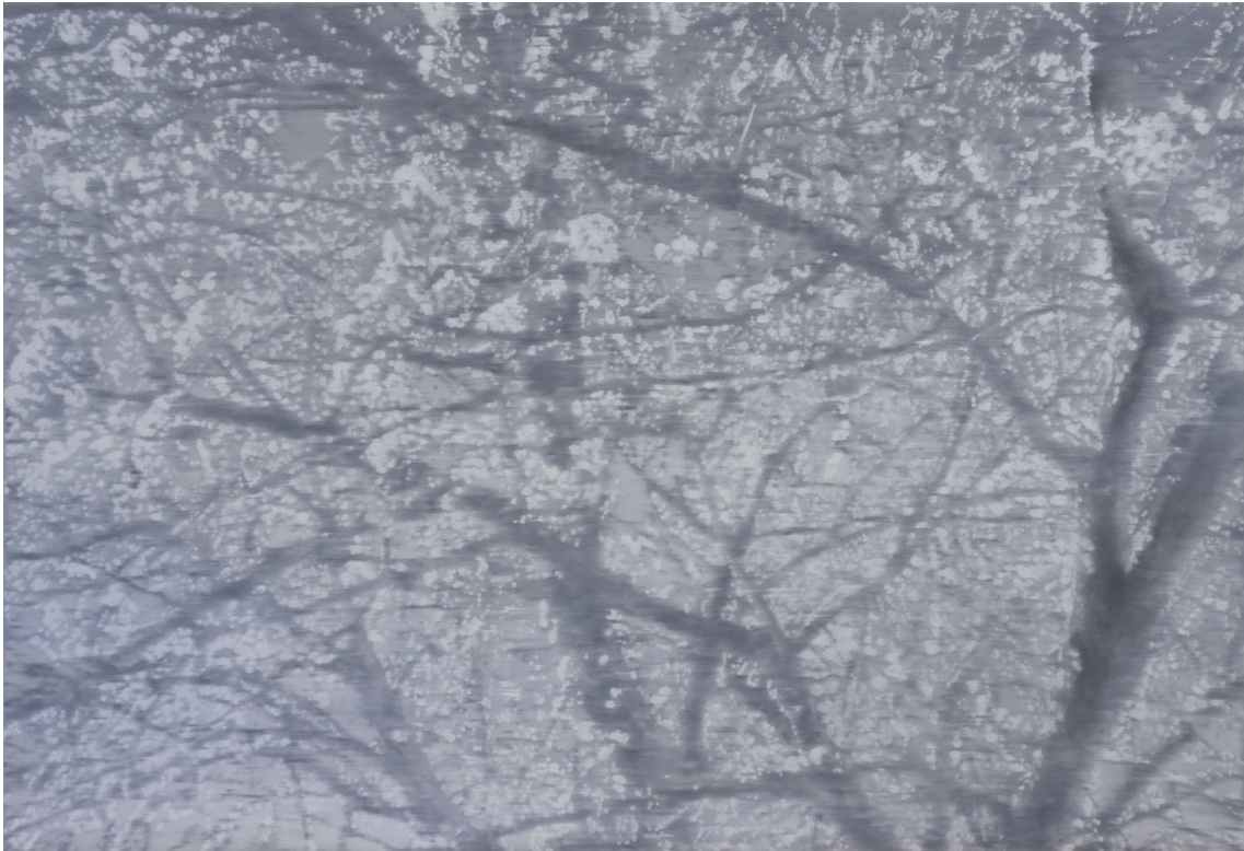
Untitled , 2021 Série "Abundance" Oil on canvas 35.43 x 51.18 in ( 90 x 130 cm )