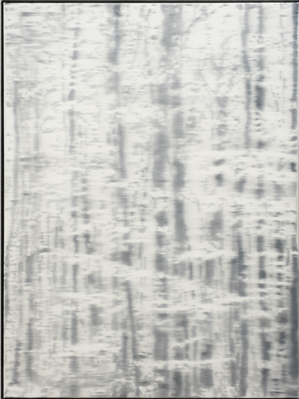
Untitled , 2021 Série "Abundance" Oil on canvas 31.5 x 23.62 in ( 80 x 60 cm )