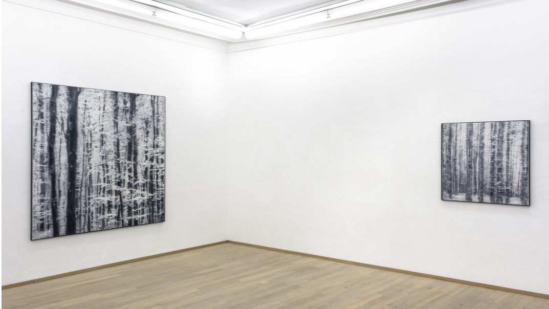
Abundance Exhibition View Nosbaum Reding, Luxembourg, 2022