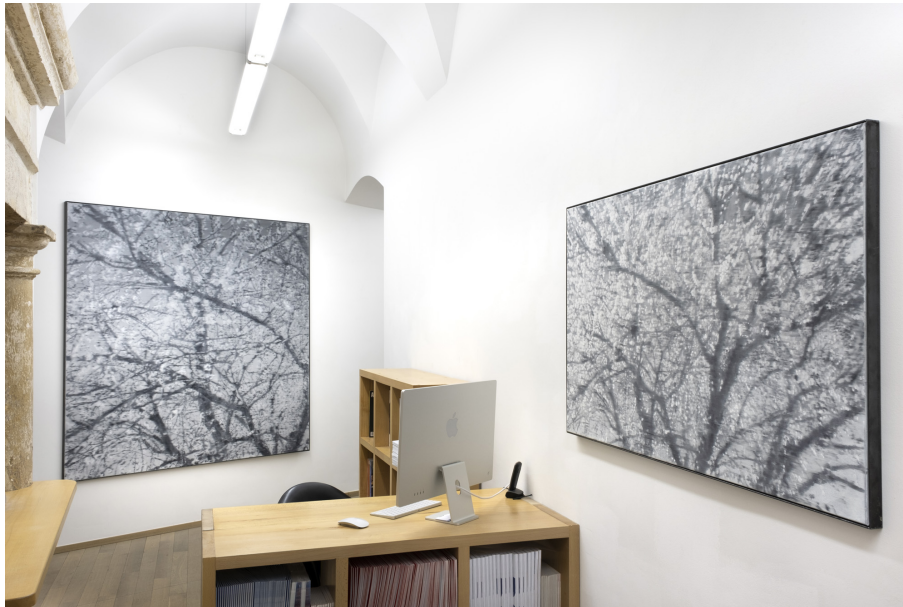
Abundance Exhibition View Nosbaum Reding, Luxembourg, 2022