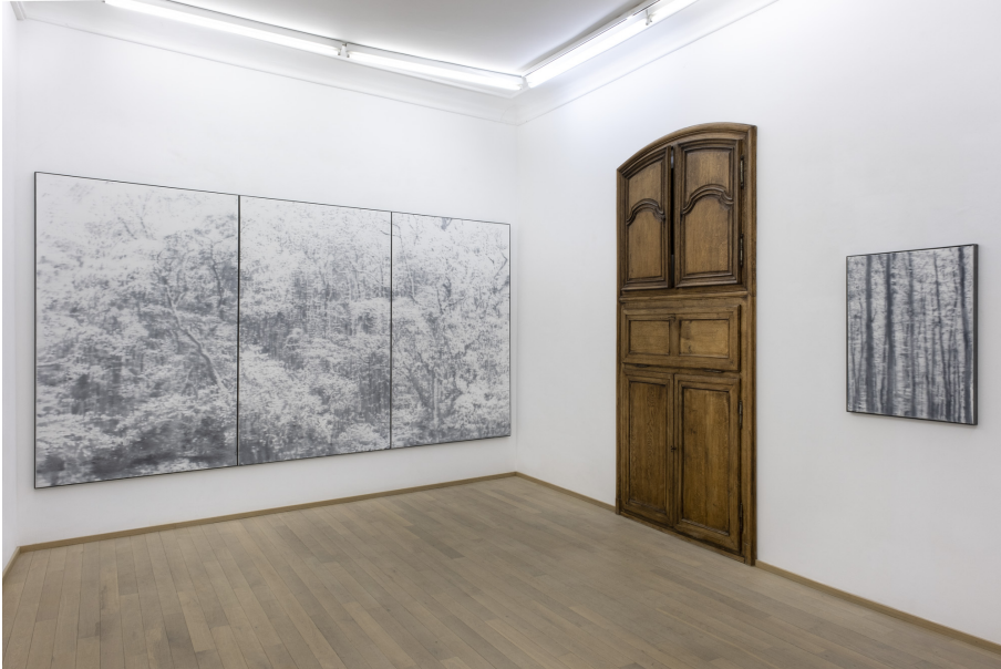
Abundance Exhibition View Nosbaum Reding, Luxembourg, 2022