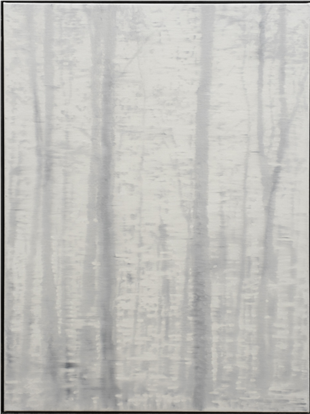
Untitled , 2021 Série "Abundance" Oil on canvas 31.5 x 23.62 in ( 80 x 60 cm )