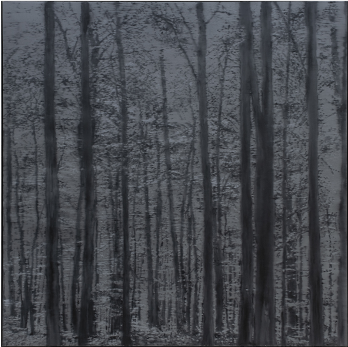
Untitled , 2021 Série "Abundance" Oil on canvas 70.87 x 70.87 in ( 180 x 180 cm )