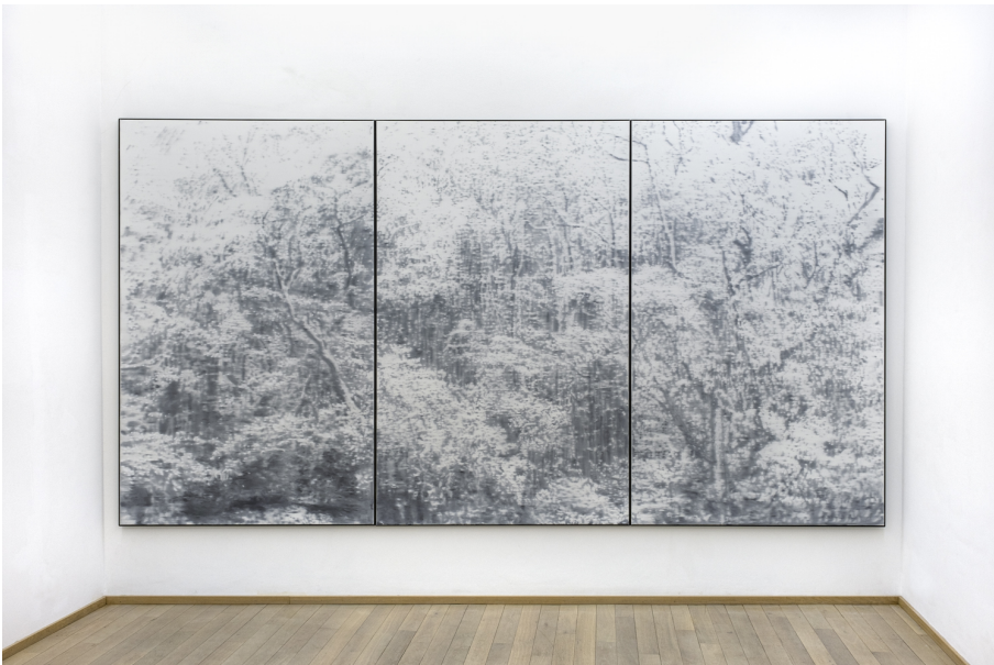
Abundance Exhibition View Nosbaum Reding, Luxembourg, 2022