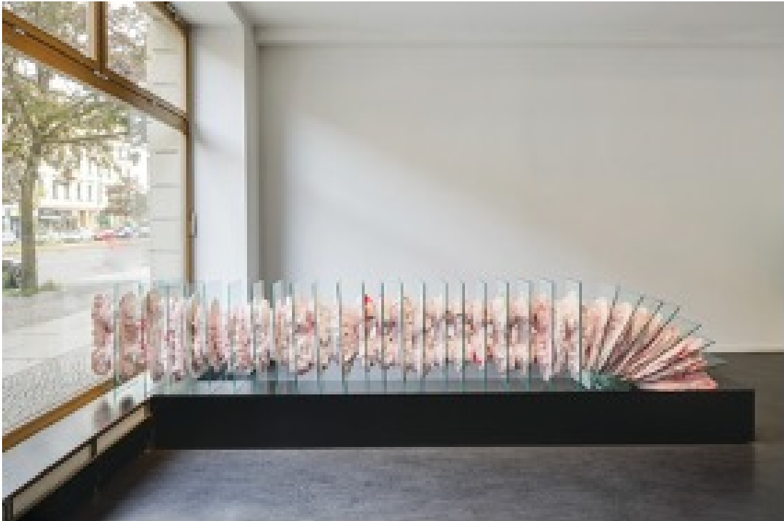
Infinity Jetzt! , 2014 Pigmented plaster, glass 27.56 x 11.81 x 124.8 in ( 70 x 30 x 317 cm )