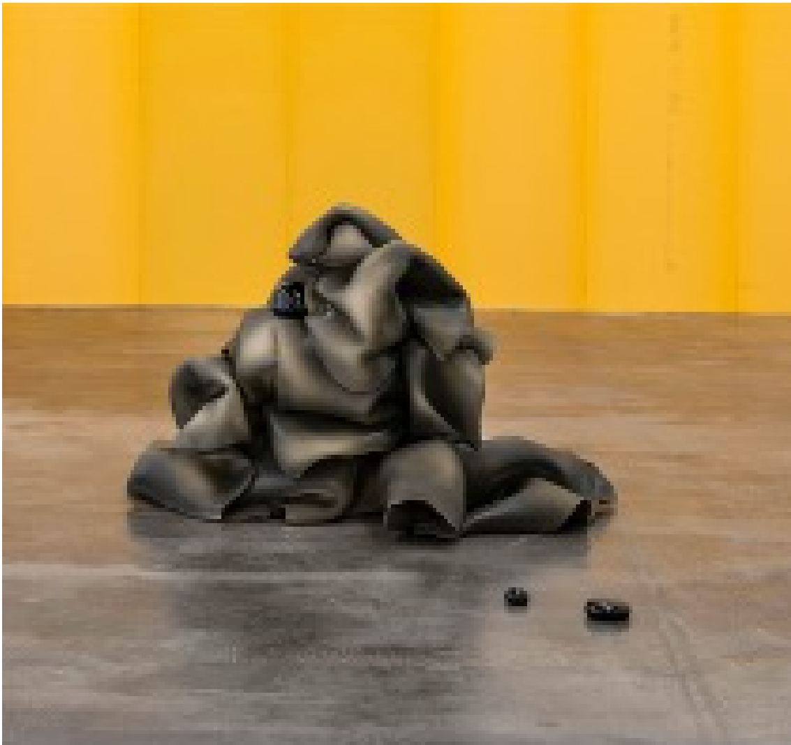
...into deliquescence , 2021 Ceramic, slip, glaze, glass 27.56 x 42.13 x 29.13 in ( 70 x 107 x 74 cm )