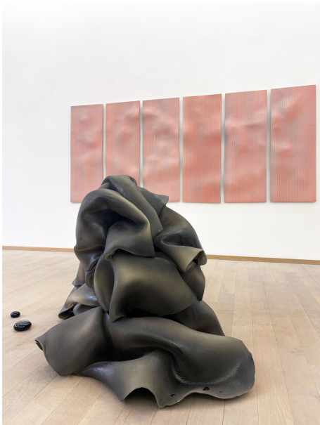
soft as a rock Exhibition View Nosbaum Reding, Luxembourg, 2022