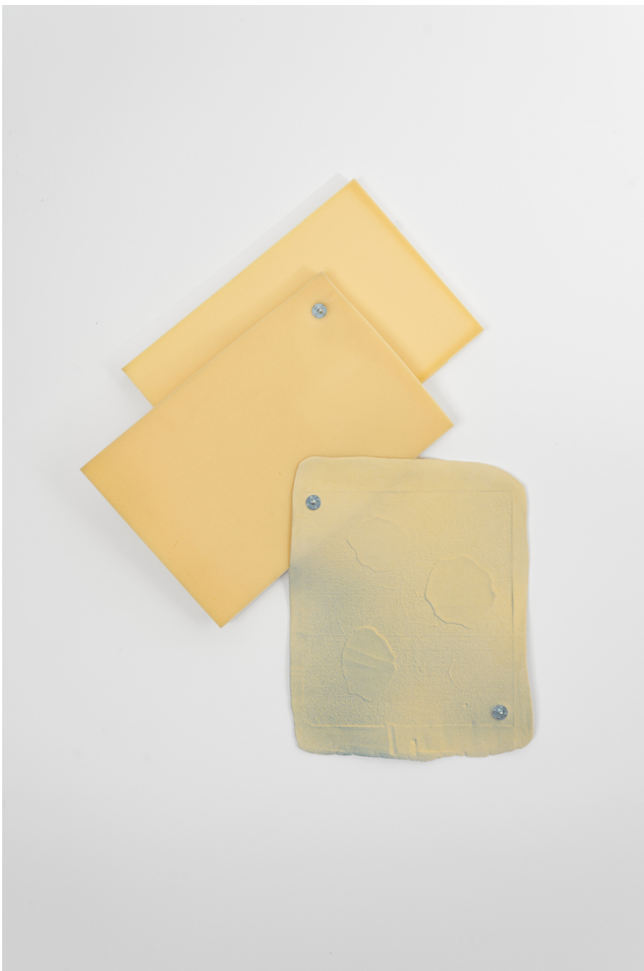
along the line , 2018 Glazed ceramic, PU foam, stainless steel bolts 34.25 x 37.8 x 2.76 in ( 87 x 96 x 7 cm )