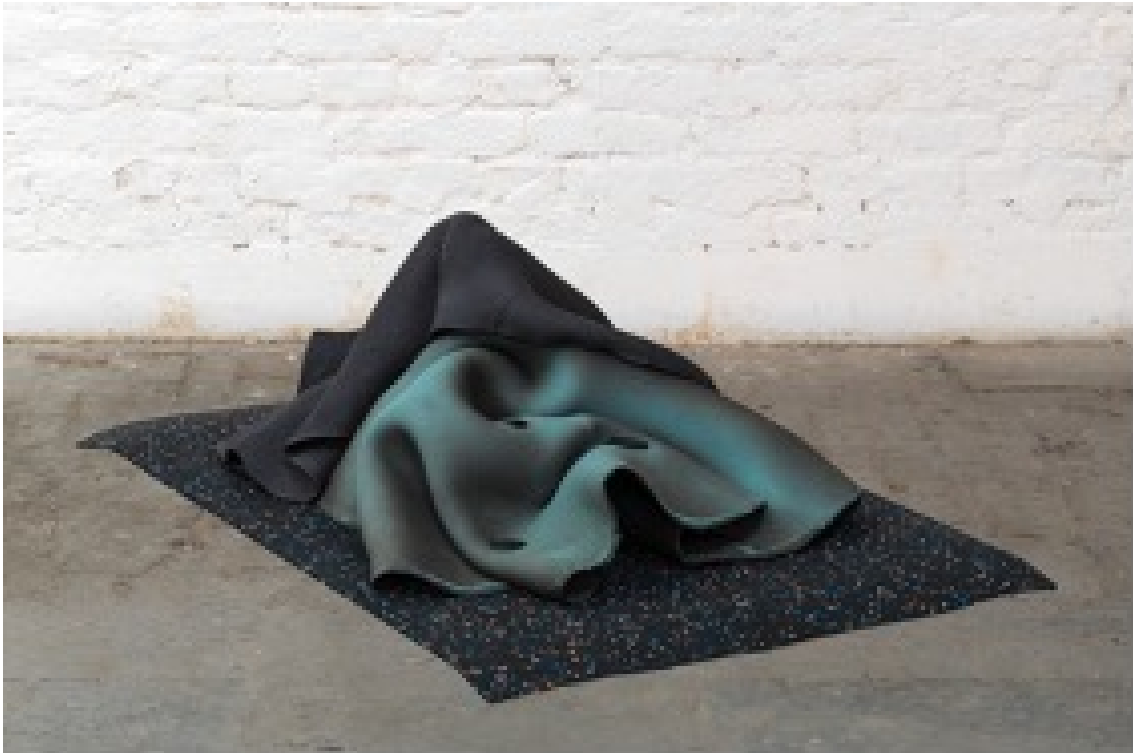
...into deliquescence , 2021 Ceramic, slip, glaze, recycled rubber 11.42 x 31.5 x 22.83 in ( 29 x 80 x 58 cm )