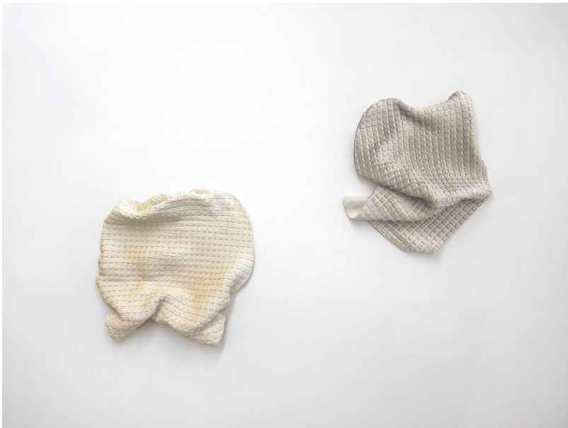
soft as a rock Exhibition View Nosbaum Reding, Luxembourg, 2022