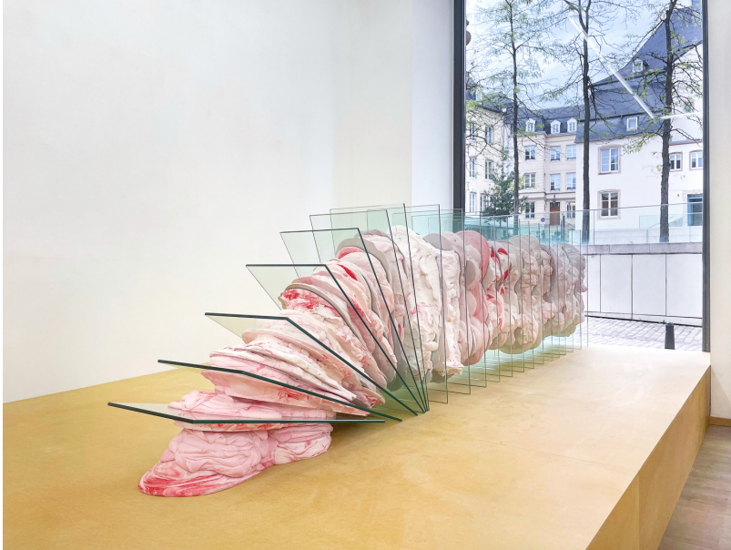
soft as a rock Exhibition View Nosbaum Reding, Luxembourg, 2022