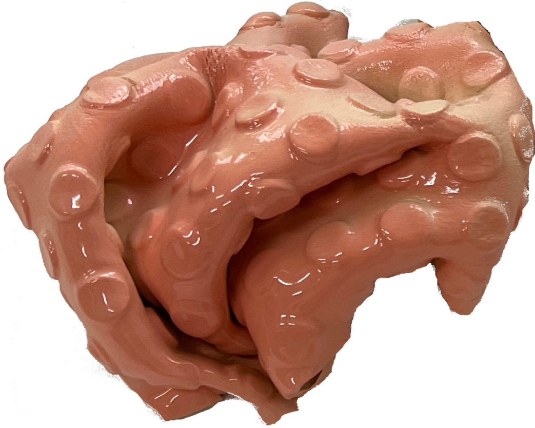
...into the peripheral, 2022 Glazed ceramic 6.89 x 6.5 x 3.74 in ( 17.5 x 16.5 x 9.5 cm )