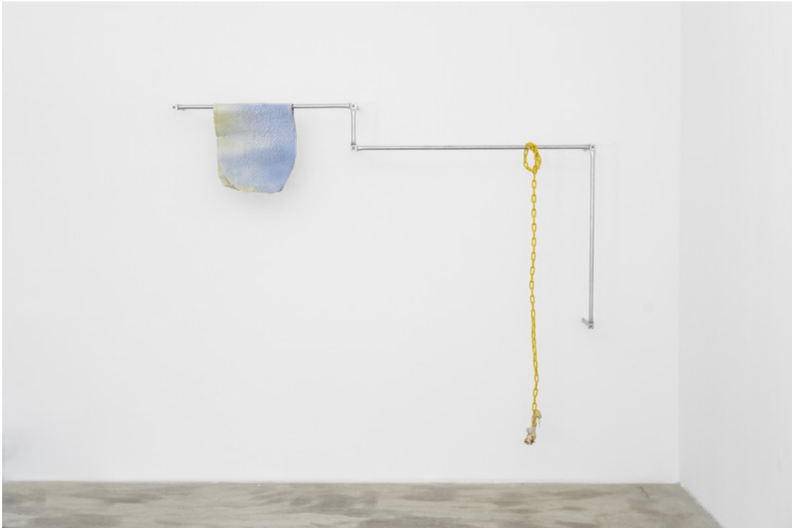
along the line , 2018

Glazed ceramic, aluminum, rubber coated chain, molten plastic, keys 82.68 x 87.8 x 12.2 in ( 210 x 223 x 31 cm )