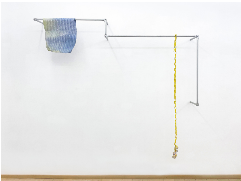
soft as a rock Exhibition View Nosbaum Reding, Luxembourg, 2022