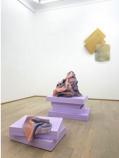
soft as a rock Exhibition View Nosbaum Reding, Luxembourg, 2022