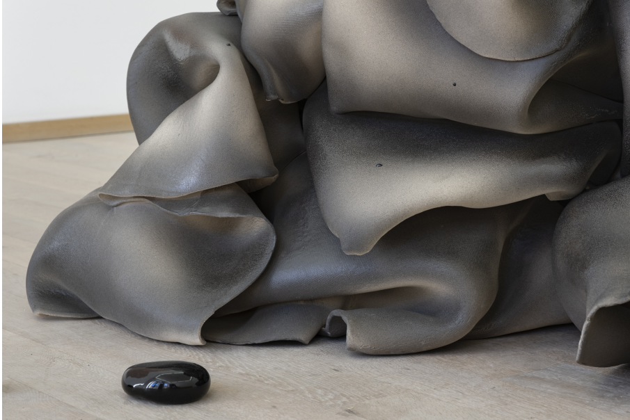
soft as a rock Exhibition View Nosbaum Reding, Luxembourg, 2022