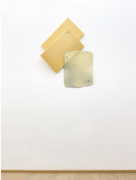
soft as a rock Exhibition View Nosbaum Reding, Luxembourg, 2022