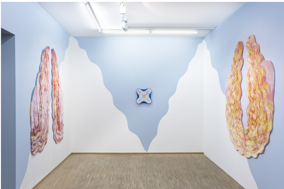
Unearthly Exhibition View Nosbaum Reding, Luxembourg, 2022