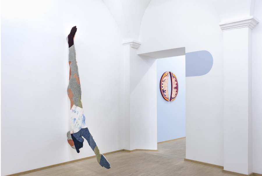
Unearthly Exhibition View Nosbaum Reding, Luxembourg, 2022