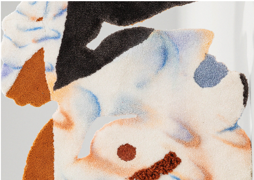
Uearthly Exhibition View Nosbaum Reding, Luxembourg, 2022