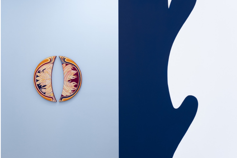
Unearthly Exhibition View Nosbaum Reding, Luxembourg, 2022