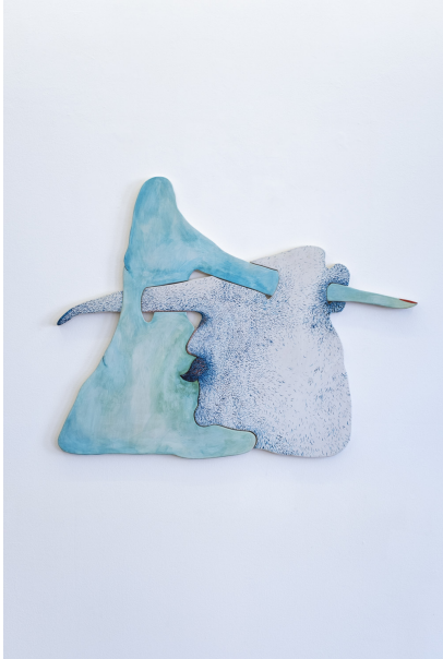
Uearthly Exhibition View Nosbaum Reding, Luxembourg, 2022