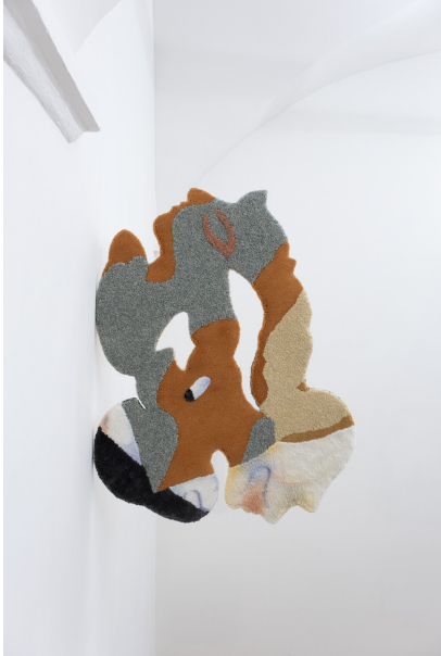
Uearthly Exhibition View Nosbaum Reding, Luxembourg, 2022