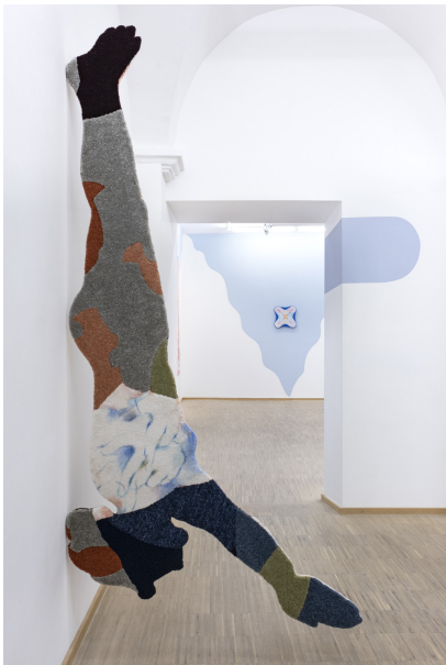
Uearthly Exhibition View Nosbaum Reding, Luxembourg, 2022