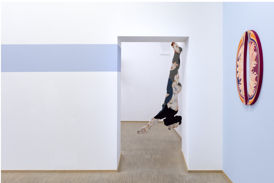
Unearthly Exhibition View Nosbaum Reding, Luxembourg, 2022