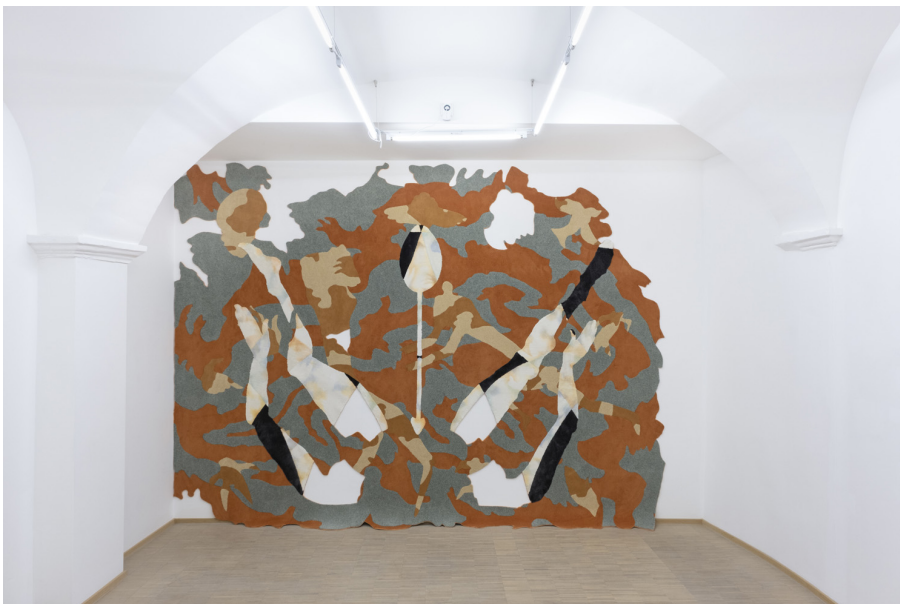
Unearthly Exhibition View Nosbaum Reding, Luxembourg, 2022