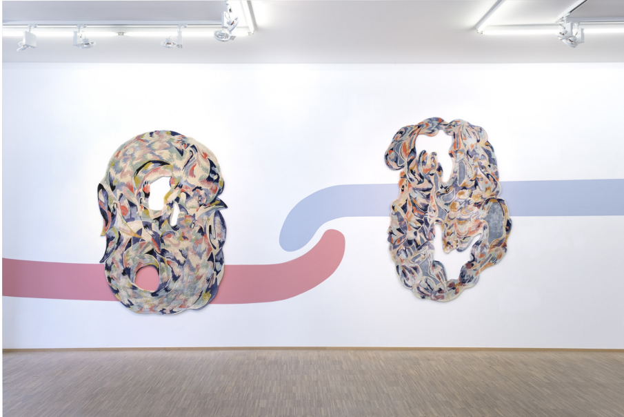
Unearthly Exhibition View Nosbaum Reding, Luxembourg, 2022