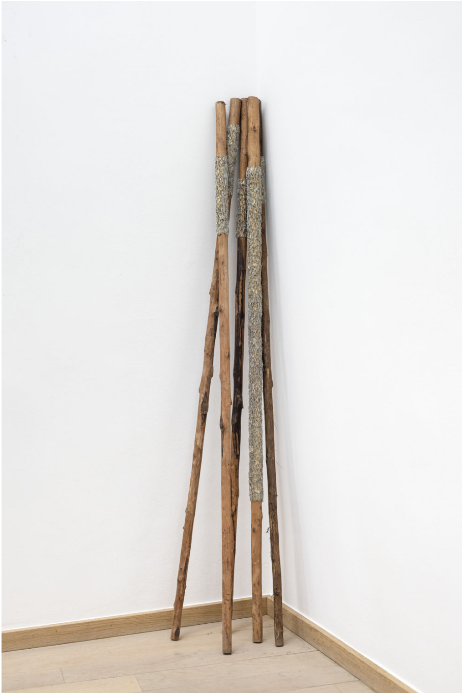
ibili !, 2022 5 Bois de chataîgnier, agrafes 46.46in ( 118cm )