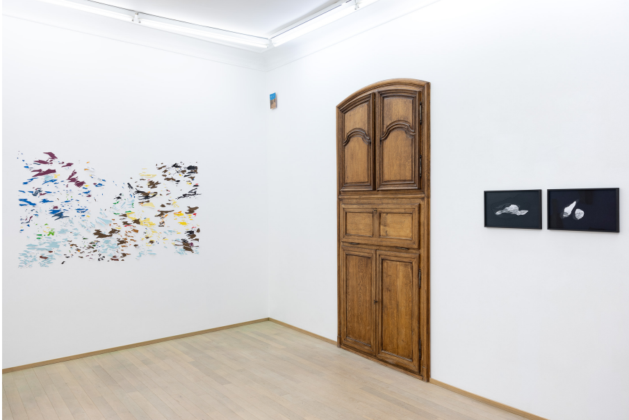
O salto Exhibition View Nosbaum Reding, Luxembourg, 2023