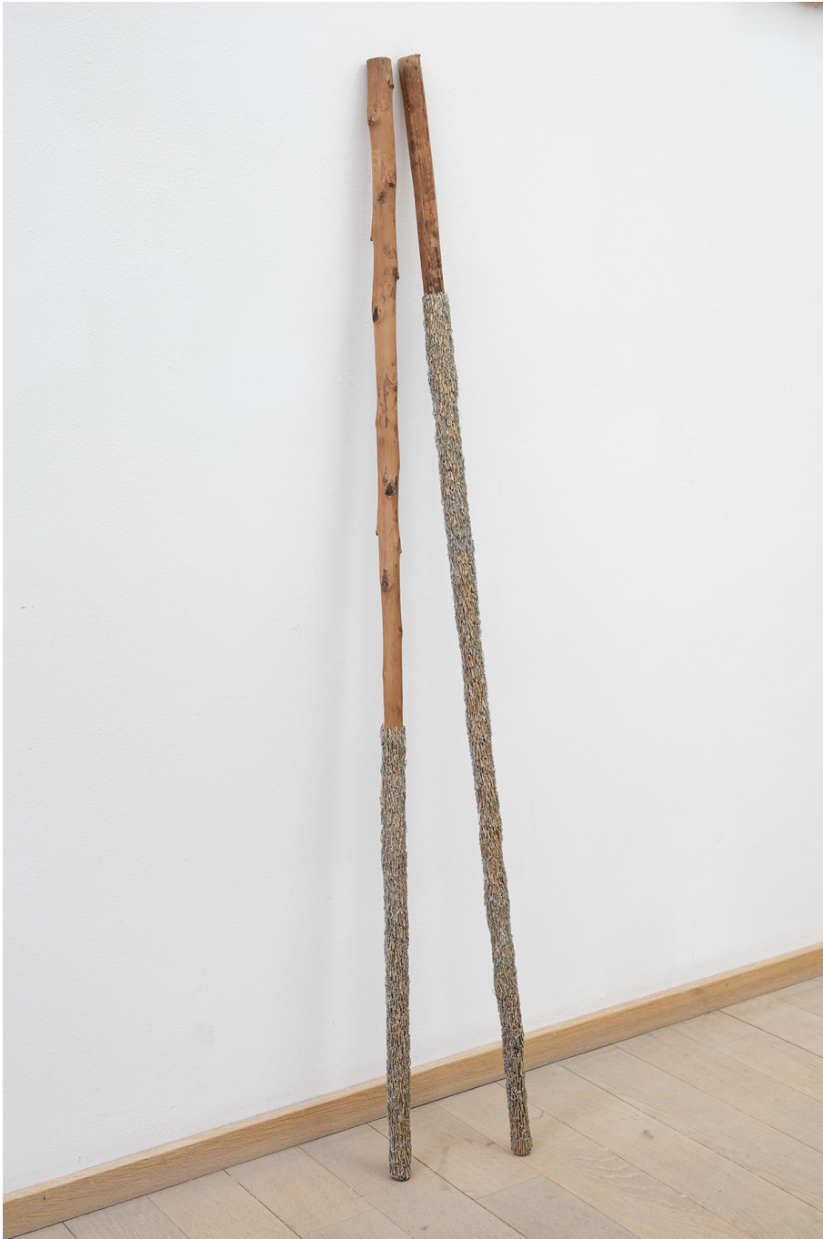
ibili ! , 2022 2 Bois de châtaignier, agrafes 46.46in ( 118cm )