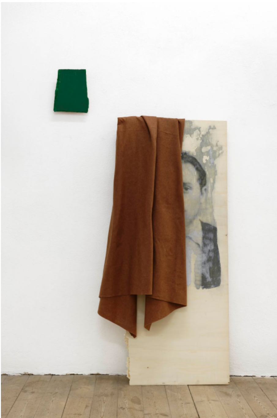
L'invention du courage (o salto), H, 2021 Acrylic, photographic transfer 24.02 x 60.24 x 1.18 in ( 61 x 153 x 3 cm )