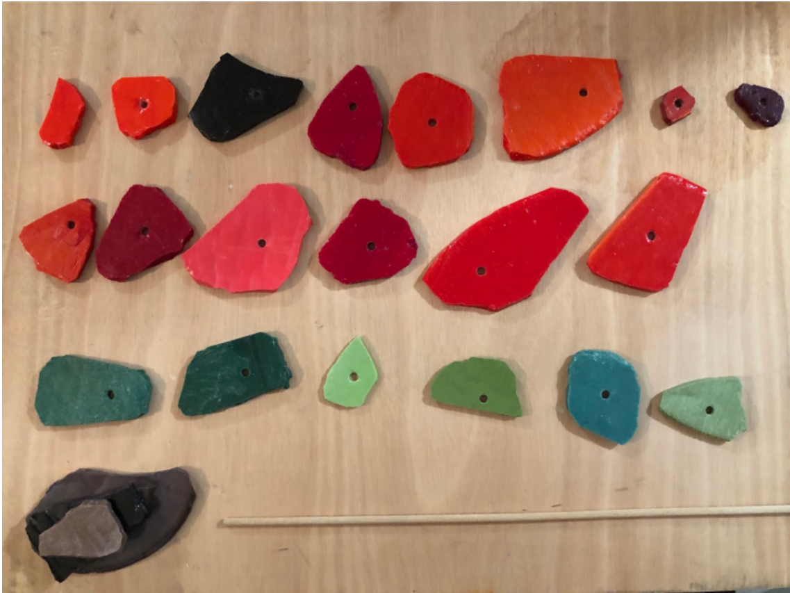
Nigritelle de Rellikon (Gymnadenia nigra) , 2023 pâte de verre coloré, hêtre