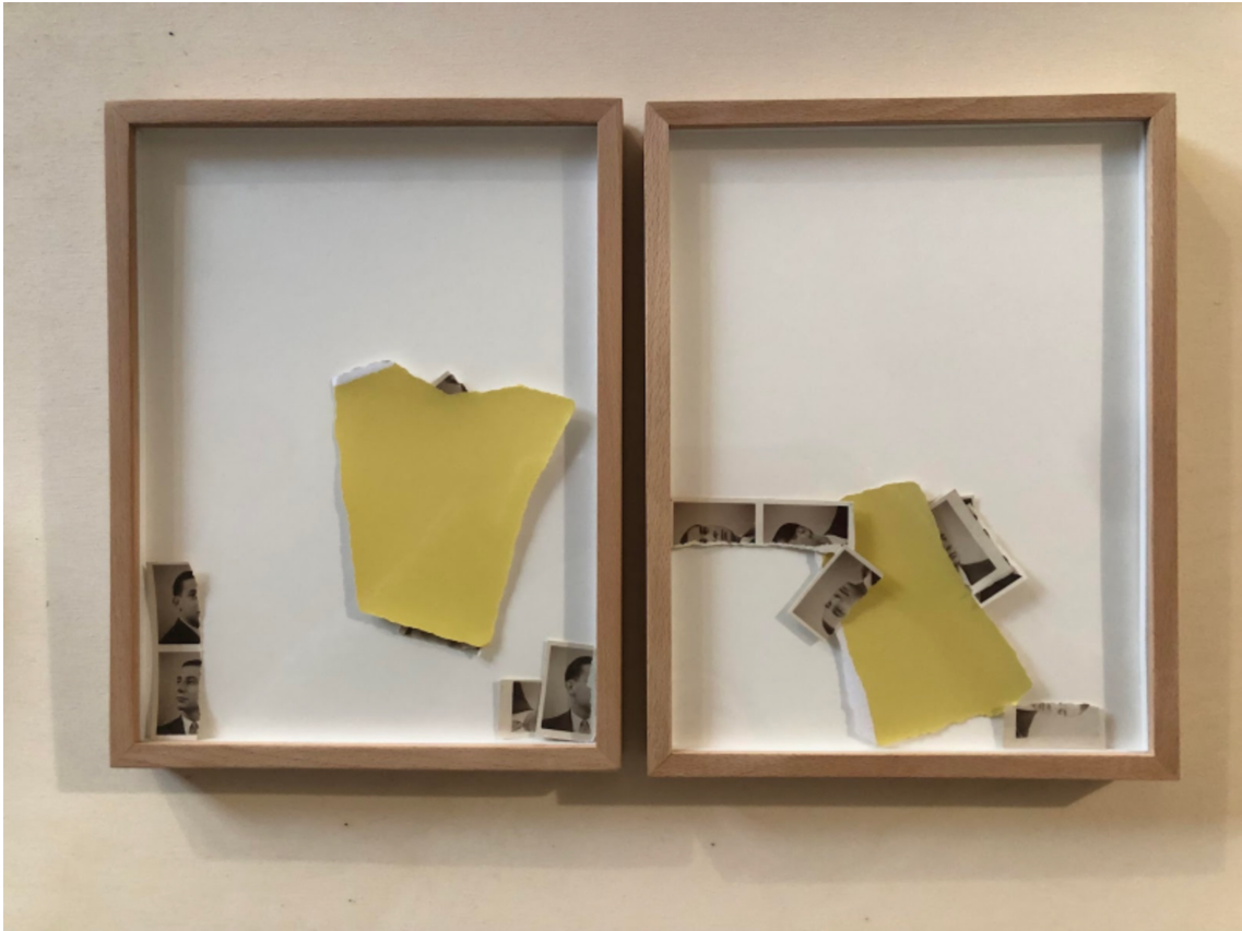
Toute la vie du visage (dyptique) , 2023 Acrylic on paper, photo of torn identities 7.87 in ( dyptique : 25,8 x 20 cm )