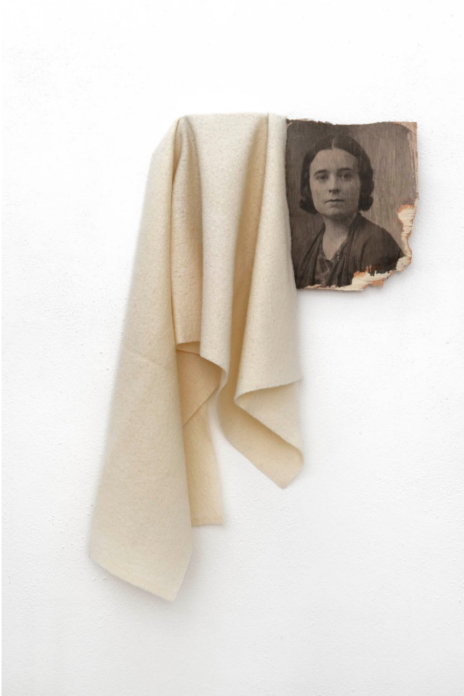
L'invention du courage (o salto), LL, 2021 Acrylic, photographic transfer 16.93 x 12.2 x 1.18 in ( 43 x 31 x 3 cm )