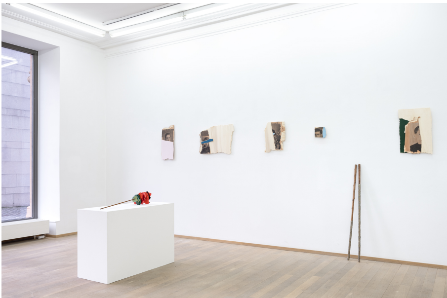
O salto Exhibition View Nosbaum Reding, Luxembourg, 2023