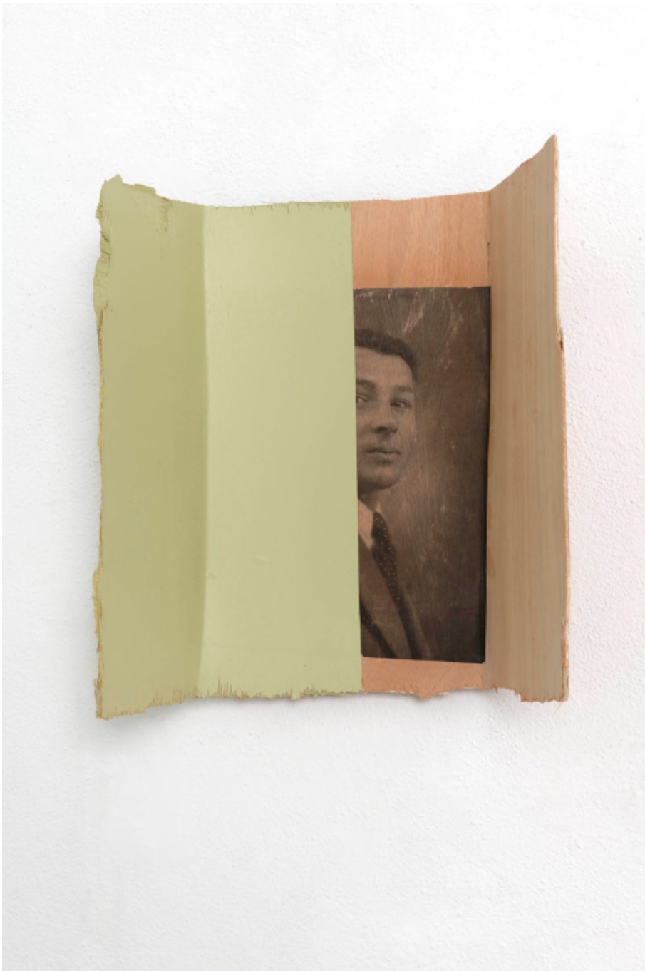
L'invention du courage (o salto), R, 2021 Acrylic, photographic transfer on wood 15.75 x 17.32 x 0.79 in ( 40 x 44 x 2,5 cm )