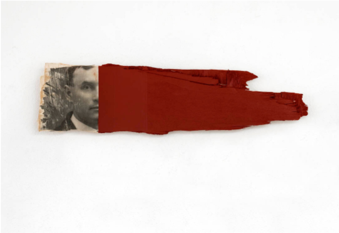
L'invention du courage (o salto), ARI, 2021 Acrylic, photographic transfer on wood 26.77 x 6.69 x 0.79 in ( 68,5 x 17,5 x 2,5 cm )