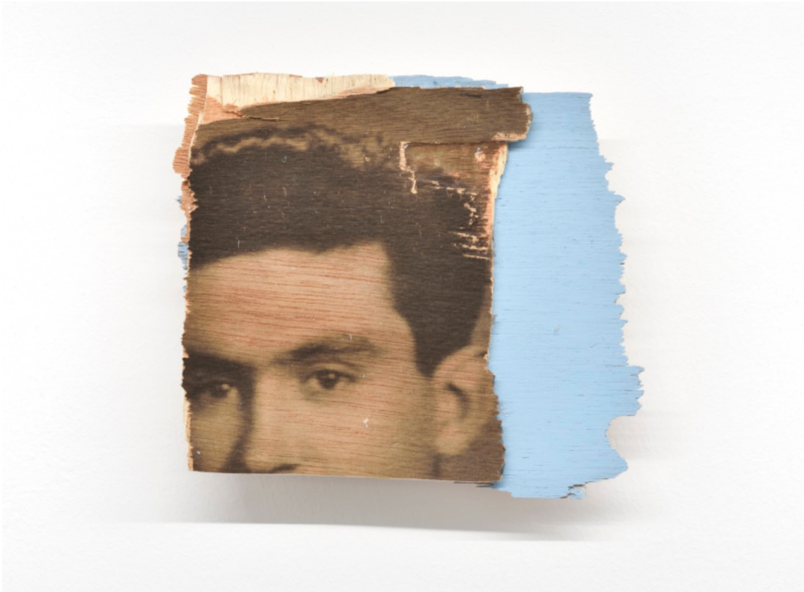
L'invention du courage (o salto), CR2, 2021 Acrylic, photographic transfer on wood 5.91 x 5.51 x 0.79 in ( 15 x 14 x 2,5 cm )