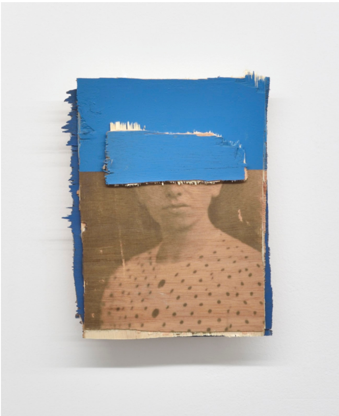
L'invention du courage (o salto), PEPO, 2022 Acrylic, photographic transfer on wood 7.87 x 5.91 x 1.18 in ( 20 x 15,5 x 3 cm )