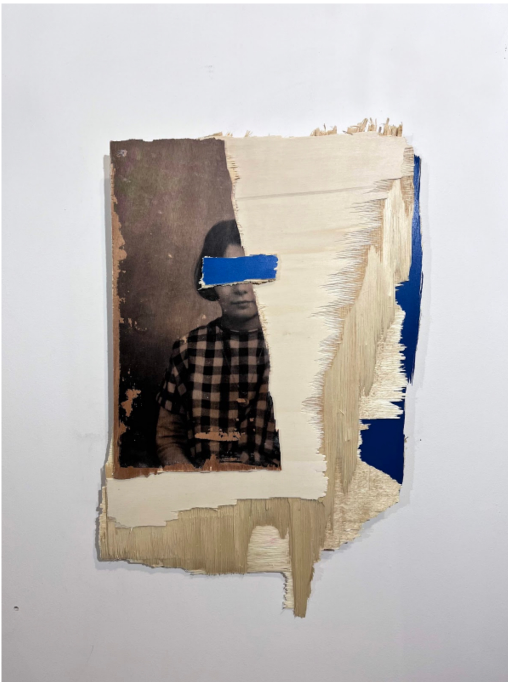
L'invention du courage (o salto), GVI, 2023 Acrylic, photographic transfer 12.6 x 17.72 x 4.72 in ( 32 x 45 x 12,5 cm )