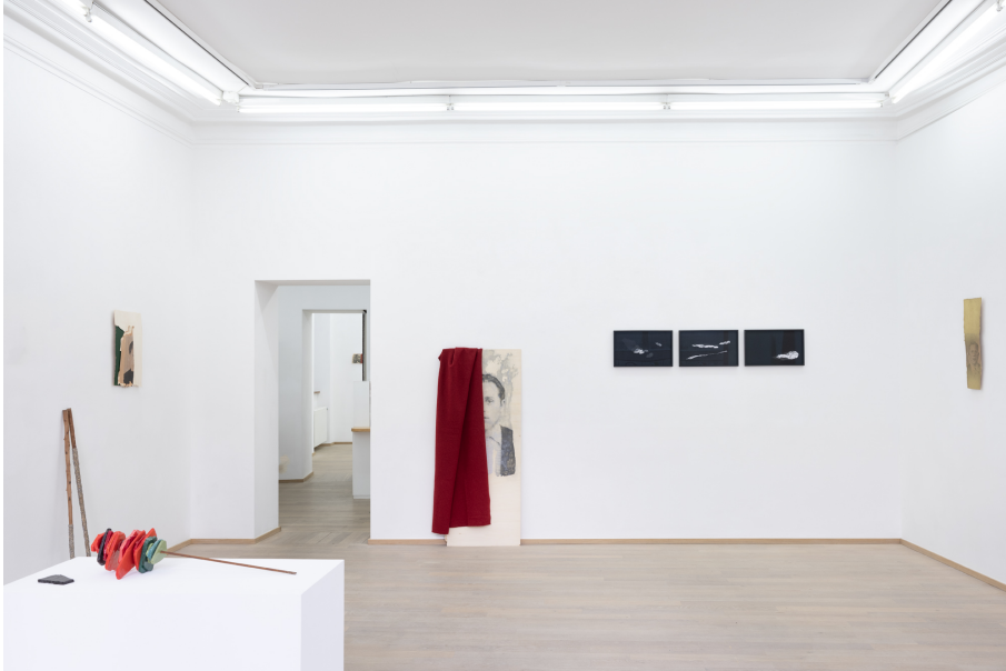
O salto Exhibition View Nosbaum Reding, Luxembourg, 2023