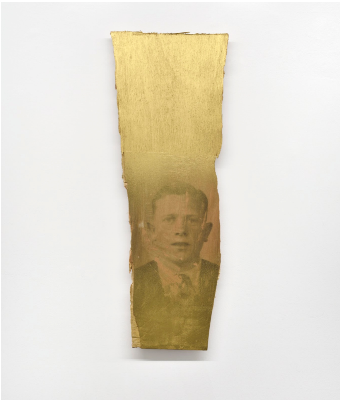
L'invention du courage (o salto), ORO, 2022 Acrylic, photographic transfer 23.23 x 8.66 x 0.79 in ( 59,2 x 22 x 2,5 cm )