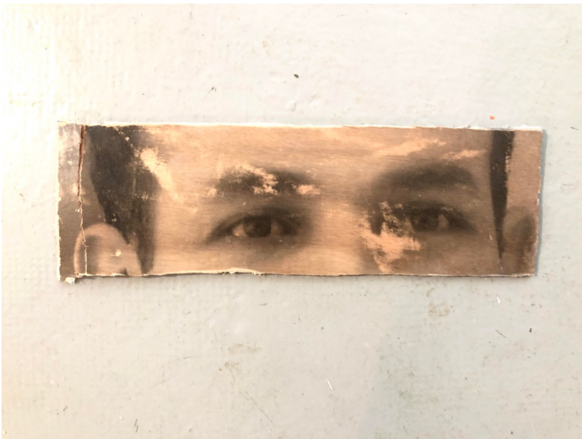
L'invention du courage (o salto), LSY, 2022 Acrylic, photographic transfer 16.14 x 5.12 x 0.79 in ( 41 x 13 x 2,5 cm )