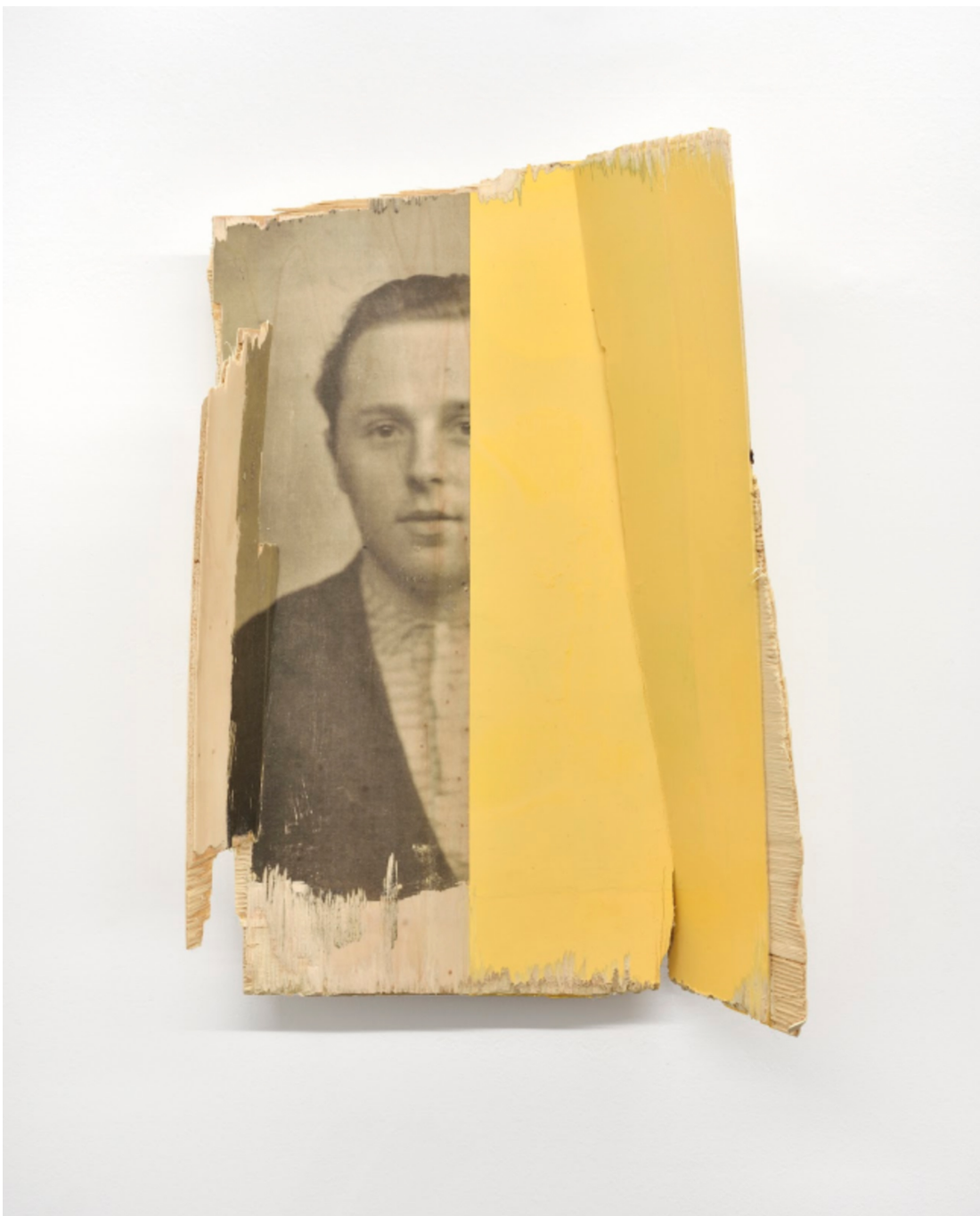
L'invention du courage (o salto), HH (jaune), 2021 Acrylic, photographic transfer 12.6 x 17.72 x 4.72 in ( 32 x 45 x 12,5 cm )