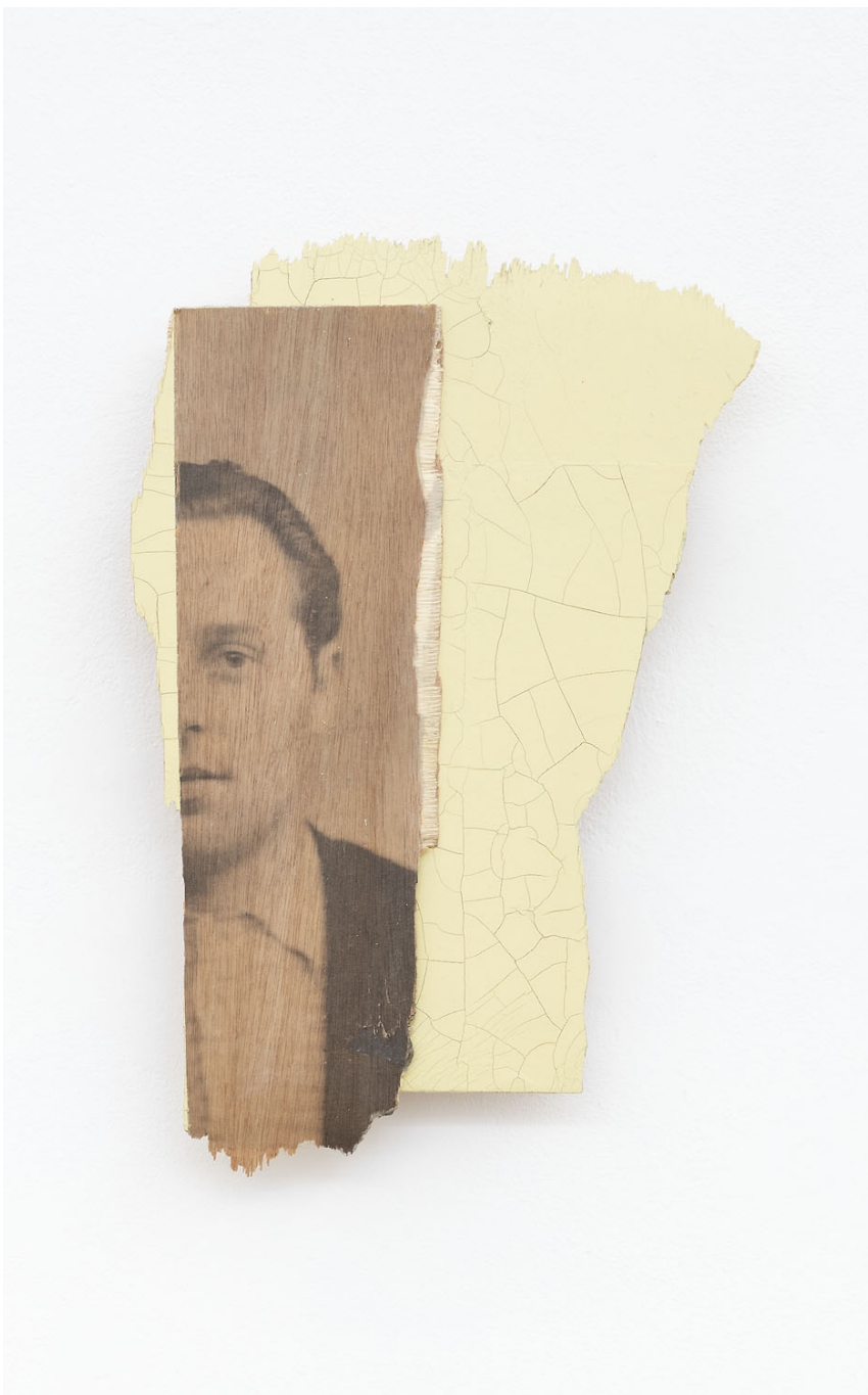
L'invention du courage (o salto) , FRA, 2022 Acrylic, photographic transfer on wood 19.29 x 12.2 x 0.79 in ( 49 x 31 x 2,5 cm )