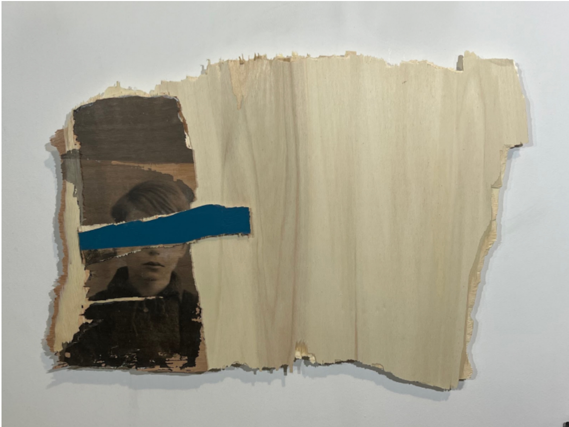
L'invention du courage (o salto), CM, 2023 Acrylic, photographic transfer on wood 24.41 x 17.72 x 0.79 in ( 62 x 45 x 2,5 cm )