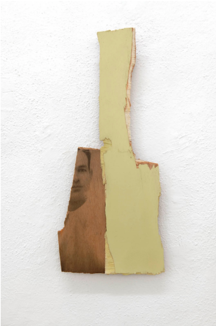
L'invention du courage (o salto), LG, 2021 Acrylic, photographic transfer on wood 18.9 x 8.27 x 0.79 in ( 48,5 x 21 x 2,5 cm )