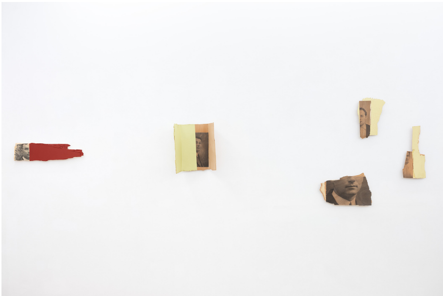
O salto Exhibition View Nosbaum Reding, Luxembourg, 2023