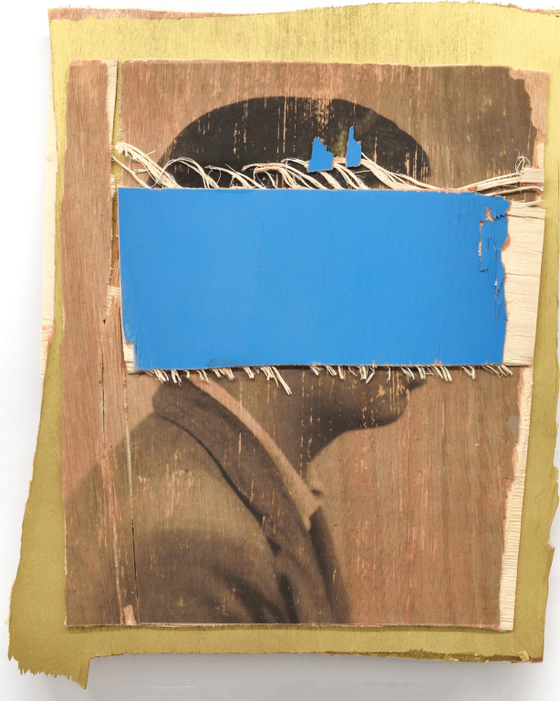
L'invention du courage (o salto), TOR ORO, 2022 Acrylic, photographic transfer on wood 11.02 x 13.39 x 1.18 in ( 28 x 34 x 3 cm )