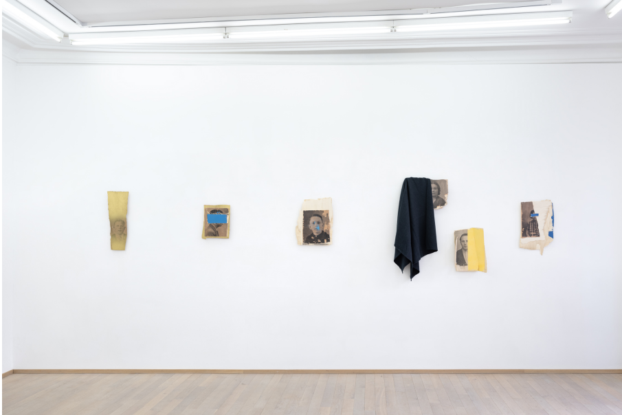
O salto Exhibition View Nosbaum Reding, Luxembourg, 2023