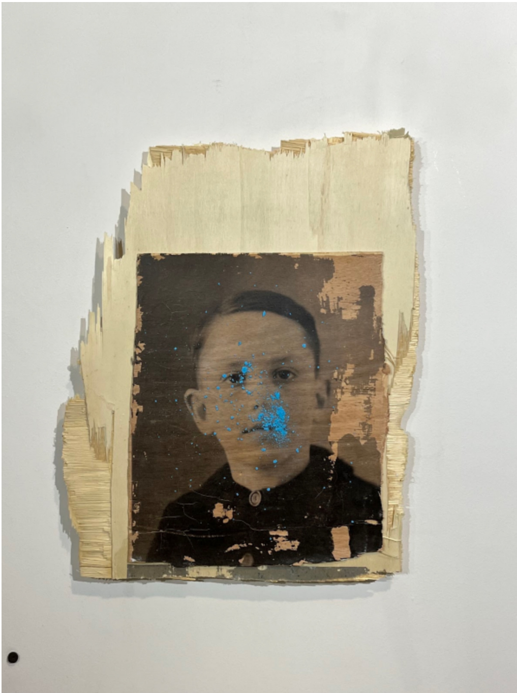
L'invention du courage (o salto), E, 2023 Acrylic, photographic transfer 18.9 x 14.57 x 0.79 in ( 48 x 37 x 2,5 cm )