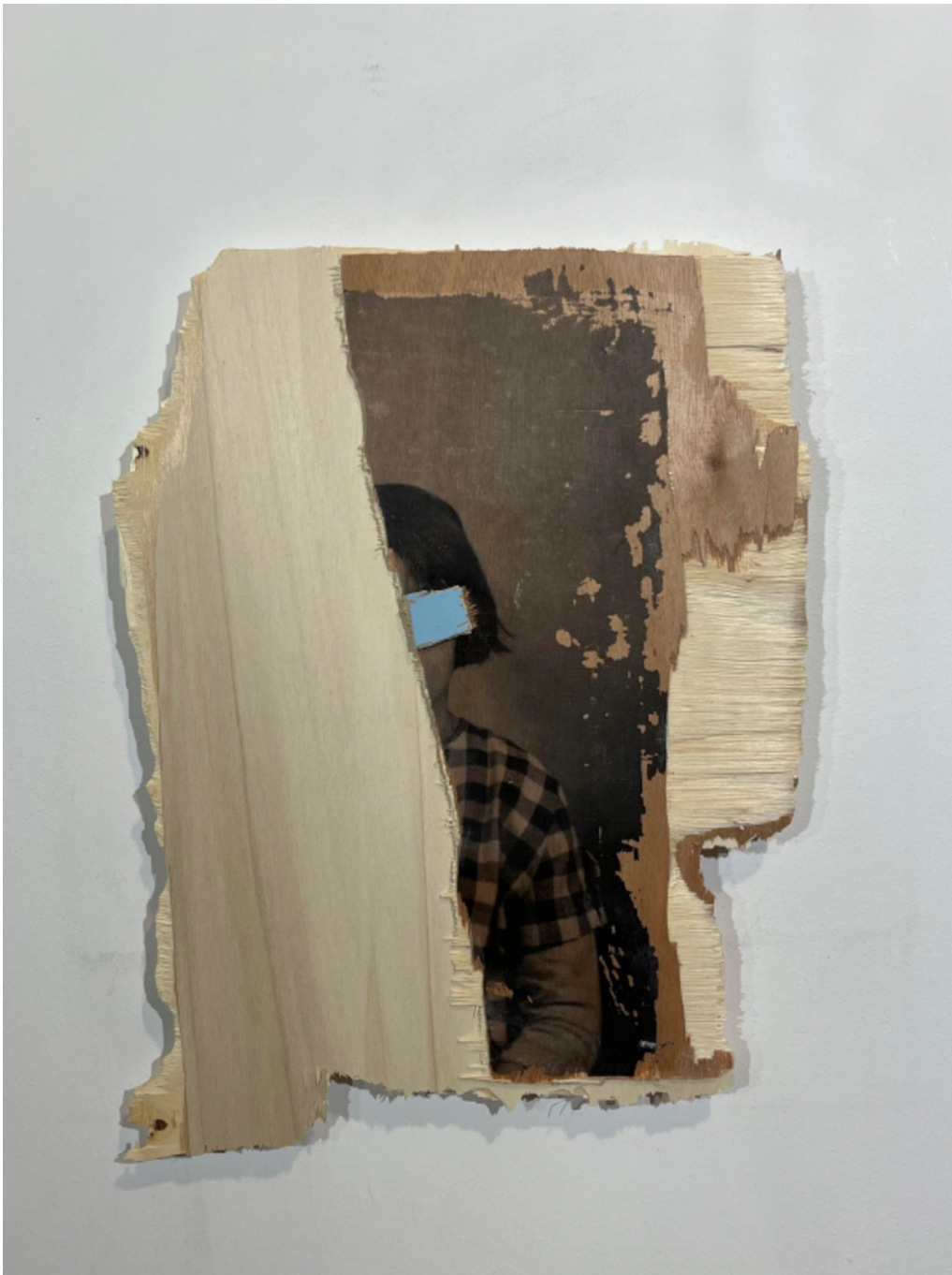
L'invention du courage (o salto), VI , 2023 Acrylic, photographic transfer on wood 16.54 x 12.2 x 0.79 in ( 42 x 31 x 2,5 cm )