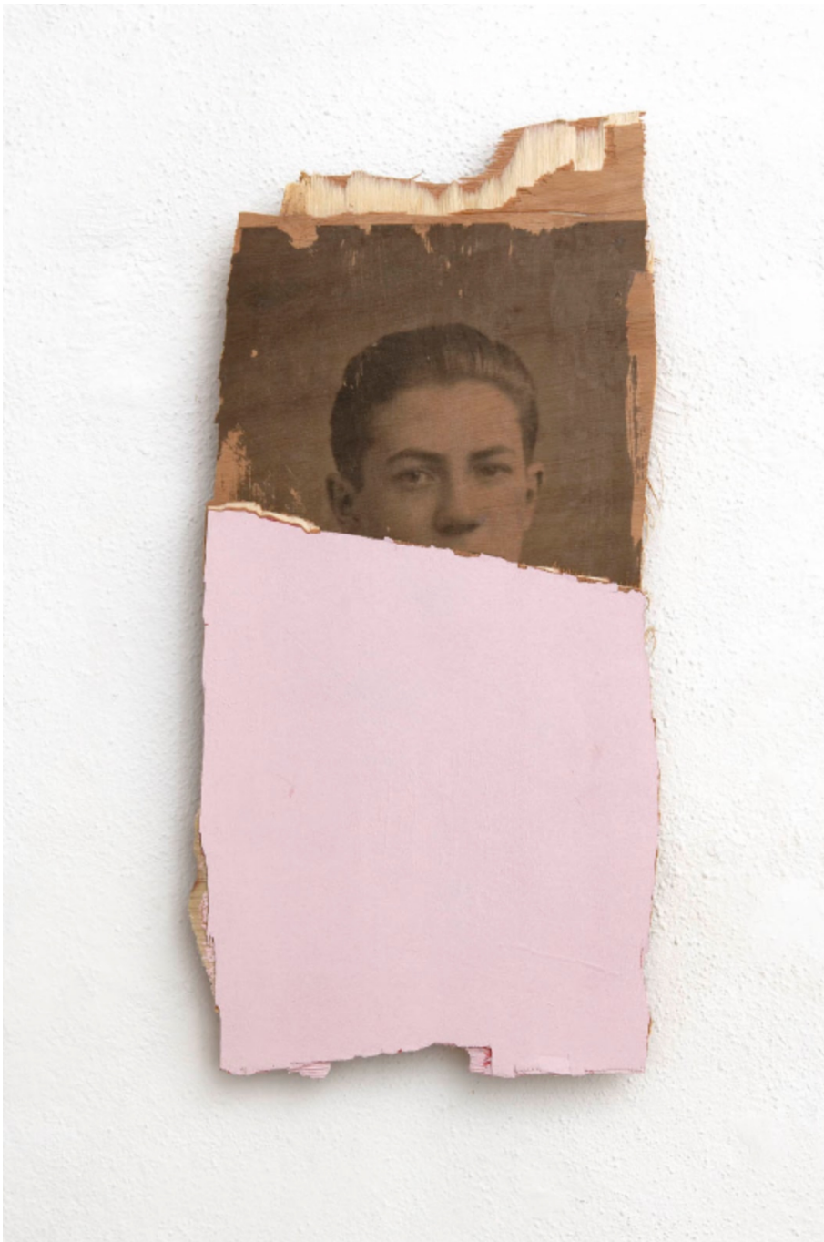
L'invention du courage (o salto), AR, 2021 Acrylic, photographic transfer on wood 10.63 x 22.44 x 1.18 in ( 27 x 57 x 3 cm )