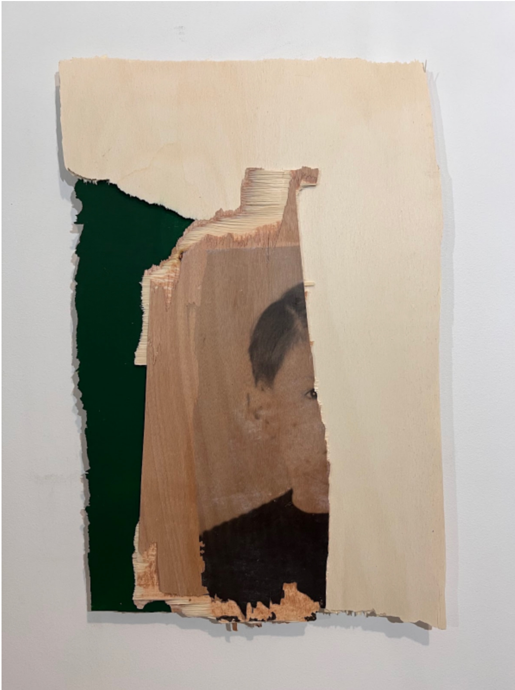
L'invention du courage (o salto), C, 2023 Acrylic, photographic transfer 20.47 x 12.99 x 0.79 in ( 52,5 x 33,5 x 2,5 cm )