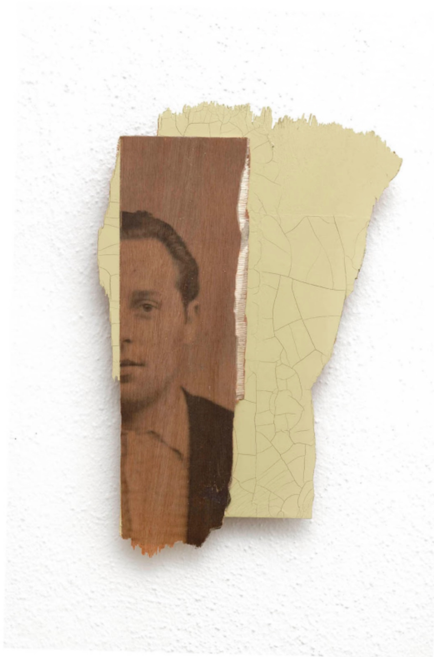
L'invention du courage (o salto), HH, 2021 Acrylic, photographic transfer on wood 15.35 x 9.84 x 0.79 in ( 39 x 25,5 x 2,5 cm )