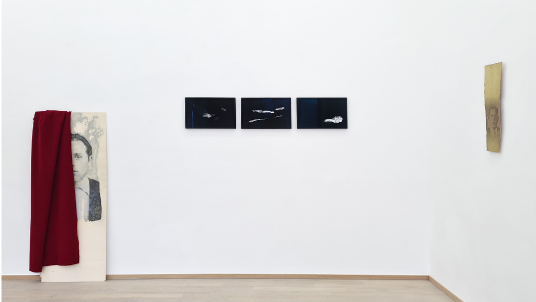
O salto Exhibition View Nosbaum Reding, Luxembourg, 2023