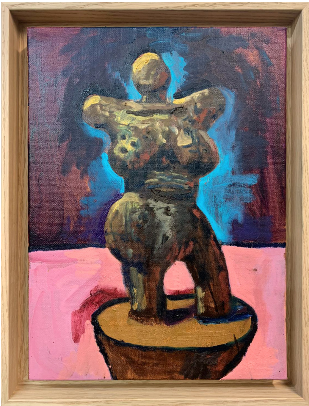
Sans titre , 2023 oil and collage on canvas 12.99 x 9.45 in ( 33 x 24 cm )