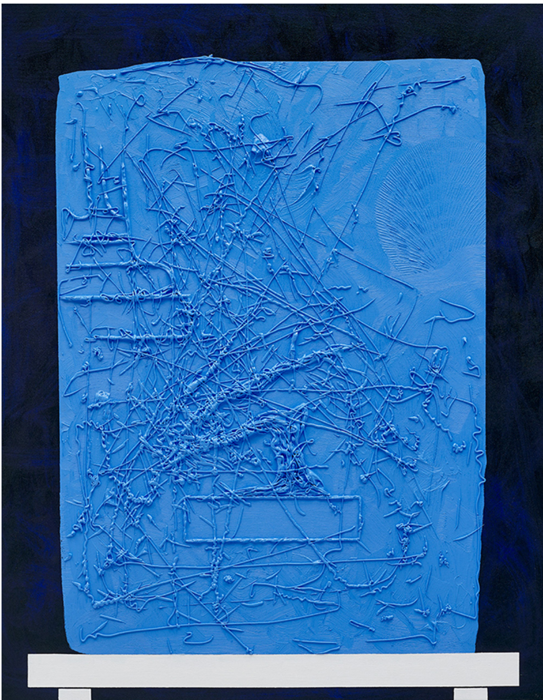
GRID (WEB) 7 , 2019 huile sur toile 45.28 x 35.43 in ( 115 x 90 cm )