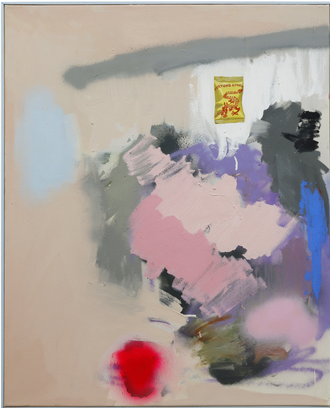
Ignore previous cookie (cookie3) , 2023 oil on canvas 31.5 x 25.59 in ( 80 x 65 cm )