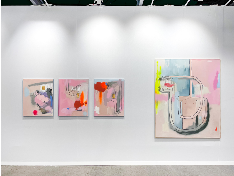
Art Paris 2023 Exhibition View Nosbaum Reding, Luxembourg, 2023