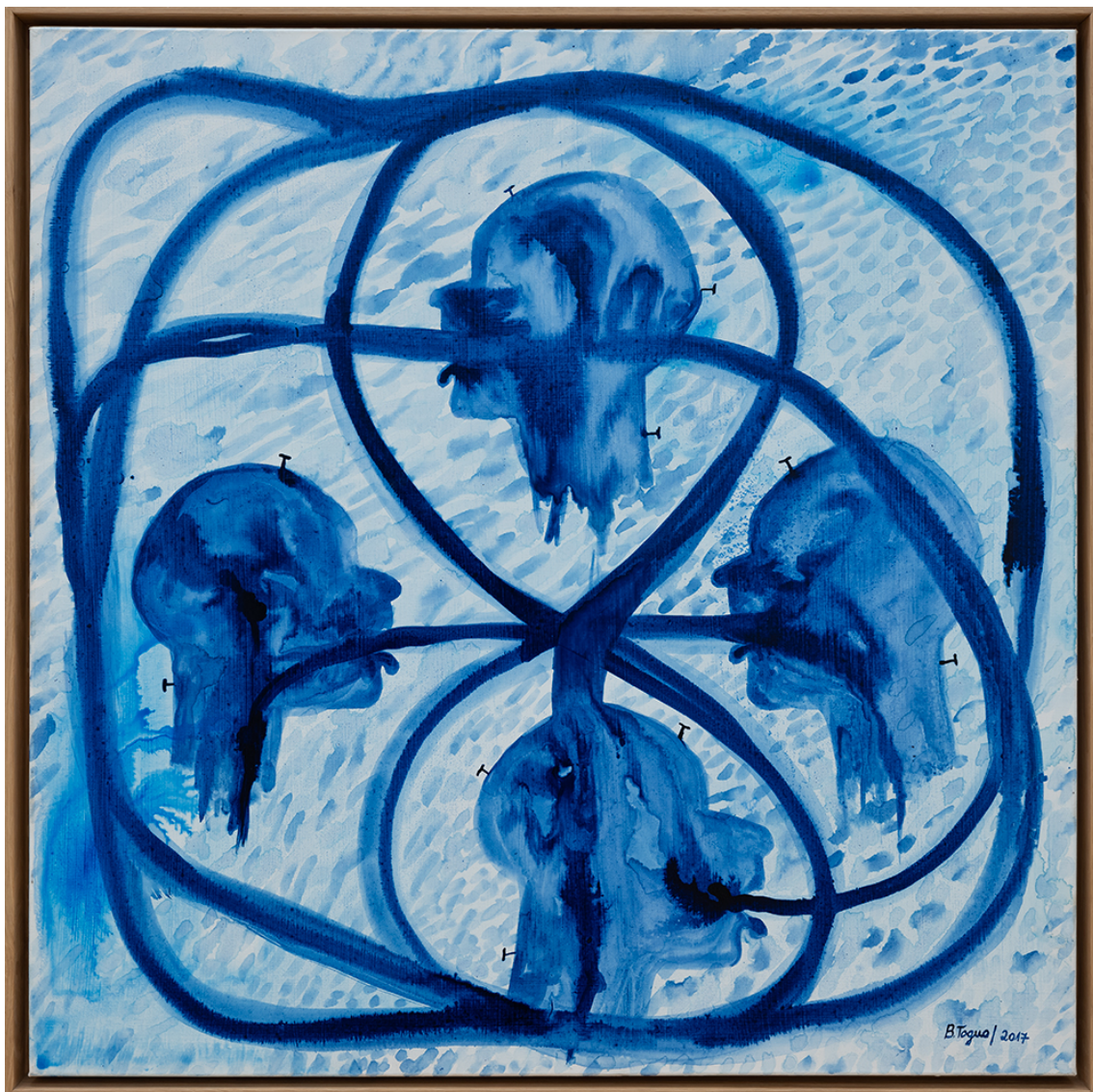
Réconciliation , 2017 Watercolor on paper mounted on canvas 39.37 x 39.37 in ( 100 x 100 cm )