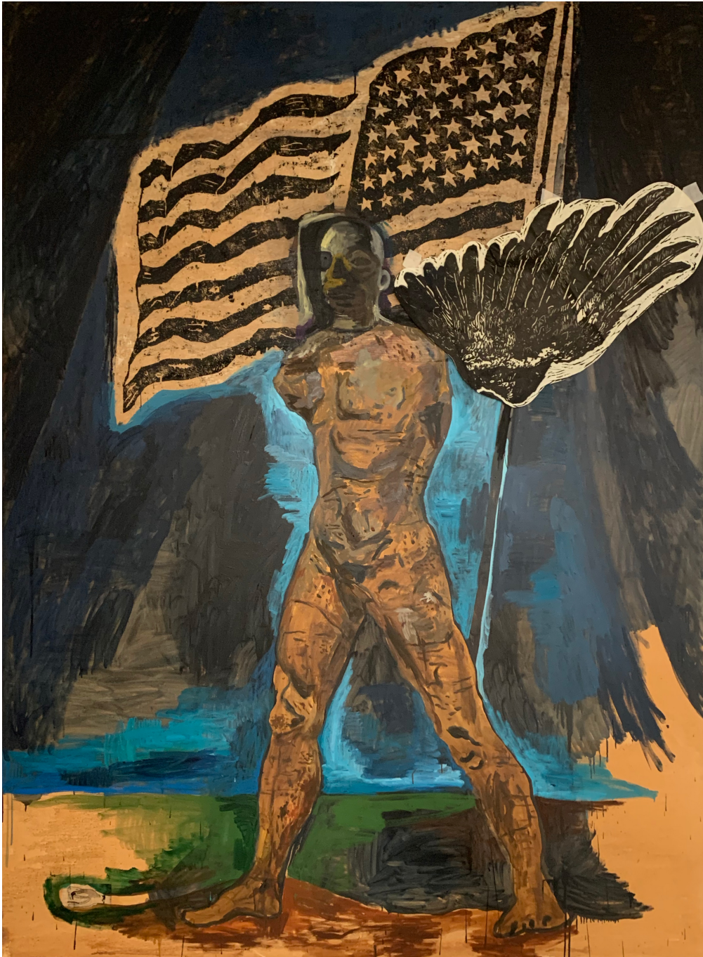
sans titre , 2020 oil and collage on canvas 98.43 x 70.87 in ( 250 x 180 cm )