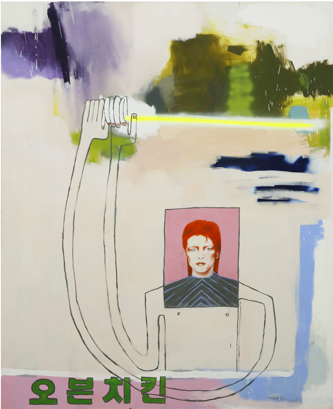
Ovenchicken , 2022 Oil on canvas 66.93 x 55.12 in ( 170 x 140 cm )