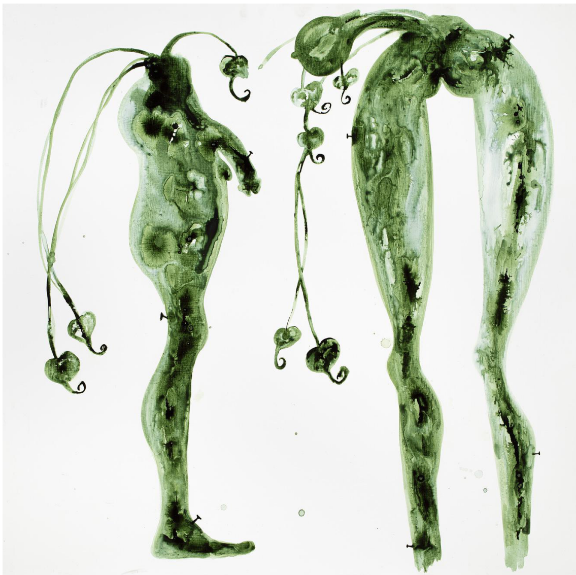
Récolte des cerises , 2019 Acrylic and Chinese ink on canvas 39.37 x 39.37 in ( 100 x 100 cm )