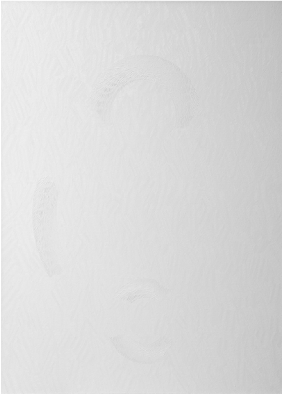
017, 2014 huile sur toile 45.28 x 35.43 in ( 115 x 90 cm )