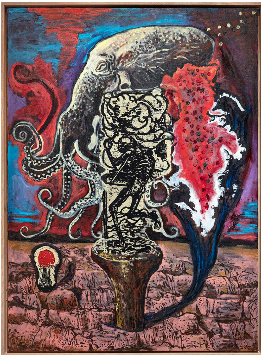
The world keeps turning , 2022 oil and collage on canvas 39.37 x 28.74 in ( 100 x 73 cm )