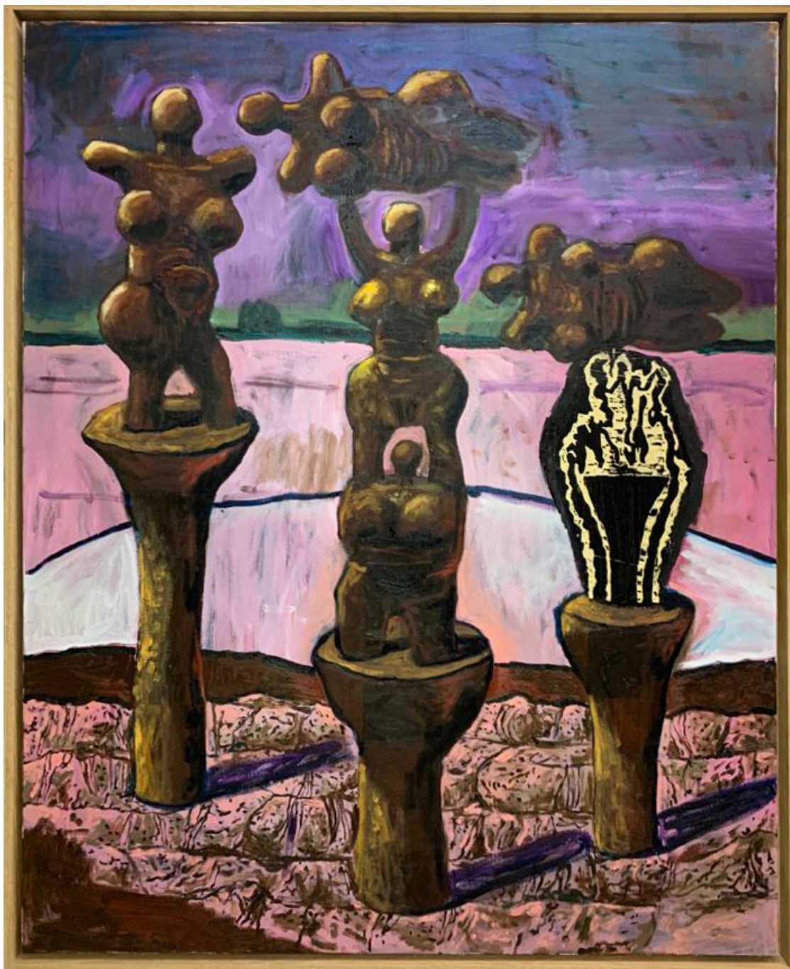
Sans titre , 2023 oil and collage on canvas 39.37 x 31.5 in ( 100 x 80 cm )