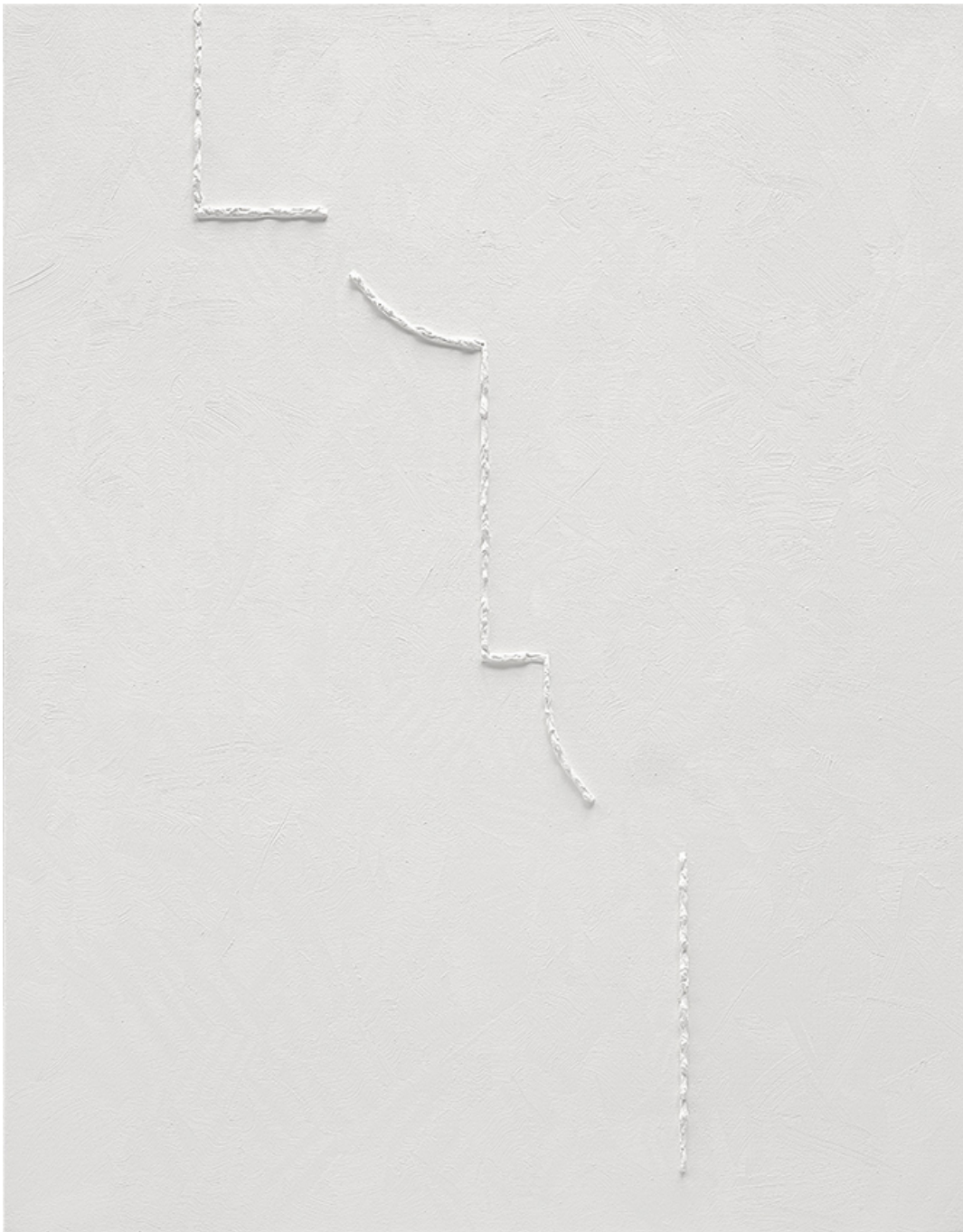
GRID (WEB) 5 , 2019 huile sur toile 45.28 x 35.43 in ( 115 x 90 cm )