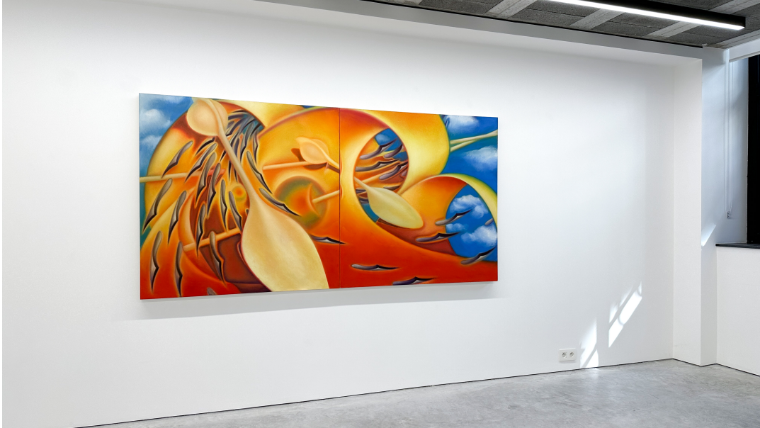
The Rain Has Changed Exhibition View Nosbaum Reding, Luxembourg, 2023