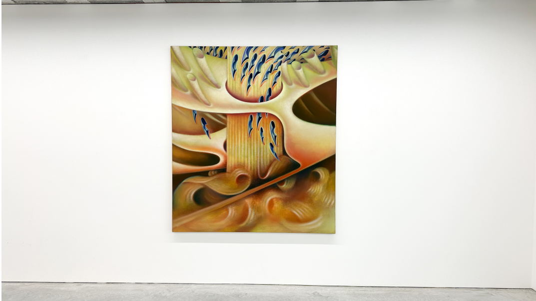
The Rain Has Changed Exhibition View Nosbaum Reding, Luxembourg, 2023