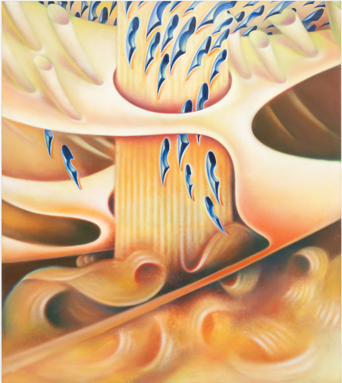
Rain Pipe , 2023 Oil on linen 66.93 x 43.31 in ( 170 x 150 cm )