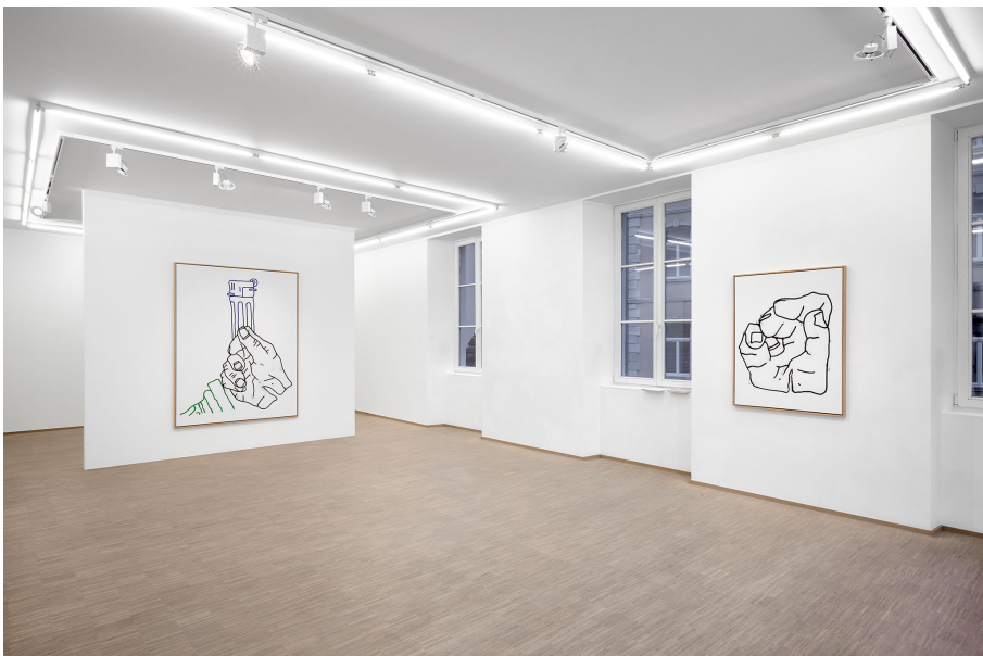
RUN ( Frühstück) Exhibition View Nosbaum Reding, Luxembourg, 2023