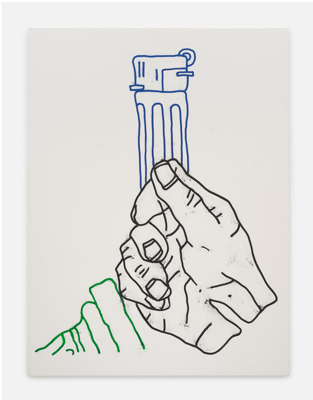
RUN (Frühstück) 1, 2023 oil on canvas 78.74 x 59.06 in ( 200 x 150 cm )