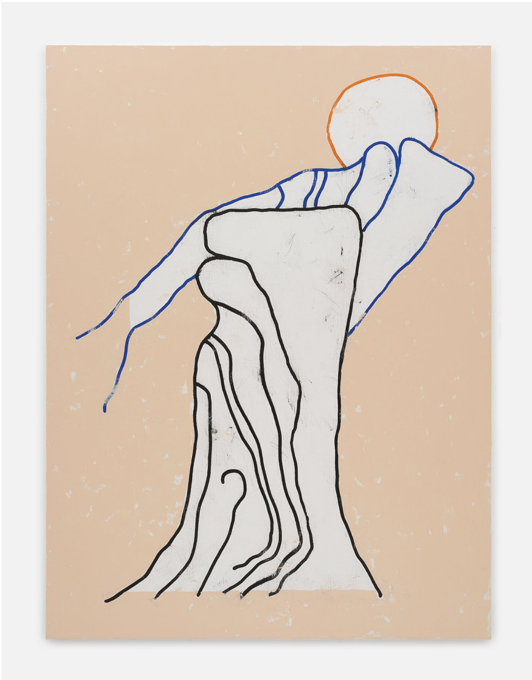
RUN (Frühstück) 6 , 2023 oil on canvas 78.74 x 35.43 in ( 200 x 150 cm )