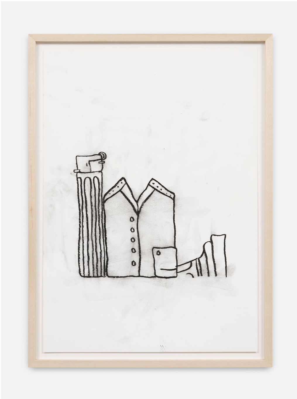
RUN-Series , 2023 Charcoal on paper 16.54 x 11.42 in ( 42 x 29,5 cm )