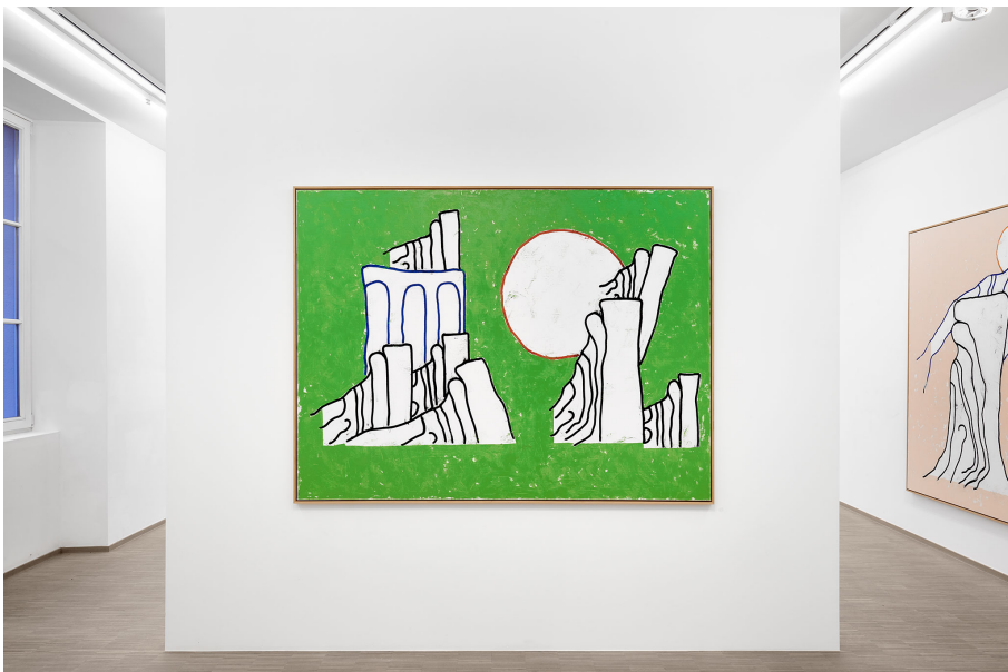
RUN ( Frühstück) Exhibition View Nosbaum Reding, Luxembourg, 2023