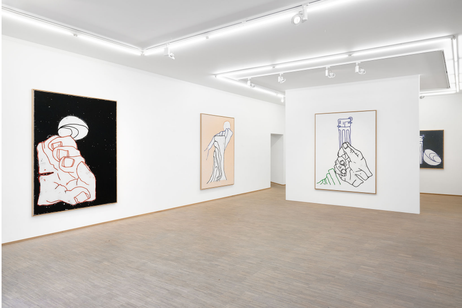
RUN ( Frühstück) Exhibition View Nosbaum Reding, Luxembourg, 2023