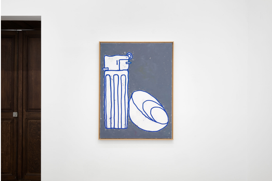
RUN ( Frühstück) Exhibition View Nosbaum Reding, Luxembourg, 2023