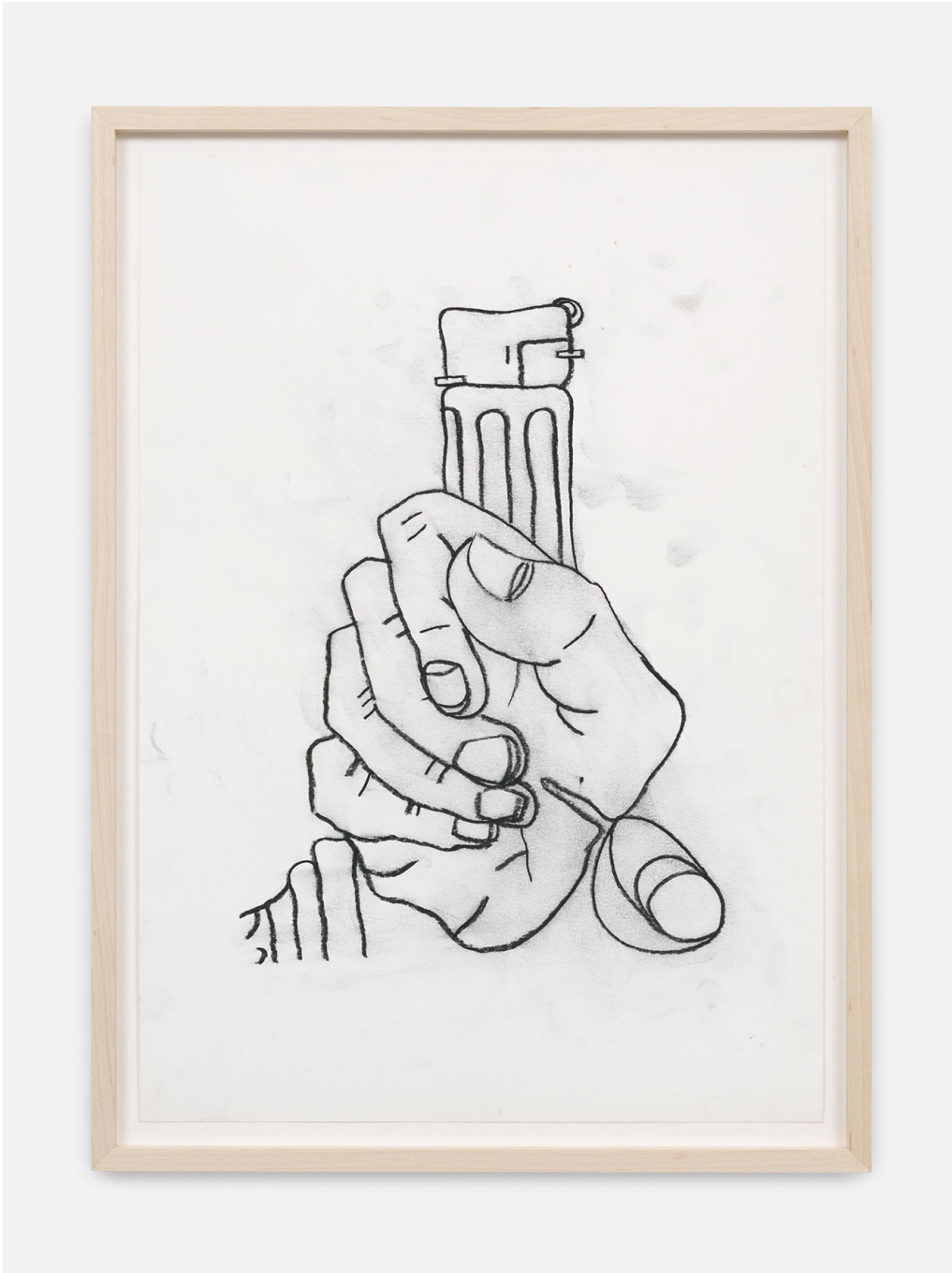
RUN-Series , 2023 Charcoal on paper 16.54 x 11.42 in ( 42 x 29,5 cm )