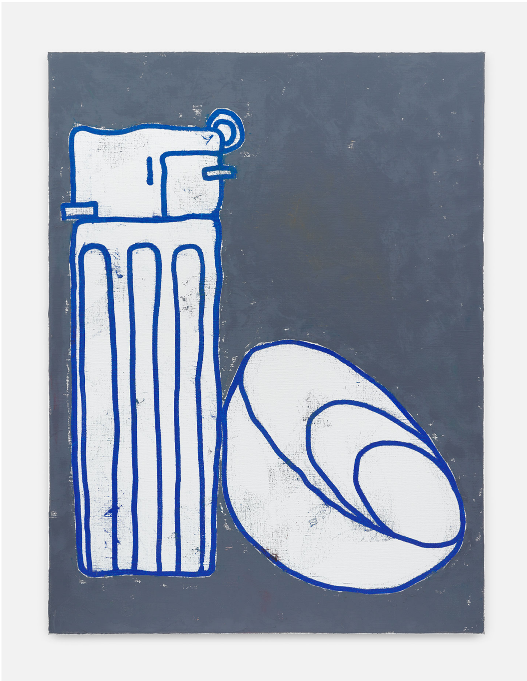
RUN (Frühstück) 2 , 2023 oil on canvas 47.24 x 35.43 in ( 120 x 90 cm )