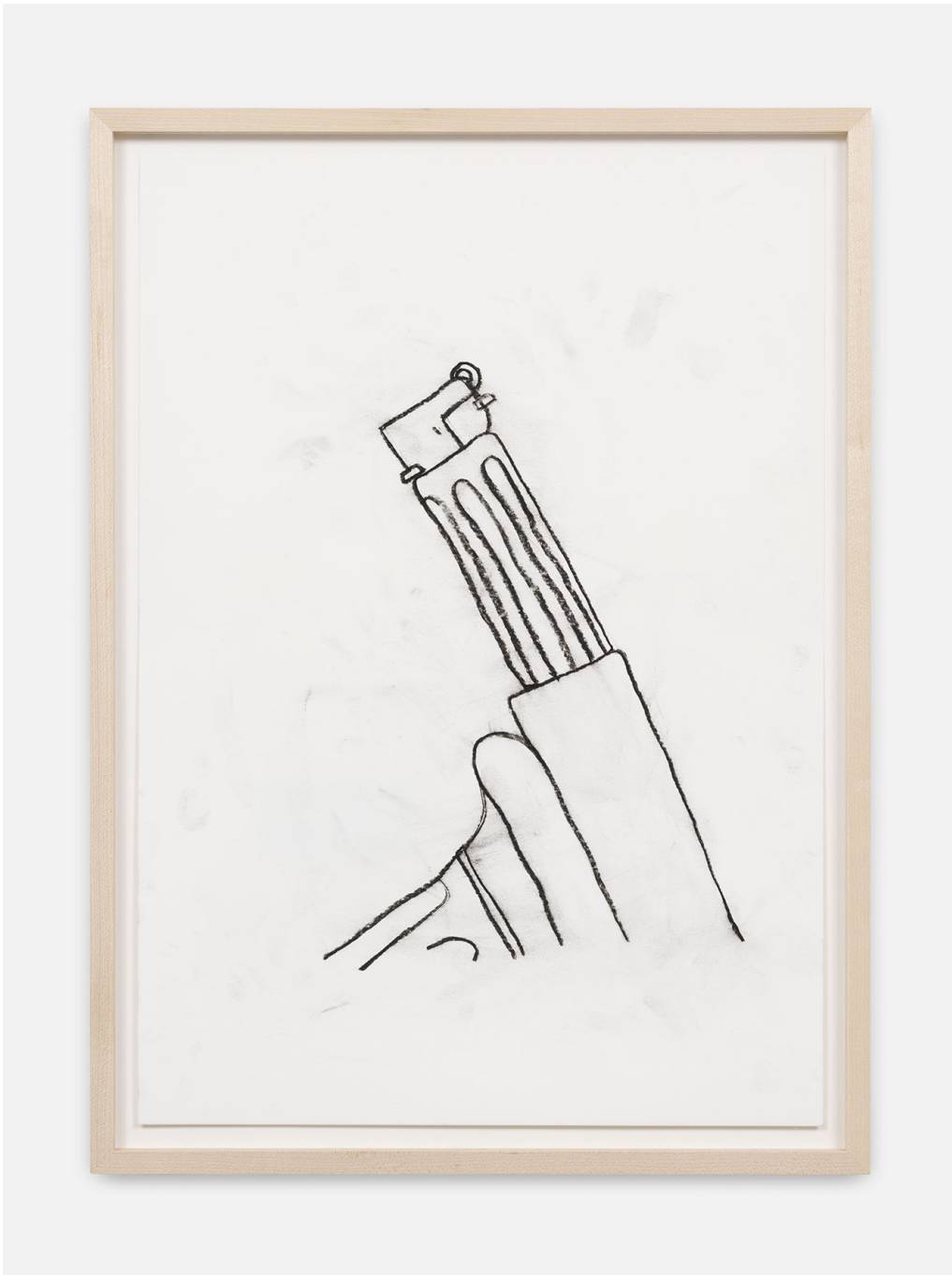
RUN-Series , 2023 Charcoal on paper 16.54 x 11.42 in ( 42 x 29,5 cm )