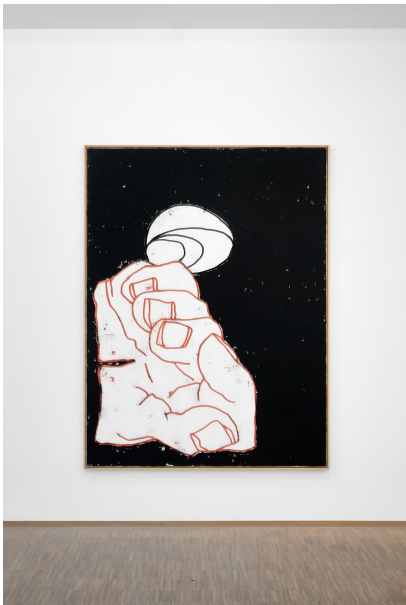
RUN ( Frühstück) Exhibition View Nosbaum Reding, Luxembourg, 2023