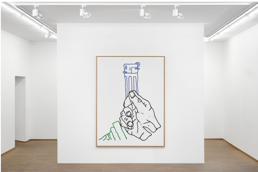
RUN ( Frühstück) Exhibition View Nosbaum Reding, Luxembourg, 2023