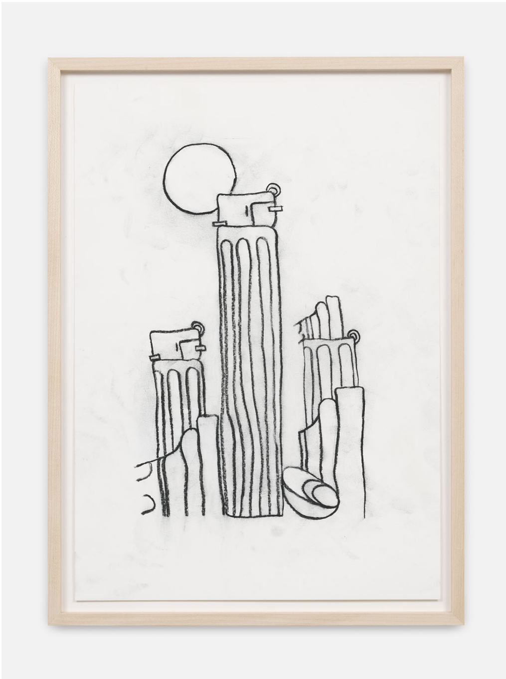
RUN-Series , 2023 Charcoal on paper 16.54 x 11.42 in ( 42 x 29,5 cm )