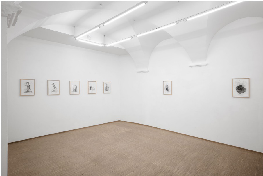
RUN ( Frühstück) Exhibition View Nosbaum Reding, Luxembourg, 2023