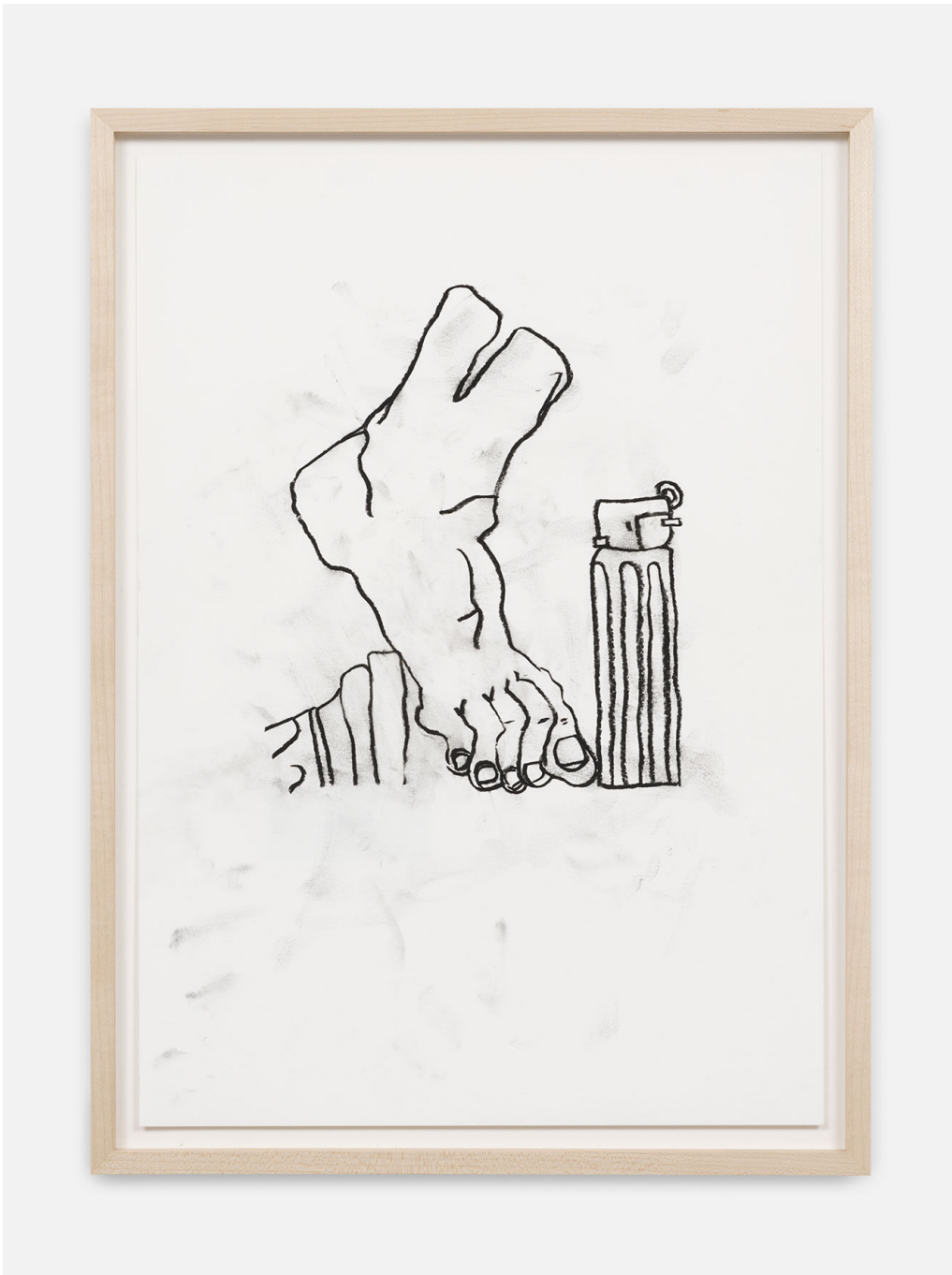
RUN-Series , 2023 Charcoal on paper 16.54 x 11.42 in ( 42 x 29,5 cm )