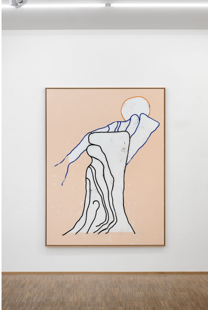
RUN ( Frühstück) Exhibition View Nosbaum Reding, Luxembourg, 2023