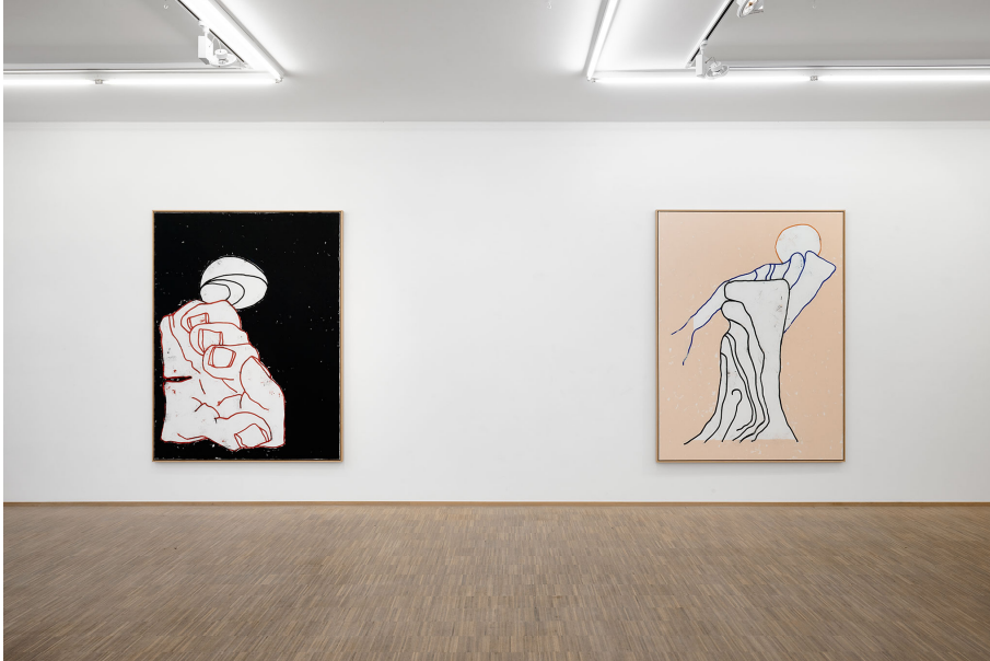
RUN ( Frühstück) Exhibition View Nosbaum Reding, Luxembourg, 2023