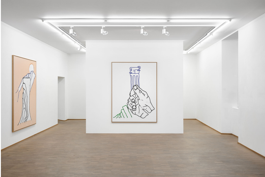
RUN ( Frühstück) Exhibition View Nosbaum Reding, Luxembourg, 2023