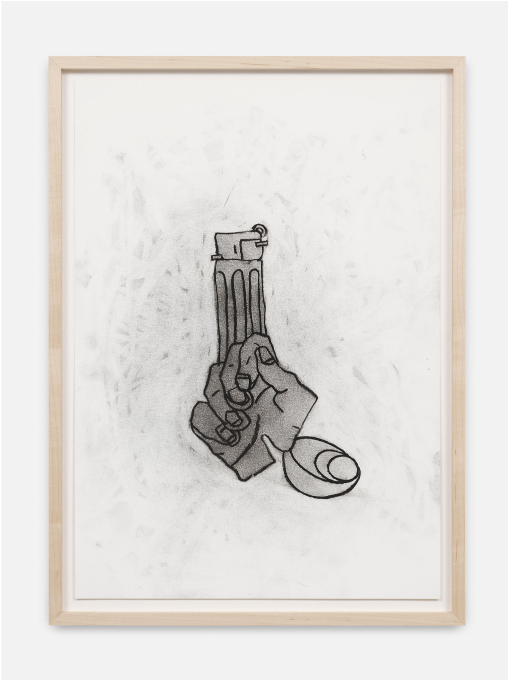
RUN-Series , 2023 Charcoal on paper 16.54 x 11.42 in ( 42 x 29,5 cm )