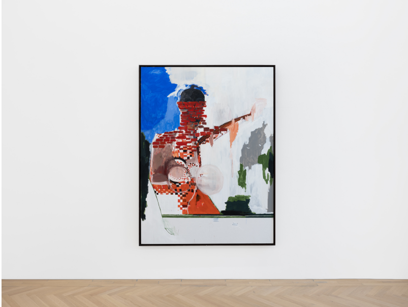
Momentum (1) Exhibition View Nosbaum Reding, Luxembourg, 2024