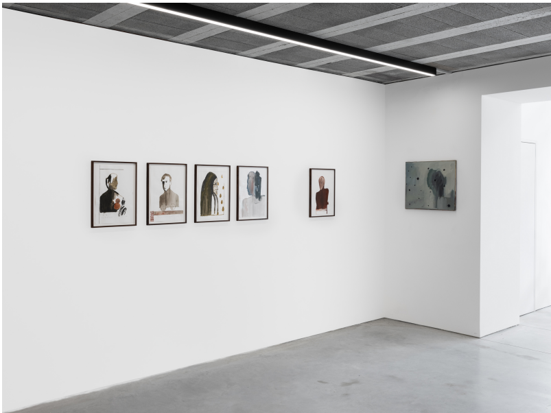
Momentum (1) Exhibition View Nosbaum Reding, Luxembourg, 2024