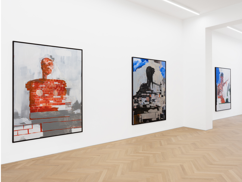
Momentum (1) Exhibition View Nosbaum Reding, Luxembourg, 2024