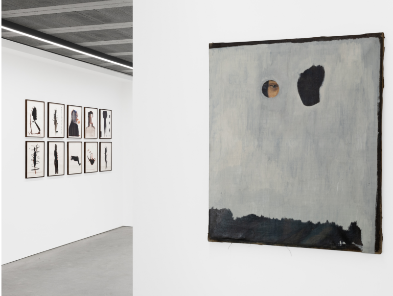
Momentum (1) Exhibition View Nosbaum Reding, Luxembourg, 2024