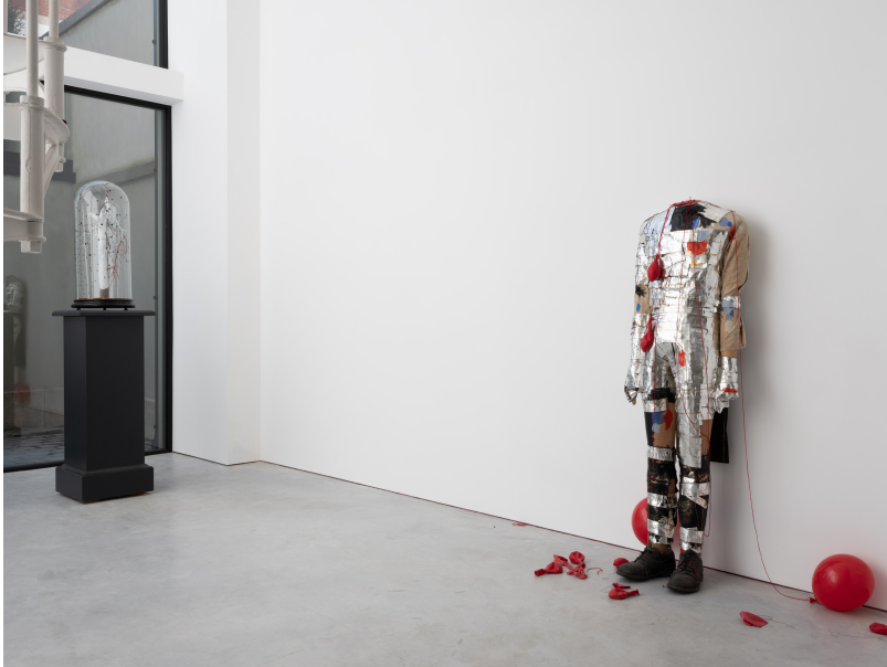
Momentum (1) Exhibition View Nosbaum Reding, Luxembourg, 2024