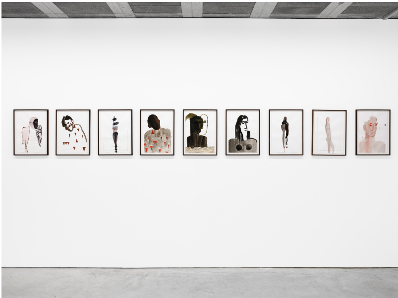
Momentum (1) Exhibition View Nosbaum Reding, Luxembourg, 2024