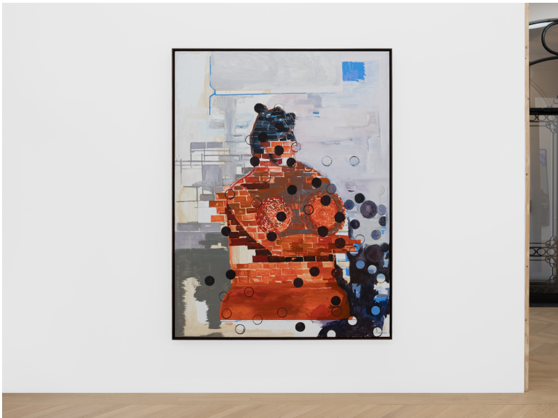
Momentum (1) Exhibition View Nosbaum Reding, Luxembourg, 2024