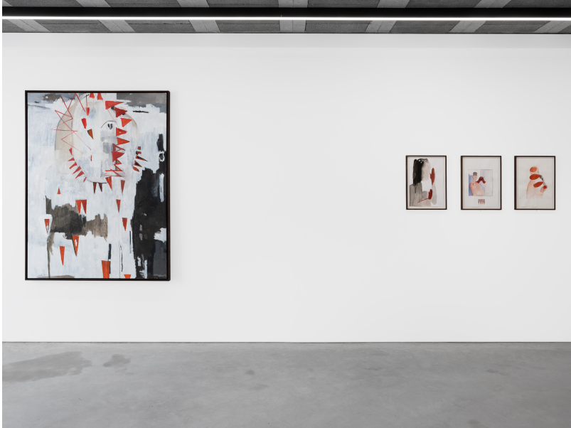
Momentum (1) Exhibition View Nosbaum Reding, Luxembourg, 2024