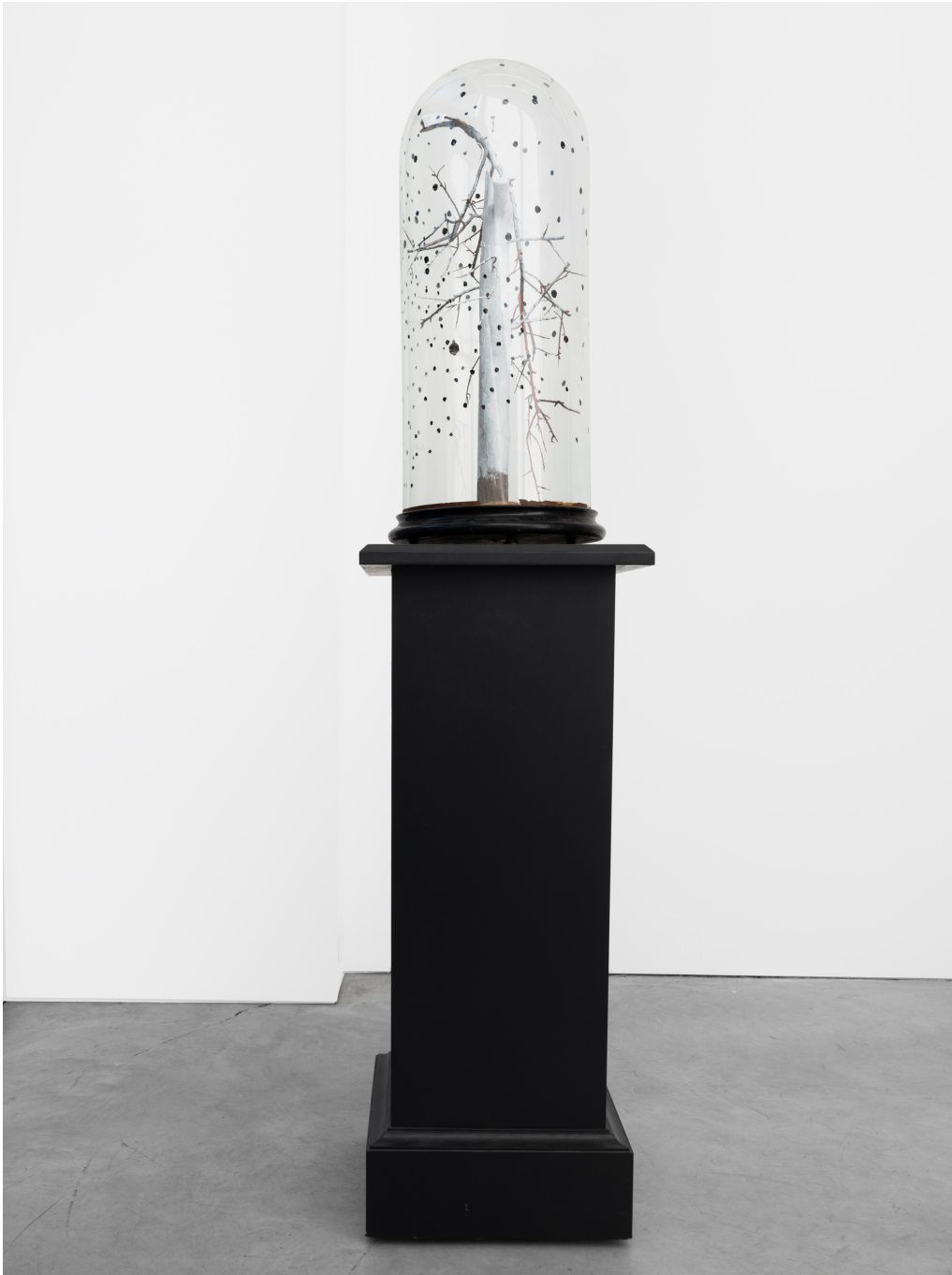
Protected tree, 2020, VII, 1, 2020 Mixed media: wood and glass (painted) 29.53 x 12.99 x 12.99 in ( 75 x 33 x 33 cm )