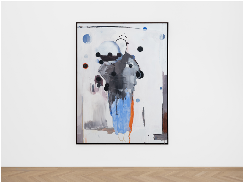
Momentum (1) Exhibition View Nosbaum Reding, Luxembourg, 2024