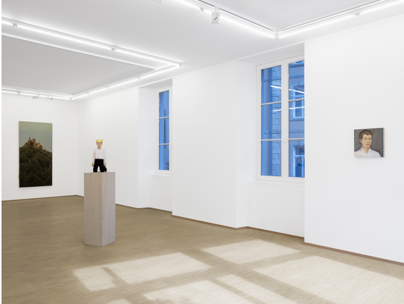
Stephan Balkenhol Exhibition View Nosbaum Reding, Luxembourg, 2024