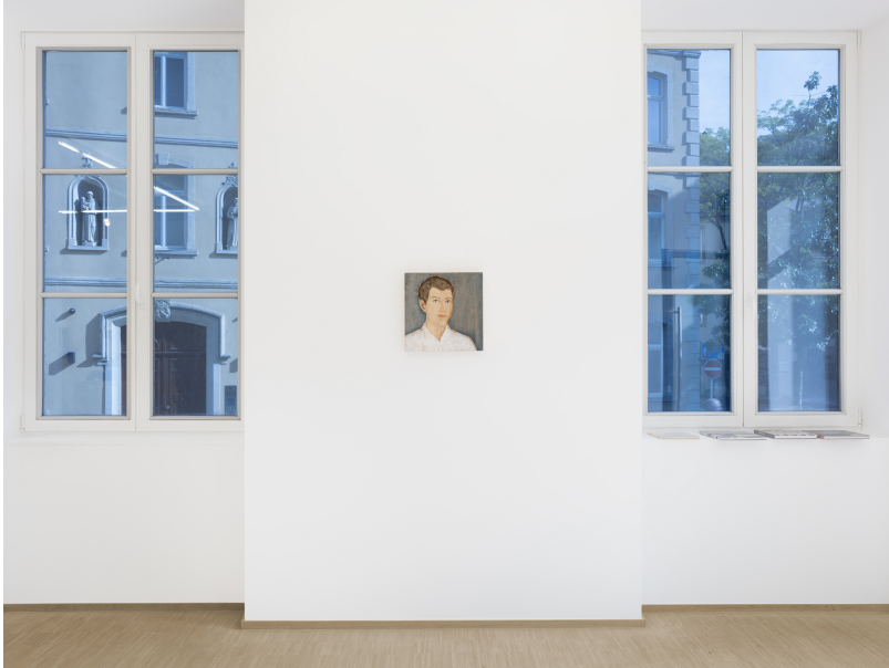
Stephan Balkenhol Exhibition View Nosbaum Reding, Luxembourg, 2024