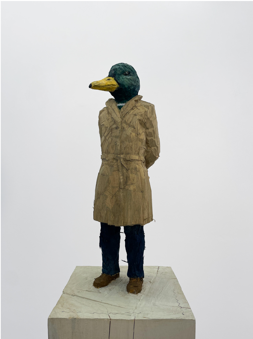
Homme canard , 2024 Bois ayous peint 66.93 x 13.39 x 13.39 in ( 170,5 x 34,5 x 34,5 cm )

Gallery Nosbaum Reding 2 + 4, rue Wiltheim L-2733 Luxembourg / T (+352) 28 11 25 1 / reding@nosbaumreding.com