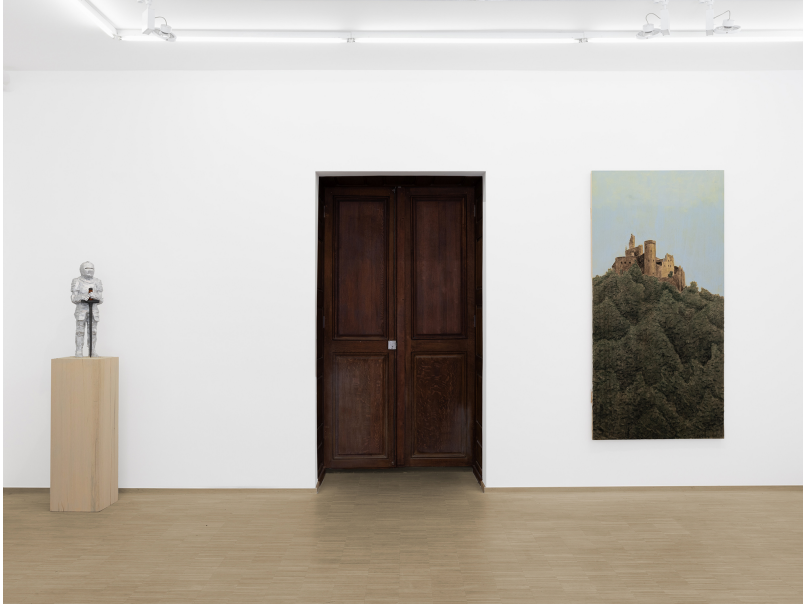
Stephan Balkenhol Exhibition View Nosbaum Reding, Luxembourg, 2024