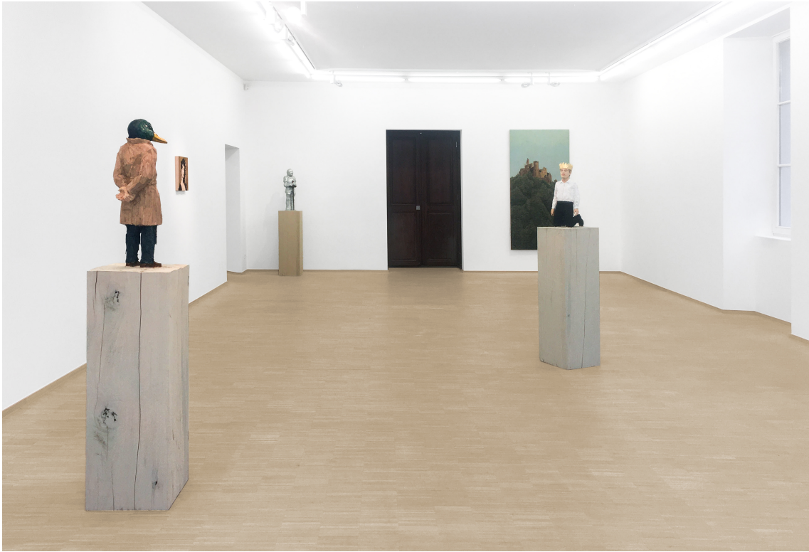
Stephan Balkenhol Exhibition View Nosbaum Reding, Luxembourg, 2024