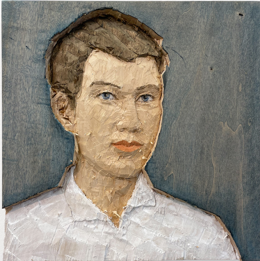
Bas-relief homme , 2024 Painted poplar wood 14.96 x 14.96 x 1.57 in ( 38 x 38 x 4 cm )

Gallery Nosbaum Reding 2 + 4, rue Wiltheim L-2733 Luxembourg / T (+352) 28 11 25 1 / reding@nosbaumreding.com