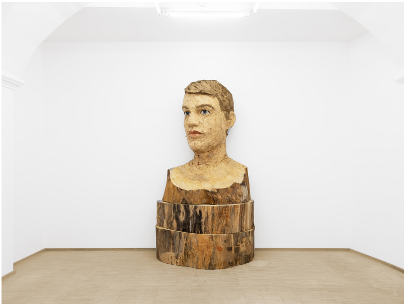
Stephan Balkenhol Exhibition View Nosbaum Reding, Luxembourg, 2024