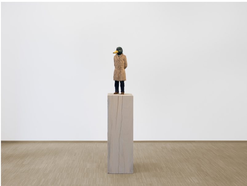
Stephan Balkenhol Exhibition View Nosbaum Reding, Luxembourg, 2024