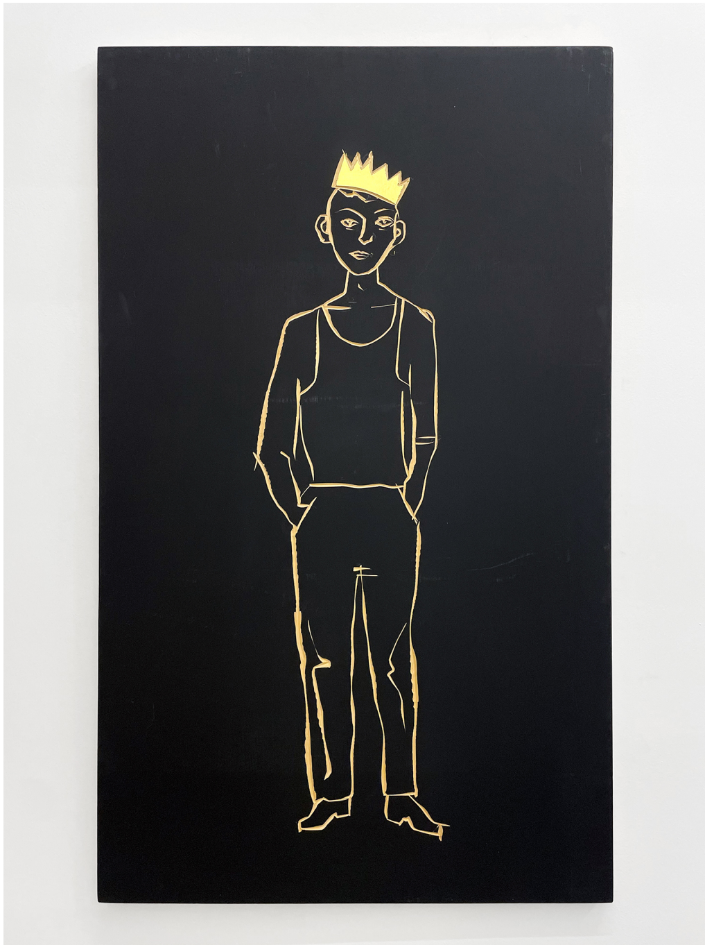
Roi , 2017 Painted ayous wood 39.37 x 23.62 x 0.79 in ( 100 x 60 x 2,5 cm )

Gallery Nosbaum Reding 2 + 4, rue Wiltheim L-2733 Luxembourg / T (+352) 28 11 25 1 / reding@nosbaumreding.com