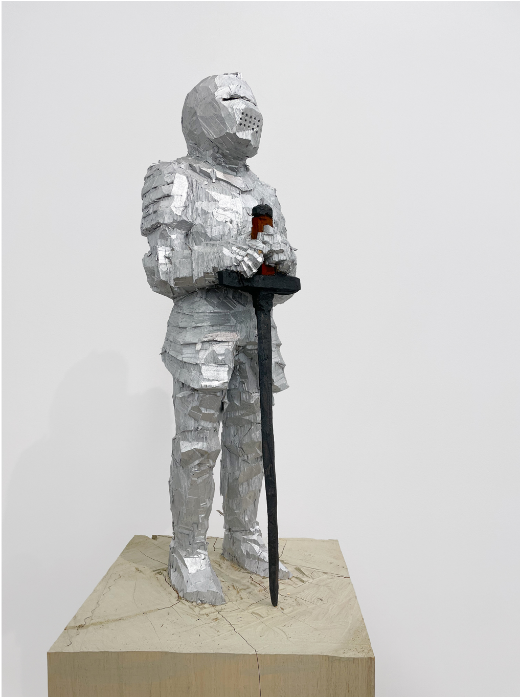
Chevalier , 2023 Painted ayous wood 67.32 x 12.99 x 12.99 in ( 171 x 33,5 x 33,5 cm )