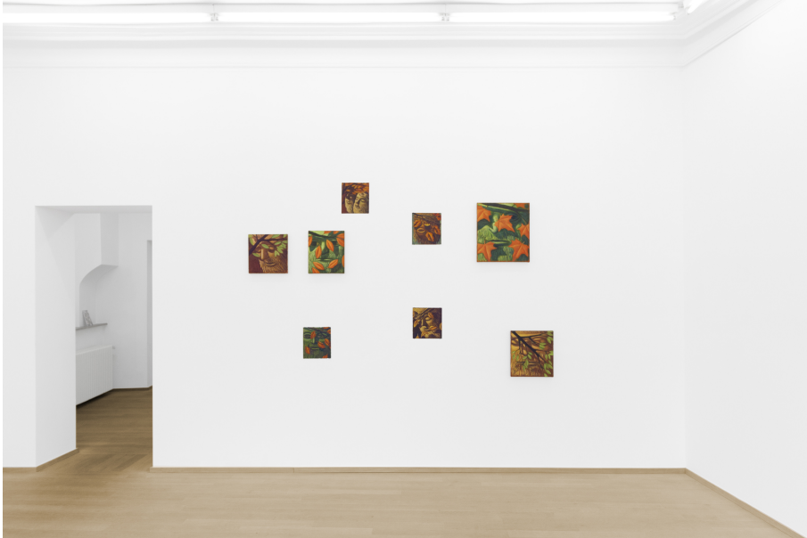
Creeper, Sleeper, Weeper Exhibition View Nosbaum Reding, Luxembourg, 2024