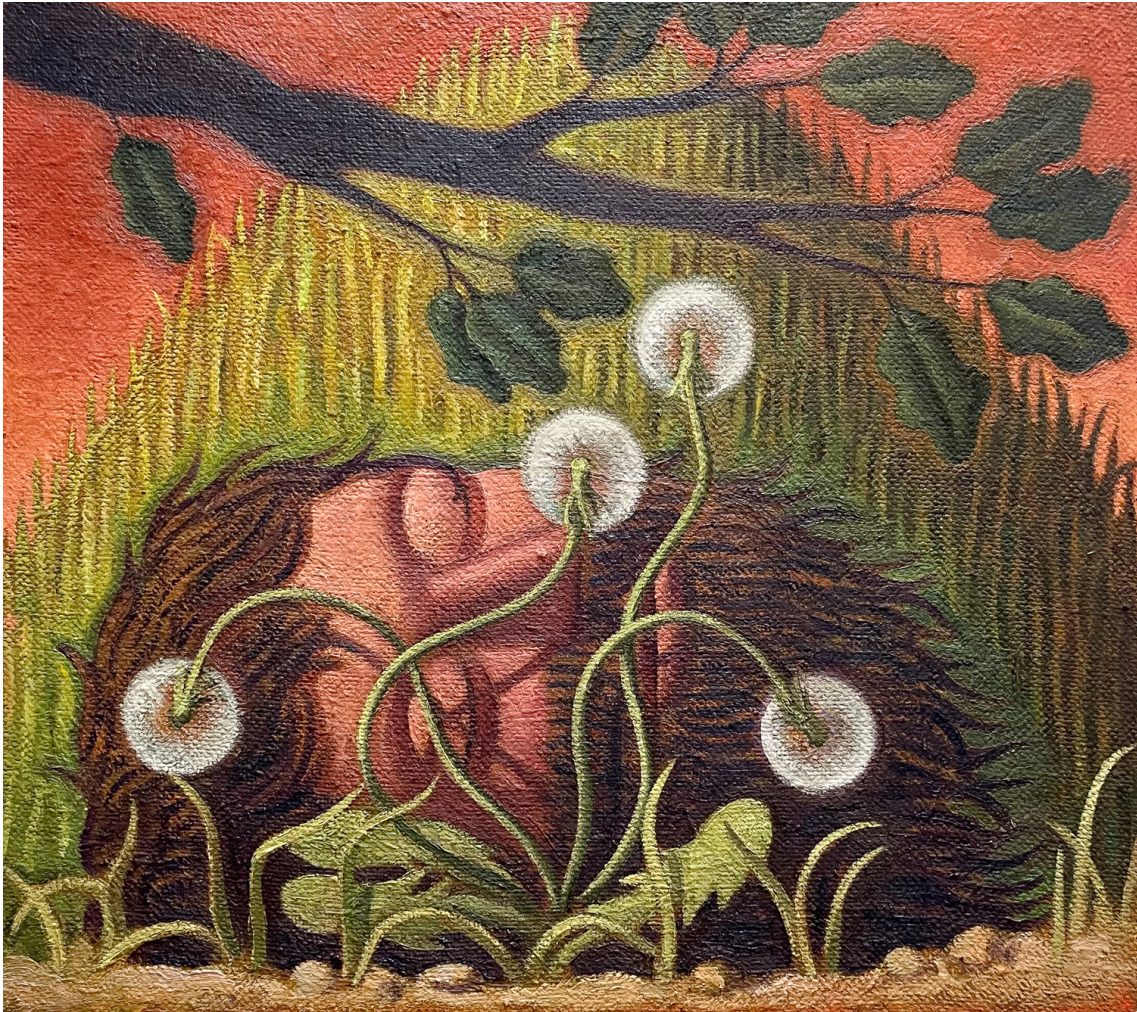
Creeper , 2024 Oil on jute 24.8 x 27.95 in ( 63,5 x 71,12 cm )