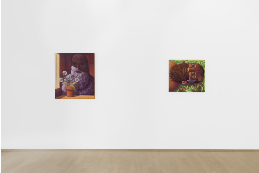
Creeper, Sleeper, Weeper Exhibition View Nosbaum Reding, Luxembourg, 2024