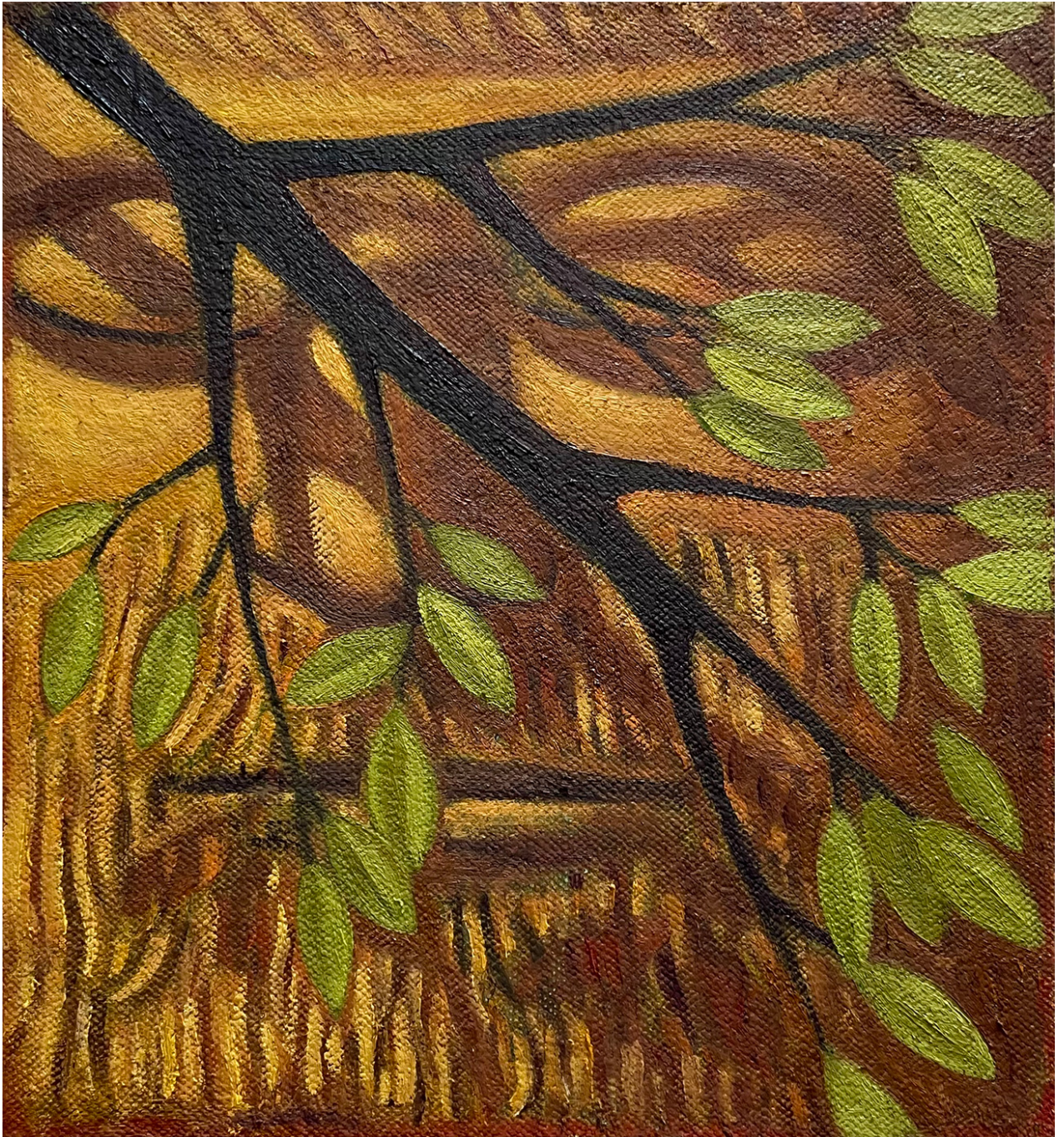
Canopy , 2024 Oil on hemp 13.78 x 13 in ( 35,56 x 33,02 cm )