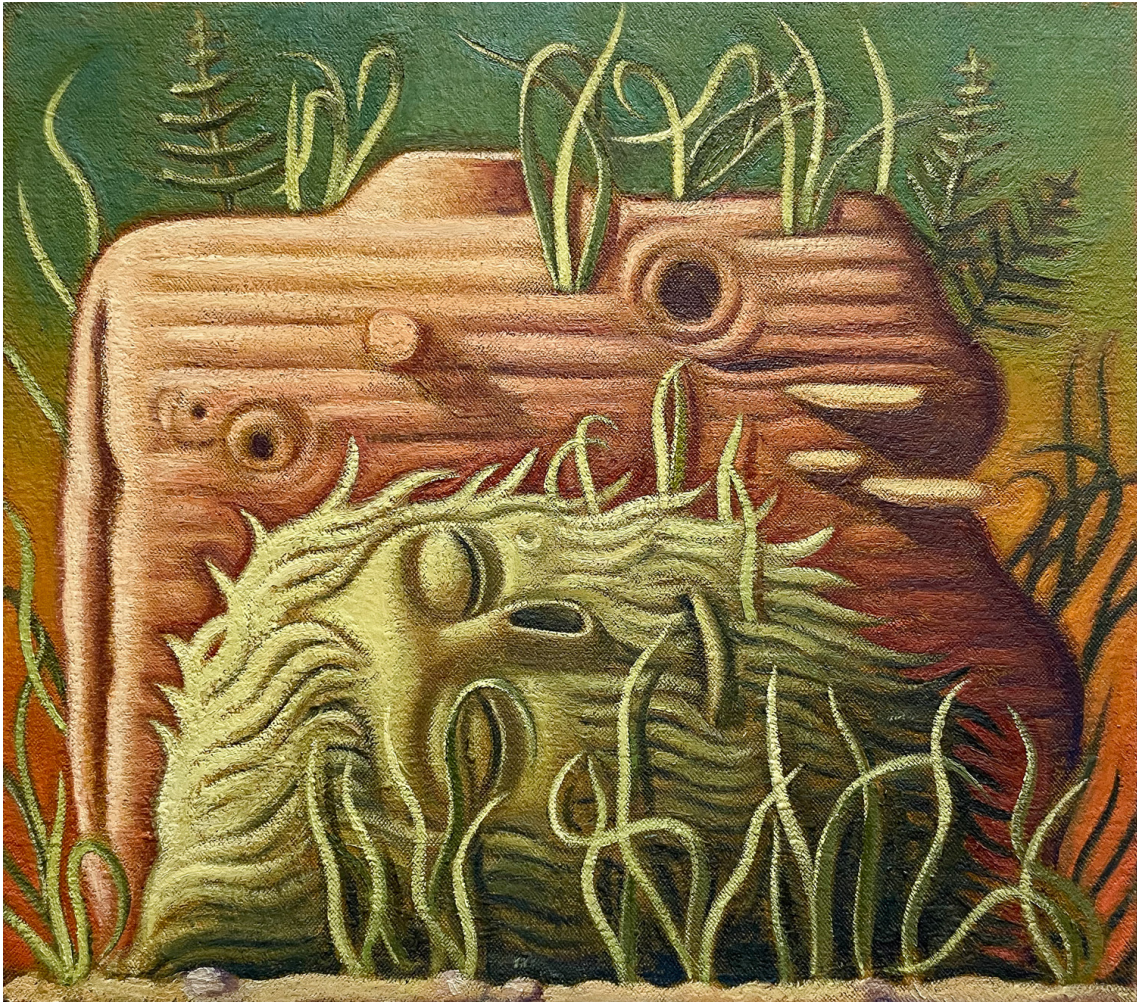
Sleeper , 2024 Oil on jute 24.8 x 27.95 in ( 63,5 x 71,12 cm )