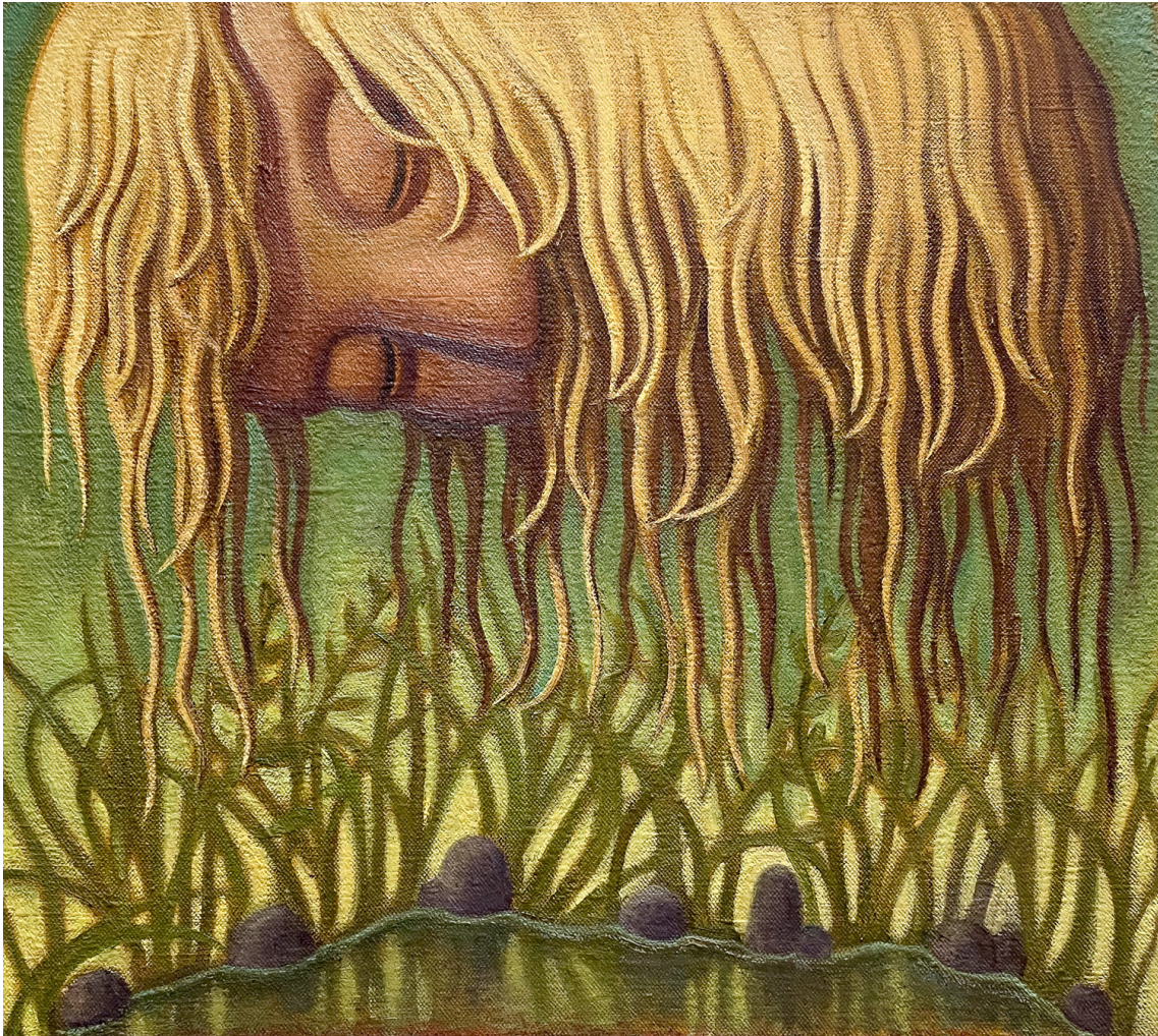
Weeper , 2024 Oil on jute 24.8 x 27.95 in ( 63,5 x 71,12 cm )