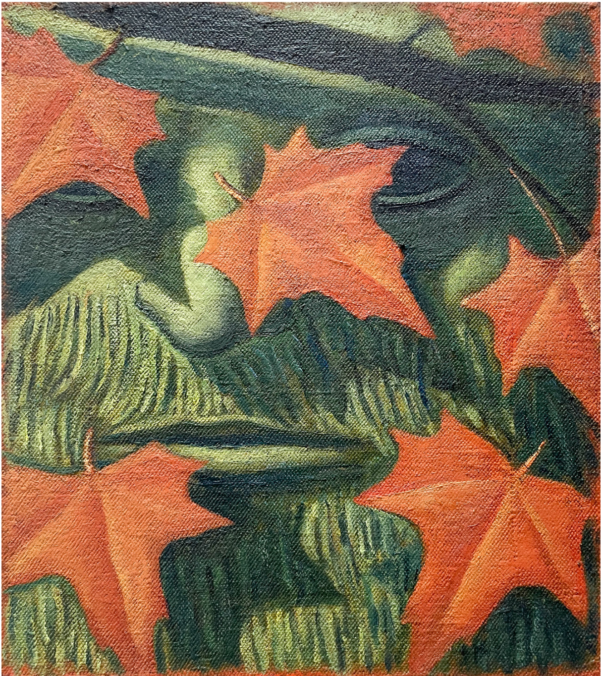
Scrim (02) , 2024 Oil on hemp 17.72 x 15.75 in ( 45,72 x 40,64 cm )