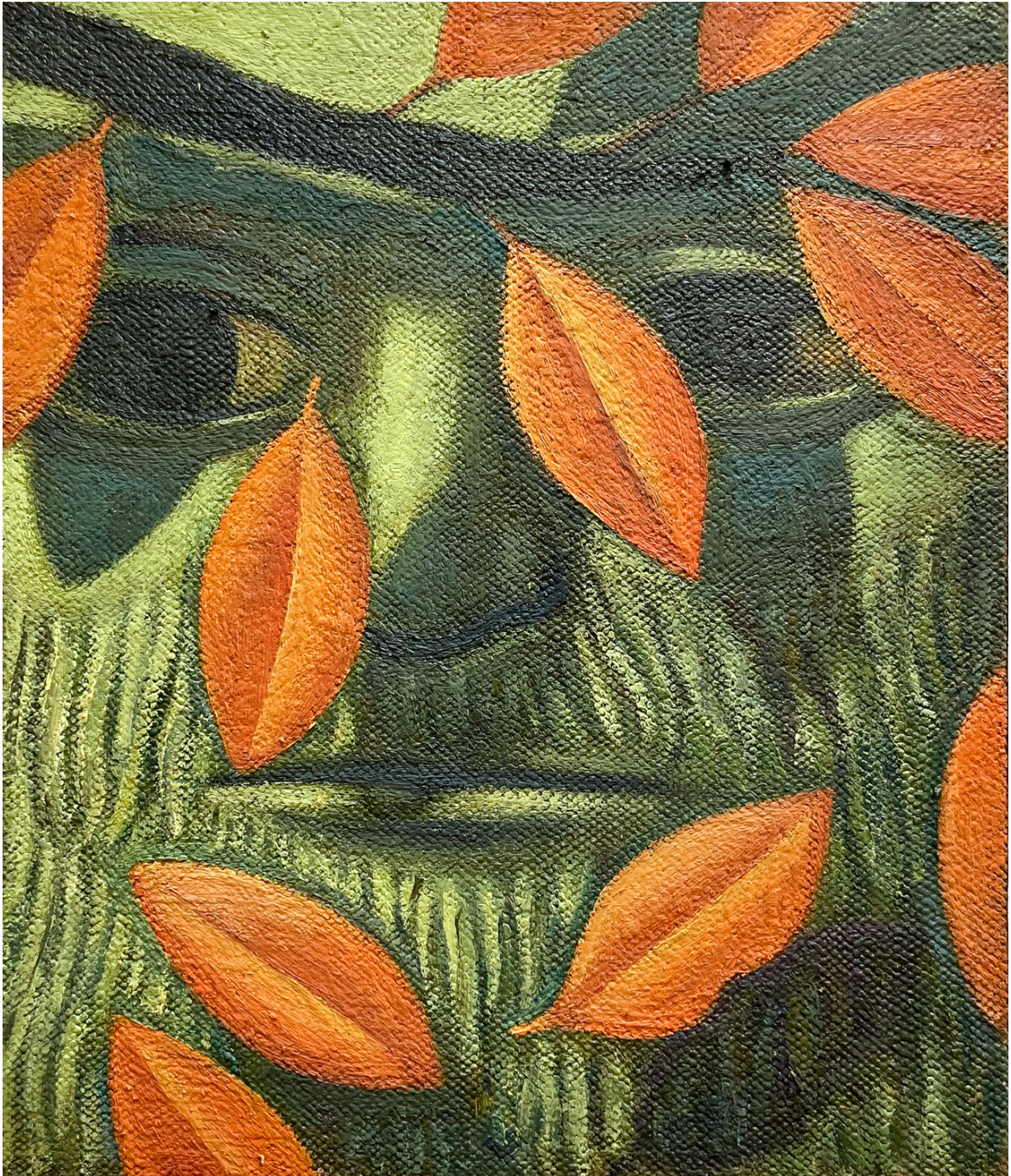
Scrim (01) , 2024 Oil on hemp 12.99 x 10.63 in ( 33,02 x 27,94 cm )