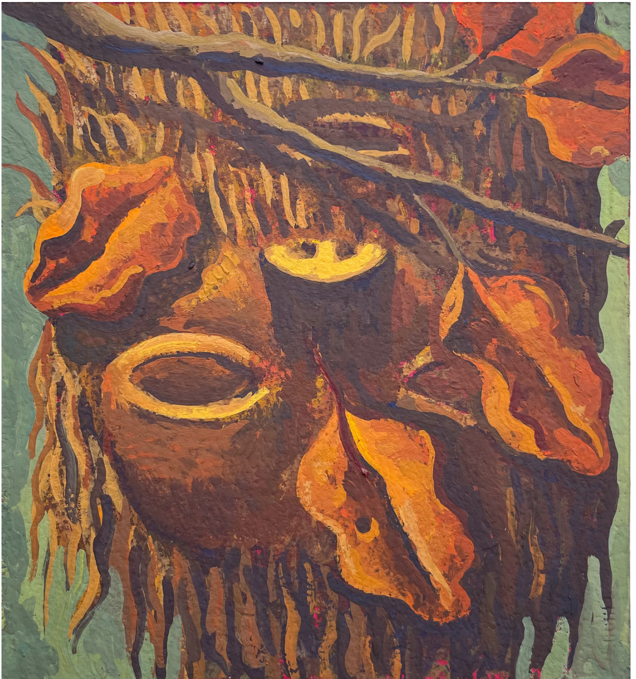
Basal (paper 02), 2024 Casein tempera on paper 9.45 x 8.27 in ( 24,77 x 21,59 cm )