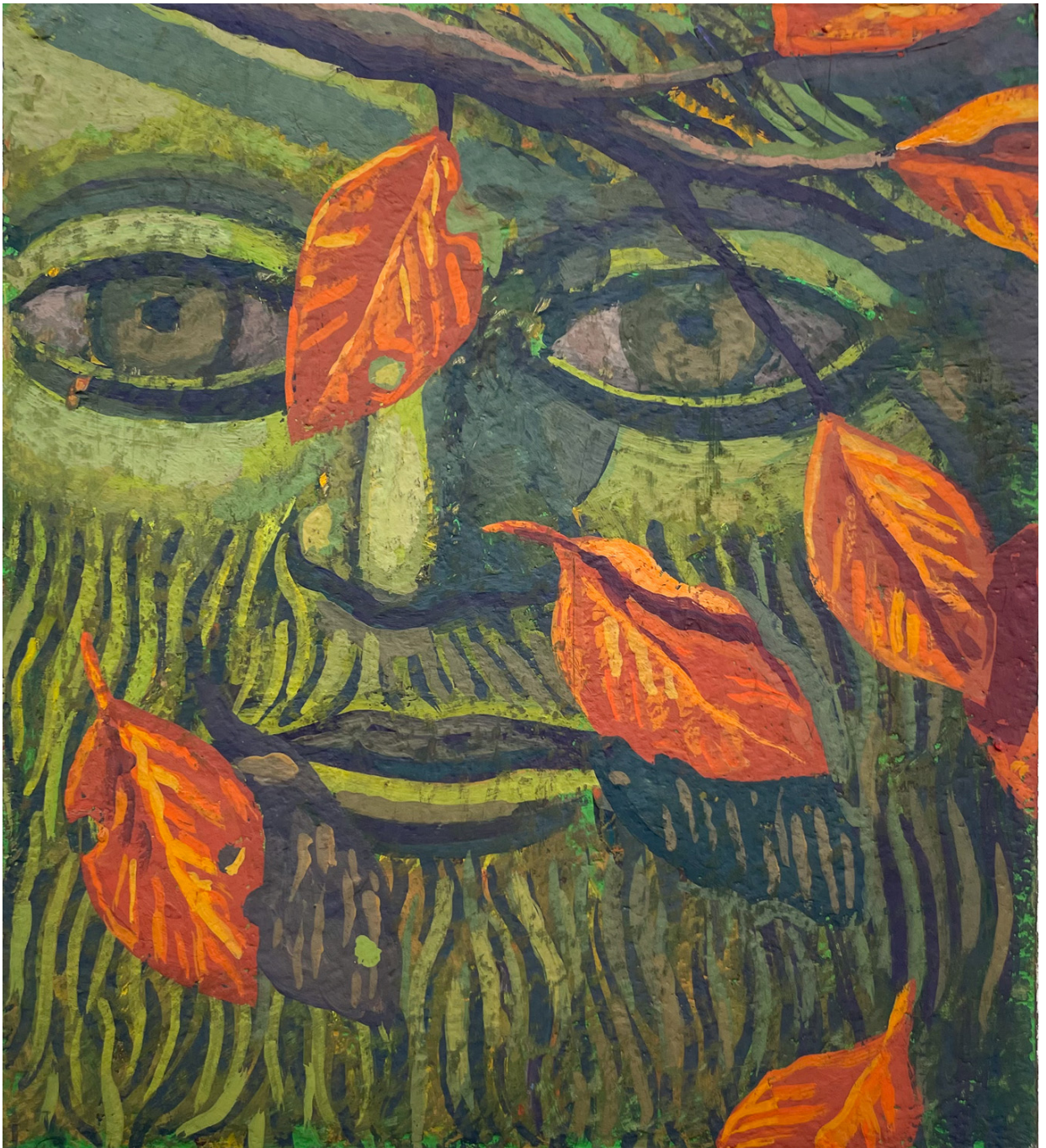
Scrim (paper) , 2024 Casein tempera on paper 9.45 x 8.27 in ( 24,77 x 21,59 cm )