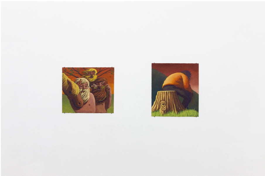
Creeper, Sleeper, Weeper Exhibition View Nosbaum Reding, Luxembourg, 2024