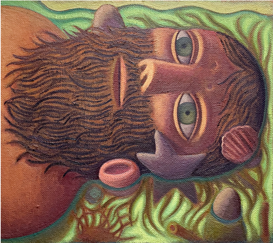
Tide Pool , 2024 Oil on jute 24.8 x 27.95 in ( 63,5 x 71,12 cm )