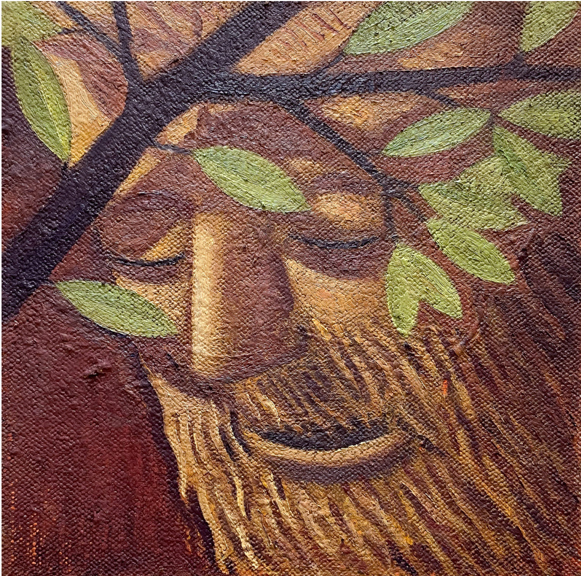
Basal , 2024 Oil on hemp 11.81 x 11.81 in ( 30,48 x 30,48 cm )