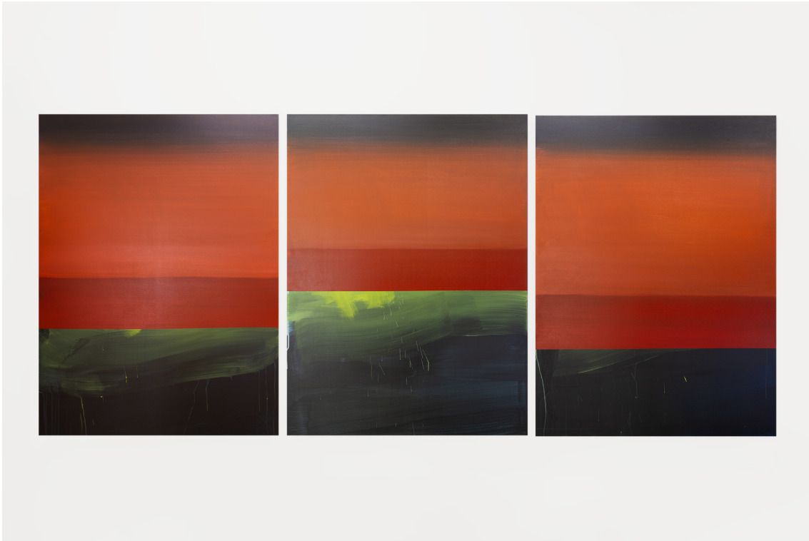
Store Shades I, II, III , 2024 Acrylic on canvas, triptych 62.99 x 47.24 in ( 160 x 120 cm )