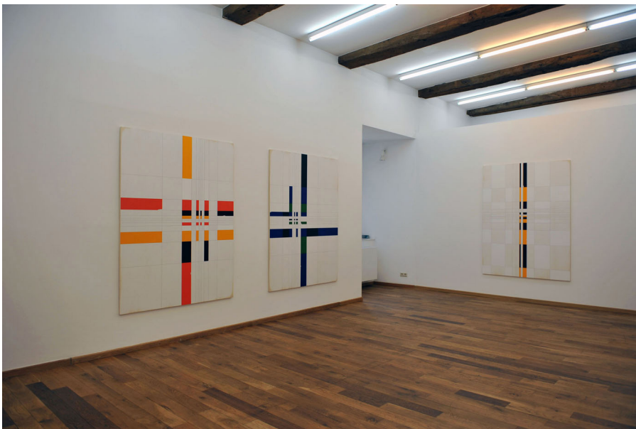
Exhibition View Nosbaum Reding, Luxembourg, 2012