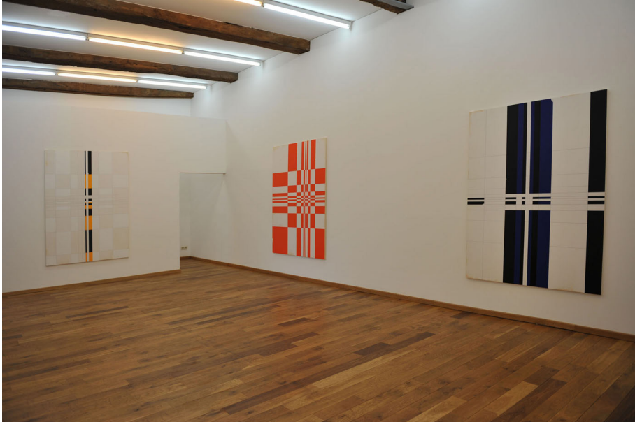
Exhibition View Nosbaum Reding, Luxembourg, 2012