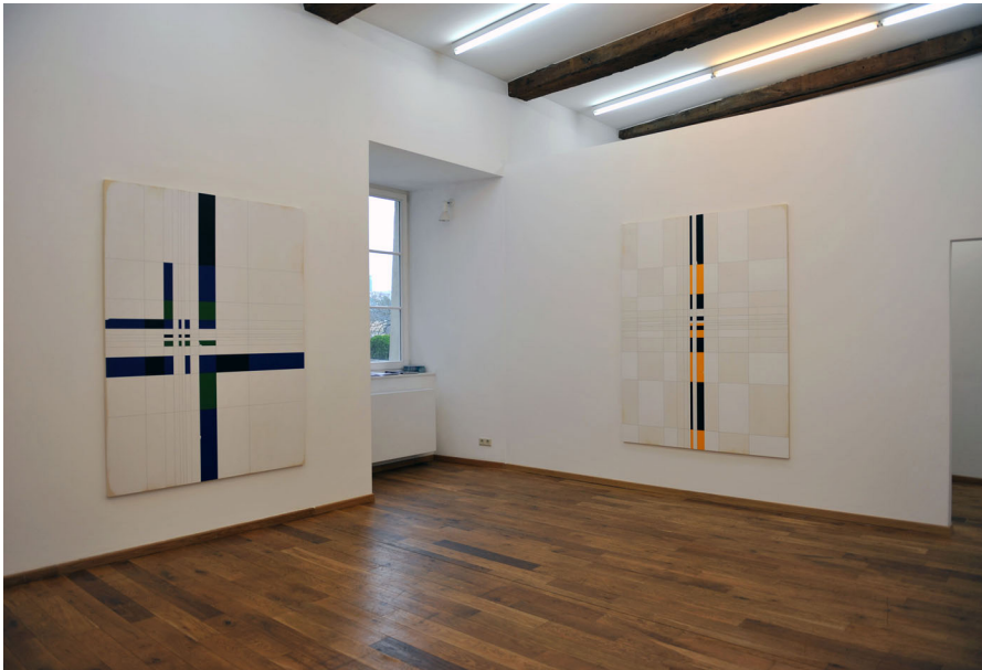
Exhibition View Nosbaum Reding, Luxembourg, 2012