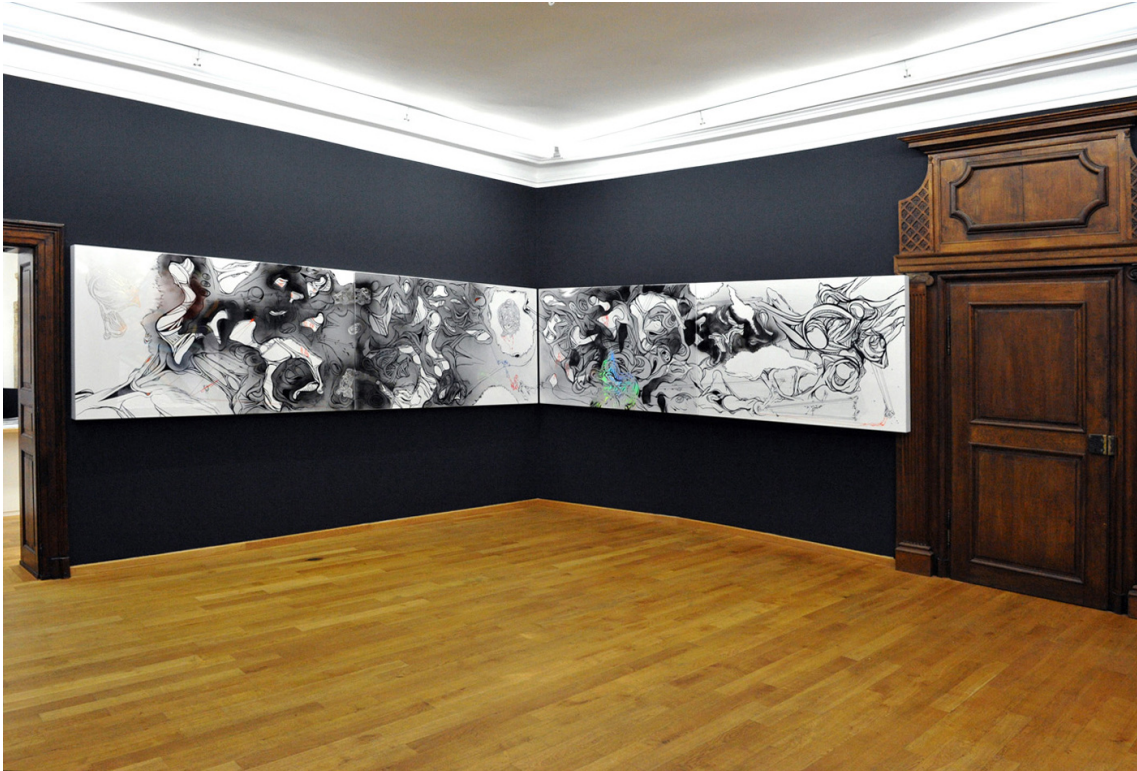
Transconnectionicons Exhibition View Nosbaum Reding, Luxembourg, 2010