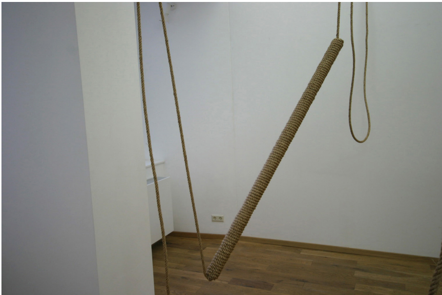
To fall in height Exhibition View Nosbaum Reding, Luxembourg, 2010