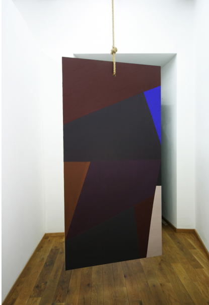
To fall in height Exhibition View Nosbaum Reding, Luxembourg, 2010