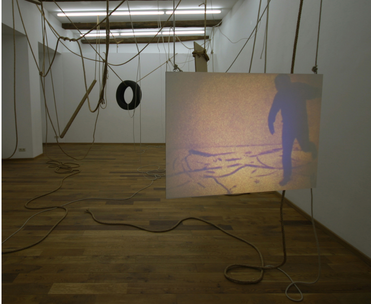
To fall in height Exhibition View Nosbaum Reding, Luxembourg, 2010