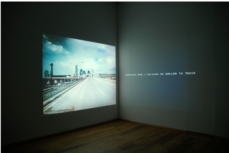
Memorial drive Exhibition View Nosbaum Reding, Luxembourg, 2009