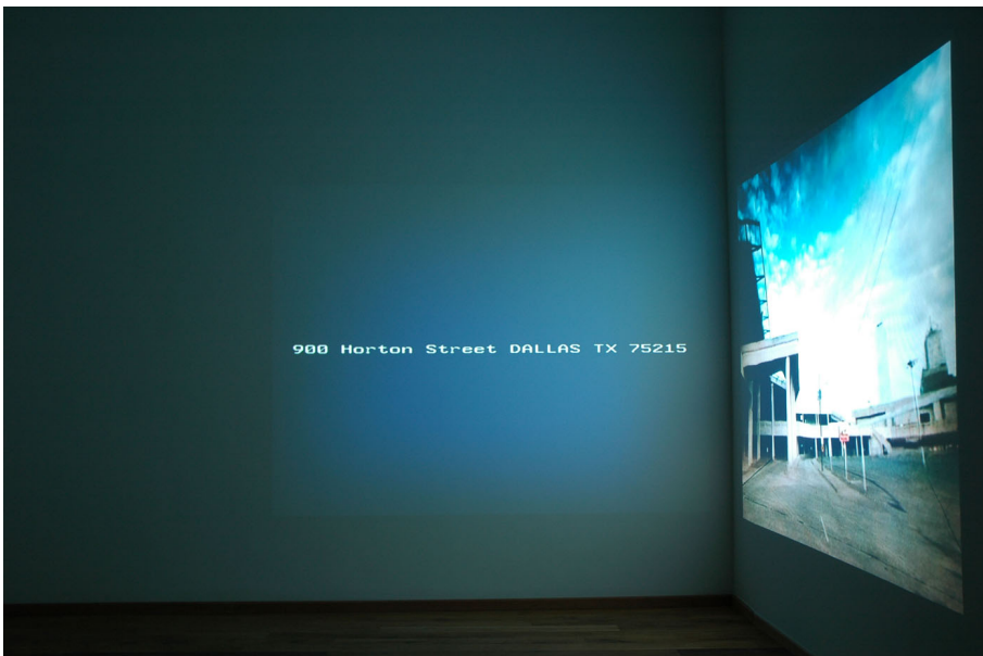
Memorial drive Exhibition View Nosbaum Reding, Luxembourg, 2009