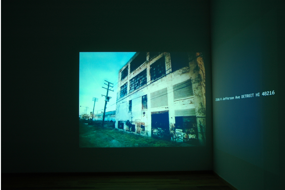
Memorial drive Exhibition View Nosbaum Reding, Luxembourg, 2009