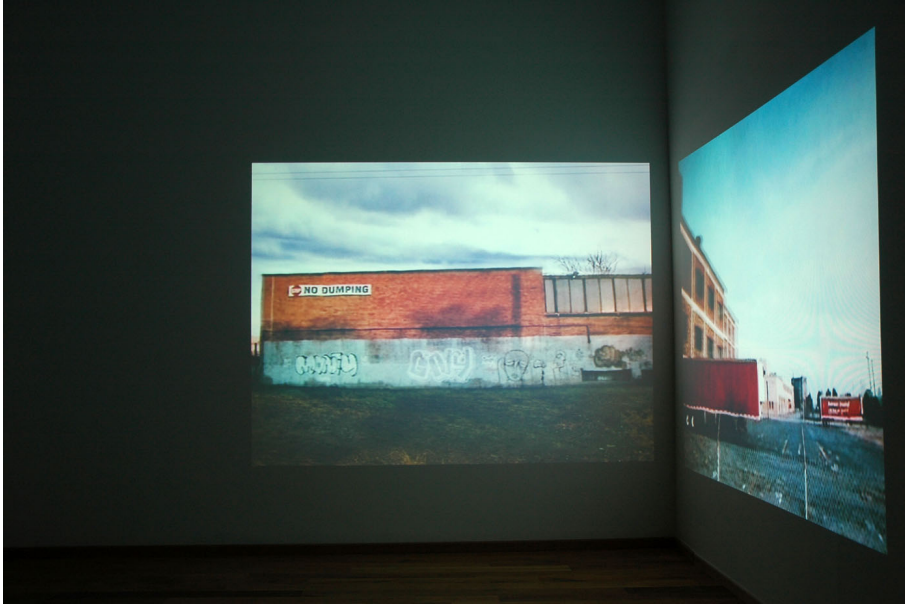
Memorial drive Exhibition View Nosbaum Reding, Luxembourg, 2009