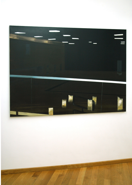
Timberland Exhibition View Nosbaum Reding, Luxembourg, 2009