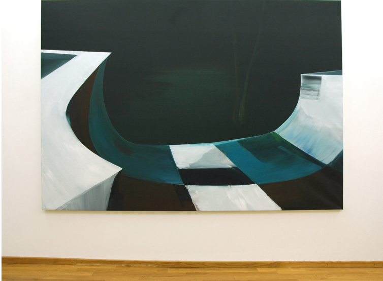
Timberland Exhibition View Nosbaum Reding, Luxembourg, 2009