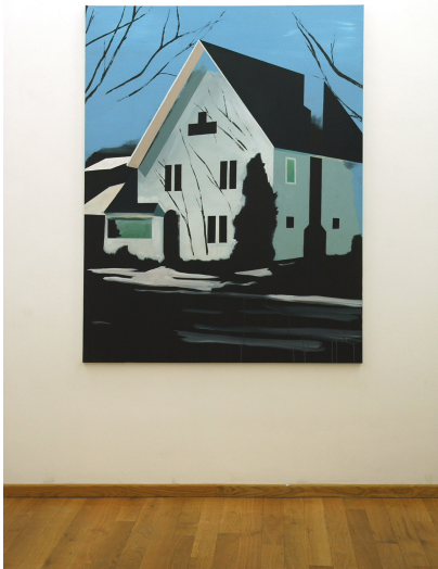
Timberland Exhibition View Nosbaum Reding, Luxembourg, 2009