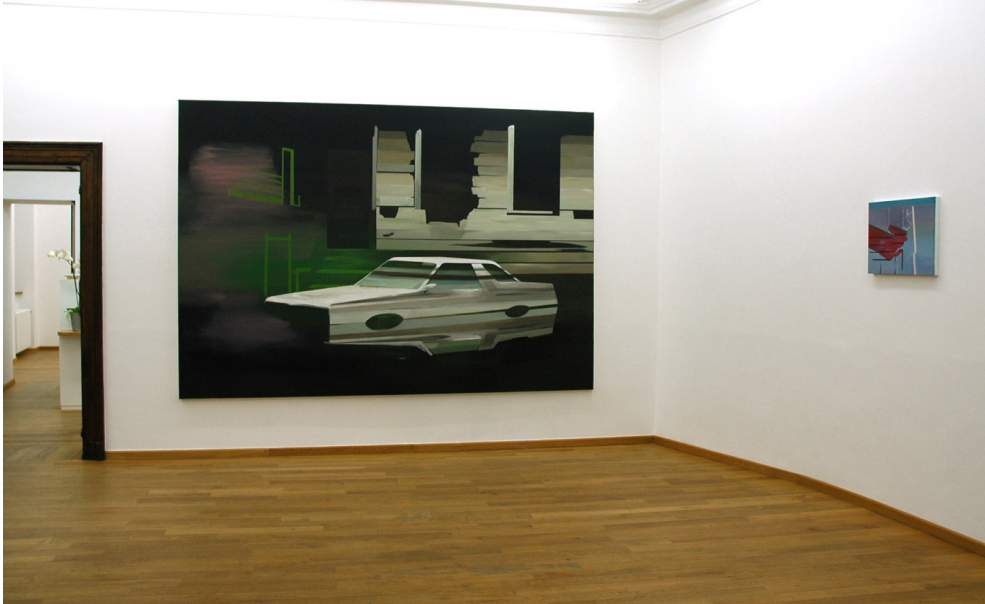
Timberland Exhibition View Nosbaum Reding, Luxembourg, 2009