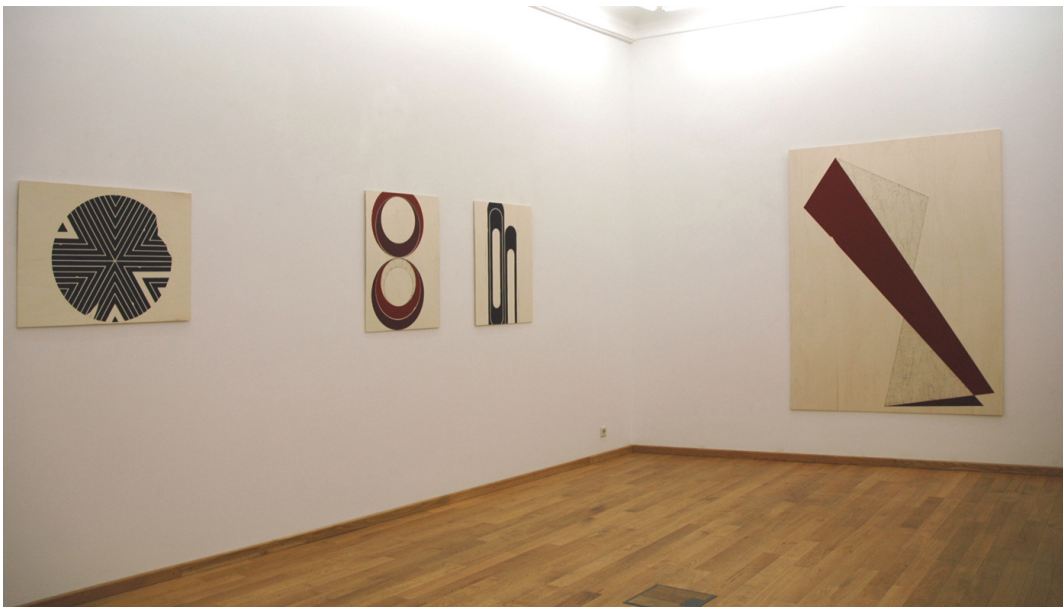
Exhibition View Nosbaum Reding, Luxembourg, 2009