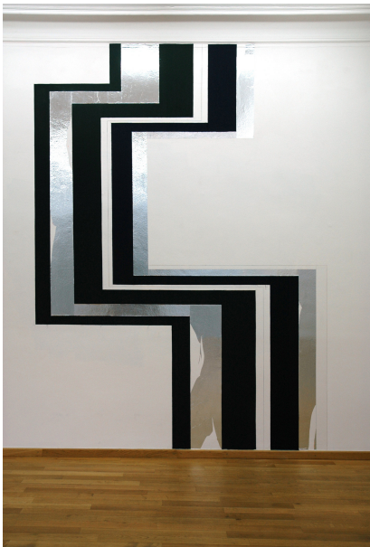
Exhibition View Nosbaum Reding, Luxembourg, 2009