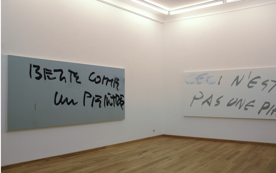
Exhibition View Nosbaum Reding, Luxembourg, 2008