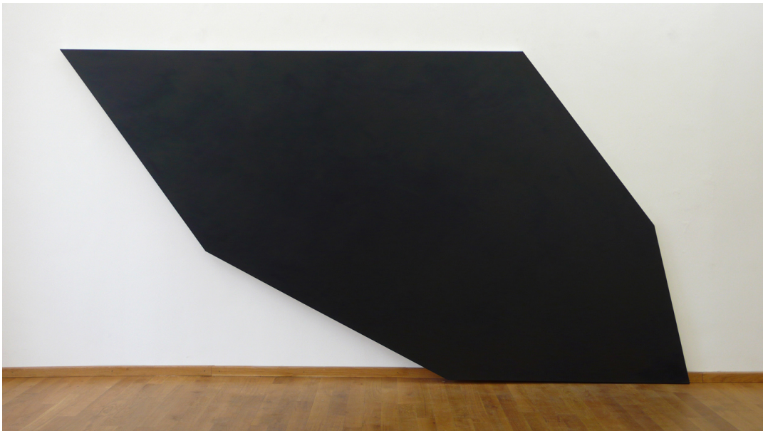
Exhibition View Nosbaum Reding, Luxembourg, 2008