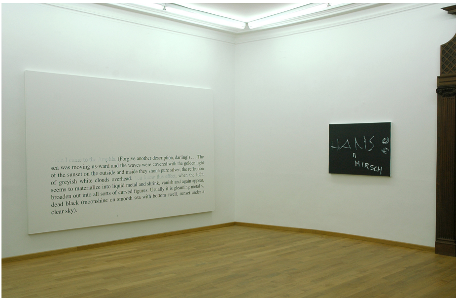
Exhibition View Nosbaum Reding, Luxembourg, 2008